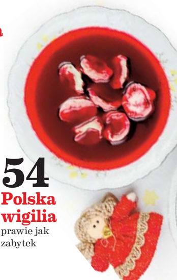
54 Polska wigilia prawie jak zabytek