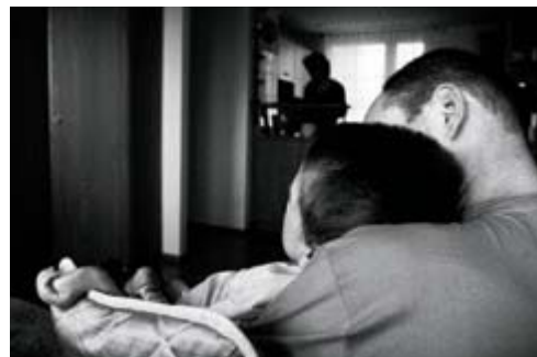
48 Hospicja dla dzieci