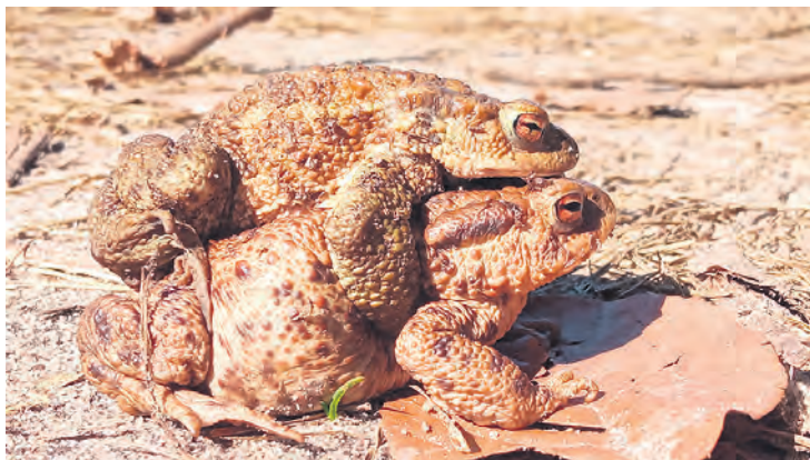
Ropuchy szare – kadr Michaliny.

Stowarzyszenie „Tilia” oraz Szkoła Leśna na Barbarce w Toruniu w okresie od marca do lipca przeprowadziły konkurs plastyczno-fotograficzny pn. „Poznaj płazy Polski”. Wzięło w nim udział 327 uczniów z różnych szkół z terenu woj. kujawsko-pomorskiego. Wśród nich byli także młodzi artyści ze Szkoły Podstawowej nr 2 w Tucholi. Konkurs organizowany był w 4 kategoriach wiekowych: przedszkola, uczniowie klas I-III szkoły podstawowej, uczniowie klas IV-VIII szkoły podstawowej, uczniowie szkół ponadpodstawowych. W przypadku uczniów przedszkoli i klas I-III zadanie konkursowe polegało na przygotowaniu pracy plastycznej, a starsi mieli