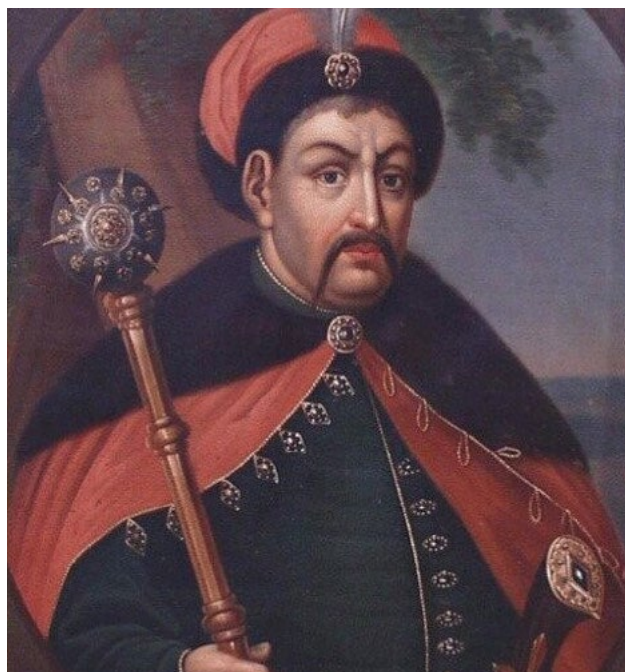
Bohdan Chmielnicki.

W praktyce wyglądało to tak: najwyższym urzędnikiem w Ukrainie, który miał uprawnienia do sprawowania władzy sądowniczej, był sędzia generalny . Wraz z kapitanem generalnym, oficerem bagażowym i kilkoma innymi wysokimi urzędnikami, których również nazywano generałami (w przeciwieństwie do tych samych stopni pułkowych), sędzia generalny uczestniczył z decydującym głosem w posiedzeniach swego rodzaju „rady ministrów” pod hetmanem. Hetman miał kolosalny wpływ na decyzje podejmowane przez sędziego generalnego , gdyż każda decyzja, któ-