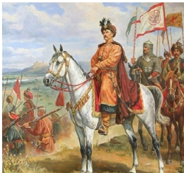
Bohdan Chmielnicki.

W styczniu 1655 r. Chmielnicki wystąpił przeciwko nim z wojskiem kozacko-moskiewskim. Decydująca bitwa, która rozegrała się pod Ochmatowem (w rejonie Kijowa), kosztowała obie strony ciężkie straty i żadnej z nich nie przyniosła sukcesu.