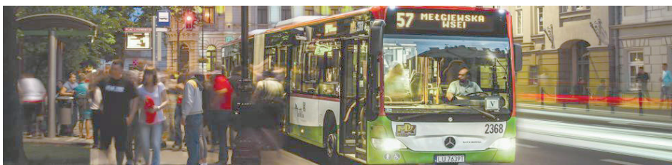
Powodem podwyżek cen biletów jest - według radnych - m.in. inflacja, wojna w Ukrainie i pandemia koronawirusa

Lublin: Zaczęły obowiązywać podwyżki cen biletów za przejazdy autobusami i trolejbusami. Bilety są droższe o ok. 11 proc.