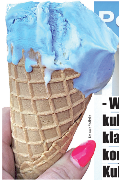
Lody o smaku radia. Powstała specjalna receptura, pozbawiona jakichkolwiek sztucznych barwników czy chemii

Wchodząc do radia zauważyłam na ogrodzeniu ciekawe zdjęcia. Opowiedz mi o nich. - Zrobiliśmy wystawę zdjęć, które pokazują, jak zmienia-