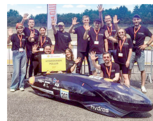
Fot. Politechnika Lubelska