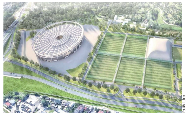
Pierwsza wizualizacja nowego stadionu żużlowego. Na trybunach nowej, zadanej areny mogłyby zasiąść od 17 do 20 tysięcy widzów

Nowy stadion ma pomieścić od 17 do 20 000 kibiców. Tor żużlowy będzie miał długość 340-370 metrów. Obok mają powstać magazyny, garaże i pomieszczenia gospodarcze. Poza zawodami żużlowymi, na nowym obiekcie mogłyby odbywać się także najważniejsze mecze innych dyscyplin, w tym koszykówki, siatkówki czy piłki ręcznej. Byłby wykorzystywany również do organizowania koncertów i innych imprez masowych.