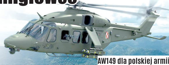
AW149 dla polskiej armii