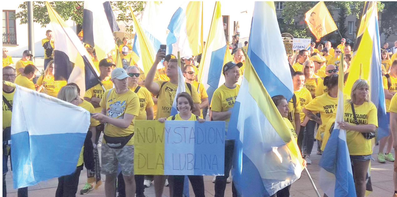
Kibice chcą nowego stadionu

Lublin: Kibice wyszli na ulicę. Żądają przyspieszenia prac przy projekcie budowy nowego stadionu żużlowego. Prezydent Krzysztof Żuk szuka pieniędzy na inwestycję. A potrzeba aż 200 milionów złotych. Na trybunach nowej areny mogłyby zasiąść od 17 do 20 tysięcy widzów. Obecny, przy al. Zygmuntońskich (Z5), mieści niespełna 10 tysięcy.