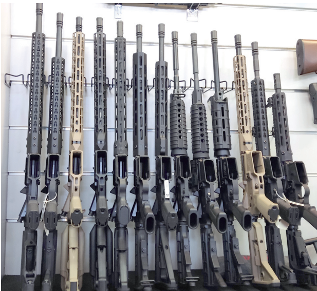
Zainteresowanie zakupem broni wciąż jest spore. Ludzie kupują pistolety, strzelby i karabiny. Ze względu na konflikt za Bugiem są pewne trudności z dostępnością niektórych modeli. Ale sytuacja na rynku stabilizuje się