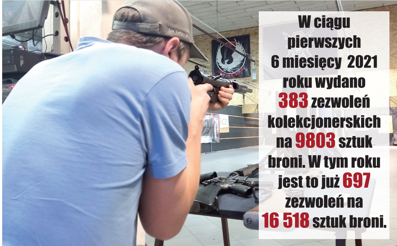
Na strzelnicy LCS można postrzelać nawet z legendarnego Stena