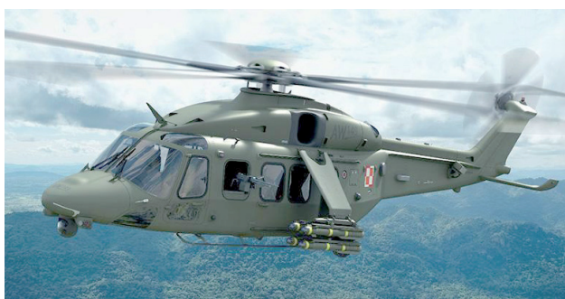
AW149 to wielozadaniowy śmigłowiec wojskowy zdolny do realizacji lotów w dzień i w nocy

Dostawcą będzie włoska firma Leonardo, właściciel PZL Świdnik. Pierwsze maszyny trafią do armii z Włoch, kolejne być może będą finalnie składane w Świdniku.