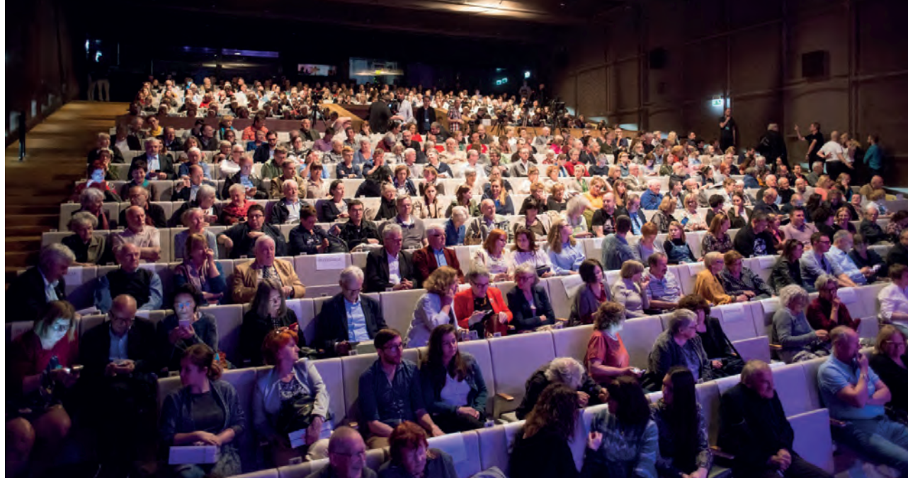
Licznie zgromadzona publiczność uczestnicząca w dyskusji ze współautorami książki Dalej jest noc... , która odbyła się 22 kwietnia 2018 r. w Muzeum Historii Żydów Polskich POLIN.

Jubileuszowy 10. numer z 2014 roku, wydany w dwóch tomach, skupiał się na losie Żydów w Warszawie, zarówno za murami getta, jak i po „stronie aryjskiej”. W roku 2015 redakcja wróciła do szeroko pojętej problematyki pomocy i ratowania Żydów. Wspólnym mianownikiem numeru z roku 2016 był kontekst europejski Zagłady . W 2017 roku wydaliśmy numer poświęcony 75. rocznicy rozpoczęcia akcji „Reinhardt”. W 2018 roku odnotowaliśmy 75. rocznicę powstania w getcie warszawskim oraz 50. rocznicę Marca 1968. W numerze z 2019 roku tematem przewodnim była problematyka religijna i teologiczna w odniesieniu do Zagłady. Numer z roku 2020 poświęcony jest przede wszystkim fenomenowi getta łódzkiego.