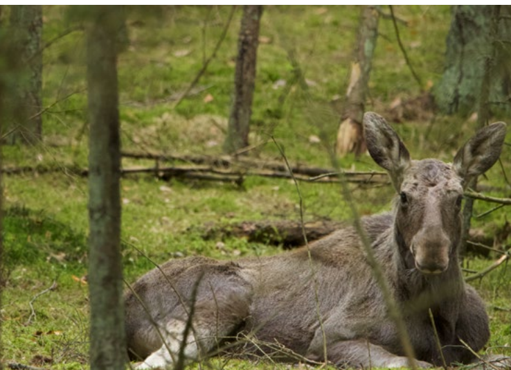
Młody łoś w lesie przy Carskiej Drodze