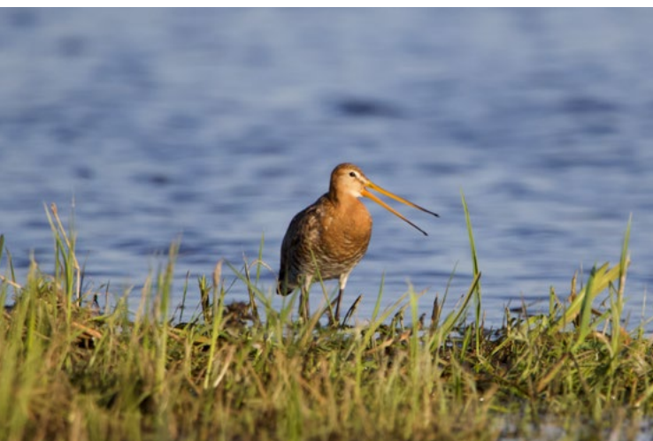
Rucyk – gatunek zagrożony wyginięciem; lęgnię się m.in. na bagnach biebrzańskich