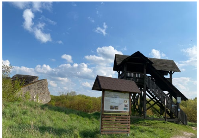
Przykład jednej z tablic informacyjnych – wiadomości o Kanale Rudzkim; obok wieża widokowa oraz pozostałości twierdzy Osowiec