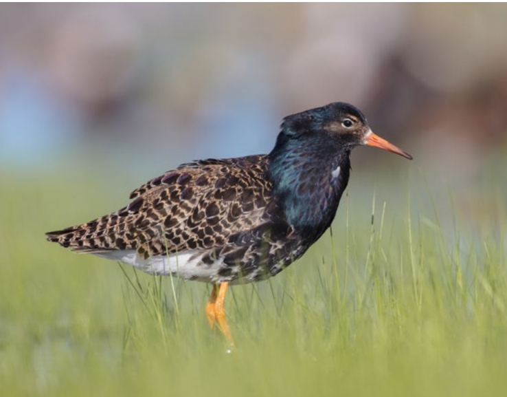
Batalion – ptak wędrowny występujący w Polsce głównie na bagnach biebrzańskich.