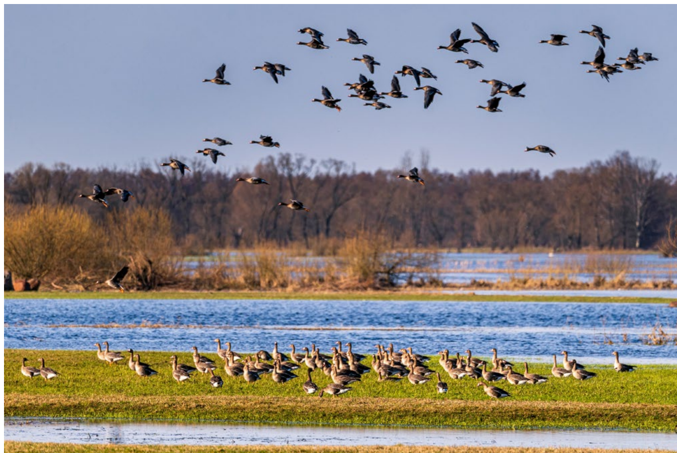
Rozlewisko Biebrzy w okresie wczesnowiosennym.