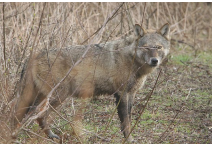
Wilk przy ścieżce edukacyjnej Barwik