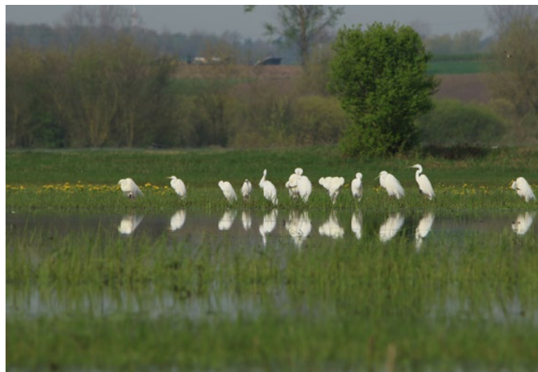
Czaple białe – pierwszy przypadek ich gniazdowania w Polsce odkryto w 1997 r. nad Biebrzą