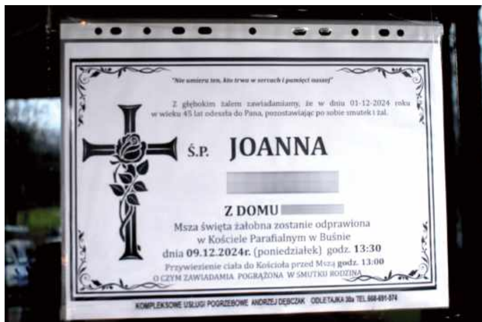
Klepsydra Joanny K.

- Pamiętam tego chłopca. Mama przywodziła go do szkoły, a następnie odbierała. Na moje oko był spokojnym uczniem. Wiem z opowieści