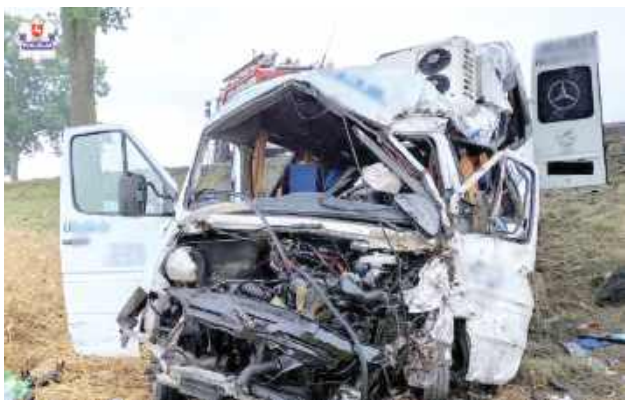
Tak wyglądał bus, który przewoził pasażerów, po zderzeniu z renault. Zginęła trójka pasażerów tego pojazdu