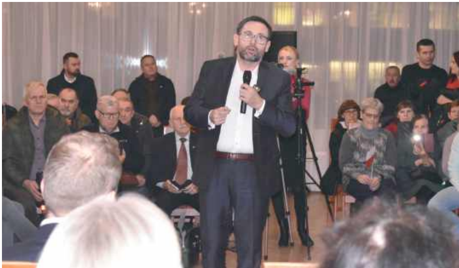
Podczas spotkania w Puławach, na którym obecni byli związkowcy z Azotów, Daniel Obajtek mówił o konieczności połączenia spółki z silnym partnerem, takim jak Orlen. Bez tego, jego zdaniem zakład nie przetrwa

Ubiegłoroczne wybory parlamentarne zmieniły układ sił na scenie politycznej, a nowy rząd z premierem Donaldem Tuskiem na czele zaczął wpro-