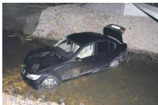
BMW wpadło do płytkiej rzeki

Kierujący samochodem osobowym marki BMW niespodziewanie na zakręcie stracił panowanie nad autem, uderzając w barierę energochłonną, a następnie w drzewo. Podróż 18-latkę z gminy Łuków za-