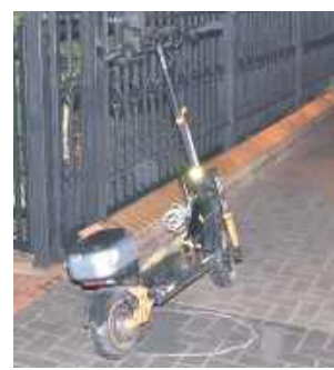
27-latek, skręcając w lewo, nie ustąpił pierwszeństwa jadącemu hulajnogą 13-latkowi

- Ze wstępnych ustaleń wynika, że kierujący osobowym