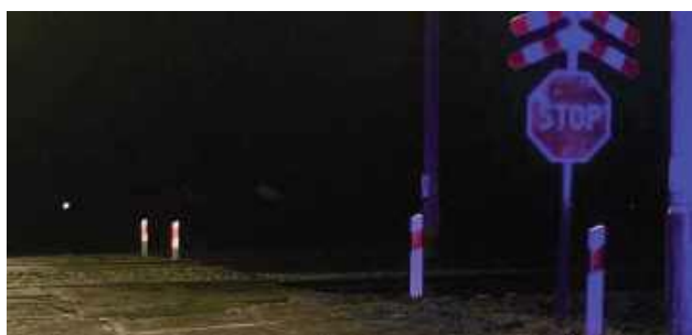
W czwartek (5 grudnia) w Minkowicach Kolonia w powiecie świdnickim lokomotywa poruszająca się na trasie Krasnystaw Fabryczny - Lublin Tatary potrafiła 39-letniego mężczyznę, który szedł po torowisku. Pieszy zmarł