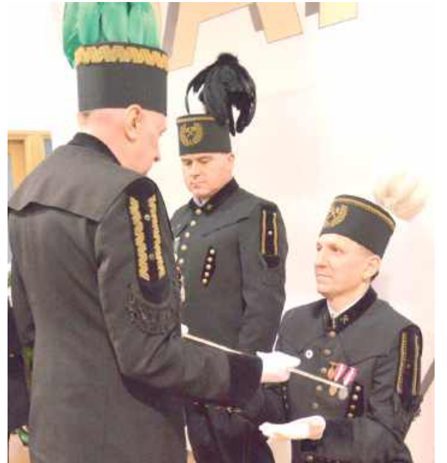
Dziesiątki górników z Bogdanki zostało podczas uroczystości barbórkowych odznaczonych i wyróżnionych