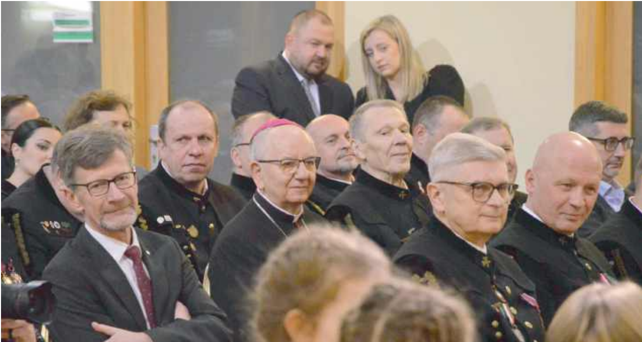
W uroczystościach brał udział m.in. arcybiskup Stanisław Budzik

To był wyjątkowy dzień dla wszystkich górników - 4 grudnia przedstawiciele tego zawodu mają swoje święto. W LW Bogdanka S.A. w minioną środę tradycji stało się zadość. Górnicy mają za sobą trudny czas, ale wydaje się, że jeszcze trudniejszy przed nimi.