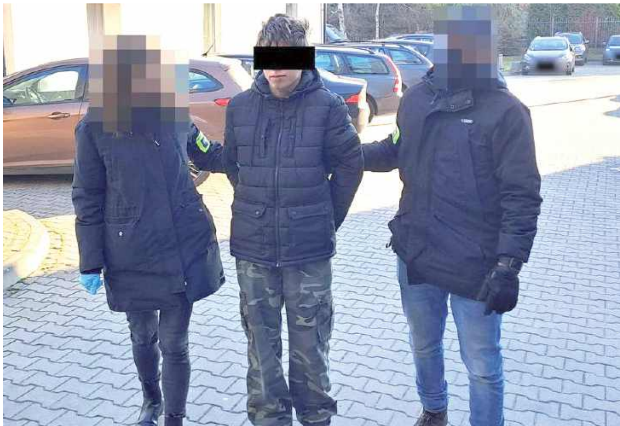
Zatrzymanego przez policję chłopaka sąd umieścił w areszcie