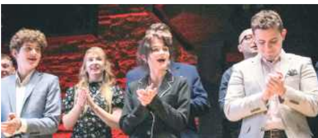
Wydarzenie odbyło się podczas ECR Kongresu Młodych

W sobotę (7 grudnia) w Filharmonii im. Henryka Wieniawskiego w Lublinie odbyło się spotkanie mieszkańców z Karolem Nawrockim, obywatelskim kandydatem na urząd prezydenta.