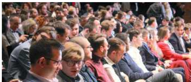
Nawrocki podkreślał, że jest kandydatem bezpartyjnym

- Nie patrzcie na mnie tylko jako na chłopaka z siłowni. Jestem doktorem nauk humanistycznych, od trzech lat prezesem Instytutu Pamięci Narodowej - podkreślał Nawrocki.