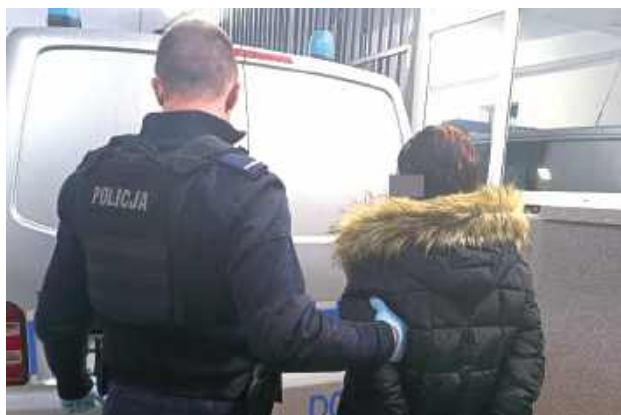
Z zawiadomienia poszkodowanej kobiety wynika, że sąsiadka już od ok. miesiąca groziła jej, że ją zabije. Ostatnim razem wzięła do ręki nóż

- Z zawiadomienia wynika, że od około miesiąca groziła swojej sąsiadce, że ją zabije,