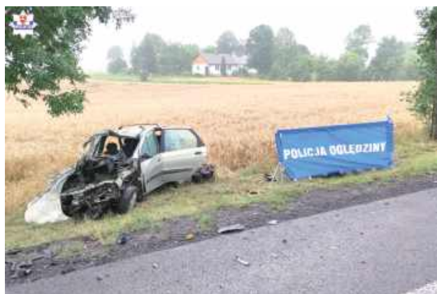
Zderzenia z busem nie przeżył kierowca renault, które wyleciało z drogi i znalazło się w rowie po przeciwnej stronie jezdni niż bus