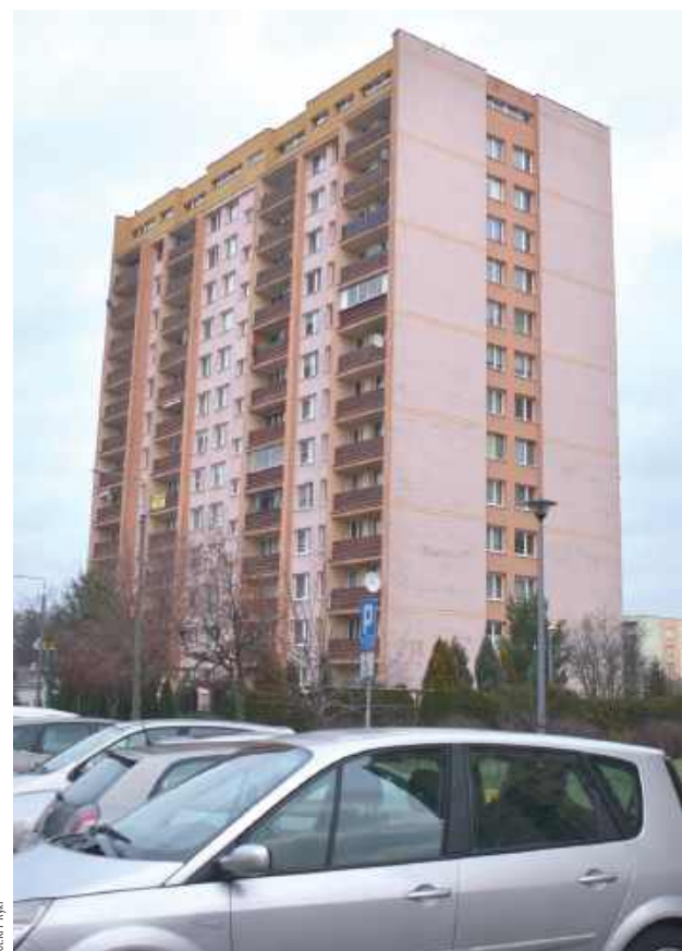
Blok, w którym mieszkała rodzina K.

9 grudnia pochowano 45-letnią kobietę, zamordowaną prawdopodobnie przez 21-letniego syna. Sąd umieścił chłopaka w areszcie, a na osiedlu, na którym doszło do zabójstwa, głównym tematem jest zbrodnia.