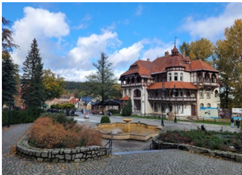
Świeradów-Zdrój, Góry Izerskie

Innymi zadaniami krajoznawstwa jest zachęcenie do samodzielnych badań naukowych, rozwijanie przywiązania do „małej ojczyzny”, zachowania odrębności przyrody i dziedzictwa kulturowego, a także pogłębienie czynnego nastawienia do pracy zawodowo-społecznej, przede wszystkim w najbliższym otoczeniu.