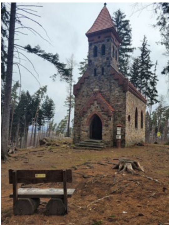
Kościół pw. św. Anny, Góra Parkowa, Głuchotały