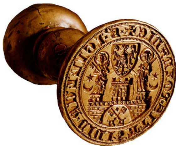
Tłok pieczętny miasta Poznania z poł. XIV w. (ze zbiorów Archiwum Państwowego w Poznaniu). Domena publiczna

ten utrwalił się w czasach nowożytnych, jednak na przestrzeni stuleci uległ pogłębieniu i zintensyfikowaniu, co było spowodowane m.in. rozwojem form kancelaryjnych i formularzowych, jak też zwielokrotnieniem liczby stosowanych pieczęci.