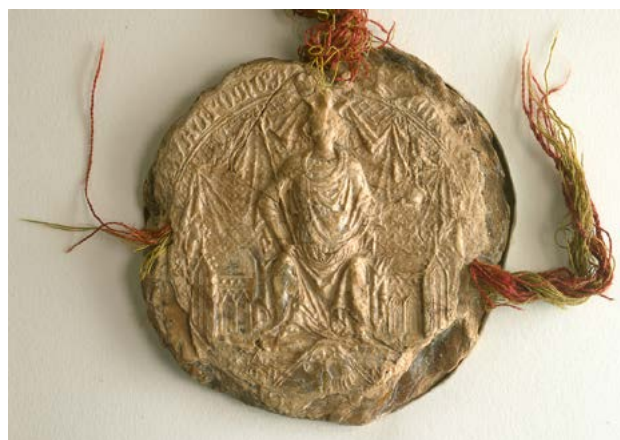
Pieczęć majestatyczna króla Kazimierza Wielkiego odcisnięta w naturalnym wosku i podwieszona na jedwabnym żółto-czerwonym sznurze. Domena publiczna

o charakterze osobistym, dalej godeł i herbów (tak rodowych i korporacyjnych, jak państwowych oraz narodowych), są na nich sceny walki (często z mitycznymi potworami), pobożnych fundacji, sceny wyobrażające pracę i wytwory pracy rzemieślników czy rolników, sceny modlitwy, adoracji świętych, a nawet mszy św., są wyobrażenia przyrody nieożywionej i ożywionej, zwierząt domowych i dzikich oraz wiele innych. Ikonografia pieczęci jest ważnym źródłem poznania w badaniach kostiumologicznych, a także studiów nad wyobrażeniami insygniów władzy oraz atrybutów różnych urzędów i godności. Analiza form napisów napieczętnych, zwłaszcza dokonywana w długim czasie trwania, pozwala prześledzić (często bardzo subtelne) zmiany kształtów, typów oraz modeli liternictwa, i to na dowolnie wybranym obszarze, często też dla takich okresów, z których nie zachowały się monumentalne formy epigraficzne (np. płyty nagrobne itp.). Badania z dziedziny sfragistyki są też nieodzownym elementem badań źródeł wyobrażeń heraldycznych, w tym ich wszelkich modyfikacji i adaptacji.