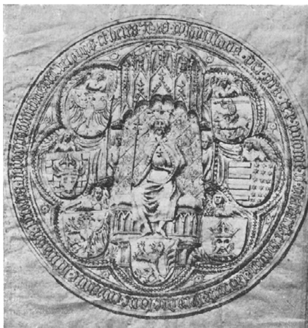
Pieczęć majestatyczna króla Władysława II Jagiełły.

go pojęcia, wyrosłego z prawa kanonicznego i opartego na autorytecie Kościoła oraz jego biskupów. Współcześnie wydaje się być już oczywiste, że właśnie za sprawą biskupów ukształtowane w Europie Zachodniej wzorce i poglądy na temat dokumentu, jego znaczenia oraz roli, jaką spełniała przy nim pieczęć autentyczna, trafiły także do Polski.