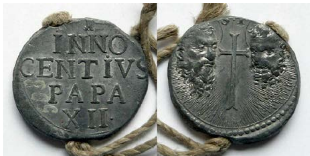
Pieczęć papieża Innocentego XII z XVII wieku.

była metalowa, dla jej ochrony sporządzano specjalne zabezpieczenie w postaci miski pieczętnej, drewnianej bądź metalowej puszki, często z ozdobnym wiekiem, pozłacanej, srebrzonej, czasami misternie kutej lub cyzelowanej. Ważnym aspektem związanym z odciskaniem pieczęci było też jej miejsce na dokumencie ( locus sigilli ), które bywało bardzo różne i zależało od wielu czynników. Jako jeden z najważniejszych należy wymienić pozycję społeczną i urząd pełniony przez dysponenta tła, następnie zwyczaj panujący w danej kancelarii, liczbę wszystkich przywieszanych bądź odcisniętych pieczęci, czas i okoliczności opieczętowania.