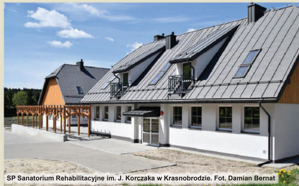
SP Sanatorium Rehabilitacyjne im. J. Korczaka w Krasnobrodzie.