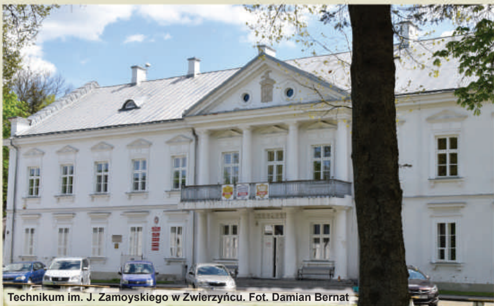
Technikum im. J. Zamoyskiego w Zwierzyńcu.