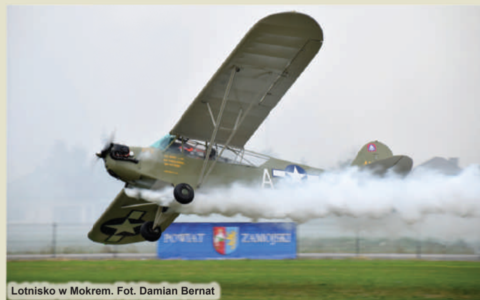
Lotnisko w Mokrem.

Starostwo Powiatowe w Zamościu ul. Przemysłowa 4, 22-400 Zamość, tel. 84 530 09 11 e-mail: starostwo@powiatzamojski.pl , www.powiatzamojski.pl