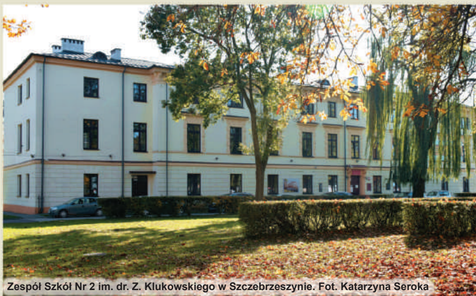
Zespół Szkół Nr 2 im. dr. Z. Klukowskiego w Szczepieszynie.