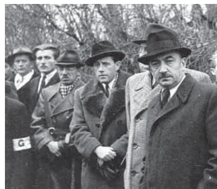
Ferenc Nagy (na pierwszym planie), Węgry, druga połowa lat 40. XX w.

Węgier trafił pod skrzydła ludzi z FBI, zostając agentem tzw. Wydziału Piątego . Od tego momentu Nagy był przydzielony do obserwacji środowisk emigracyjnych z Europy Środkowo-Wschodniej . Między