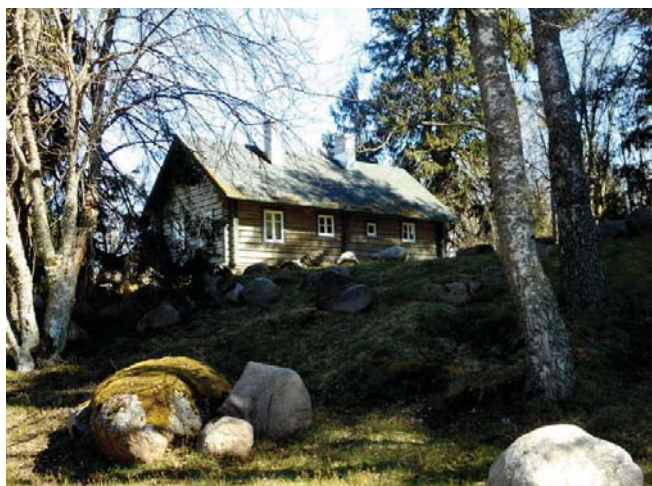
Altja, wioska rybacka

Park jest rajem dla obserwatorów dzikiej przyrody. Do reprezentantów awifauny możemy zaliczyć orła przedniego, świergotka drzewnego, sowę włochatkę, dzięcioła czarnego oraz gniazdujące na torfowiskowych wyspach mewy srebrzyste i kaczki. W okresie wiosennym uwagę przyciągają toku-