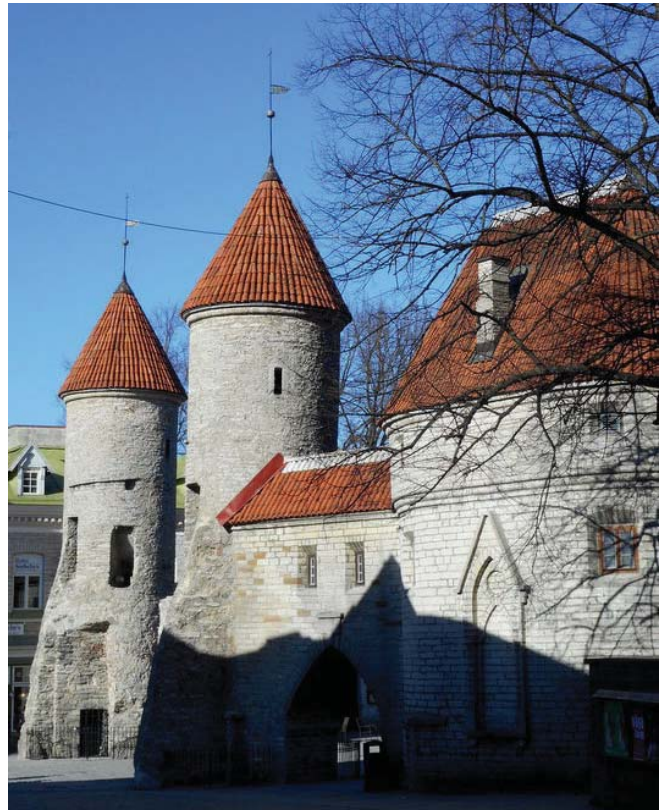
Sredniowieczna zabudowa Tallinna

Krwawa chrystianizacja zdziesiątkowała liczebność estońskiej szlachty, a wielu notabli zostało zdegradowanych do statusu chłopstwa, nękanego podatkami i daninami. Szlachtę i rycerstwo stanowili wówczas Niemcy, którzy wzniesli gotyckie kościoły i mury, a także mieszczzańskie kamienice i spichlerze. Kres panowania zakonu nastąpił w II poł. XVI w., gdy ostatni mistrz zakonu, w obawie przed atakiem Moskwy, od-