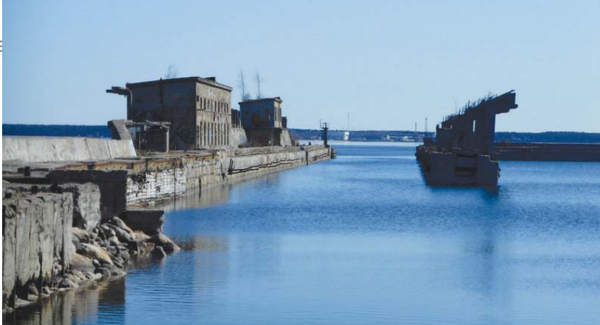
Opuszczona baza wojskowa dla łodzi podwodnych

czy wyspy Suur-Pakri związanej z testami bombowymi, było utrzymywane w ścisłej tajemnicy, a pobyt w tych miejscach był zakazany.