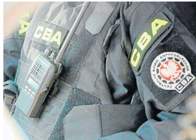
FOT. CBA / ZDJĘCIE ILLUSTRACYJNE

- Postępowanie prowadzone jest przez Prokuraturę