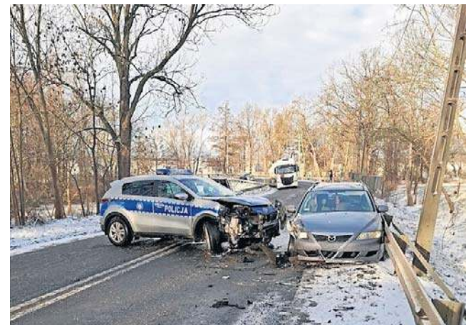
Ustalono, że oskarżony prowadził pojazd pod wpływem metamfetaminy

Dodajmy, że groziło mu 7,5 roku więzienia, bo miał na koncie inne podobne przestępstwa.