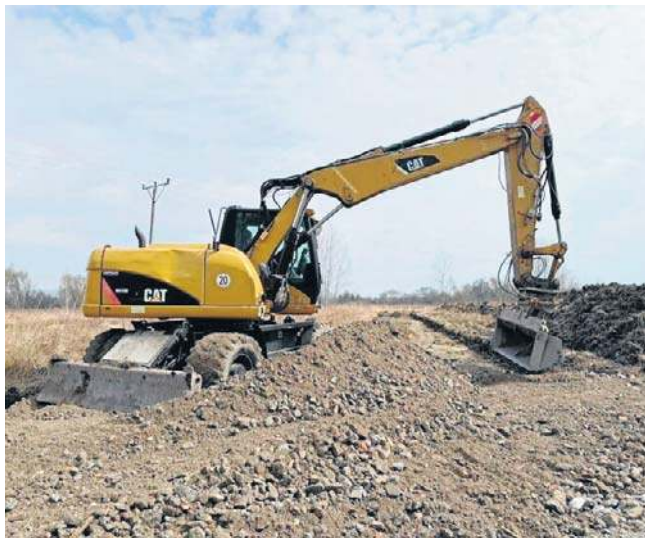
Ruszyły prace przygotowawcze. Pierwsze informacje o parametrach złoża poznamy jeszcze w 2026 roku

Miasto ma już wstępną umowę ze spółką ciepłowniczą ECO, która pozwoliłaby wykorzystać wodę geotermalną