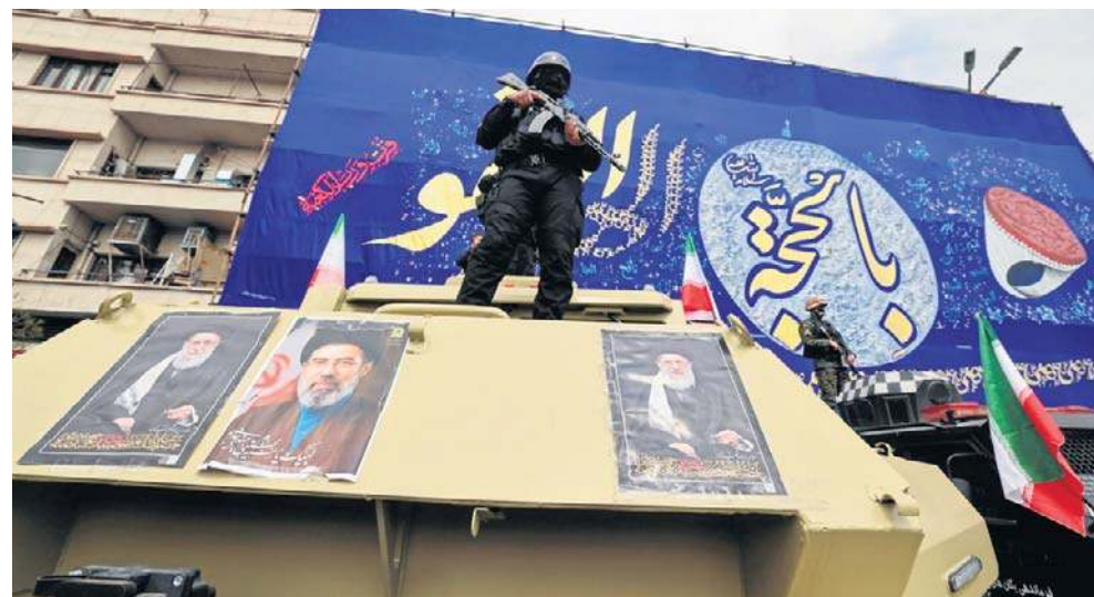
Członek sił specjalnych IRGC stojący na straży pojazdów opancerzonych oklejonych portretami zamordowanego irańskiego najwyższego przywódcy