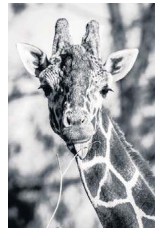
Rafiki mieszkał 17 lat w ogrodzie we Wrocławiu

Dodajmy, że Rafiki odszedł z powodu niewydolności krą-