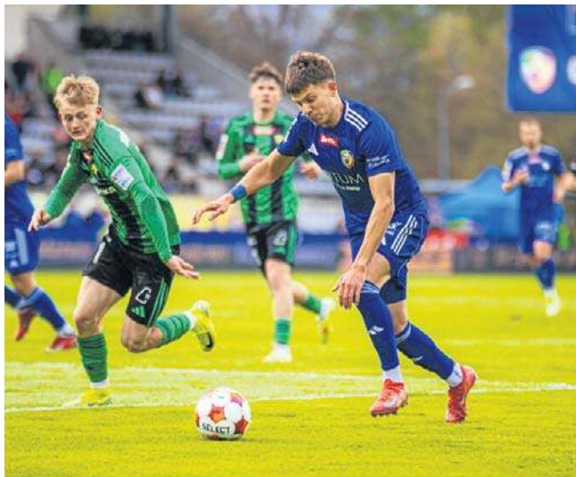
Optycznie Miedź Legnica sprawiała lepsze wrażenie, ale nie była w stanie strzelić Górnikowi ani jednej bramki

Ta porażka była dopełnieniem pogromu faworytów, z jakim mieliśmy do czynienia w 29. serii gier. Tylko Chrobry Głogów stanął na wysokości zadania, zmniejszając stratę do Śląska Wrocław do 3 pkt. ©©