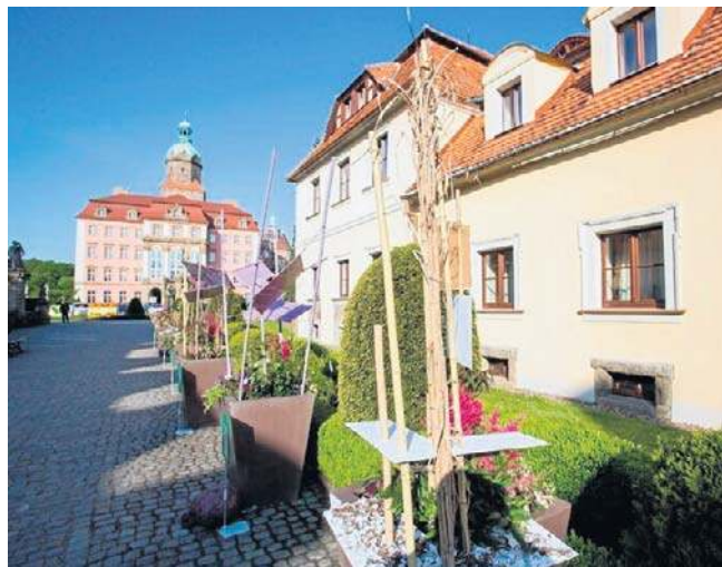
Wśród wybranych w ostatnim konkursie projektów jest m.in. dalsza rewaloryzacja Zamku Książ

6. Wrocław. Ochrona i upowszechnienie dziedzictwa - klasztor Dominikanów. Koszt całkowity: ok. 18,7 mln zł; dofinansowanie: ok. 14,6 mln zł.