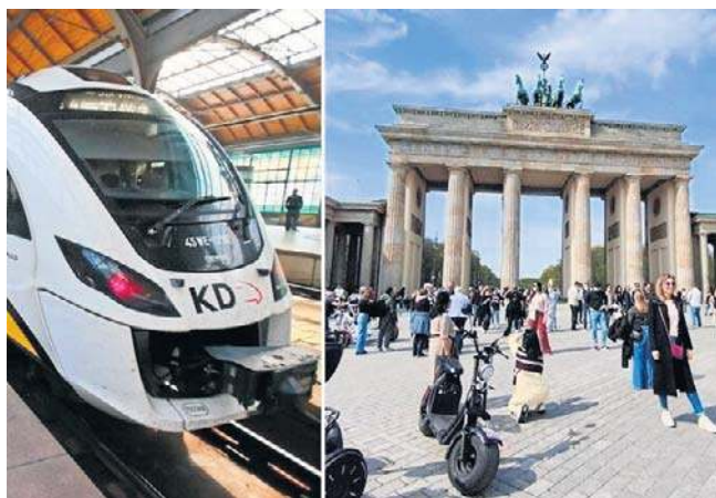
Czas przejazdu z Wrocławia do Berlina powinien wynieść około 4,5 godziny

Dla pasażerów oznacza to łatwiejszy dostęp do Berlina. Choć pociągi nie dojadą bezpośrednio do stolicy Niemiec, przesiadka w Chociebużu