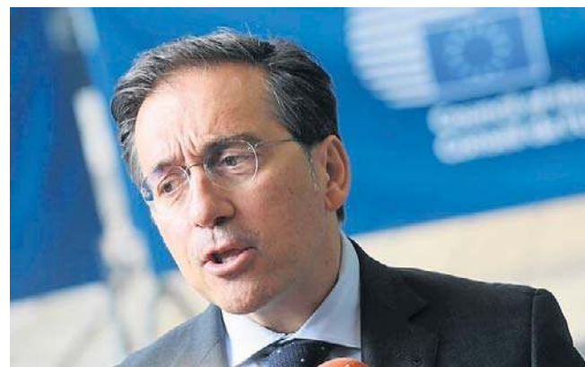
Jose Manuel Albares w Luksemburgu powiedział o propozycji zawieszenia umowy z Izraelem

Decyzja o zawieszeniu umowy stowarzyszeniowej wymaga jedności wszystkich państw członkowskich.