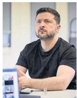
Słowa Zelenskigo wywołały wzburzenie

Zapytany w tym samym wywiadzie telewizyjnym, czy