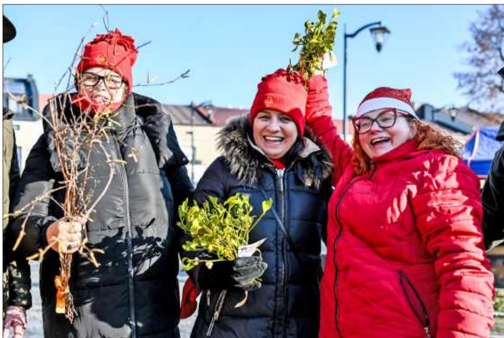
Powiatowy Jarmark Świąteczny przyciągnął tłumy.