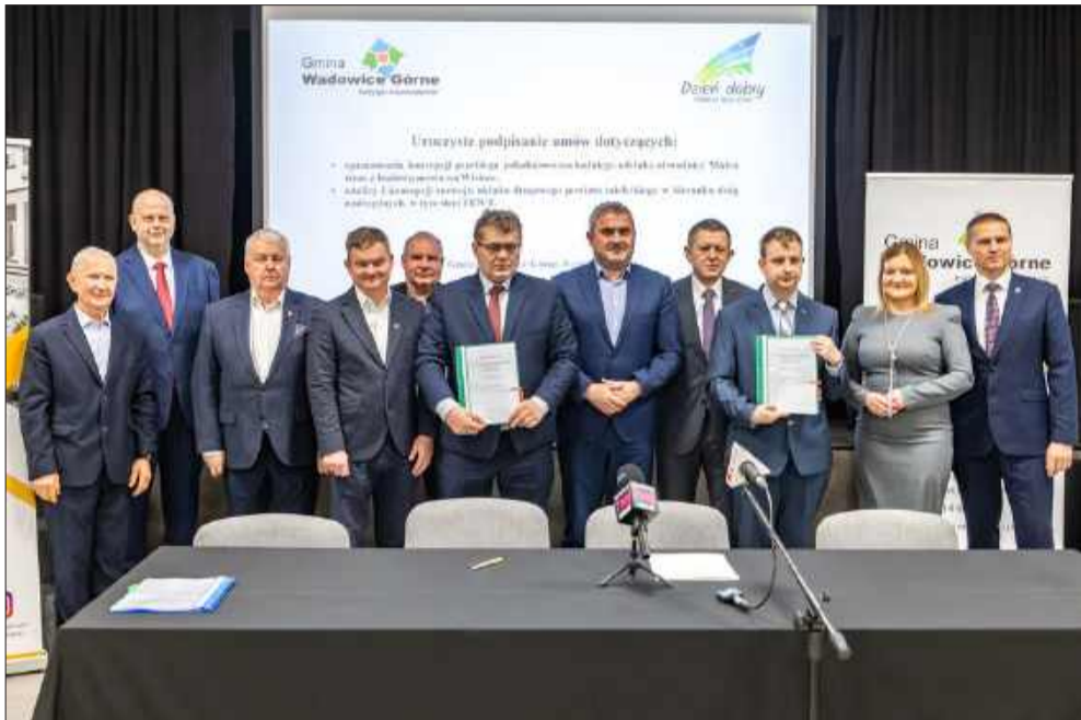
Spotkanie z Wiceministrem Infrastruktury w GOK Wadowice Dolne.