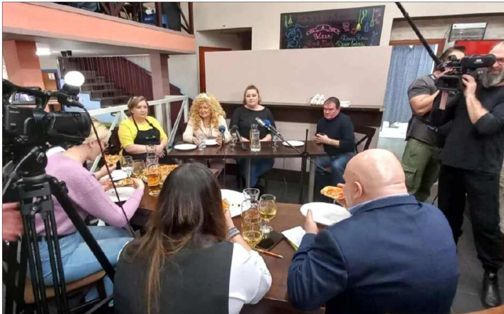
„Kuchenne rewolucje” w Mielcu, w dawne restauracji „Vis a vis”.

Podczas finału programu Gessler uznała zmiany za trafione; właściciele z entuzjazmem podkreślali wzrost gości i obrotów. Jednak pomimo pozytywnej oceny „Kuchennych Rewolucji” lokal nie przetrwał