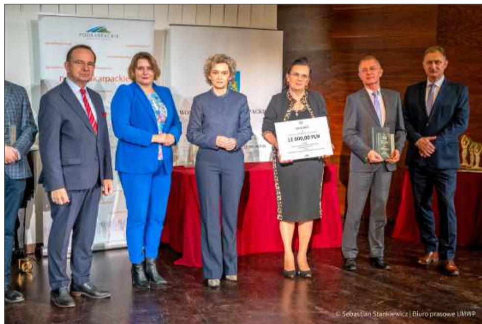
Marszałek wręczył nagrody NGO Wysokich Lotów.

Stowarzyszenie „Siedlisko Pokoleń” od lat konsekwentnie realizuje inicjatywy edukacyjne, prospołeczne i międzypokoleniowe. Jego działalność koncentruje się na budowaniu więzi społecznych, aktywizacji mieszkańców, pielęgnowaniu lokalnej tożsamości oraz wzmacnianiu