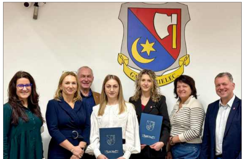
W Urzędzie Gminy Mielec odbyło się uroczyste ślubowanie nowych urzędników.

W Urzędzie Gminy Mielec odbyła się uroczystość, która zawsze ma wyjątkowy charakter – ślubowanie nowych pracowników samorządowych. To moment symboliczny, zamykający okres służby przygotowawczej i kończący się egzaminem, a jednocześnie otwierający drogę do pełnienia odpowiedzialnych zadań na rzecz mieszkańców gminy.