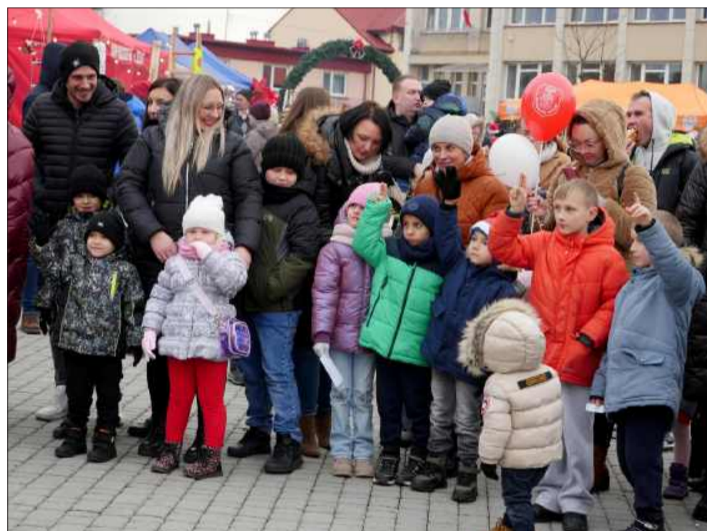
Spotkanie z Mikołajem i jego pomocnikami.