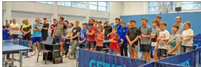
Turniej cieszył się sporym powodzeniem.

Po zakończeniu turnieju najlepszym pingpongistom wręczono puchary i dyplomy. Zawody sprawnie sędziował Józef Turecki, z pomocą arbitrow obecnych przy poszczególnych stołach. DD