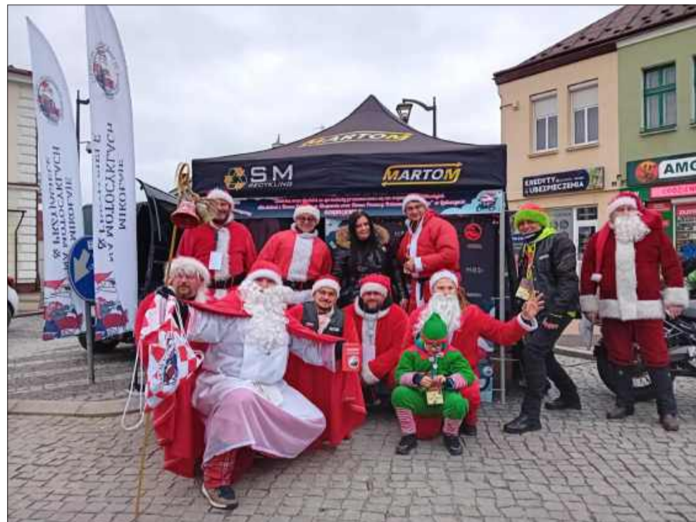
Weekend pełen radości i bożonarodzeniowej magii.