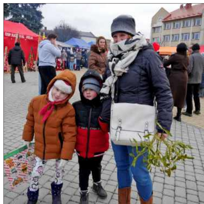
Najmłodszy niecierpliwie czekali na spotkanie z Mikołajem.