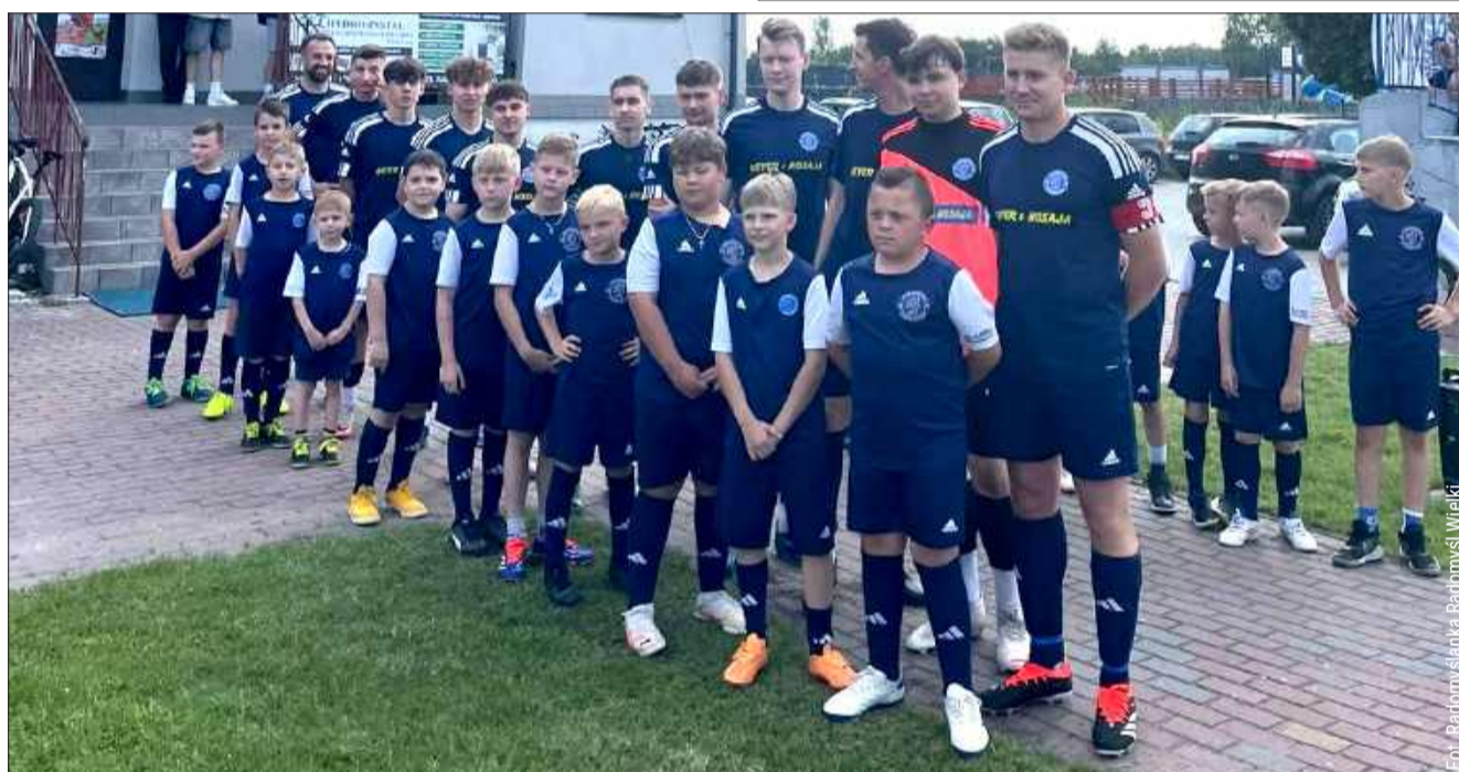
Radomyślanka jest liderem okręgówki dębickiej po jesieni