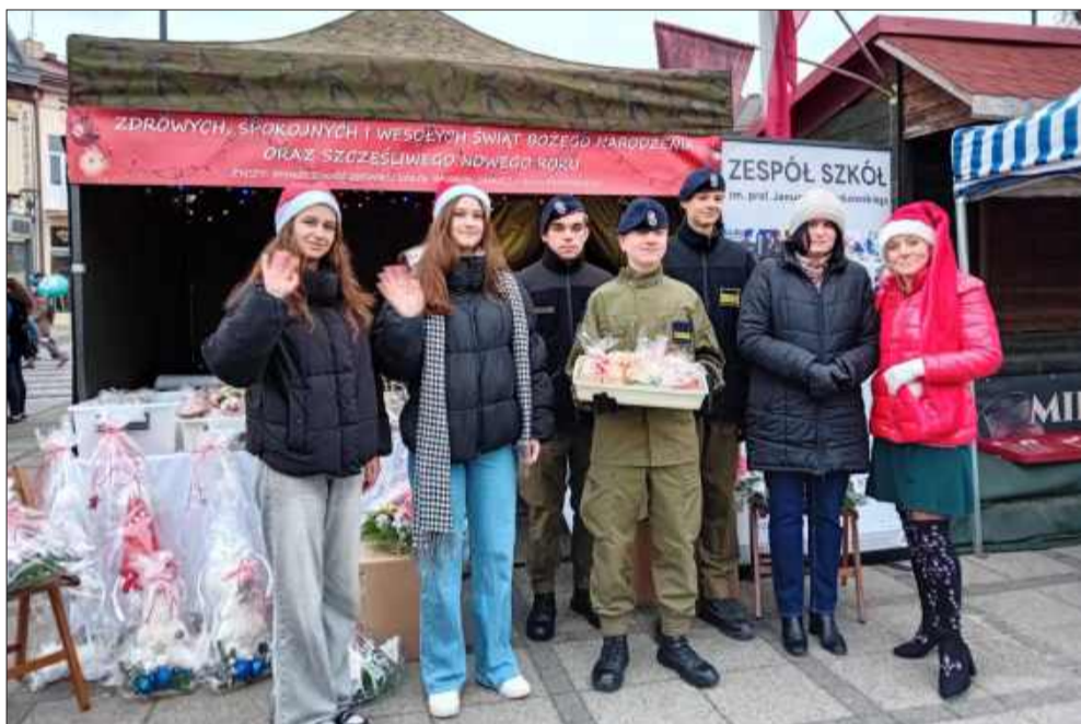
Pamiątkowe zdjęcia w mikołajowych strojach.