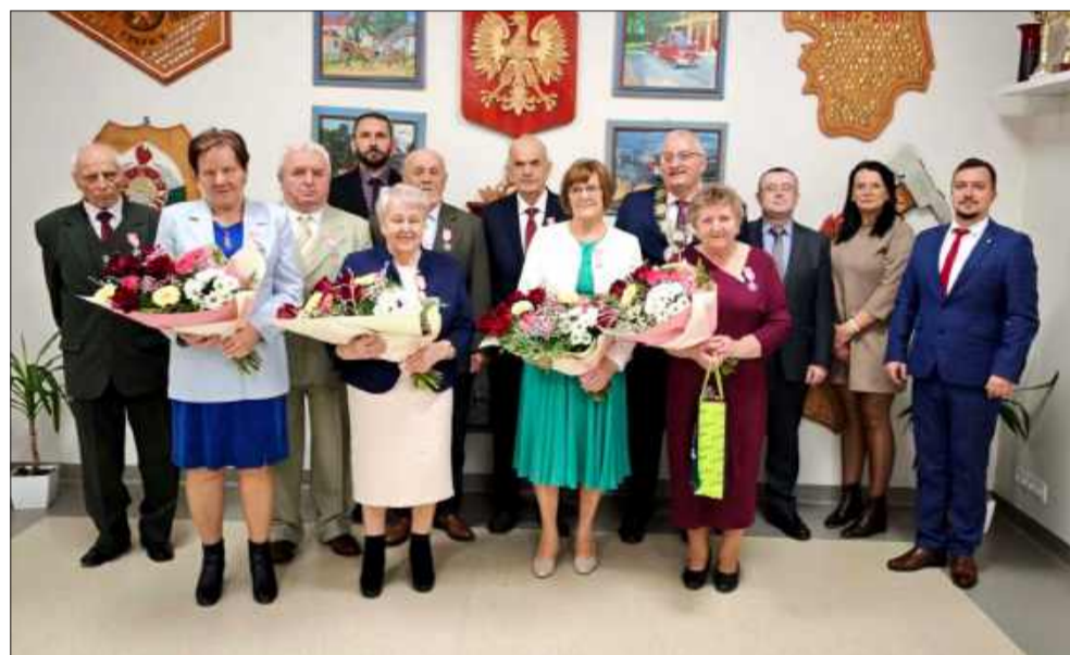
U honorowano pary z ponad 50-letnim stażem małżeńskim.