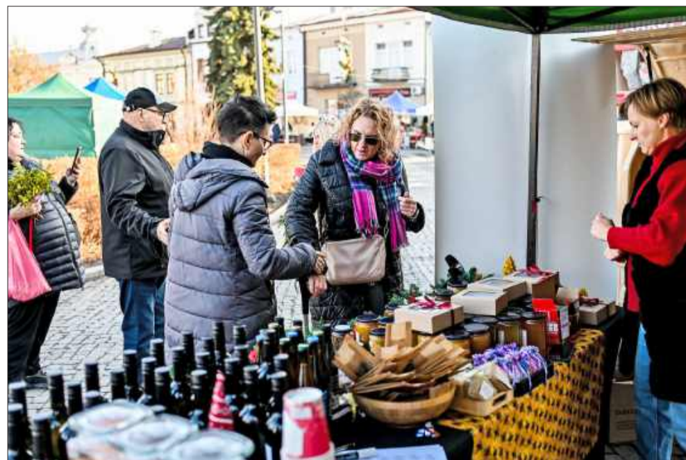
Zakupy świąteczne w centrum Mielca.