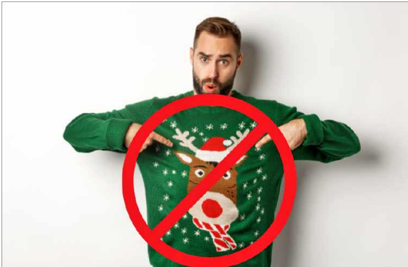
Wbrew pozorom takie stylizacje to nienajlepszy wybór