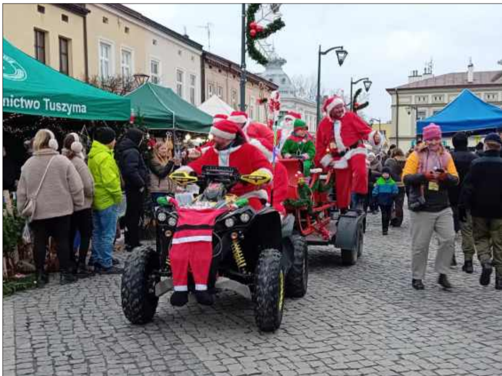
Mikołaje na Motocyklach – jedna z głównych atrakcji.

Przez cały weekend Rynek w Mielcu tętnił życiem, a frekwencja potwierdziła, że Powiatowy Jarmark Świąteczny na stałe wpisał się w kalendarz lokalnych wydarzeń. Dla wielu mieszkańców była to okazja nie tylko do zakupów, ale przede wszystkim do spotkań, rozmów i wspólnego wejścia w świąteczny nastrój. jb