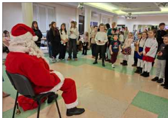
Spotkanie ze świętym Mikołajem.