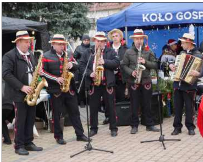
Kapela „Żarowanie” rozgrzewała odwiedzających jarmark.