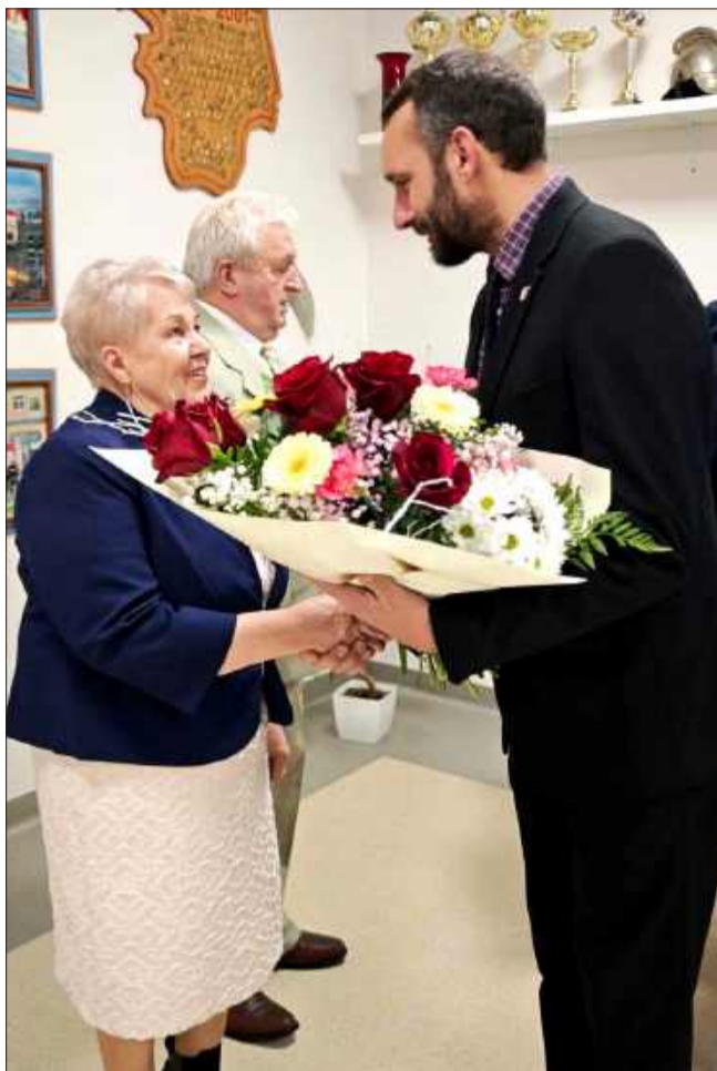
Nie zabrakło gratulacji i wspomnień.

Wszystkim odznaczonym parom życzymy dalszych lat zdrowia, pogody ducha i kolejnych wspólnych jubileuszy. MW