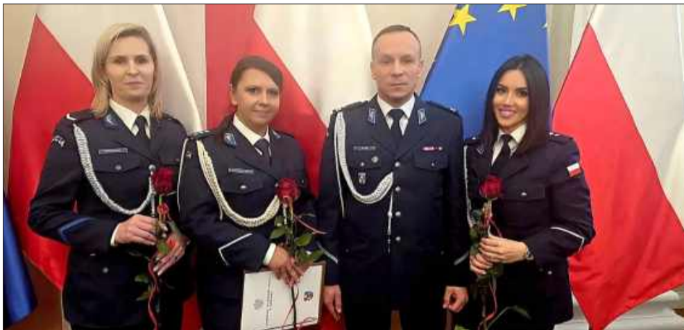
Przedstawicielki mieleckiej policji także były obecne na uroczystości.