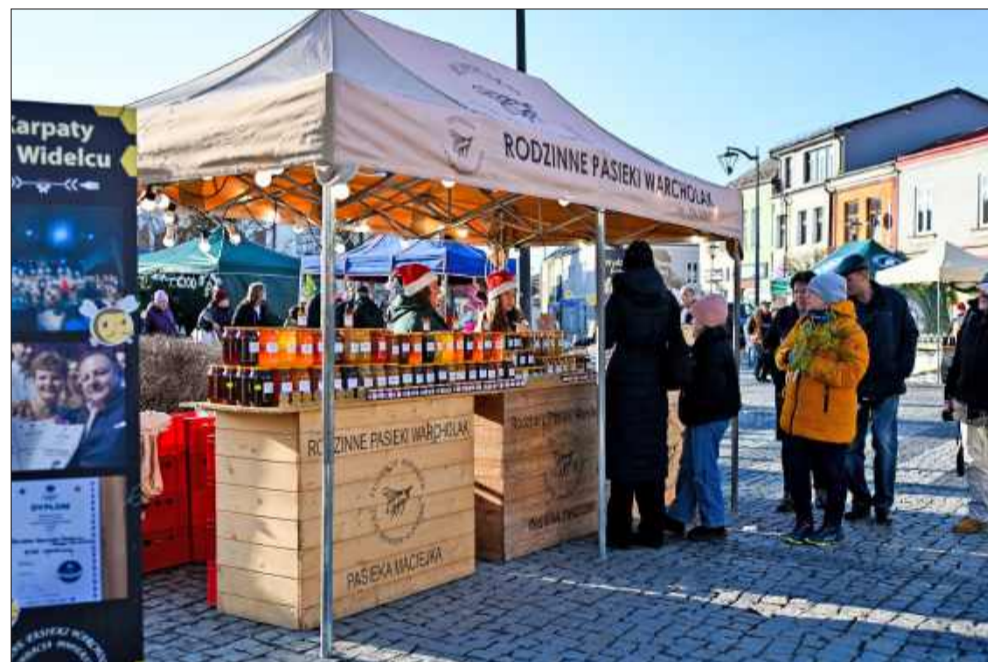
Świąteczne stoiska pełne regionalnych smaków.