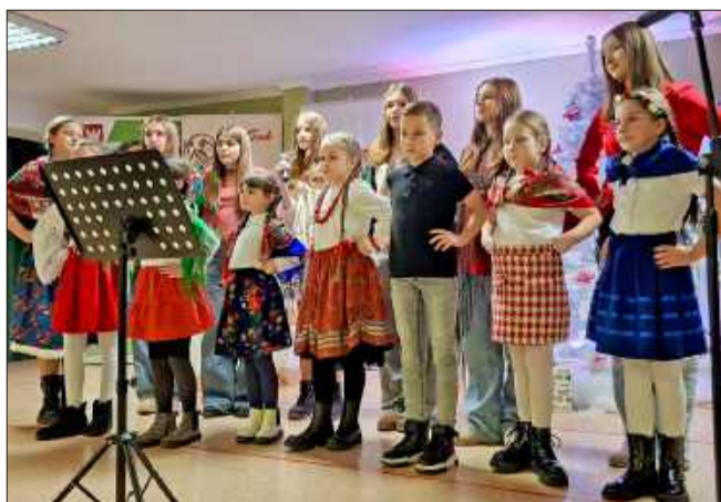
Występ SP Borki Nizińskie.

II Charytatywny Kiermasz Książki Przeczytanej po raz kolejny udowodnił, że lokalne inicjatywy mają wielką moc. Pozostaje mieć nadzieję, że za rok miłośnicy książek znów spotkają się w Borowej na kolejnym, równie udanym kiermaszu. MW