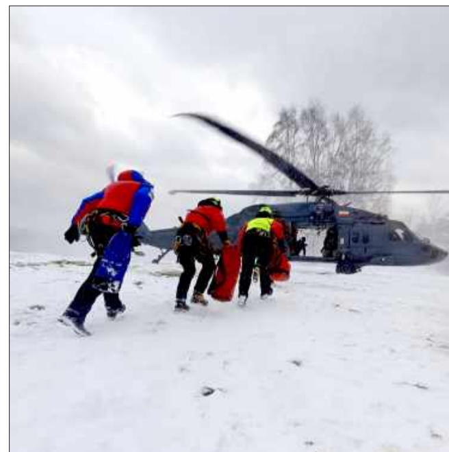
Black Hawk nad Bieszczadami. Kontrterrorysty trenowali w ekstremalnych warunkach.

Bieszczady ponownie stały się poligonem dla służb mundurowych. Podczas zaawansowanych ćwiczeń kontrterrorystycznych zorganizowanych przez jednostkę „BOA” nad górskim terenem wielokrotnie pojawiał się policyjny śmigłowiec S-70i Black Hawk.