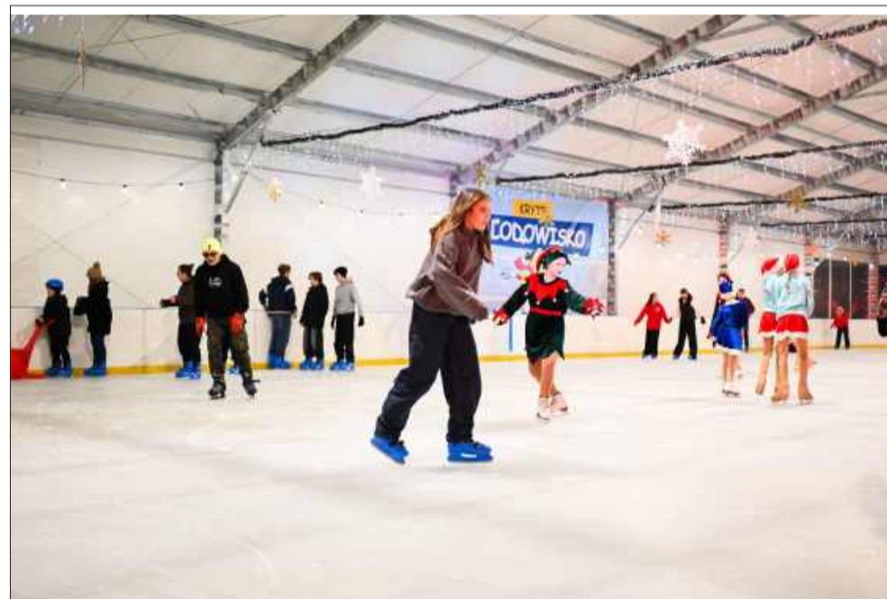
Nowe lodowisko cieszyło się dużym zainteresowaniem