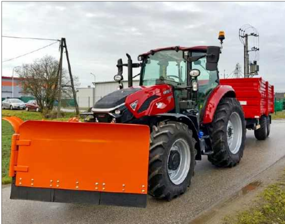
Ciągnik wyposażony jest w przyczepę.