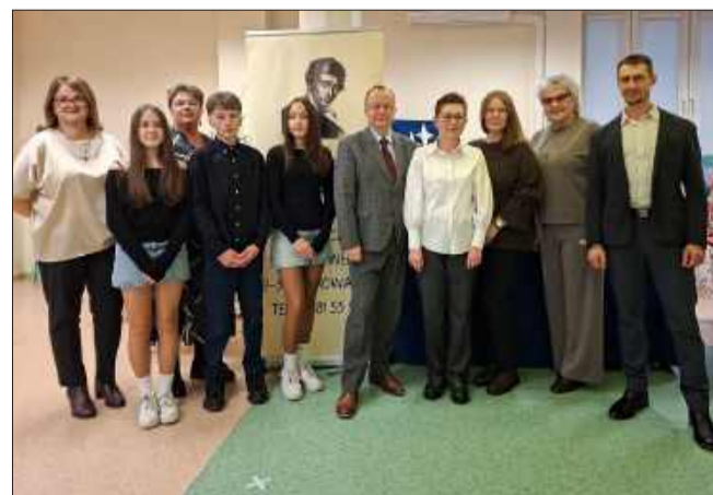
Gminny Ośrodek Kultury pełen miłośników książek.