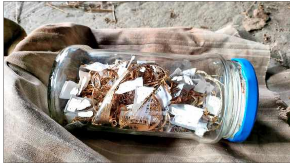
Lup był przechowywany m.in. w taki sposób.