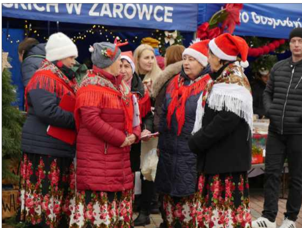
Stoiska kół gospodyń wiejskich jak zwykle, ugięły się pod ciężarem przysmaków.