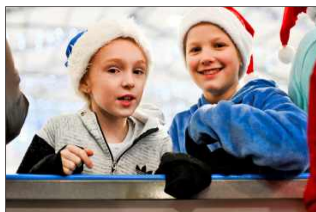
Najmłodsi z podziwem obserwowali występ.

Od godziny 17.00 lodowisko zamieniło się w muzyczną strefę zabawy. O oprawę dźwiękową zadbał DJ Paweł Waclawik, który przez cały wieczór serwował znane i lubiane hity, tworząc energetyczny klimat sprzyjający wspólnej zabawie na lodzie.