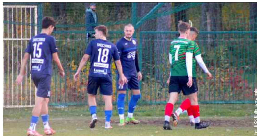
Jesieńna runda była świetna w wykonaniu „Smoków”.

Potem po zaciętym boju „Smoki” wywiozły komplet punktów z Brzostka, a następnie po bardzo dobrym meczu zremisowali z Sokołem II Kolbuszowa Dolna. W barwach przeciwnika wystąpiło w tym meczu, aż ośmiu zawodników z pierwszego zespołu trzecioligowca. Nie wystarczyło to jednak na dobrze dysponowanych w tym dniu mielczan.