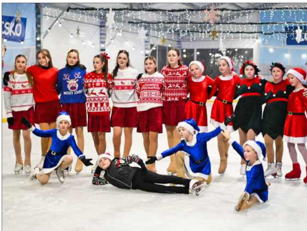
Widowiskowe układy łyżwiarskie.