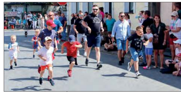
Niedzielną część Dni Żelechowa 2025 uświetniły również biegi dziecięce i młodzieżowe

gacze otrzymują pamiątkowe medale, statuetki oraz mają zapewnioną wodę, batony i ciepły posiłek - podkreślają organizatorzy, dziękując wszystkim darczyńcom. Na starcie biegu głównego i marszu Nordic Walking stanęło niemal 150 biegaczy. Po pokonaniu trasy, na żelechowskim rynku, wszyscy zostali udekorowani pamiątkowymi medalami. Najlepsi w swoich