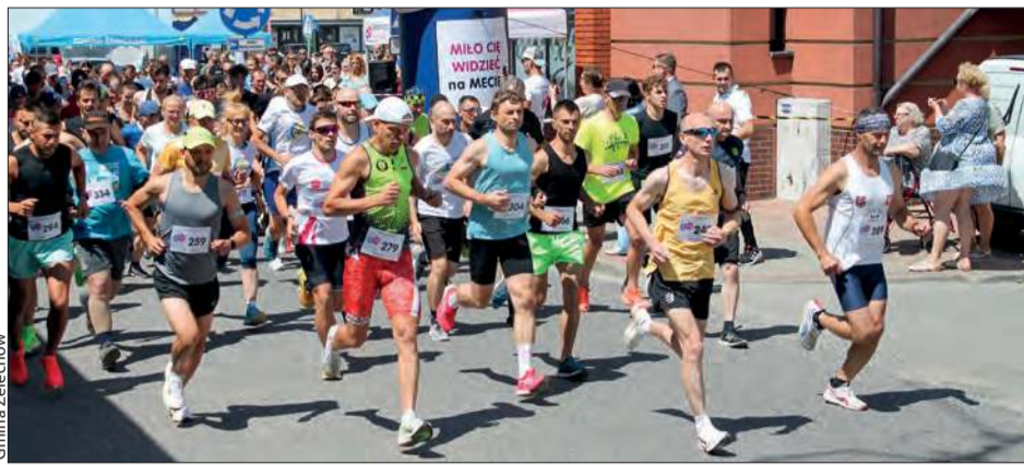
Uczestnicy zmierzli się z trasami biegu głównego na 8 km, marszu nordic walking na 5 km

Wydarzenie zostało zorganizowane przez grupę Żelechów Aktywni Sportowo z inicjatywą Piotrem Kajdą na czele, we współpracy z Gminą Że-