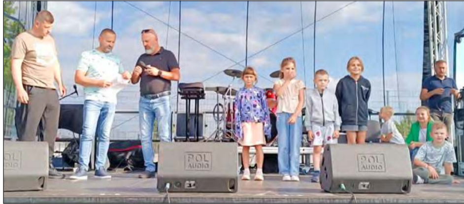
Zarząd Koła PZW nr 14 w Sobolewie przygotował konkurs plastyczny dla dzieci