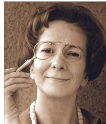
Wisława Szymborska, 1964

Z limeryków podhalańskich Twierdzą mieszkańcy wioski Jurgów, że się wywodzą od Habsburgów, a ściślej mówiąc od Rudolfa, który z ludnością grał tu w golfa.