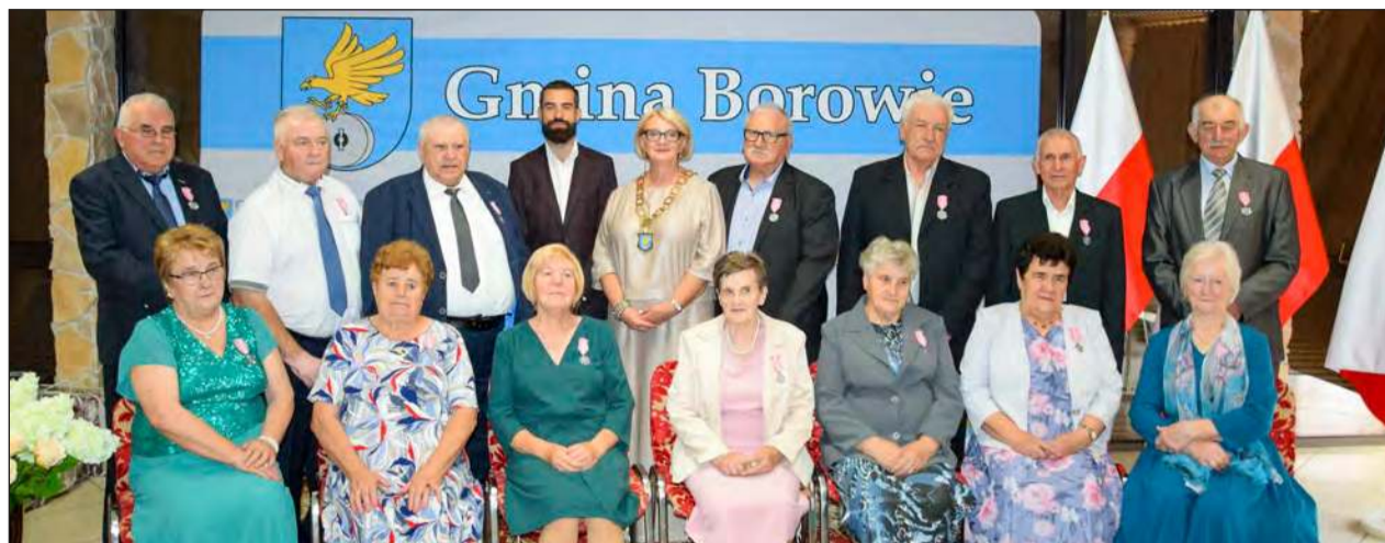
■ Osiem małżeństw z gminy Borowie świętowało swoje Złote Gody