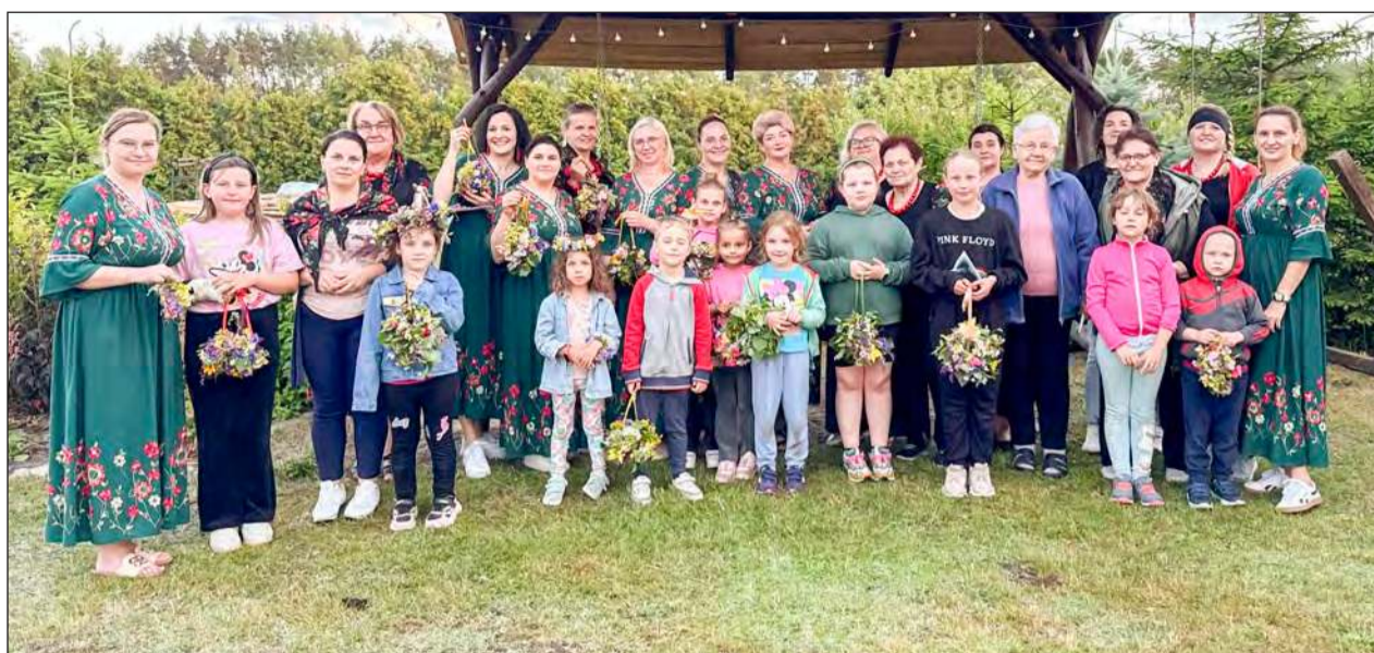
Urzekające w Jażwinach zorganizowały warsztaty plecienia tradycyjnych wianków z ziół i kwiatów. To część ich działań, które mają na celu odbudowę lokalnej tożsamości kulturowej

Na wydarzenie przyszło wielu mieszkańców Jażwin.