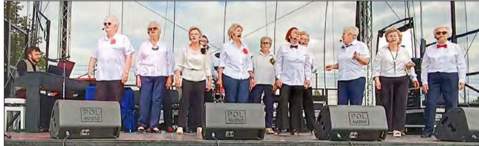
Scena w sobotę należała także do lokalnych artystów. O dawkę śmiechu i dobrego humoru zadbał Klub Pogodni, prezentując kabaret „Z życia wzięte, z humorem podane, czyli: Starsza młodzież daje czadu!”