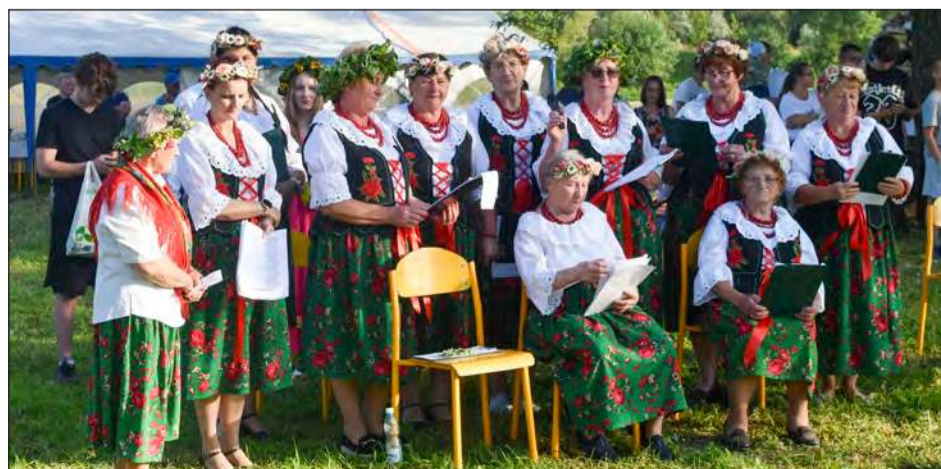
Podczas Nocy Świętojańskiej nie mogło zabraknąć występów artystycznych

Wydarzenie zakończyła zabawa z zespołem Nonsens. Partnerem wydarzenia był Samorząd Województwa Mazowieckiego.