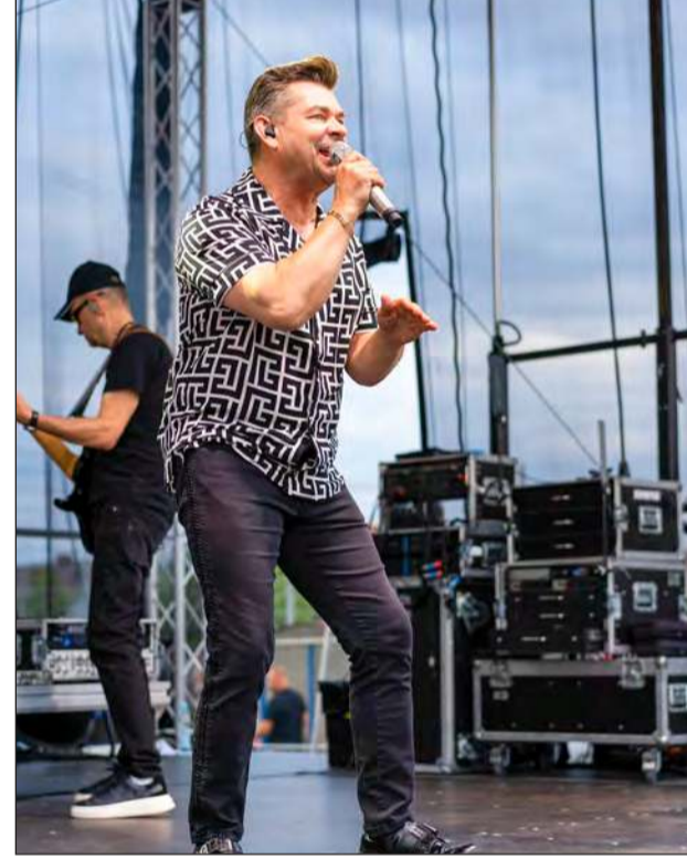
O 19:30 na scenie wystąpiła gwiazda wieczoru - Zenon Martyniuk z zespołem Akcent

tłumy fanów, którzy śpiewali, tańczyli i z entuzjazmem reagowali na każdy hit. Emocje sięgały zenitu, a wspólna zabawa trwała do późnych godzin wieczornych. Po koncercie Zenona Martyniuka scenę przejął zespół Nonsens, który zadbał o dalszą część muzycznej zabawy.