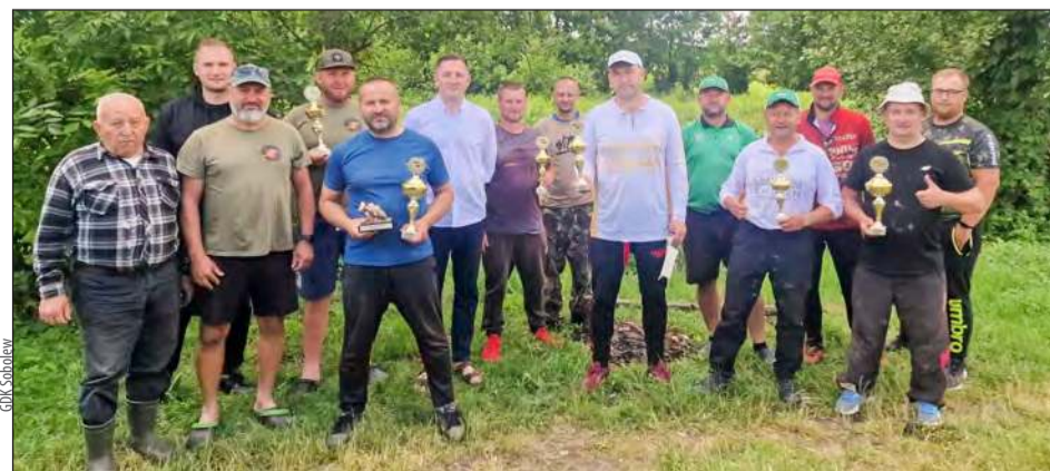
Świętowanie rozpoczęły zawody wędkarskie zorganizowane przez Koło Wędkarskie nr 14 w Sobolewie