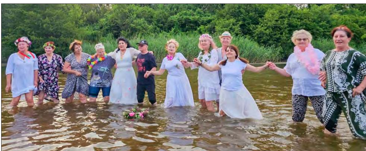
Nad Morskim Okiem w Wildze odbyła się Noc Kupały, która zgromadziła mieszkańców powiatu w poszukiwaniu legendarnego kwiatu paproci

W poniedziałkowy wieczór, 23 czerwca, miłośnicy plenerowych zabaw spotkali