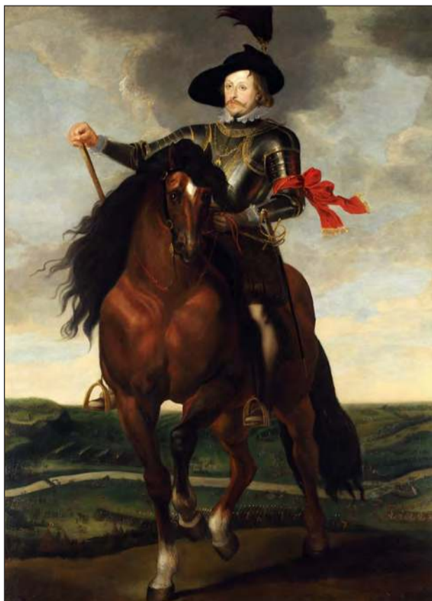
❖ Portret konny królewicza Władysława wykonał około 1624 r. Peter Paul Rubens

11 kwietnia królewicz „jechał do Okrzei. Król wyprowadzał go aż ku Żelechowu, tam dopiero zsiadłszy z karety, królewicz z płaczem upadł mu pronus do nóg i potem pocałował go w nogi. Król go zaś, zdjawszy czapkę, pocałował w głowę, przeżegnał i bardzo płakał. On potem znowu mu do nóg upadł