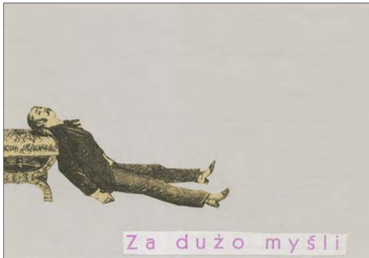
Wisława Szymborska, Wyklejanki 2003

Wiersze Szymborskiej, jako wakacyjna lektura i do tego zabawna! To chyba jakieś żarty! - pomyśli najeżony czytelnik tego artykułu. Albo nawet zakrzyknie! I będzie miał rację. Badania czytelnictwa w Polsce pokazują, że poezja jest często pomijana w wyborach lekturowych, wolimy prozę. W szkole nauczyciele koniecznie chcieli się od nas dowiedzieć, co poeta miał na myśli, pisząc wiersz a my, skąd mieliśmy to wiedzieć? I jeszcze w dorosłym życiu zabierać Szymborską na wakacje? Poezję?! Zapewniam,