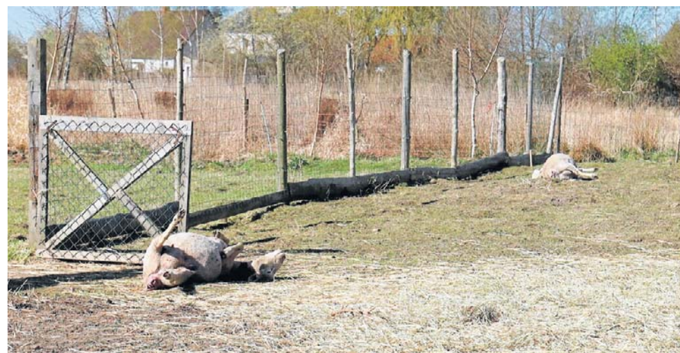
FOT. DAWID JASKIEWICZ

Wilki, przypominają jednak leśnicy, nie czai się i nie czai na człowieka. Jest drapieżnikiem szczytowym i reguluje w przyrodzie populację między innymi saren czy bobrów. Jak tłumaczą przyrodnicy, wilki robią to, co do nich należy. W całej Polsce według szacunków jest około 4 tysięcy osobników. Prawdopodobieństwo spotkania wilka w lesie jest więc minimalne. Tym bardziej, że zdrowy wilk człowieka unika. ©