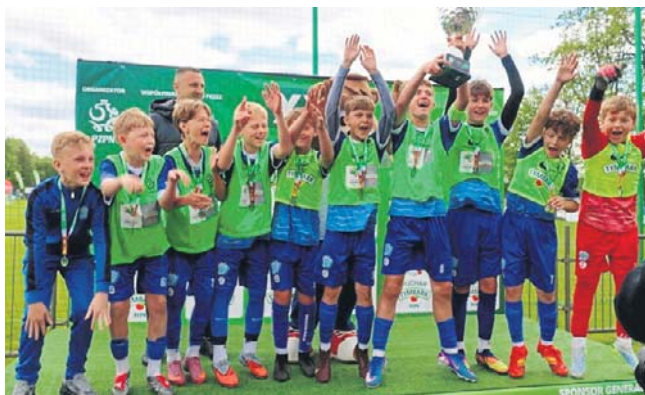
Chłopcy z SP 7 Koszalin