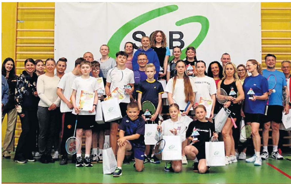
Uczestnicy finału badmintonowych zmagania w Sławnie

Bardzo dobre starty przedstawili Klubu Kolarskiego Ziemia Darłowska na progu sezonu kolarskiego, podczas inauguracji Zachodniopomor-