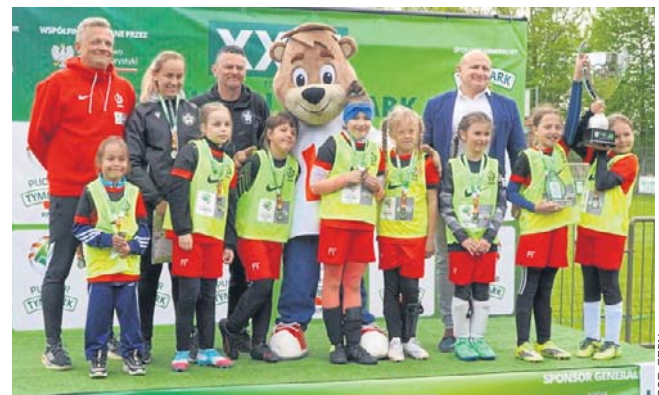
Dziewczynki z SP 1 Sianów

- Wiedzieliśmy, że pierwszy mecz będzie decydujący, żeby dobrze wejść w turniej. Udało się. No i też liczyliśmy się z tym, że byliśmy faworytem, ponieważ dla chłopców to jest już drugi finał. Dwa lata temu w kategorii U-10 zajęliśmy 3. miejsce