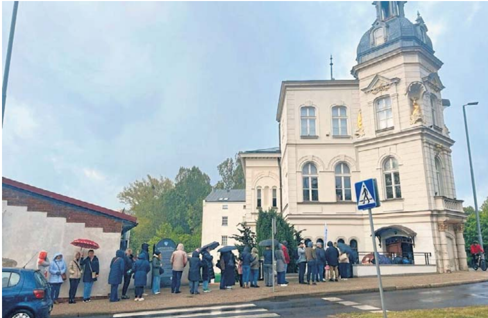
W Koszalinie Noc Muzeów połączona jest z obchodami 760-lecia miasta Koszalina i organizowana pod hasłem: „760 x Koszalin, czyli jak świętować to świętować!”