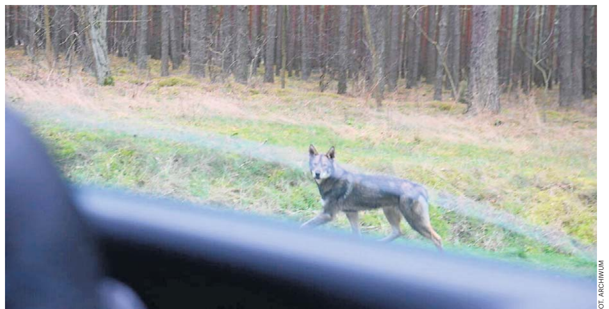
W lasach na Pomorzu Środkowym widok wilka nie jest już czymś wyjątkowym