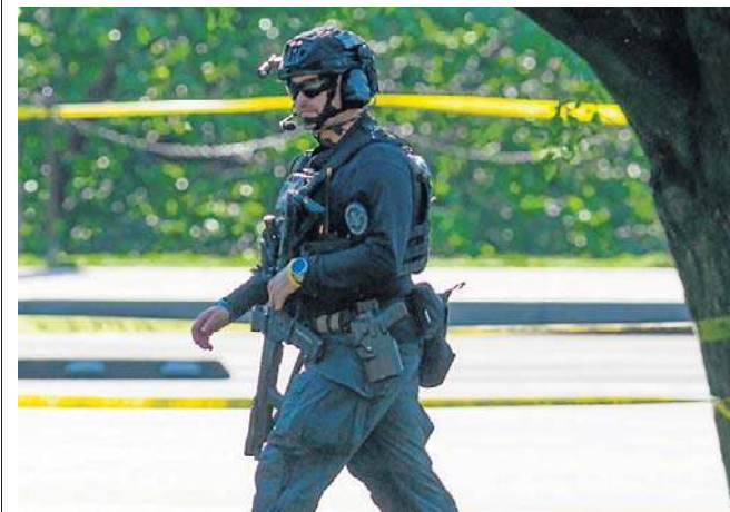
Policja oraz Secret Service nie ujawniają na razie, jakie były motywy działania postrzelonego mężczyzny

Ani policja, ani Secret Service nie określiły, jakie zamiary miał postrzelony mężczyzna. Chwilę przed incydemtem przejeżdżała obok kolumna pojazdów z wiceprezydentem J.D. Vance'em, lecz nic nie wskazuje, by miała ona związek ze strzelaniną.