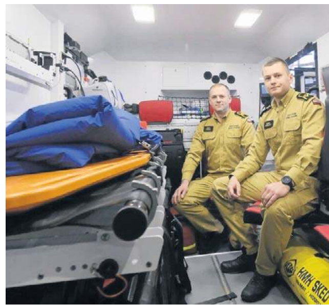
Strażacy podkreślają, że wewnątrz pojazdu można szybko - w ciągu 30 sekund - dostosować do rodzaju akcji

Jednym z ważniejszych rozwiązań jest możliwość szybkiej