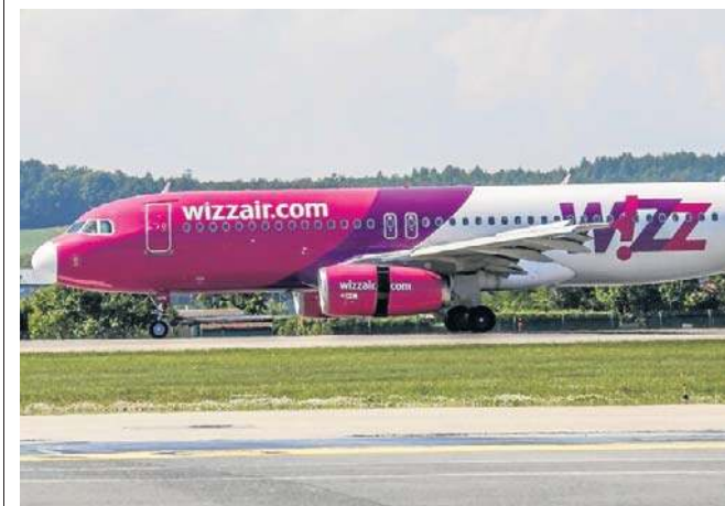
- Linie lotnicze w całej Europie mogą stanąć w obliczu bankructwa już we wrześniu - przewiduje prezes WizzAir

- Wydaje się, że Polska może być stosunkowo bezpiecznym rynkiem w Europie, ponieważ 90 proc. polskiego zapotrzebowania jest produkowane w Polsce i to w dużej mierze z surowca, który nie przychodzi do nas z Zatoki Perskiej - mówi Wesołek.