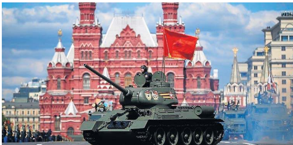
Ministerstwo Obrony poinformowało wcześniej, że Defilada Zwycięstwa w Moskwie po raz pierwszy od 2007 roku odbędzie się bez udziału sprzętu wojskowego

Później tego dnia Zełenski ogłosił „reżim ciszy”, czyli