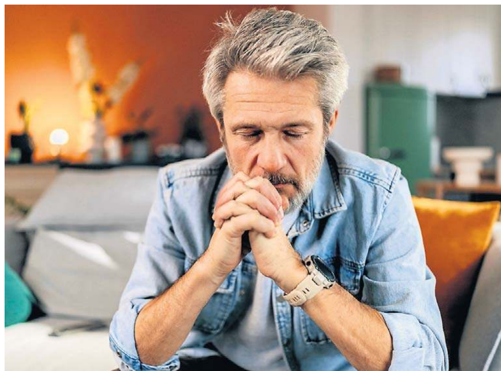
Polacy nie przygotowują się do starości i to poważny błąd

Polacy liczą na rodzinę, ale prawie nikt nie przygotowuje się systemowo na niesamodzielność. Dobra wiadomość jest taka, że przygotowanie do starości nie musi oznaczać rezygnacji z życia ani straszenia się chorobą. To racjonalne planowanie: zdrowia, relacji, pieniędzy i przestrzeni. Im wcześniej zaczynasz, tym większa szansa, że starość rzeczywiście będzie taka, jaką sobie dziś wyobrażamy: u siebie, bezpieczna i możliwie samodzielna.