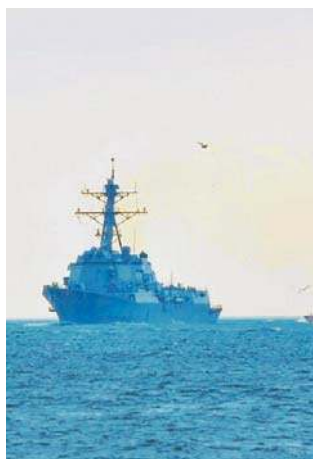
Niszczyciel USS Truxtun, zdjęcie z 2014 roku

Tranzyt niszczycieli nastąpił po ogłoszeniu przez prezydenta Donalda Trumpa, że Stany Zjednoczone pomogą przeprowadzać statki przez cieśninę Ormuz, zablokowaną przez Iran w pierwszych dniach