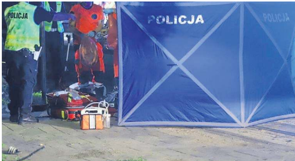
Podczas udzielania pomocy przez policjantów i ratowników pojawił się postronny 40-letni mężczyzna, który przeszkadzał i uniemożliwiał pomoc rannemu

40-latek awanturował się, dlatego policjanci użyli gazu pieprzowego w ramach środków przymusu bezpośred-