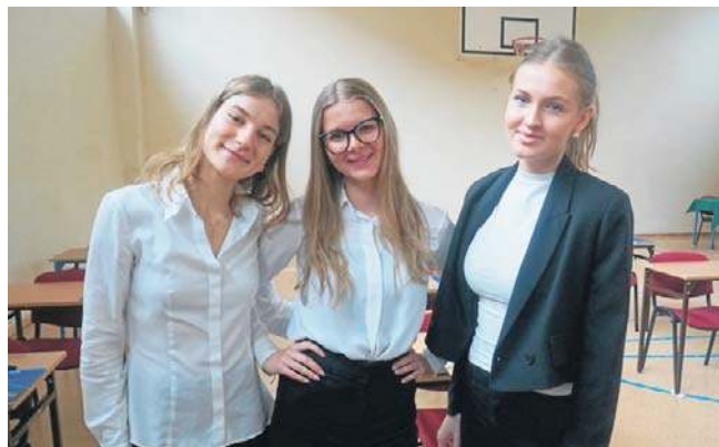
Maturzystki z II Liceum Ogólnokształcącego przed egzaminem z matematyki

Arkusze z egzaminów pisemnych (rozpoczynających się o 9.) pojawiają się na stronie cke.gov.pl po zakończeniu sesji, najczęściej o godzinie 14. Uwaga! Arkusze wraz z rozwiązaniami ekspertów będą publikowane w serwisie gloswielkopolski.pl w dniu egzaminu, tuż po ich udostępnieniu przez CKE.