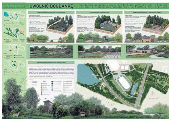
Wizualizacje przygotowane na konkurs „Uwolnić Bogdanke”

- Od dekady trwają starania osiedlowych radnych, architek-