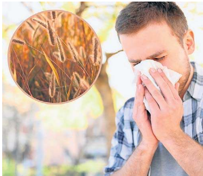
W maju najbardziej uciążliwe dla alergików są pyłki dębu i traw