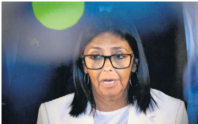
- Wenezuela nie jest kolonią, lecz wolnym krajem - powiedziała p.o. prezydenta Delcy Rodríguez

Rodriguez przemawiała w Międzynarodowym Trybunale Sprawiedliwości (MTS) w Hadze, gdzie toczy się postępowanie w sprawie sporu granicznego pomiędzy Wenezuelą a Gujaną o region Esequibo. U wybrzeży tego regionu, kontrolowanego przez Gujanę, odkryto w ostatnich latach bogate złoża ropy naftowej, a Wenezuela rości sobie do niego pretensje.