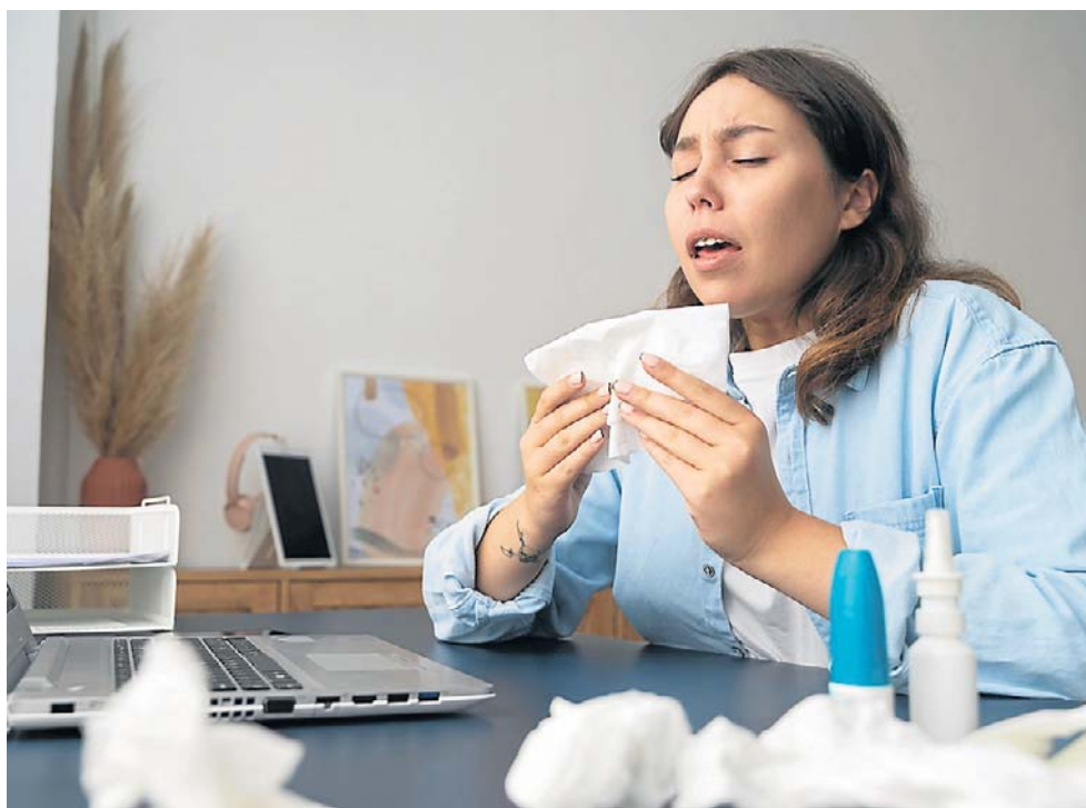
Jak odróżnić alergię od przeziębienia?

U wielu osób z alergią wziewną występuje również tzw. alergię krzyżową na produkty spożywcze, na przykład osoby uczulone na pyłki traw reagują alergicznie również na pomidory, orzeszki ziemne czy pomarańcze. Alergia krzyżowa pojawia się, ponieważ przetworzone przez układ odpornościowy w reakcji na pyłki reagują również w zetknięciu z innymi alergenami.