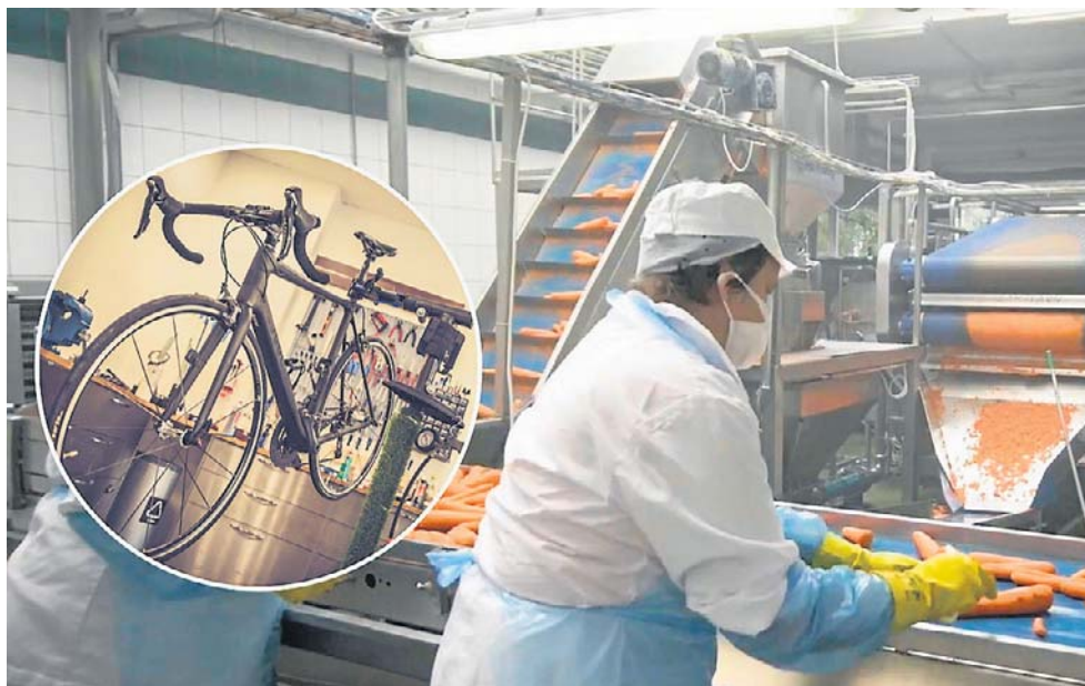
Marwit powstał w 1993 roku, a w 2021 ogłosił upadłość. Świeże soczki marchewkowe były bardzo znane, „zagrały” nawet w filmie, nazwano je „marwitkami”