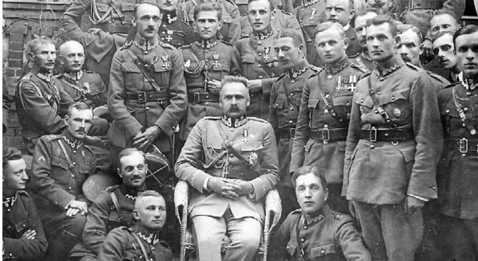
Józef Piłsudski wśród oficerów 64 Pułku Piechoty z Grudziądza. Jednostka ta opowiedziała się po stronie rządowej. Zdjęcie zrobione niedługo po zamachu

„Pierwsze wieści o rokoszu dotarły do Torunia w środę 12 bm po południu - czytamy. - Wielu nie chciało dać wiary, by w obecnej, tak ciężkiej dla państwa chwili, ktokolwiek mógł odważyć się rozpuścić ogień