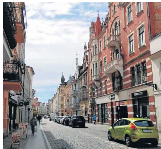
Tu mieściła się redakcja „Słowa Pomorskiego”