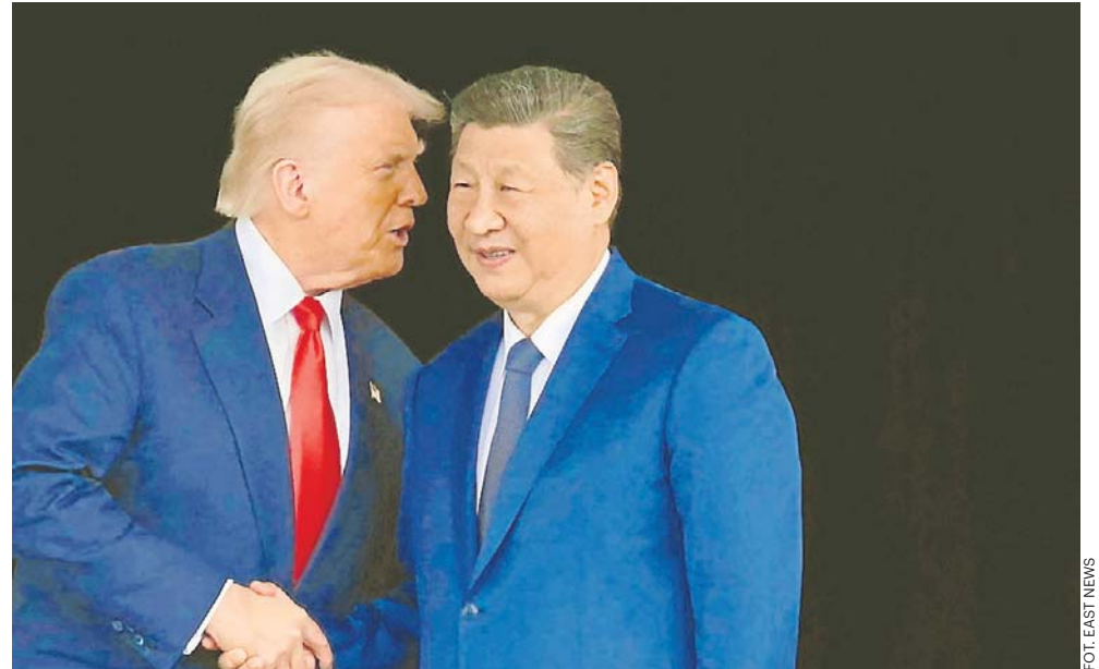
Przywódcy USA i Chin podczas ostatniego spotkania w październiku 2025 roku w Korei Południowej