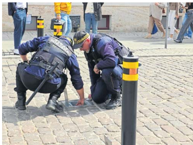
Obsługa słupków na starówce w Toruniu - między innymi na ulicy Chełmińskiej - zajmują się strażnicy miejscy

Właśnie strażnicy miejscy mają najwięcej pracy przy systemie. To oni, o wyznaczonych godzinach, wysuwają z słupki z nawierzchni jezdni lub je w niej chowają. Są one uruchamiane na kluczyk. Z nieoficjalnych informacji wynika, że strażnicy mają problemy z obsługą słupków. Obawiają się także tego, jak system będzie działał zimą. - Podpisaliśmy umowę z firmą, która zajmuje się utrzymaniem słupków. Raz w tygodniu słupki są one czysz-