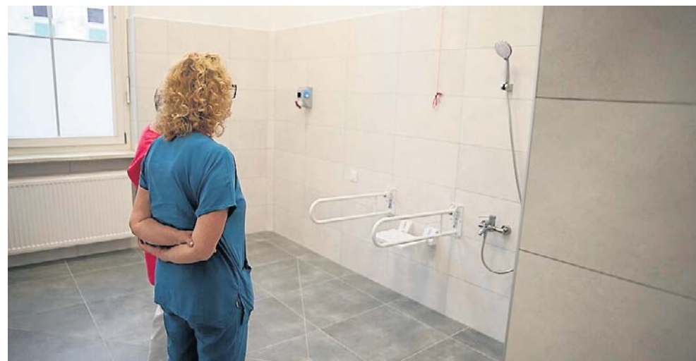
Oddział Rehabilitacji Ogólnoustrojowej i Neurologicznej przeniósł się na pierwsze piętro

- Zapewniamy im indywidualną, dostosowaną do potrzeb każdego z nich opiekę lekarzy, fizjoterapeutów i innych osób z personelu. To pacjenci neurologiczni, na przykład po urazach mózgu, urazach czaszkowo-mózgowych, po porażeniach w wyniku udaru. Są to też ci ortopedyczni, czyli osoby ze wstawionymi prote-