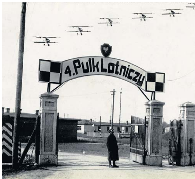
Wjazd na toruńskie lotnisko

Posiłki z Pomorza do Warszawy nie dotarły, chociaż 64 pułk z Grudziądza i 67 Pułk Piechoty z Brodnicy rzeczywiście miały zamiar tam ruszyć. Nie udało im się to z powodu strajku kolejarzy, którzy poparli Józefa Piłsudskiego. Czy z toruńskiego lotniska rzeczywiście poleciały na pomoc rządowi cztery samoloty, tego nam się potwierdzić nie udało. W zamachu majowym, po każdej ze stron zginęło ponad 100 żołnierzy. Podczas walk śmierć poniosło również 164 cywili. Przewrót podzielił kraj, wrogie obozy zaczęły się jednoczyć dopiero w 1939 roku, chociaż niektóre rany nie zablizniły się nawet wtedy. Warto jednak pamiętać, że ludzie, którzy w maju 1926 roku stanęli na przeciw siebie, później walczyli o Polskę i za nią umierali. Generał Leonard Skierski jest na przykład najstarszą ofiarą zbrodni katyńskiej.