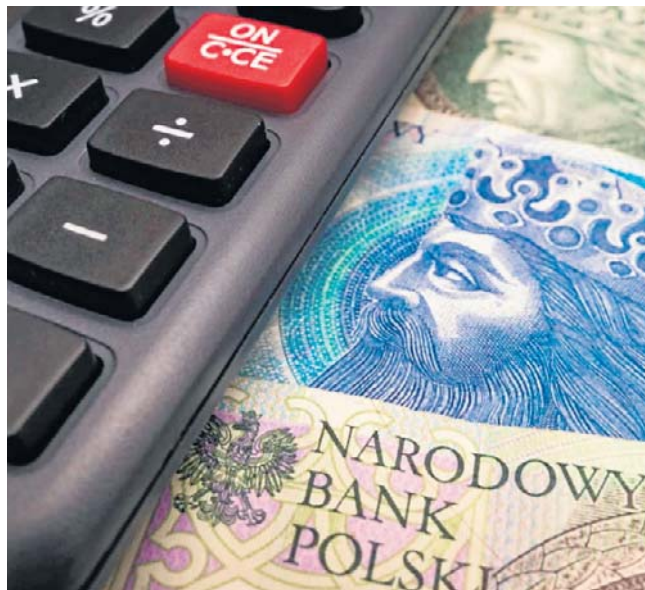
Na 12 maja zaplanowano w Sejmie pierwsze czytanie projektu Lewicy dotyczącego konkretnych zmian w liczeniu minimalnego wynagrodzenia

Oczywiście, veto co do różnych kwestii zgłaszali tutaj przedstawiciele pracodawców. Kluczowa różnica pomiędzy projektami polega też na tempie wdrożenia zmian. Wersja