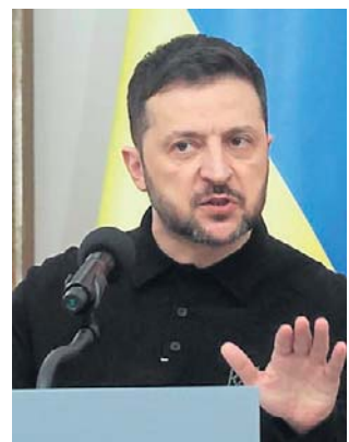
„Rosja zdecydowała o zakończeniu ciszy”

„Rosja sama zdecydowała o zakończeniu częściowej ciszy, która utrzymywała się przez kilka dni. Tej nocy wystrzeliła przeciwko Ukrainie ponad 200 dronów uderzeniowych. Na froncie ponownie użyto bomb lotniczych - ponad 80, odnotowano także ponad 30 uderzeń lotniczych” - napisał Zełenski w serwisach społecznościowych.