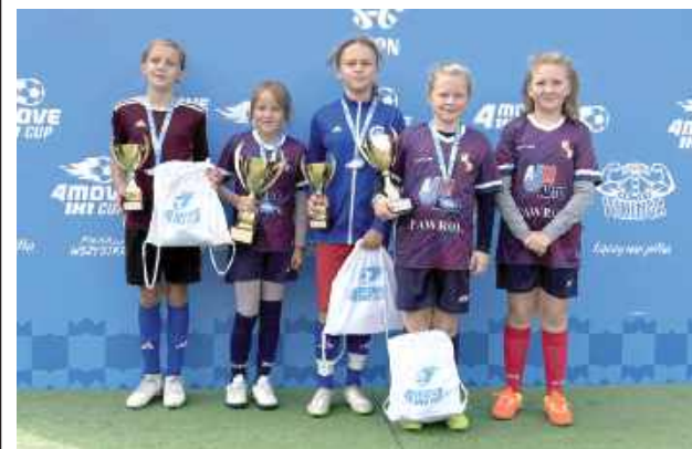
Nasze dzielne piłkarki!