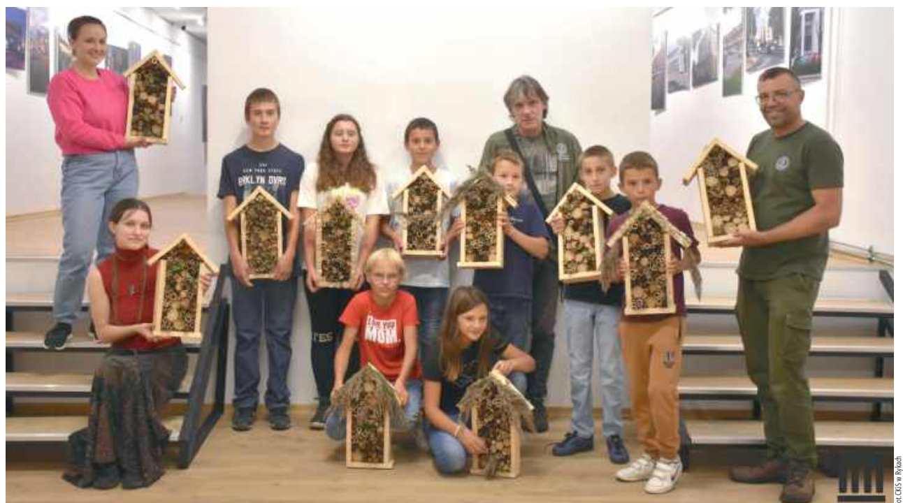
US Młodzież nie tylko świetnie się bawiła, ale również nauczyła się obsługi kilku narzędzi i dowiedziała się, jak można zrobić coś z (pozornie) niczego

Na zakończenie warsztatów uczestnicy otrzymali upominki od Zespołu Lubelskich Parków Krajobrazowych oraz notesy od CKiS.