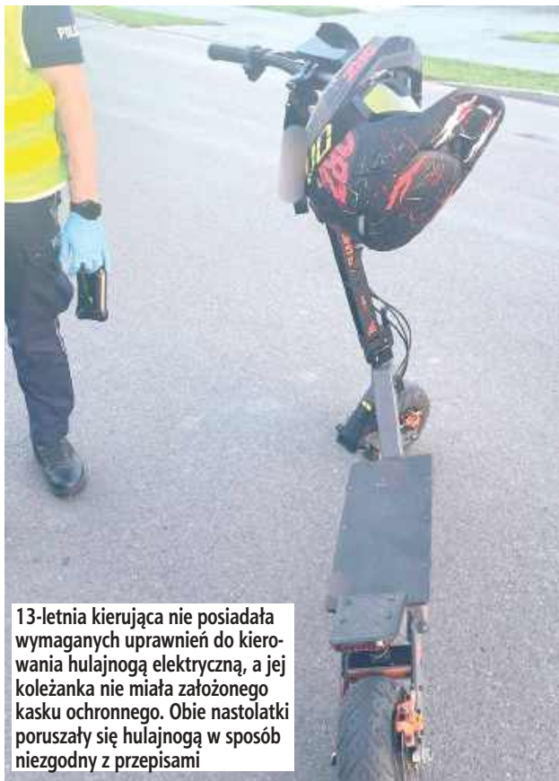
13-letnia kierująca nie posiadała wymaganych uprawnień do kierowania hulajnogą elektryczną, a jej koleżanka nie miała założonego kasku ochronnego. Obie nastolatki poruszały się hulajnogą w sposób niezgodny z przepisami

Z ustaleń policjantów wynika, że 13-letnia mieszkanka powiatu ryckiego kierowała hulajnogą elektryczną, przewożąc na niej swoją 12-letnią koleżankę. W pewnym momencie dziewczynka straciła panowanie nad pojazdem i zjechała z drogi dla