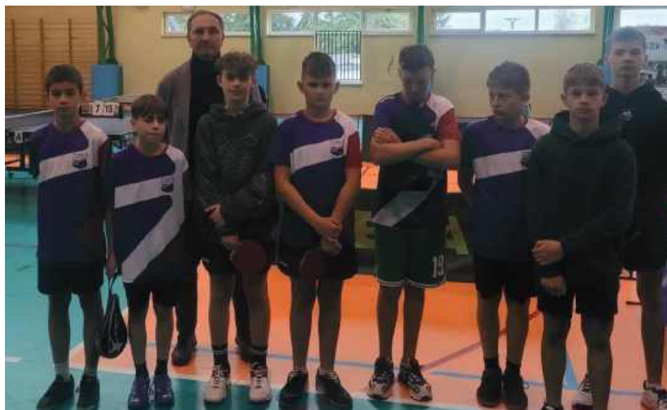
Zespół Amatora Leopoldów-Rososz