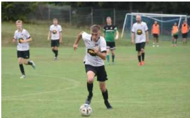
Gracze Orłęt przywieźli punkt z boiska Legionu