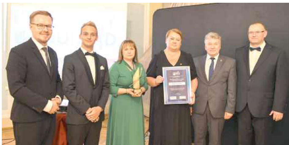
Ogólnopolski Konkurs o Znak Jakości „Przyjazny Urząd” od lat promuje i nagradza instytucje sektora publicznego, które stawiają na nowoczesne i rzetelne zarządzanie, wysoką kulturę pracy, uczciwość, otwartość wobec obywateli oraz innowacyjne rozwiązania w obsłudze klienta

Ogólnopolski Konkurs o Znak Jakości „Przyjazny Urząd” od lat promuje i nagradza instytucje sektora publicznego, które stawiają na nowoczesne i rzetelne zarządzanie, wysoką kulturę pracy, uczciwość, otwartość wobec obywateli oraz