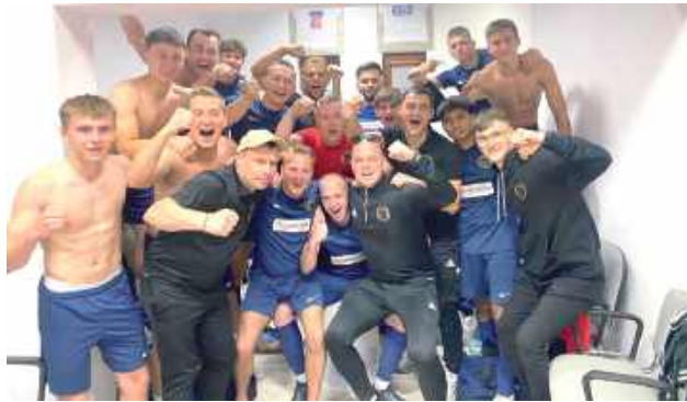
Kolejne rodzinne zdjęcie ekipy Czarnych Dęblin!

- Nie od dziś wiadomo, że mecze z Wilkami do łatwych nie należą, dlatego już przed spotkaniem uczu-