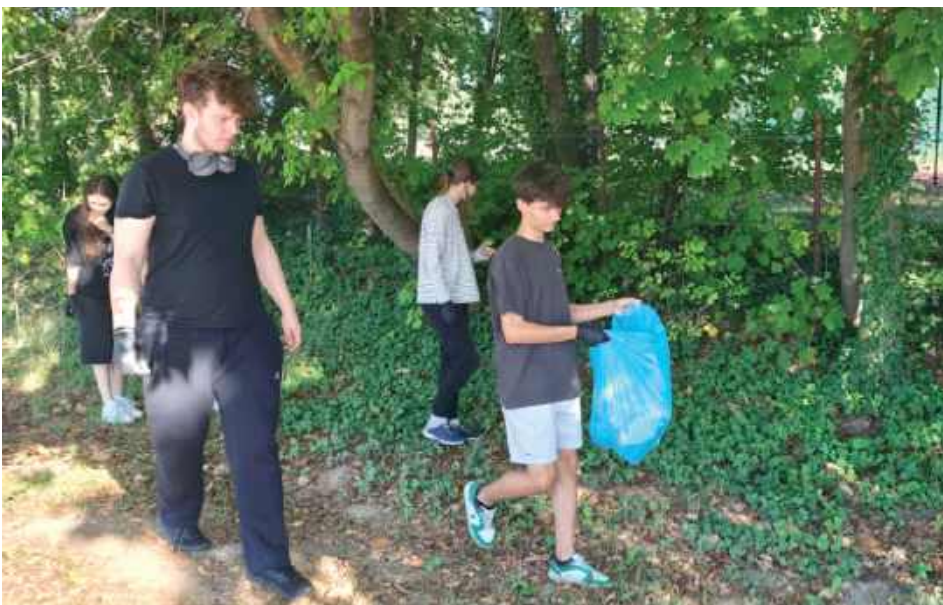
LO w Rykach

W ramach ogólnopolskiej akcji Sprzątanie Świata, uczniowie Zespołu Szkół Zawodowych nr 1 w Rykach aktywnie włączyli się w działania na rzecz ochrony środowiska. Zaopatrzeni w rękawiczki i worki na śmieci, przeszli wybranymi ulicami Ryk, zbierając porzucone odpady i dbając o czystość swojej okolicy. Młodzież z zaangażowaniem i entuzjazmem podjęła się tego zadania, pokazując, że troska o środowisko naturalne to sprawa nas wszystkich. Inicjatywa miała na celu nie tylko uprzątnięcie przestrzeni publicznej, ale również promowanie postaw proekologicznych wśród młodych ludzi