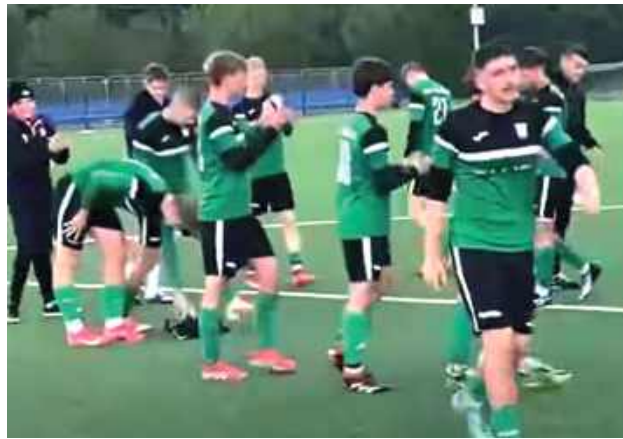
Gracze Ruchu II rozbili drugi zespół Lewart Lubartów

Od pierwszego gwizdka to zawodnicy Ruchu II Ryki nadawali ton grze. Gospodarze nie potrafili wypracować sobie klarownych okazji