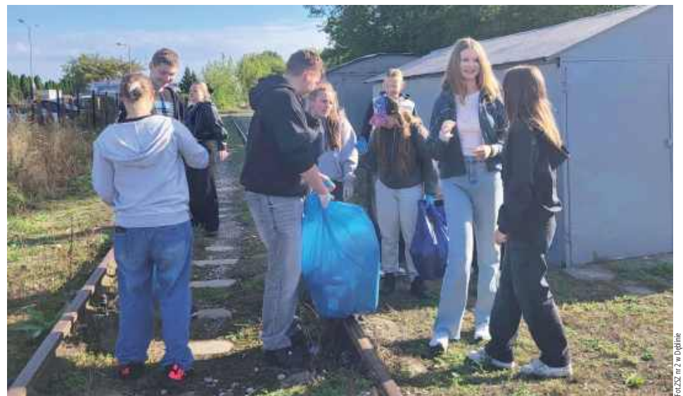
ZSZ nr 2 w Dębline

22 września uczniowie Liceum Ogólnokształcącego w Rykach wzięli udział w corocznej akcji „Sprzątanie Świata”. W trosce o środowisko lokalne, młodzież zaopatrzona w rękawiczki i worki na śmieci wyruszyła, by posprzątać wybrane miejsca na terenie miasta. Tego dnia licealiści udowodnili, że odpowiedzialność za planetę zaczyna się od najbliższego otoczenia – i warto o nie dbać każdego dnia, nie tylko od święta