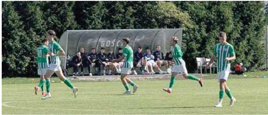
Piłkarze Ruchu dwukrotnie cieszyli się z goli. Ostatni gwizdek oznaczał kolejną porażkę

Druga połowa mogła rozpocząć się dla Ruchu znakomicie. - Przy stanie 2:2 mieliśmy słupek po strzale Wojtka Żelazko,