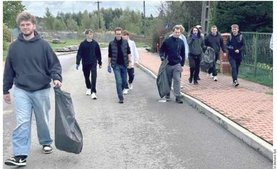
ZSZ nr 1 w Rykach