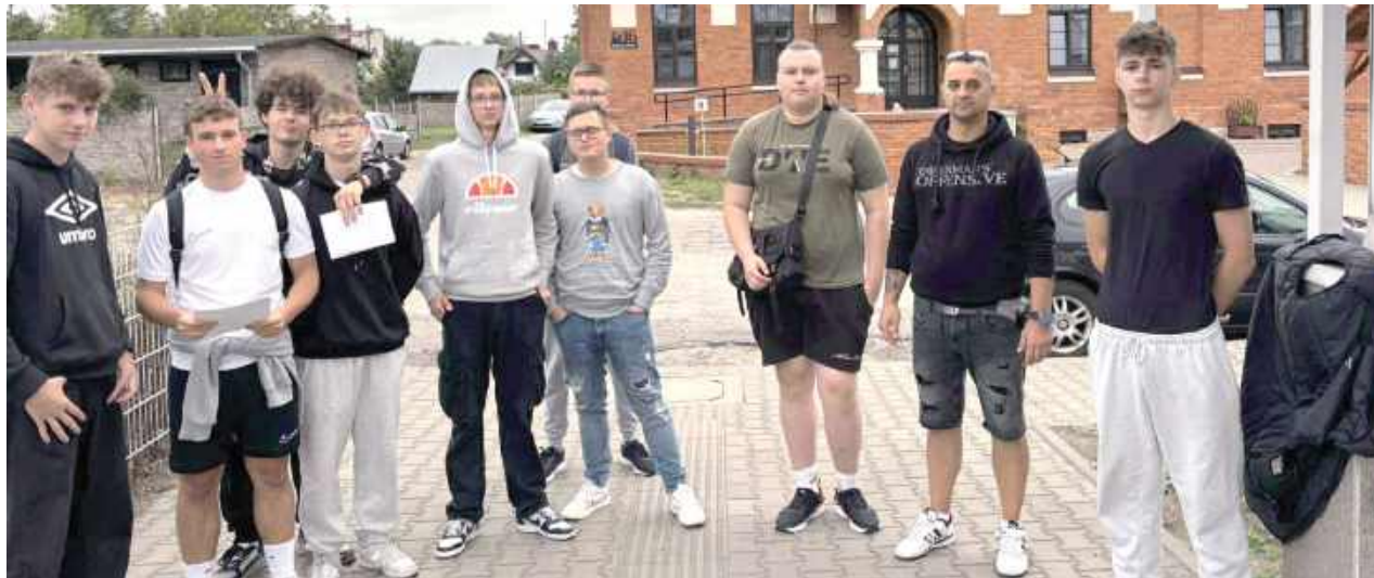
Zadaniem patroli było dotarcie wyznaczoną trasą do punktów kontrolnych i wykonanie zadań. Na każdym punkcie kontrolnym (każdy z nich nosił nazwę zawodu kształconego obecnie w szkole) uczestnicy odczytywali fragment historii szkoły

Zadaniem patroli było dotarcie wyznaczoną trasą do punktów kontrolnych i wykonanie zadań. Na każdym punkcie kontrolnym (każdy z nich nosił nazwę zawodu kształconego obecnie w szkole) uczestnicy odczytywali fragment historii