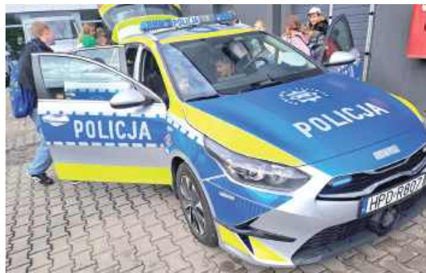
Dzieci miały okazję nie tylko poznać tajniki codziennej służby policjantów, ale również zwiedzić budynek komendy oraz zapoznać się z policyjnym sprzętem

- Naszym celem było nie tylko pokazanie dzieciom kulis policyjnej służby, ale przede wszystkim przekazanie im wiedzy na temat bezpieczeństwa - podkreśla asp. Łukasz Filipek, oficer prasowy