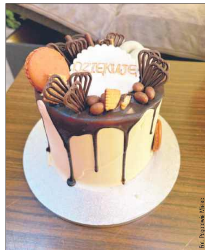
Gratulujemy ratownikom skutecznej akcji!