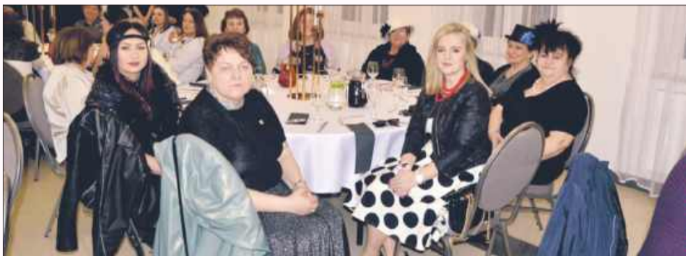
GAWŁUSZOWICE- To był wyjątkowy Dzień Kobiet

To był właśnie ten czas dla wszystkich pań i na czerwonym dywanie tak mogły chociaż przez chwilę się poczuć. ak