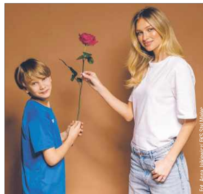
Specjalna sesja zdjęciowa Akademii FKS Stal Mielec z okazji dnia kobiet

Cavaleiro ma za sobą występy w najważniejszych ligach europejskich. W Premier League rozegrał niemal 60 spotkań, w La Liga – 34, w Ligue 1 – 31, a w angielskiej Championship aż 134 mecze. Ostatnio reprezentował barwy brazylijskiego zespołu RB Bragantino.