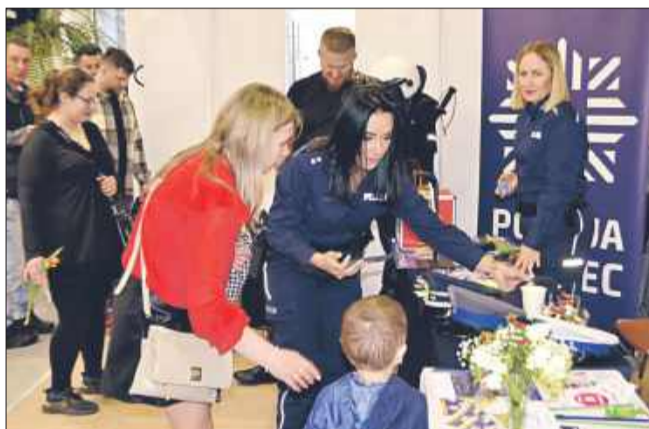
Zainteresowanie policją już od najmłodszych lat.