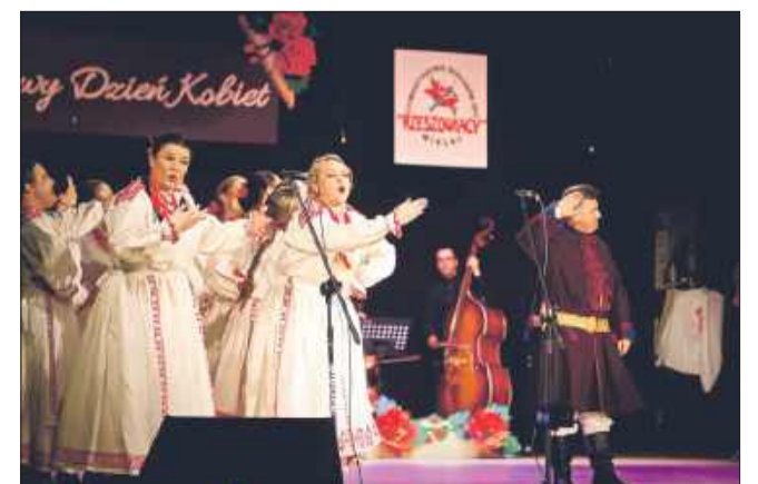
Choreografie pełne emocji wzbudzały zachwyt wśród publiczności.