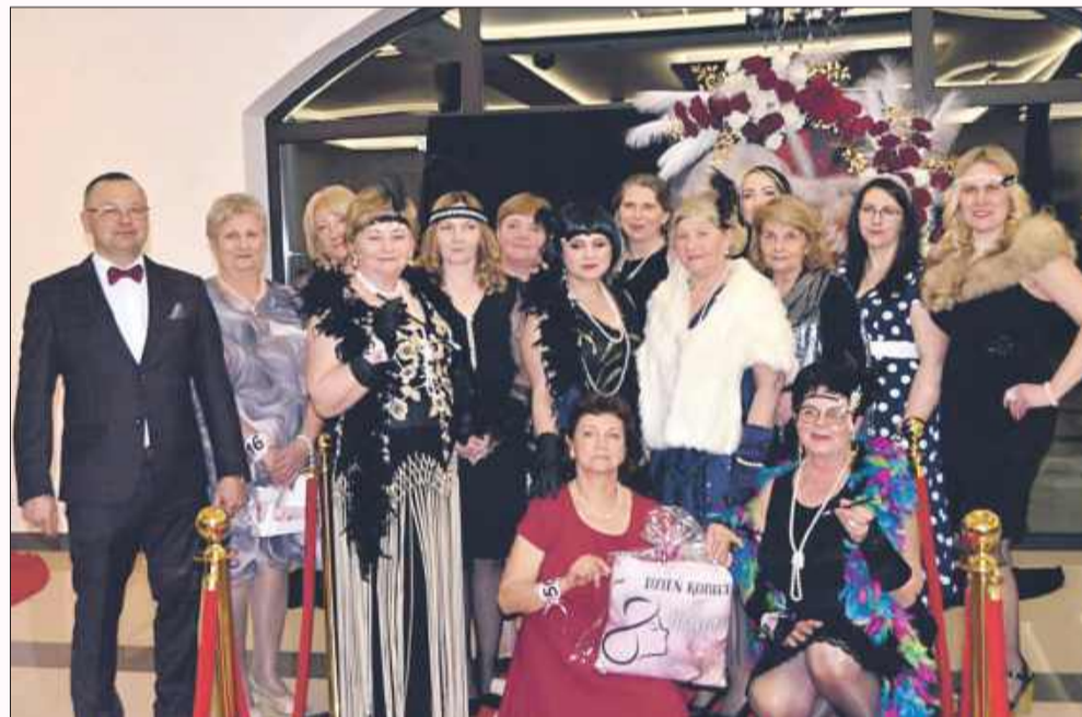
Styl, szyk i dobra zabawa na Dzień Kobiet.