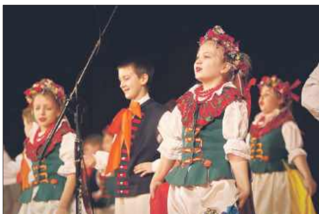
Grupa dziecięca podczas występu.