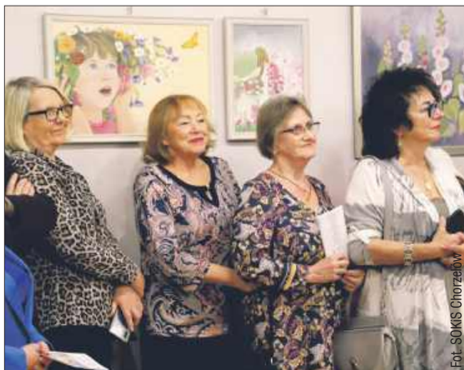
Kobiety świętują w Chorzelowie na wernisażu.