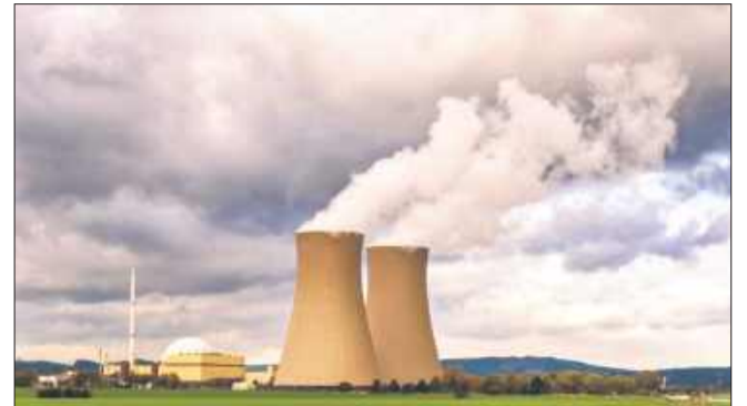
Zdjęcie poglądowe elektrowni jądrowej.

Już w 2023 r. pojawiały się głosy o możliwej lokalizacji w Połaniu. Mieszkańcy podkreślali wtedy, że byłby to impuls dla regionu. - Elektrownia atomowa mogłaby zatrzymać w Połaniu ludzi młodych, ponieważ teraz to jest miasto emerytów, młodzież wyjeżdża za pracą do dużych miast. Czego tu się obawiać? Nowoczesne technologie są bezpieczne, a my możemy mieć z takiej elektrowni tylko