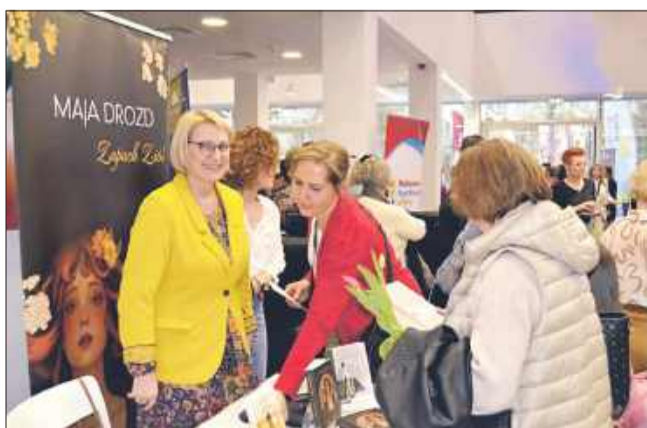
W Mieleckiej Strefie Kobiet również coś dla ducha.