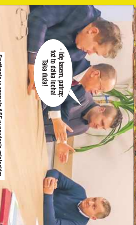
Spotkanie w sprawie ASF w powiecie mieleckim.