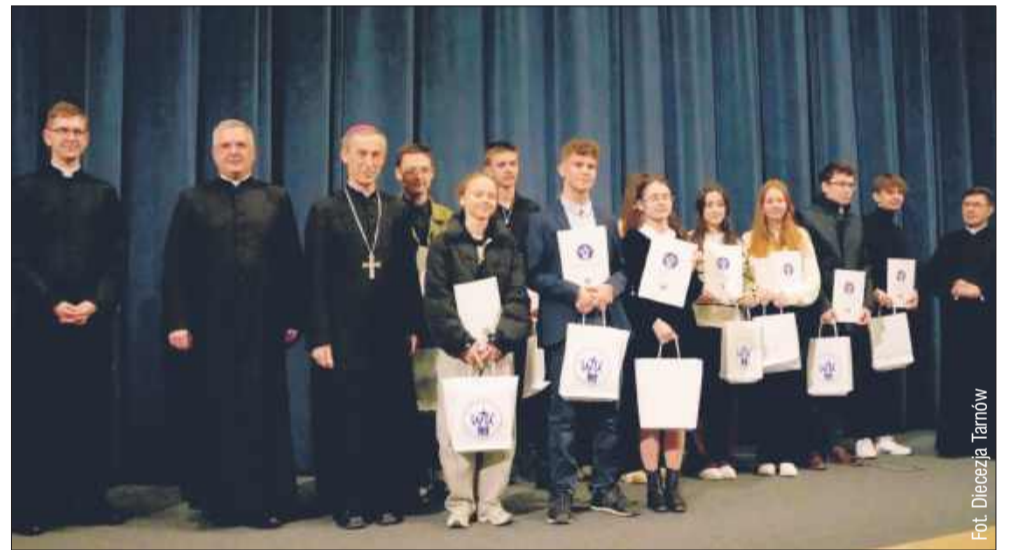
W rywalizacji wzięło udział 82 uczestników z 45 szkół z całej diecezji tarnowskiej.