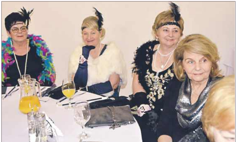
Dzień Kobiet w Gminie Gawłuszowice.