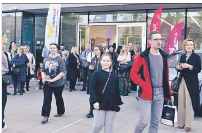
Miasto Mielec zachęciło kobiety do spędzenia niedzieli nieco inaczej.