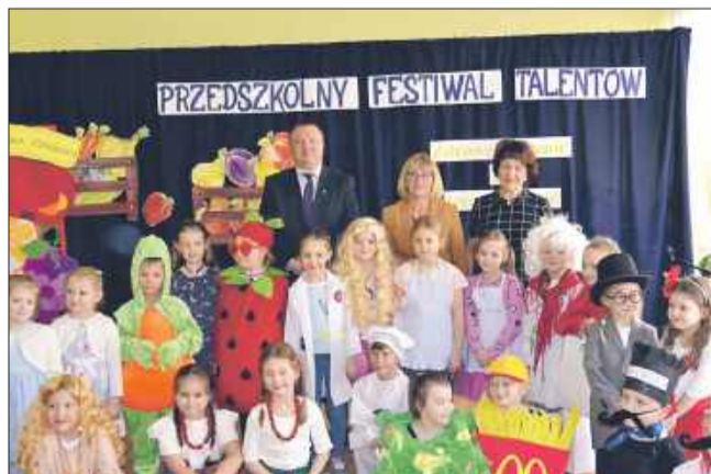
Uczestnicy Festiwalu Talentów w PM nr 8 w Mielcu.