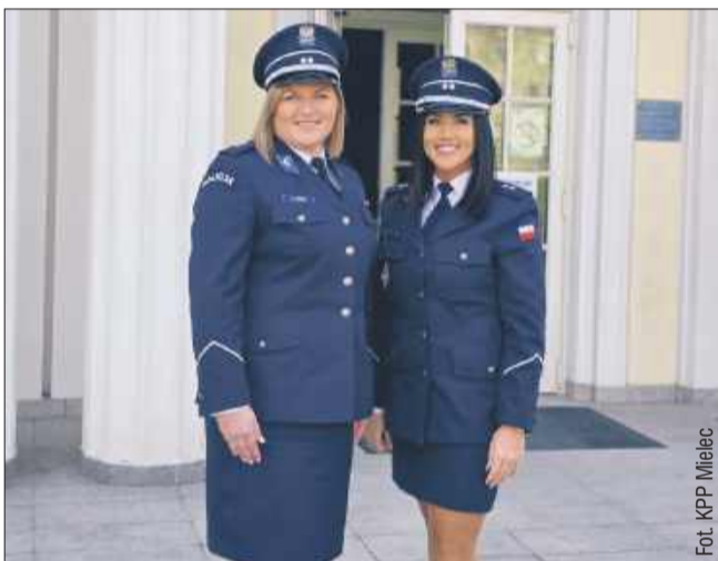
W codziennej pracy mieleckiej policji kobiety ogrywiają olbrzymią rolę.