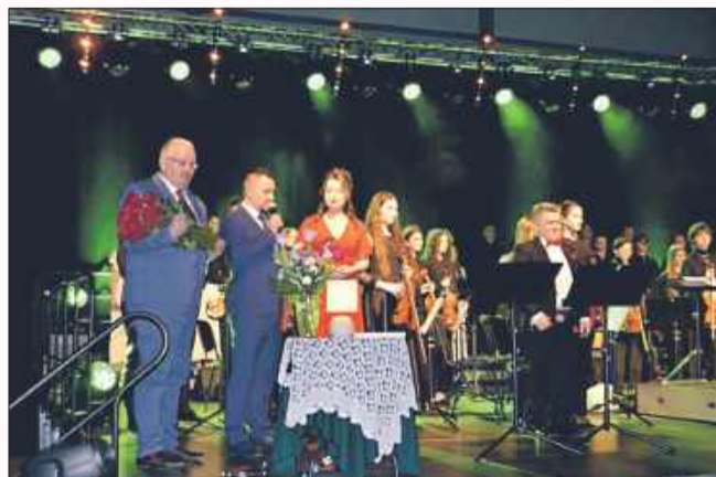
Czerwone róże i życzenia z okazji Dnia Kobiet od wójt.