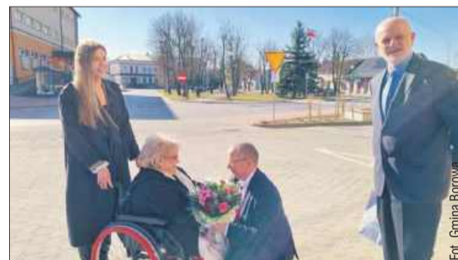
Pierwsza mieszkanka, która skorzysta z windy w Borowej.