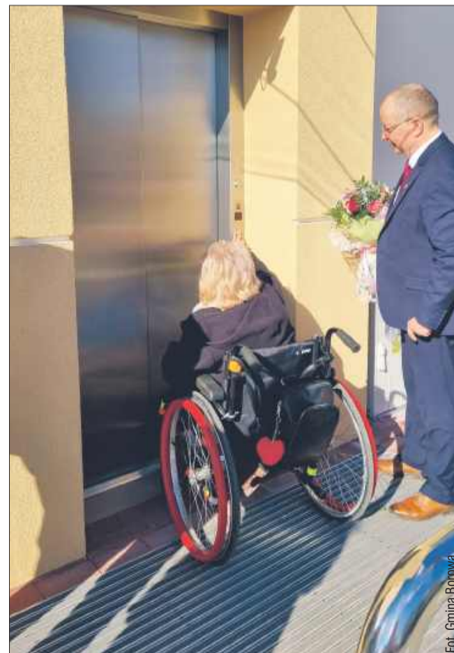
Winda przy Urzędzie Gminy w Borowej już działa.