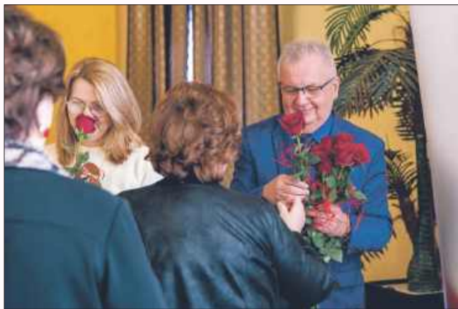
Kwiaty dla Pań w dniu ich święta.