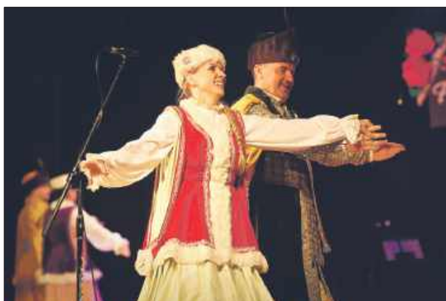
Uśmiechy nie schodziły z twarzy artystów.