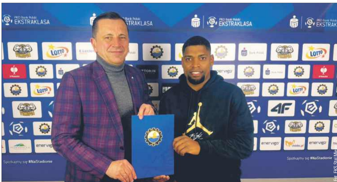
Nowy zawodnik w FKS Stali Mielec.