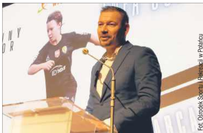
Enea Elektrownia Połaniec oraz Ośrodek Sportu i Rekreacji w Połańcu będą kontynuować projekt „Aktywny Junior. ENEA CUP 2025”.

Wsparcie Enei Elektrowni Połaniec w realizacji tego projektu ma kluczowe znaczenie dla całej