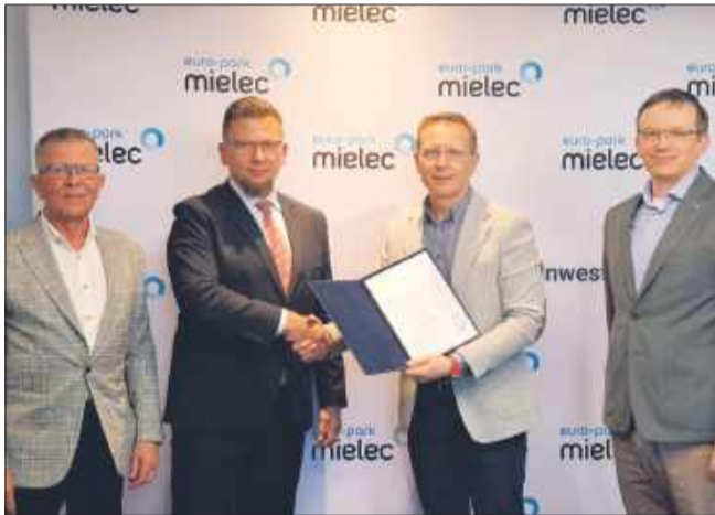
Kirchhoff Polska sp. z o.o. otrzymał Decyzję o Wsparciu w ramach Polskiej Strefy Inwestycji.

Firma Kirchhoff Polska jest cenionym producentem w bran-