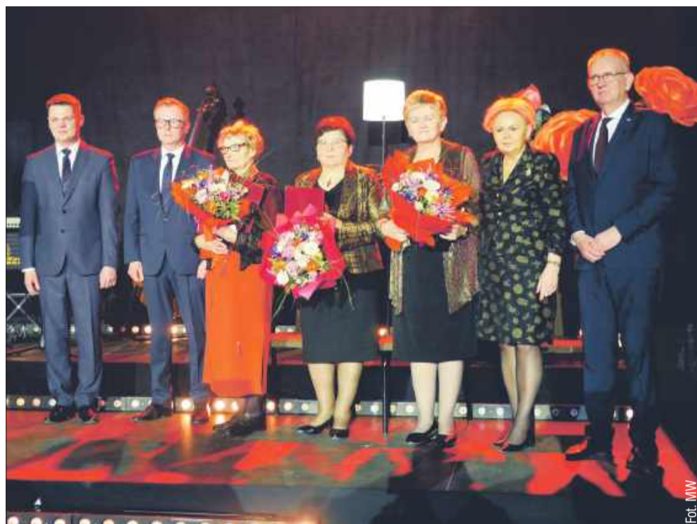
Wyjątkowe kobiety, wyjątkowy wieczór.

- Bez niej kultura w naszej gminie nie byłaby taka sama – zaznaczył wójt, przypominając jej wieloletnią działalność w kapeli „Wadowiaczy”, a obecnie „Swojacy”, jak również zaangażowanie w szkolenie młodych talentów. - Koncertowała pani wszędzie, od scen małych i dużych, uczyła pani wielu adeptów folkloru, ale też organizowała szereg wydarzeń kulturalnych.