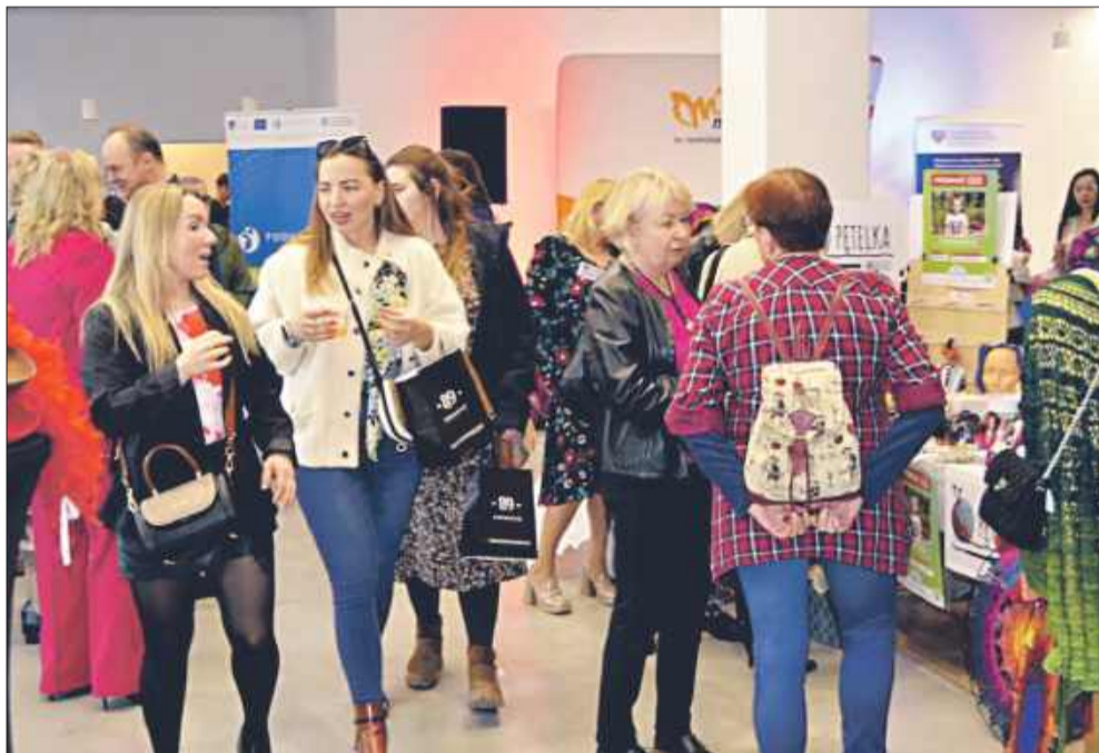
Tłumy kobiet w mieleckiej bibliotece.