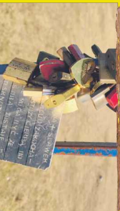
Kłódka na Wistocie przejdzie generalny remont. Co stanie się z kłódkami zakochanych?