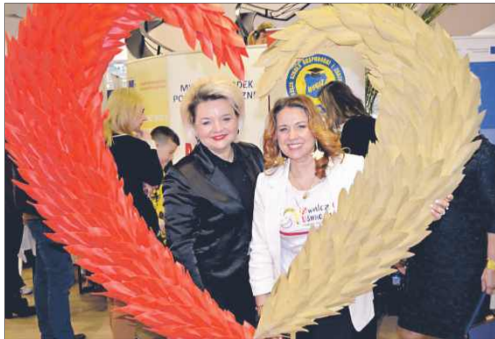
Mielecka Strefa Kobiet z Fundacją Zwalczyć go uśmiechem.