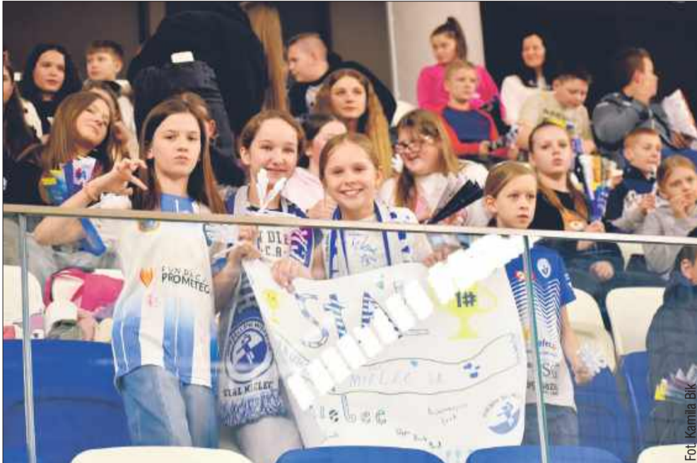
Na trybunach ponad tysiąc kibiców.

Handball Stal Mielec po trudnym i pełnym emocji meczu pokonała Siódmkę Miedź Huras Legnica 26:23 (14:13).