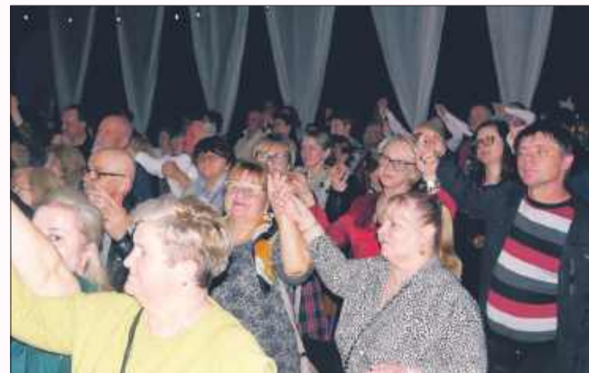
Publiczność w Radomyślu świetnie się bawiła.

Miniony weekend w powiecie mieleckim upłynął pod znakiem wyjątkowych wydarzeń, zorganizowanych z okazji Dnia Kobiet. Odbyły się kameralne występy muzyczne, kreatywne warsztaty i relaksujące seanse – każdy mógł znaleźć coś dla siebie. Nie zabrakło dobrej zabawy, uśmiechów i milej atmosfery, które sprawiły, że ten weekend na długo pozostanie w pamięci uczestników.