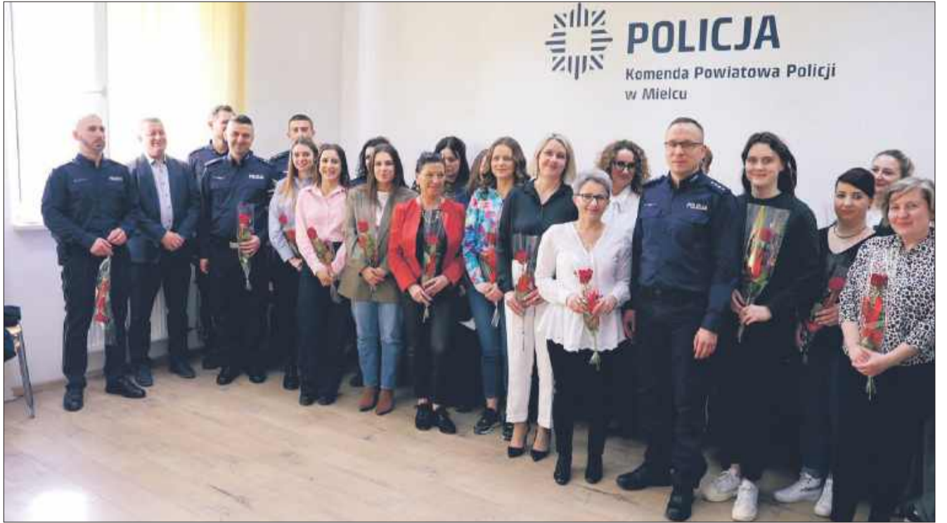
W sali odpraw mieleckiej komendy zebrały się panie pracujące w różnych pionach policji.