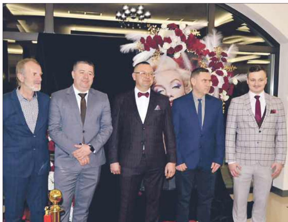
Panowie gotowi do życzeń.