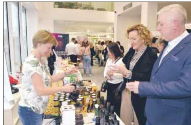
Smakowita i zdrowa herbatka.