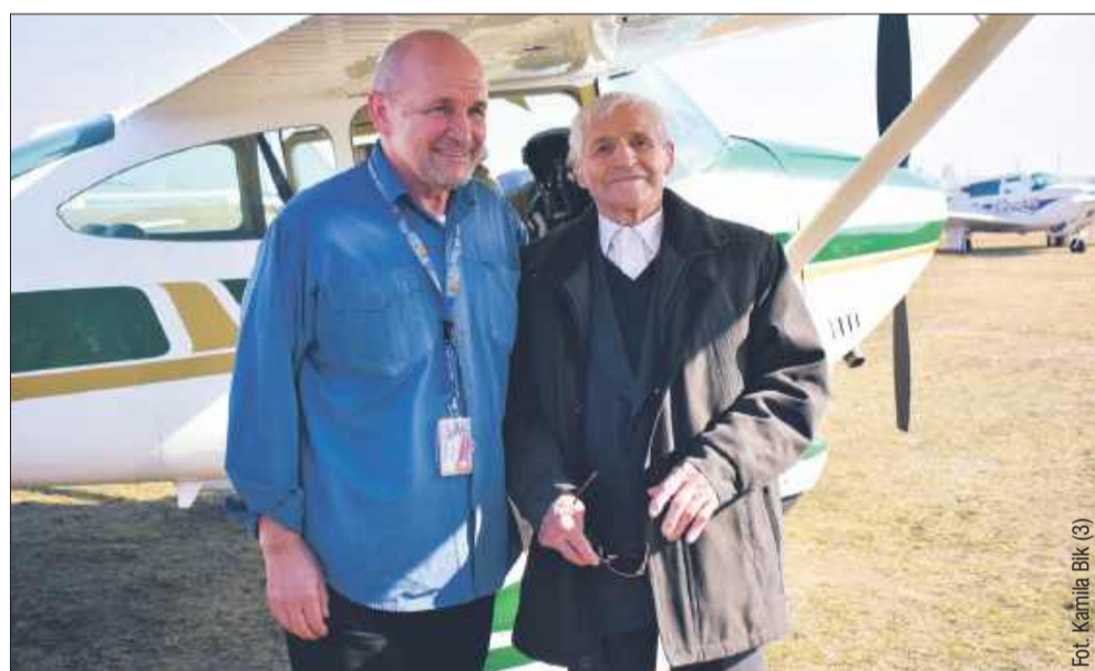
Pan Jan wraz z pilotem.