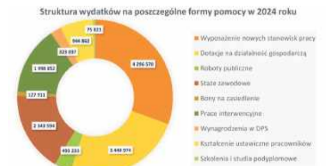
Wykres pokazujący formy wsparcia w PUP w 2024.

Mimo niewielkiego wzrostu liczby bezrobotnych o 58 osób