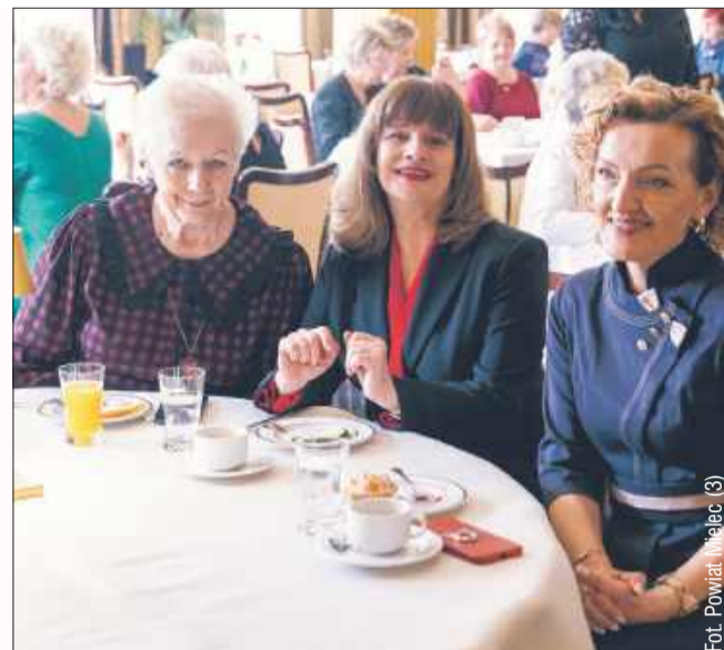
Dzień Kobiet z kobietami w Iskierce.

Panie z organizacji pozarządowych świętowały 7 marca Międzynarodowy Dzień Kobiet w Mielcu. Powiat Mielecki był organizatorem tej wspaniałej uroczystości.