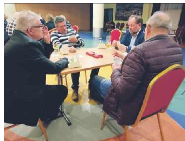
Mielczanie brali udział w rozgrywkach ze zmiennym szczęściem.