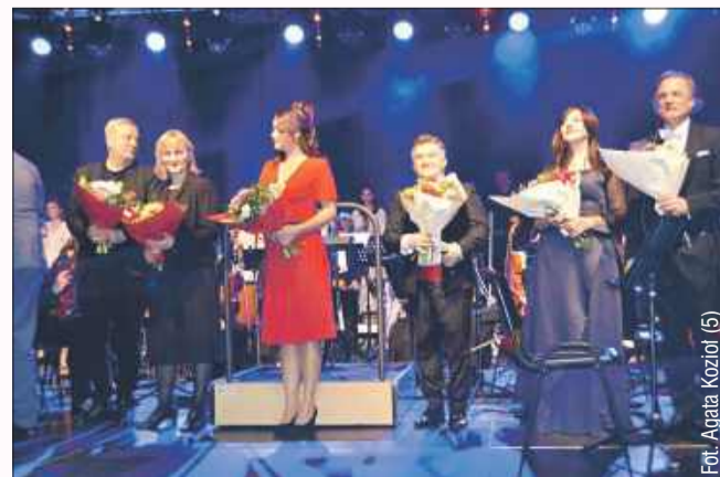
Kwiaty nie tylko dla kobiet