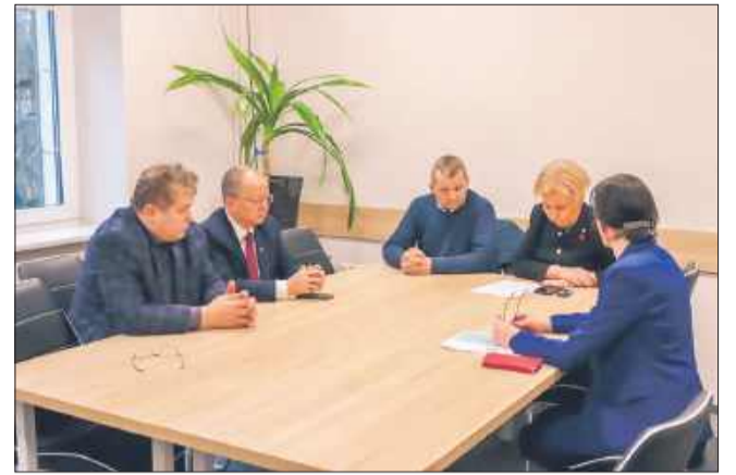
W Powiatowym Inspektoracie Weterynarii w Mielcu odbyło się spotkanie z inicjatywy poseł Krystyny Skowrońskiej.

Posel Krystyna Skowrońska zadeklarowała wsparcie dla