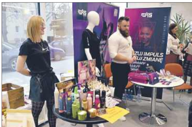
Kobiety lubią pachnieć.