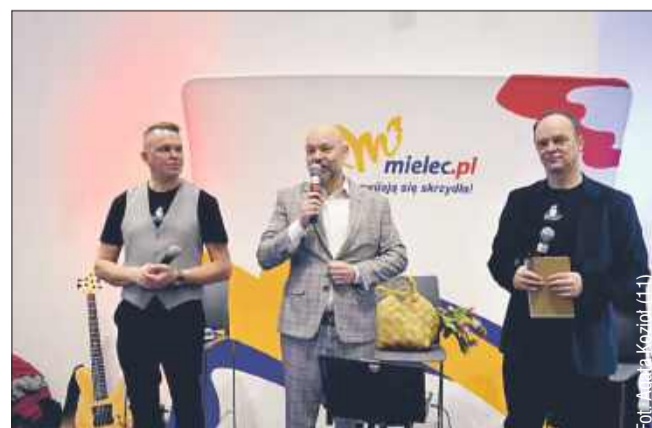
Prezydent Mielca złożył wszystkim Paniom życzenia z okazji Dnia Kobiet.