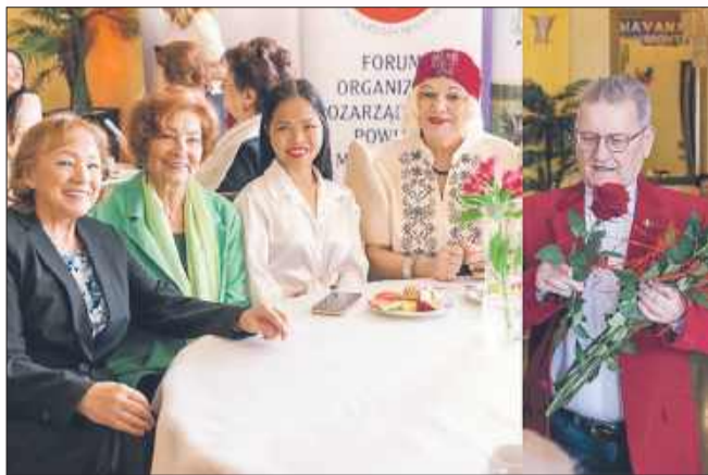
Powiat Mielecki także zadbał o Panie.