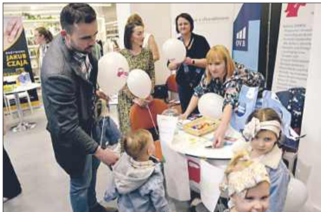
Najmłodsi też skorzystali z konsultacji