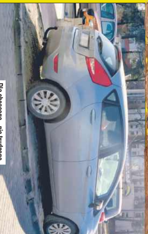
Dla chcącego - nic trudnego.