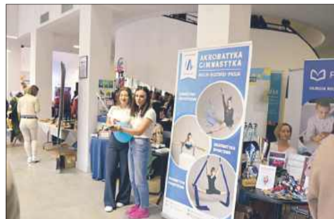
Coś dla zdrowia i dobrego samopoczucia- Akrobatyka Mielec.