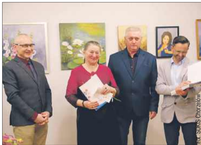
Kobieca perspektywa i Dzień Kobiet w Chorzelowie.