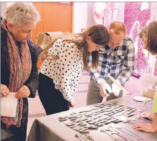
To była chwila wytchnienia, przyjemności, relaksu i dobrego kina.

Marcowa edycja KINO KOBIETY I PIĘKNA SEKRETY w przeddzień Dnia Kobiet przyciągnęła sporą grupę zainteresowanych mieleczanek. Miała być chwila wytchnienia, przyjemności, relaksu i dobrego kina i... była.