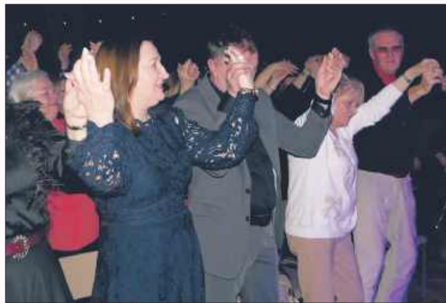
Zespół Wawele porwał publiczność.