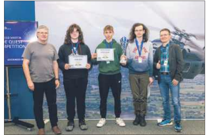
Code Quest to międzynarodowy konkurs.

Po raz siódmy w Polsce odbyła się krajowa edycja prestiżowego konkursu programistycznego Code Quest, organizowanego przez Lockheed Martin i PZL Mielec. Wydarzenie przyciągnęło utalentowanych uczniów szkół średnich z południowo-wschodniej Polski, którzy zmierzyli się w wymagających zadaniach programistycznych.