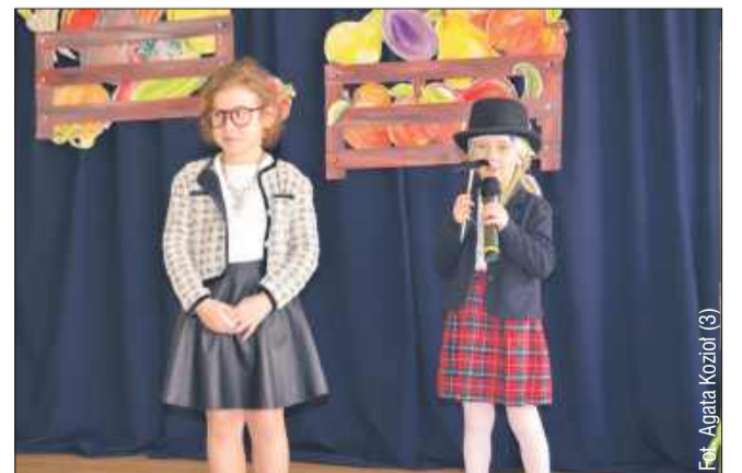
Wspaniała gra małych aktorek na Festiwalu.