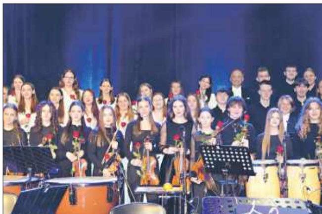
Państwowa Szkoła Muzyczna na koncercie.