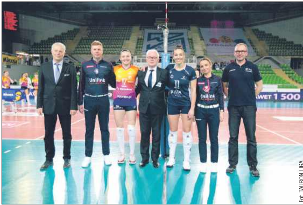
Przed ITA TOOLS Stal Mielec ostatni mecz fazy zasadniczej.

Siatkarki ITA TOOLS Stal Mielec walczyły do samego końca, jednak w pięciosetowym thrillerze musiały uznać wyższość Metalakas Pałacu Bydgoszcz. Po emocjonującym meczu to bydgoszczanki cieszyły się z awansu do play-off, wygrywając 3:2. Mielczanki wciąż mają szansę na awans, ale o wszystkim zdecyduje ostatnia kolejka!