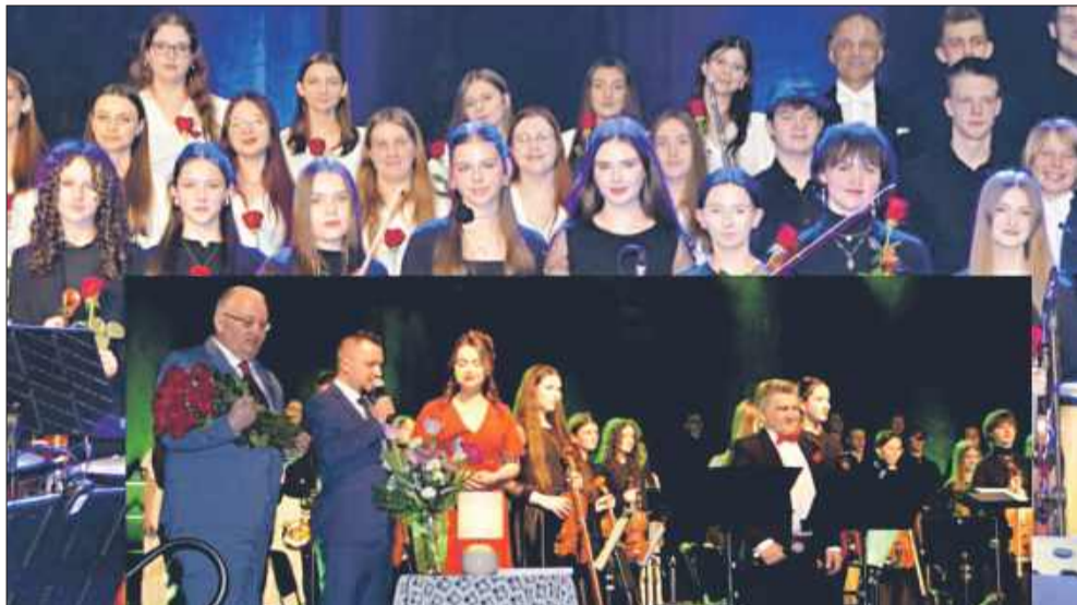
Dzień Kobiet w Czerminie