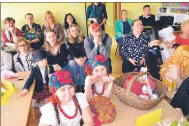
Przedszkolny Festiwal Talentów.