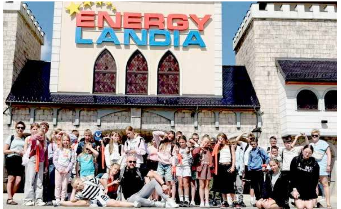
Nie zabrakło wizyty w Energylandii

Piąty dzień przyniósł emocje w Energylandii. Kolejki, rollercoastery, strefa wodna na długo pozostaną w pamięci. Szóstego dnia zaplanowany był już powrót do domu. Nie oznaczało to, że zabrakło ciekawych planów. Najpierw grupa zatrzymała się na Mszy Świętej w przepięknej, zabytkowej kolegiacie w Pilicy. Później czekał wspólny obiad i zwiedzanie imponującego zamku w Ogrodzieńcu. To tam kręcono sceny m.in. do filmu „Zemsta”.