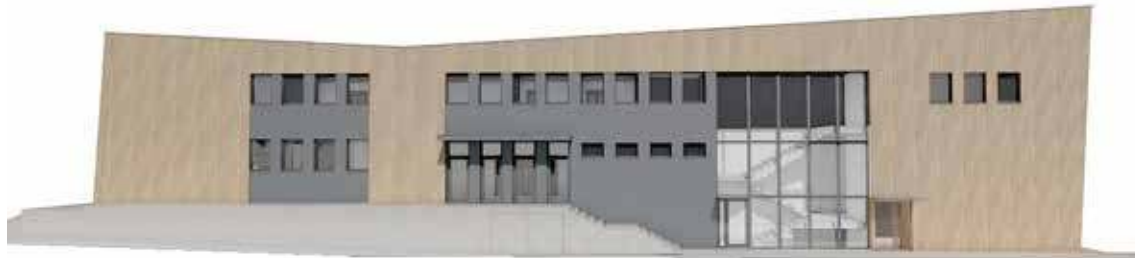
Widok NDK po przebudowie

Zachodniego - Inwestycja finansowana z Programu: IIT Powiatu Goleniowskiego/FEPZ 7.2 Rozwój obszarów innych niż miejskie (IIT - finansowanie załatwione jeszcze przez burmistrza Czapłę).