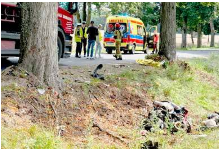
Siła uderzenia spowodowała, że skuter wpadł do rowu.

Jak z kolei podała pracownik biura WSPR w Szczecinie w zastępstwie rzecznika prasowego, ok godz. 11:35 wezwanie do wypadku komunikacyjnego droga Wierzbicin- Dobra. Na miejsce zadysponowano w sumie dwa ZRM oraz śmigłowiec LPR. Na miejscu zastano: kobietę, lat ok. 78 z urazem wielonarządowym, pomimo podjętej resuscytacji nastąpił zgon pacjentki; mężczyznę, lat ok. 72 z urazem wielonarządowym, nastąpiło u niego nagle zatrzymanie krążenia, ale po podjęciu resuscytacji