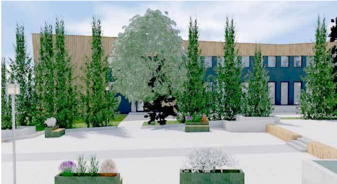
Widok od strony Miejskiej Biblioteki Publicznej

Dlatego też jeszcze w lipcu zostało ogłoszone trzecie postępowanie na znalezienie wykonawcy robót wraz z projektem