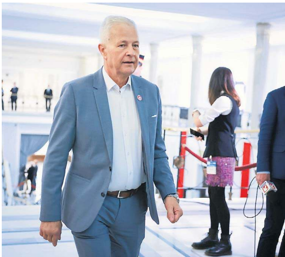
Apoloniusz Tajner najprawdopodobniej zastąpi w fotelu prezesa PZN Adama Małysza

Co się zatem takiego wydarzyło, że miesiąc później zasadniczo zmieniliście zdanie? Nic szczególnego. Być może Adam przemyślał, jaką decyzję podjąć odnośnie kolejnych