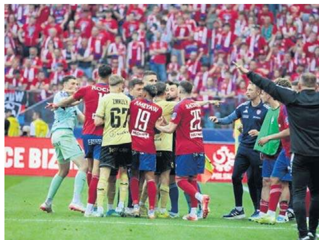
W końcówce spotkania na murawie doszło do awantury

Górniki po raz ostatni grał w finale w 2001 roku, a zdobył Puchar w 1972. Związaną z tym