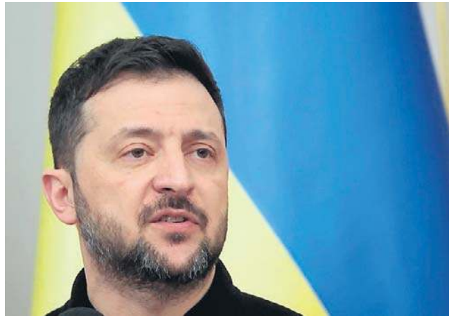
Wołodymyr Zełenski opublikował nagranie pokazujące moment ataku na dwa statki rosyjskiej „floty cieni”

Drozdenko napisał na Telegramie, że w nocy z soboty na niedzielę nad obwodem leningradzkim strącono ponad 60 dronów. PAP