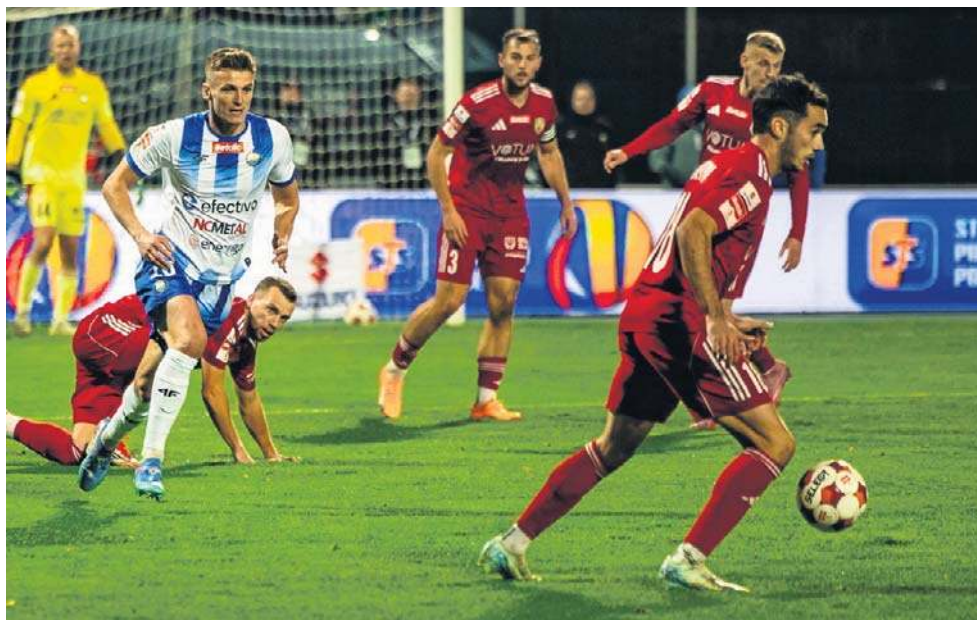
Stal miała swoje sytuacje w Legnicy, ale ich nie wykorzystała - Miedź była konkretniejsza

Początek spotkania w Legnicy przebiegał pod dyktando gości, którzy często utrzymywali się przy piłce na połowie Miedzi. Dobry początek spuentował