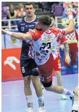
Mielczanie (na niebiesko) zagrają już tylko o 7. miejsce

Stal dobrze zaczęła i po kilku minutach prowadziła 3:1. Chwilę później miejscowi doprowadzili do remisu. Po następnych pięciu minutach Chrobry był już na prowadzeniu. Podopieczni Roberta Lisa dość szybko doprowadzili po-