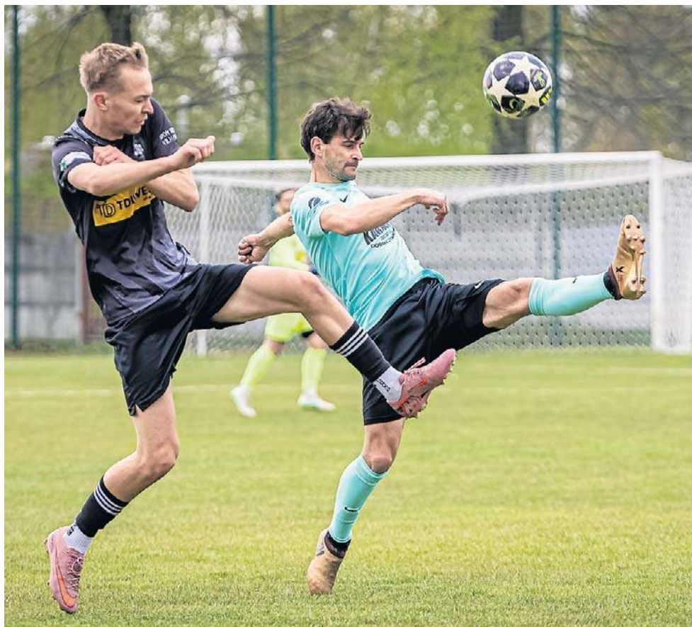
Piłkarze Orła Wólka Niedźwiedzka (na czarno) wywieźli komplet punktów z Zaczernia i cały czas są w grze o miejsce drugie dające udział w barażu o 4. ligę