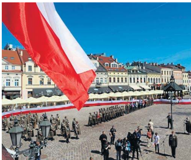
2 maja, Rynek w Rzeszowie: uroczystości, z udziałem Wojska Polskiego, z okazji Święta Flagi

W generalnej klasyfikacji Rzeszów, zdobywając 68,3 pkt, uplasował się na drugiej pozycji w kategorii miejszych miast grodzkich. Na pierwszym miejscu Sopot (71,0 pkt), na trzecim Świnoujście (66,2 pkt).