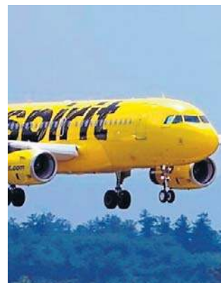
Linie Spirit nie wytrzymały rosnących cen paliw

Upadek Spirit z dnia na dzień uwypukla konsekwencje wojny USA-Izrael z Iranem. Podczas gdy Spirit już przed szokiem paliwowym zmagał się z problemami, globalni przewoźnicy także walczą