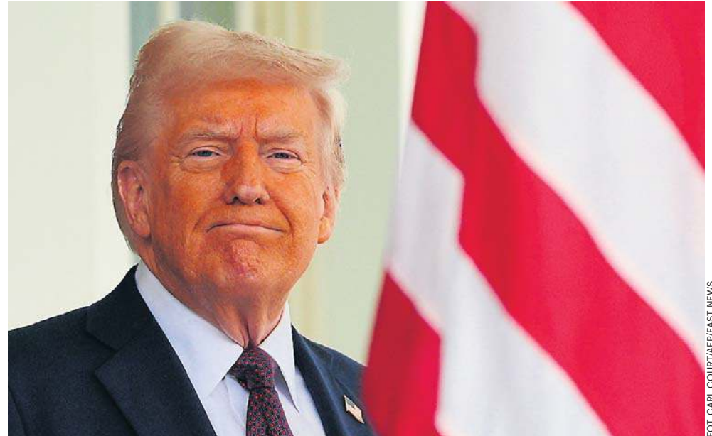
W piątek Trump mówił, że choć Iran poczynił „wielkie kroki” i chce porozumienia, to nie jest usatysfakcjonowany jego propozycjami. Oceniał, że może nie dojść do porozumienia

Irańskie media podały, że 14-punktowa propozycja Teheranu obejmowała wycofanie sił amerykańskich z obszarów otaczających Iran, zniesienie blokady, uwolnienie zamrożonych aktywów Iranu, wypłatę odszkodowań, zniesienie sankcji i zakończenie wojny na wszystkich frontach, w tym w Libanie,