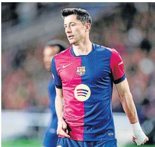
Lewandowski będzie rozmawiał o swojej przyszłości dopiero wtedy, gdy Barca zapewni sobie mistrzostwo

Mistrzostwo Portugalii po kolejnej skromnej wygranej zapewniło sobie FC Porto. „Smoki” wygrały u siebie z niżej notowaną Alvercą (1:0) po голу polskiego obrońcy Jana Bednarka, który przesądził o 31. tytule w bogatej