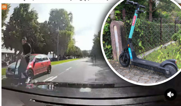
Tak się tepek wozi hulajnogą po ulicy