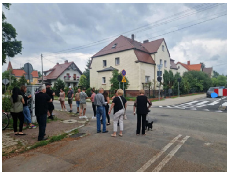
Spotkanie mieszkańców ulicy Wileńskiej.