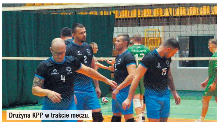
Drużyna KPP w trakcie meczu.