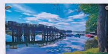
„Most nad wodą”

Najwięcej zgłoszeń napłynęło od dorosłych. Zdjęcia były bardzo różnorodne, ale wszystkie spaja element nieba.