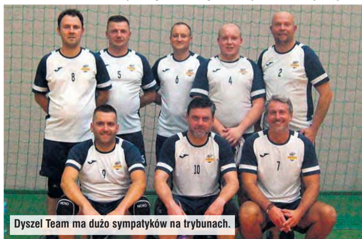
Dyszel Team ma dużo sympatyków na trybunach.

niem w grze policjantów. Walka trwała w każdej akcji, choć w końcówce szczęście sprzyjało lepszym, ponieważ zwycięzcy tej części meczu okazali się triumfatorami w pozostałych setach. W dwóch kolejnych Tucholanka trzymała bezpieczny dystans punktowy, który pozwolił kontrolować grę od pierwszej do ostatniej akcji.