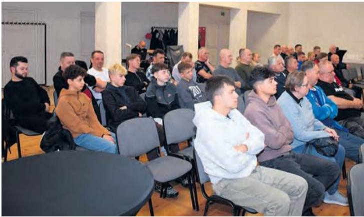
W spotkaniu z wieloletnim, utytułowanym dziennikarzem sportowym uczestniczyli m.in. młodzi zawodnicy Victorii Śliwice.