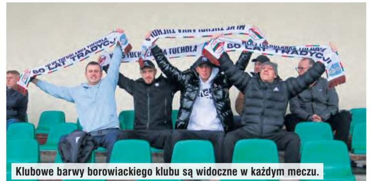
Klubowe barwy borowiackiego klubu są widoczne w każdym meczu.