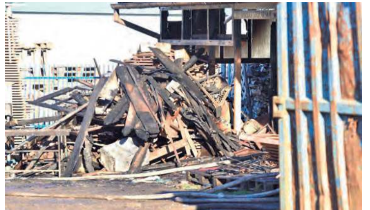
Opróżnione wnętrze stolarni.