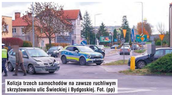
Kolizja trzech samochodów na zawsze ruchliwym skrzyżowaniu ulic Świeckiej i Bydgoskiej.