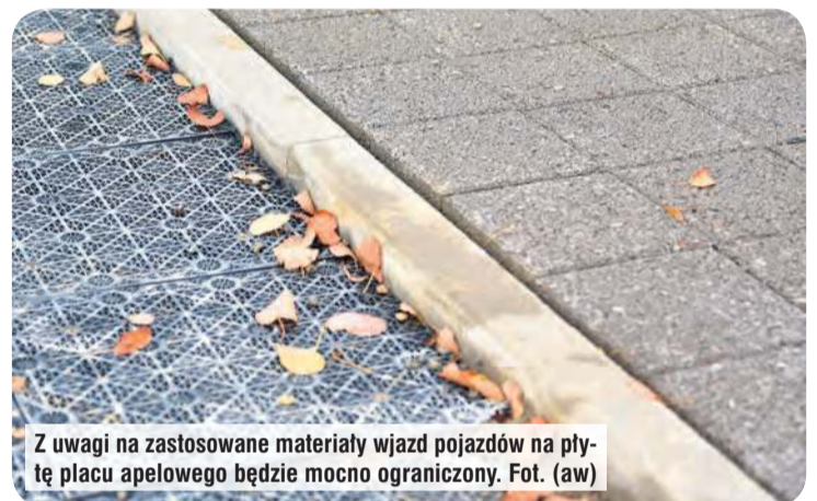
Z uwagi na zastosowane materiały wjazd pojazdów na płytę placu apelowego będzie mocno ograniczony.

– Trzeba było zdjąć cały asfalt wraz z podbudową. War-