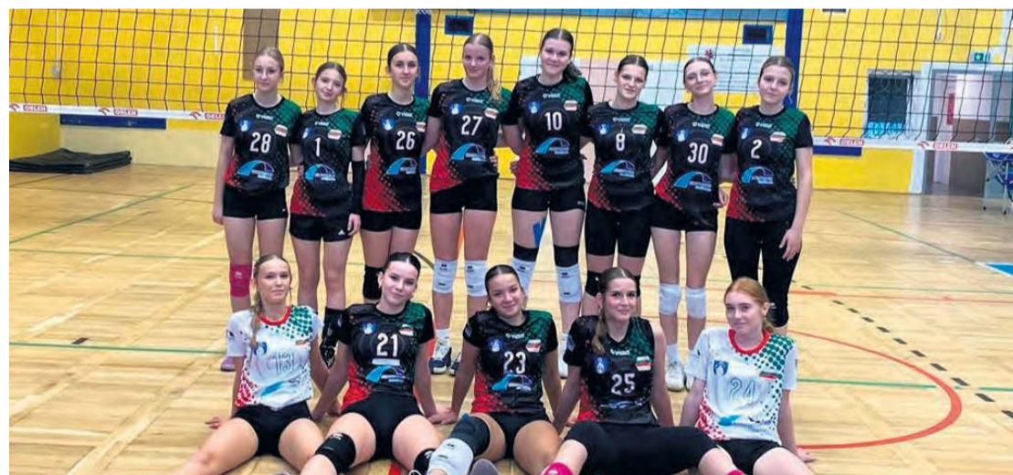
Zespół junierek po meczu z Pałacem. To był pojedynek pełen walki szczególnie w trzecim secie.

Juniorki Tucholanki zajmują trzecie miejsce w tabeli ligi wojewódzkiej liczącej sześć zespołów. Jarosław Kania