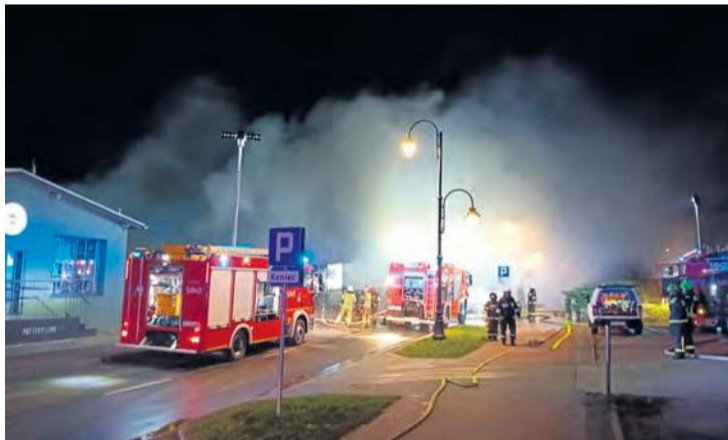
Głęboki dym przez długie godziny spowijał okolicę.