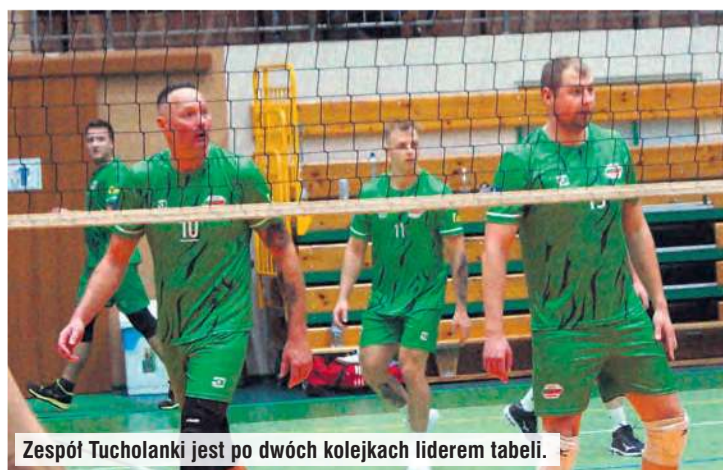
Zespół Tucholanki jest po dwóch kolejkach liderem tabeli.

Jarosław Kania, fot. profil FB Tucholskiej Ligi Siatkówki