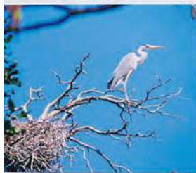
„Czapla biała w starym lesie”