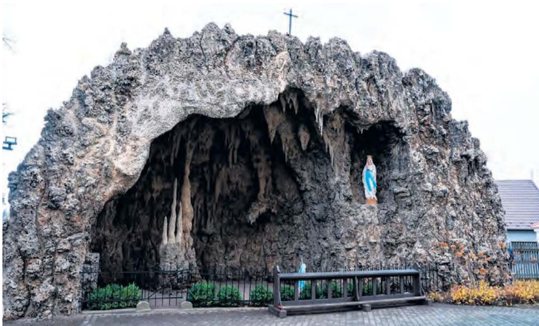
Grotka Najświętszej Marii Panny z Lourdes w Śliwicach została wybudowana w pierwszej dekadzie XX wieku.