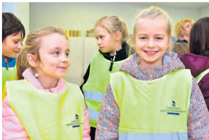
Uczniowie dosłownie świecili dobrym przykładem. Drogę do i z miejsca spotkania przebyli w odblaskowych kamizelkach.