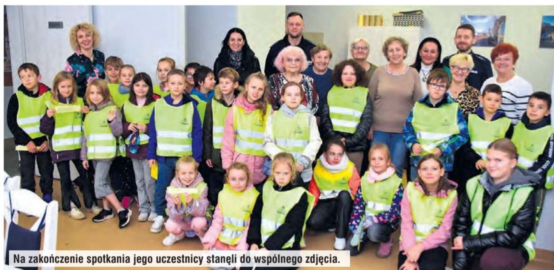
Na zakończenie spotkania jego uczestnicy stanęli do wspólnego zdjęcia.