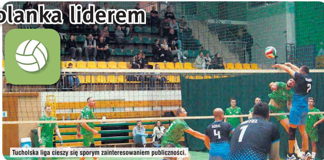
Tucholska liga cieszy się sporym zainteresowaniem publiczności.

Dyszel Team – Technikum Leśne 1:2 (27:25, 23:25, 18:25)