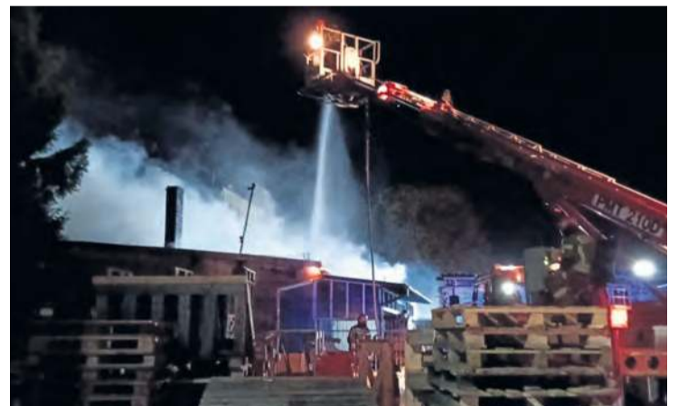
Akcja gaśnicza na ul. Chopina w Tucholi.

Strażacy mieli cały czas z tyłu głowy kamienicę, w kierunku której przemieszczały się zadymienie i wysoka temperatura. Istniało realne zagrożenie rozprze-