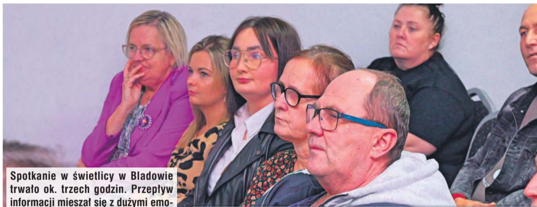
Spotkanie w świetlicy w Bładowie trwało ok. trzech godzin. Przepływy informacji mieszał się z dużymi emocjami. To nie koniec tematu farmy fotowoltaicznej w obrębie Słupów.