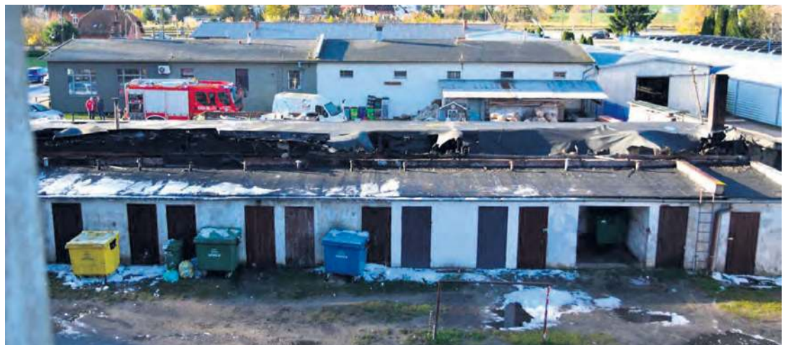
Parterowy budynek, który zajął się ogniem, należy do Gminnej Spółdzielni w Tucholi.

Poza tym dochodziło do gwałtownego rozgorzenia pożaru