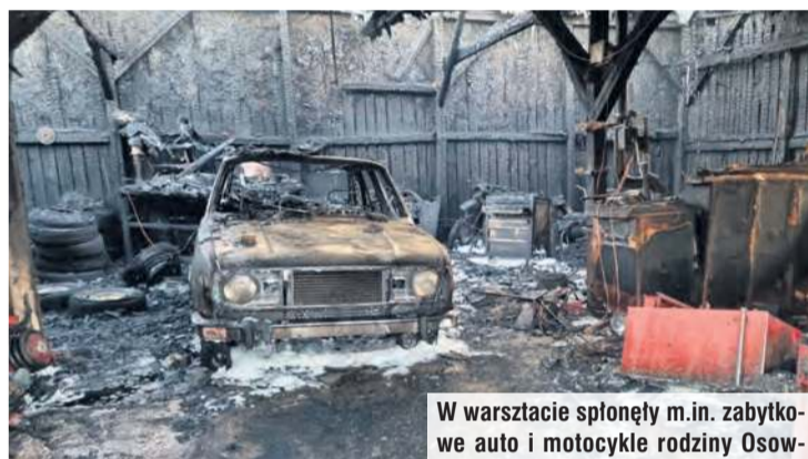
W warsztacie spłonęły m.in. zabytkowe auto i motocykle rodziny Osowskich. Uruchomili zbiórkę w internecie na portalu zrzutka.pl na odbudowę warsztatu.

Zbiórka na odbudowę warsztatu kod QR https://zrzutka.pl/gzpx5d