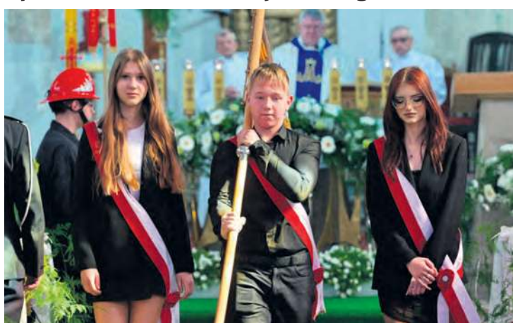
11 listopada polskie barwy ozdobią kościoły w Cekcynie. Tutaj odbędą się obchody Narodowego Święta Niepodległości.