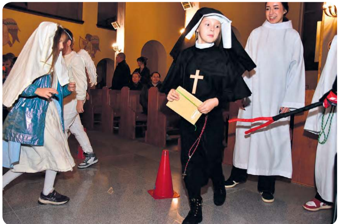
W drodze do nieba dzieci musiały pokonać liczne przeszkody.