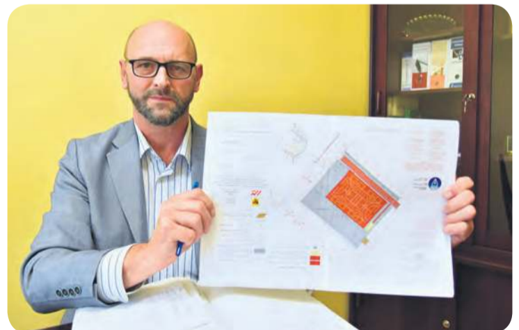
Jak podkreśla nadzorujący tucholską oświatę, inwestycja realizowana w ZSLiT należy do bardzo ważnych i otwiera drzwi kolejnym zadaniom, nastawionym na ekologię oraz zagospodarowanie wód.