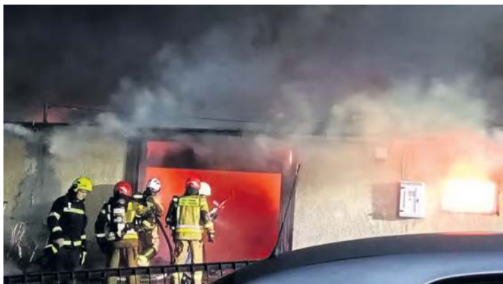
Z uwagi na specyfikę pożaru nie można było wprowadzić strażaków do środka palącego się budynku.

– W kulminacyjnym momencie akcji podano łącznie dziewięć prądów gaśniczych, w tym siedem wody i dwa piany gaśniczej. Pożar udało się opanować około godziny 5:45, co oznacza, że główna walka strażaków z ogniem trwała cztery godziny.