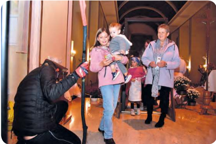
Symboliczne wrota do nieba przekraczały dzieci wraz z dorosłymi.

było stwierdzić, która to już jego edycja. Po frekwencji i reakcjach uczestników widać jednak, że wydarzenie na stałe wpisało się w kalendarz parafialnej wspólnoty.