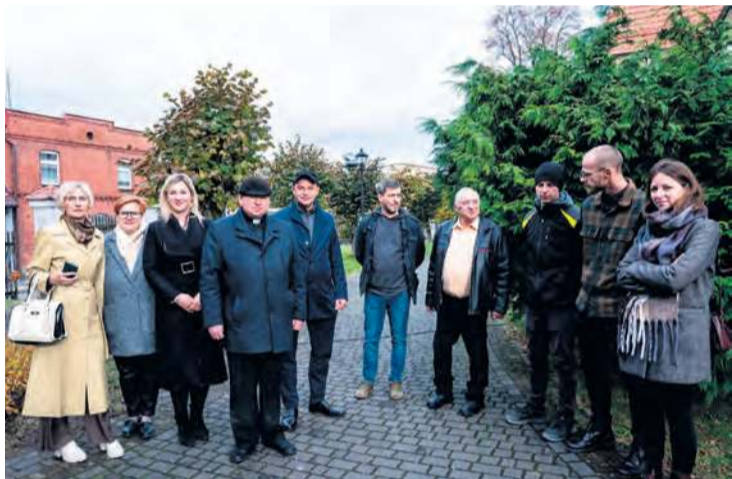
W minionym tygodniu, tj. we środę (29 października) odbył się odbiór prac konserwatorskich, restauratorskich oraz robót budowlanych przy Grocie Matki Boskiej z Lourdes w Śliwicach.

wicz oraz inspektorka z urzędu gminy Ester Gwizdała .