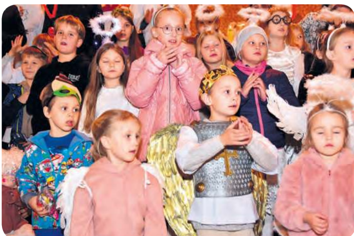
Dzieci chętnie śpiewały ze scholą „Margaretki”.