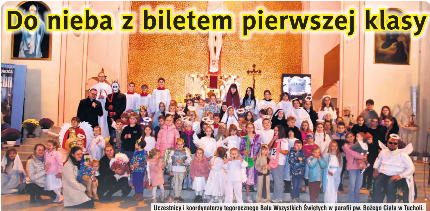
Uczestnicy i koordynatorzy tegorocznego Balu Wszystkich Świętych w parafii pw. Bożego Ciała w Tucholi.

Kolejna edycja Balu Wszystkich Świętych, którego organizacji podjęła się parafia pw. Bożego Ciała w Tucholi, przyciągnęła w mury świątyni dzieci wraz z całym rodzinami. Dobrą zabawę połączono z modlitwą.