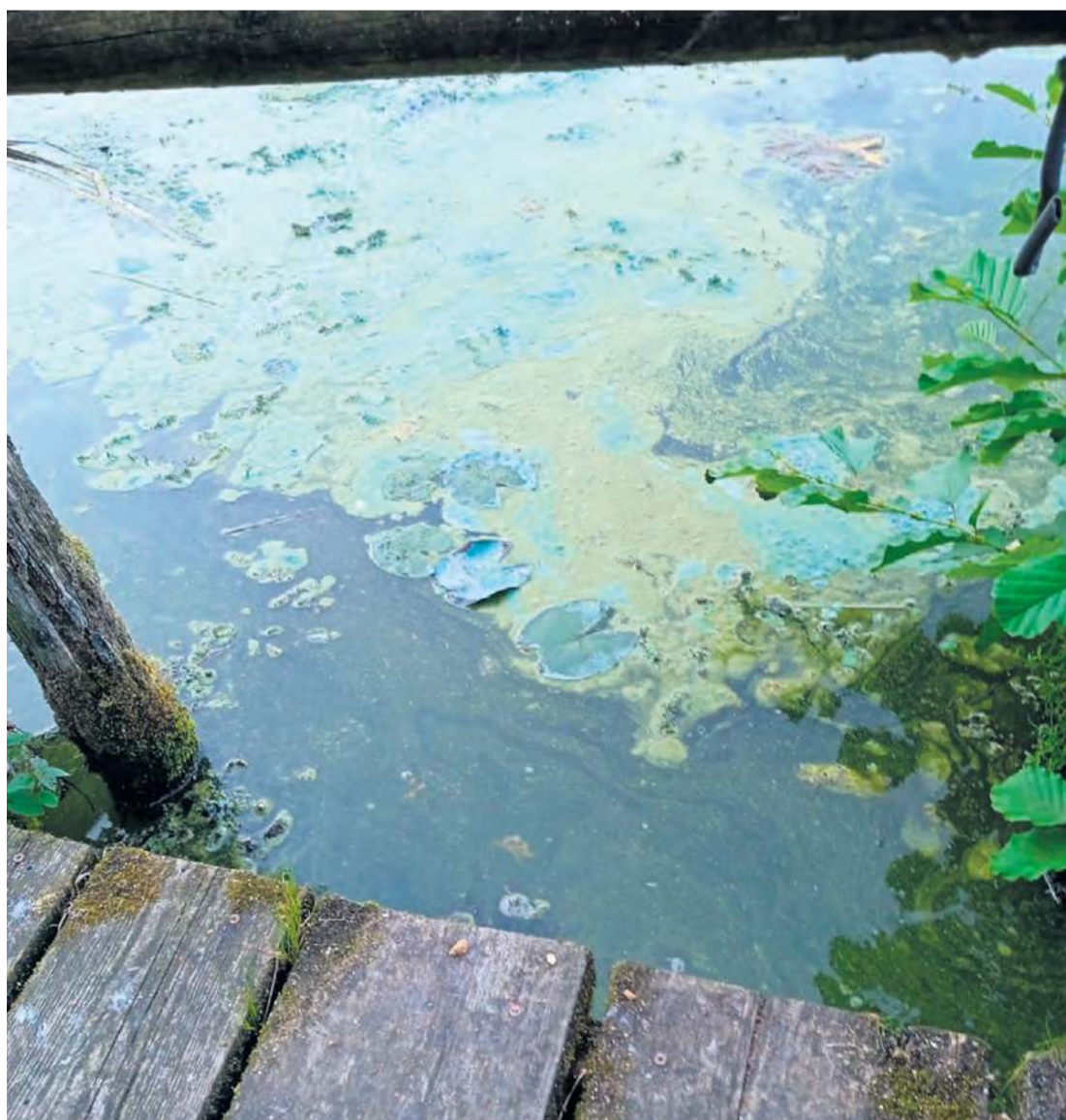
Skąd problem z wodą w Jeziorze Minikowskim? Próbujemy dowiedzieć się, czy osady są efektem naturalnych stanów w przyrodzie, czy może jednak na jakość wody w akwenu ma wpływ czynnik ludzki.

W lipcu, na prośbę mieszkańców Minikowa i wójt, sprawdzono, czy jezioro jest przepływowo. Rekonesans przeprowadziło Państwowe Gospodarstwo Wodne Wody Polskie Zarząd Zlewni w Chojnicach. Z pisma, które otrzymaliśmy, wynika, że oględziny jeziora oraz gruntów przyległych w ciągu rzeki Zamrzonki, prowadzone od 27 do 30 lipca, nie wykazały trudności w przepływie wody. Dokument uzupełniono m.in. o informację, że do zadań statutowych PGW WP ZZ Chojnice „nie należy prowadzenie badań jakości wody”. Monitoringiem oraz badaniem jakości wód powierzchniowych zajmuje się Wojewódzki Inspektorat Ochrony Środowiska.