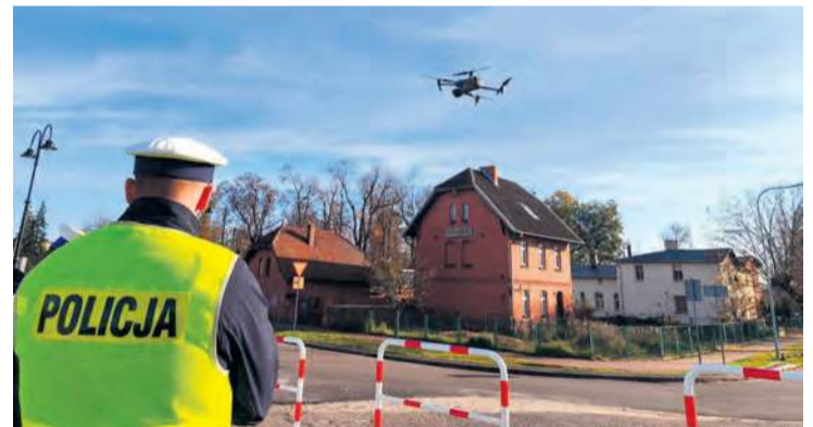
Policjanci w prowadzonych działaniach wykorzystywali również drony.