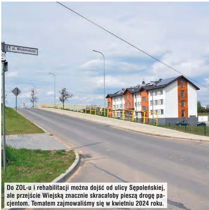
Do ZOL-u i rehabilitacji można dojść od ulicy Sępoleńskiej, ale przejście Wiejską znacznie skracaloby pieszą drogę pacjentom. Tematem zajmowaliśmy się w kwietniu 2024 roku.

– Nie chciałem być tym, który mówiąc kolokwialnie „rżnie wszystko, co popadnie”. Tym bardziej, że te drzewa dobrze wyglądają, dają cień, a i tak nie-