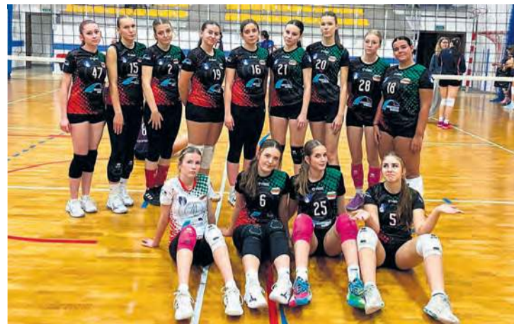
Tucholanki w Grudziądzu. Jeden mecz ze Stalą przegrały, jeden wygrały po tie-breaku.