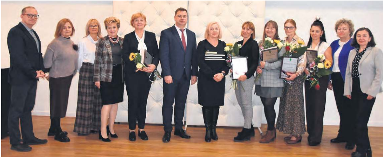
Uczestnicy uroczystości, która odbyła się z okazji Dnia Edukacji Narodowej.