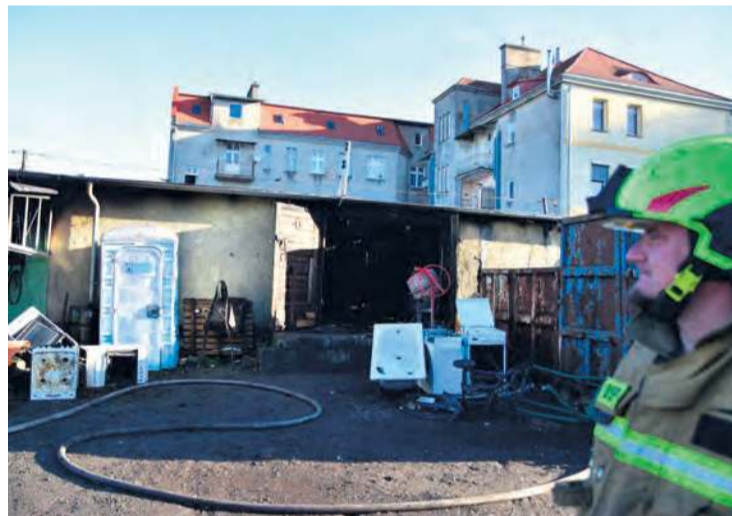
W ogniu stanął też skup złomu.

Przy artykule publikujemy kody QR i linki do obu zbiórek. Agata Wiśniewska