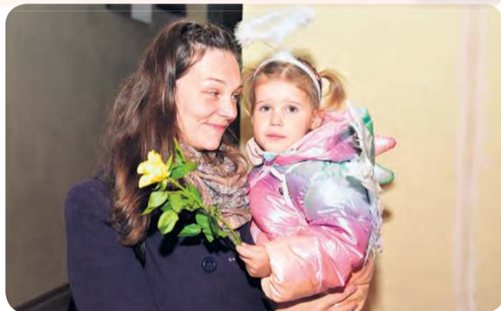
Tej anieliцы najlepiej było w objęciach mamy.