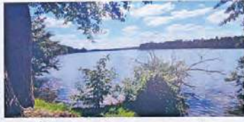
„Kamień w wodzie”