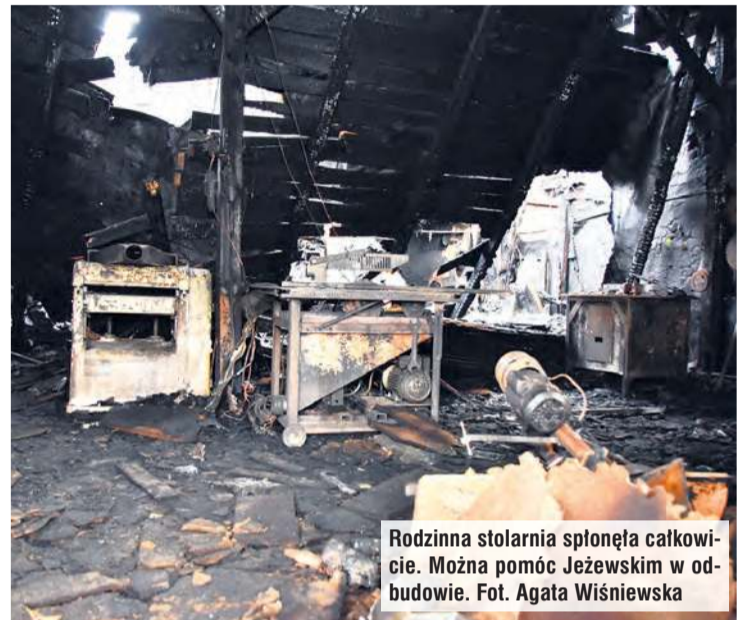
Rodzinna stolarnia spłonęła całkowicie. Można pomóc Jeżewskim w odbudowie.