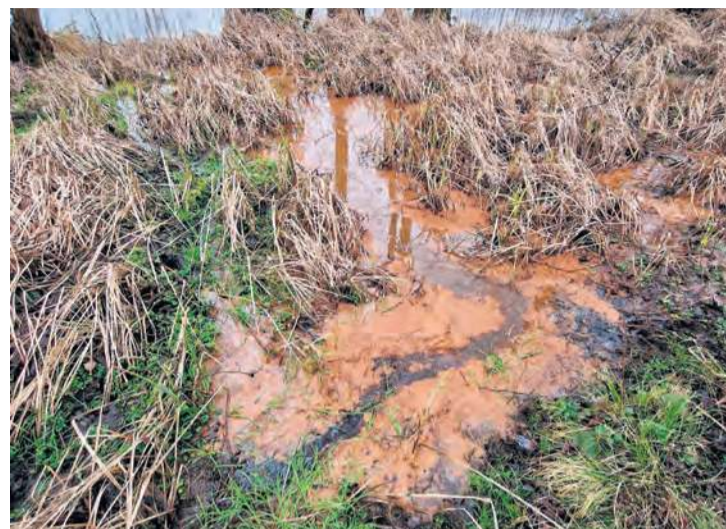
– Moim zdaniem wszystkie podnoszone przez mieszkańców Minikowa problemy można racjonalnie wytłumaczyć i są one efektem naturalnych stanów w przyrodzie – ocenia Tomasz Bonk, kierownik komunalni w Lubiewie.

O sprawę pytamy wójt. Słyszymy, że komisja rolnictwa, leśnictwa i ochrony środowiska wypracowała wnioski po tym, jak