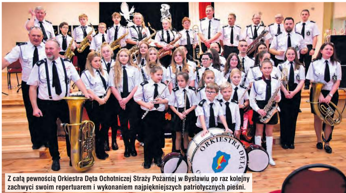
Z całą pewnością Orkiestra Dęta Ochotniczej Straży Pożarnej w Bystawiu po raz kolejny zachwyci swoim repertuarem i wykonaniem najpiękniejszych patriotycznych pieśni.