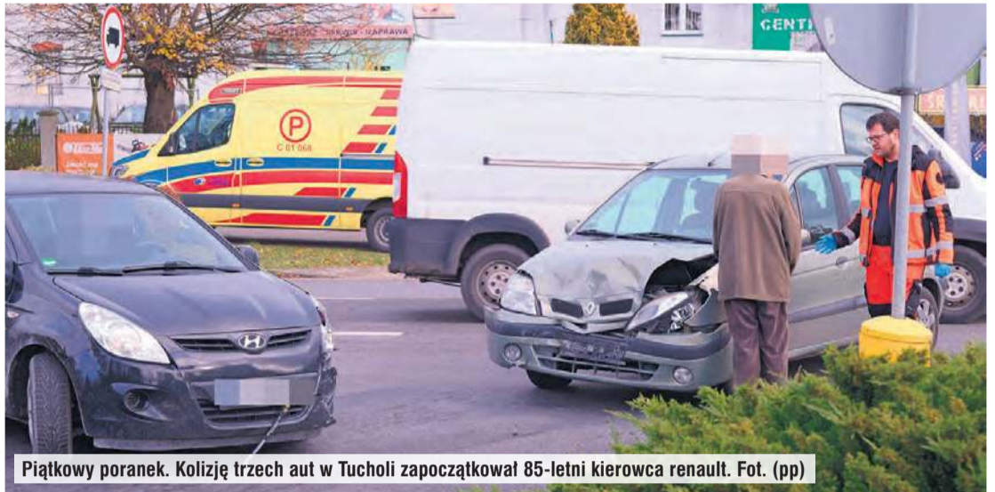
Piątkowy poranek. Kolizję trzech aut w Tucholi zapoczątkował 85-letni kierowca renault.

Ponadto 1 listopada policjanci zatrzymali w Żalnie prawo jazdy 54-letniemu kierowcy za przekroczenie dopuszczalnej prędkości w obszarze zabudowanym o 54 km/h. Mundurowi nałożyli