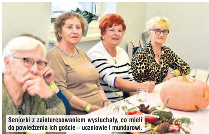
Seniorki z zainteresowaniem wysłuchały, co mieli do powiedzenia ich goście – uczniowie i mundurowi.