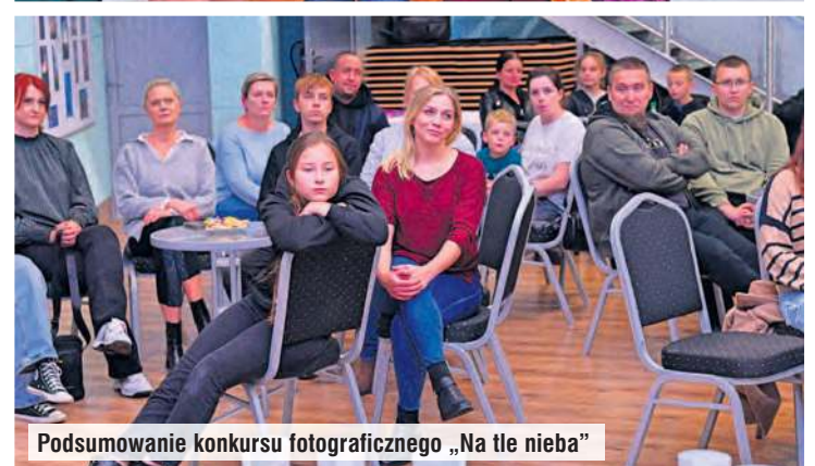
Podsumowanie konkursu fotograficznego „Na tle nieba”