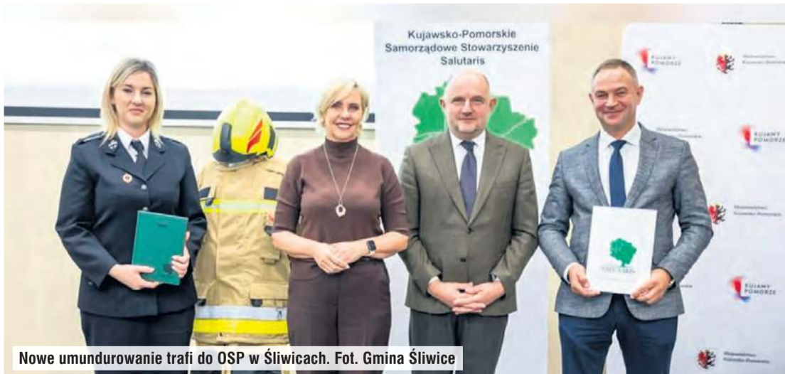
Nowe umundurowanie trafi do OSP w Śliwicach.

Gmina Śliwice została posiadaczem dwóch kompletów umundurowania specjalnego, z których druhowie Ochotniczej Straży Pożarnej w Śliwicach będą korzystać podczas akcji ratowniczo-gaśniczych.