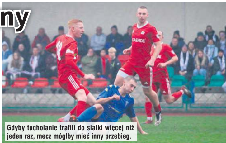
Gdyby tucholanie trafili do siatki więcej niż jeden raz, mecz mógłby mieć inny przebieg.

Nic nie zapowiadało takiej piłkarskiej burzy na tucholskim stadionie – przynajmniej do przerwy. Sądząc po samej grze, moż-