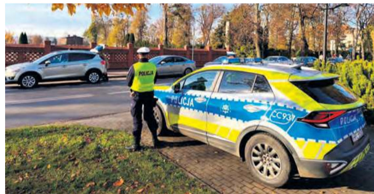
Funkcjonariuszy można było spotkać m.in. w obrębie cmentarza parafialnego w Tucholi.

Podczas minionego weekendu (31 października – 2 listopada) na drogach powiatu tucholskiego doszło do trzech niegroźnych kolizji. Dwie z nich miały miejsce w piątek (31 października) – w Tucholi i Brzuchowie, a kolejna 1 listopada w Wielkim Mędromierzu. W przypadku pierwszej z nich byliśmy na miejscu zdarzenia. Na skrzyżowaniu ulic Bydgoskiej i Świeckiej doszło do kraksy