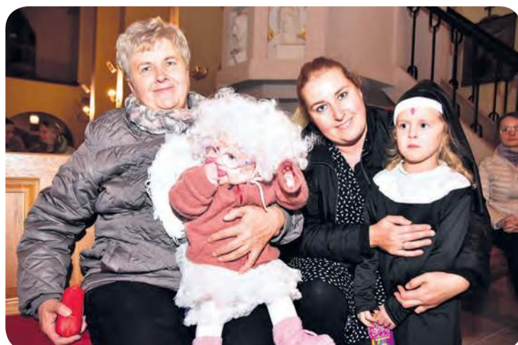
Wydarzenie przyciągnęło w mury świątyni całe rodziny.

Bal rozpoczął się około godziny 16:00 przemarszem z relikwiarzami pod ołtarz. Część dzieci niosła róże. W gronie uczestników znaleźli się liczni święci – m.in.: św. Franciszek z Asyżu, św. Rita, św. Faustyna Kowalska czy św. Jan Paweł II – oraz anioły i inne biblijne postaci. Zebrani wspólnie odmówili dziesiątkę różańca, a następnie wyruszyli w „drogę do nieba”.