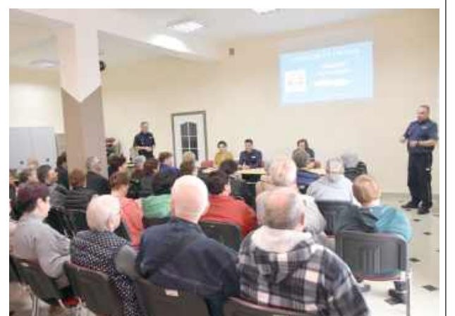
Na spotkaniu licznie pojawili się seniorzy z Gminy Kąkolewnica

Celem debaty było zaangażowanie mieszkańców w wypracowanie rozwiązań, które przyczynią się do poprawy bezpieczeństwa osób starszych na terenie gminy. Po przywitaniu uczestników i wprowadzeniu w tematykę spotkania