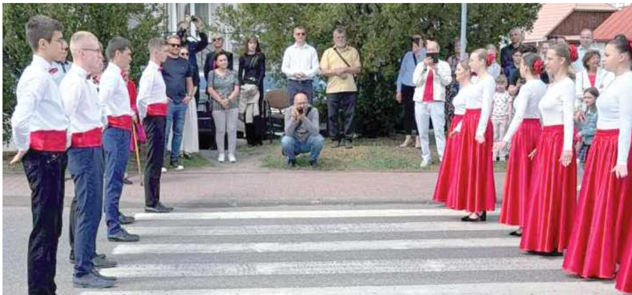
Poloneza odtańczyli uczniowie Zespołu Szkół Rolniczych w Woli Osowińskiej

Radzyna Podlaski: Uroczystą Mszą Świętą w intencji ojczyzny odprawioną w Kościele św. Trójcy rozpoczęły się uroczystości związane z obchodami 234 rocznicy uchwalenia Konstytucji 3 Maja – próby ratowania suwerenności.