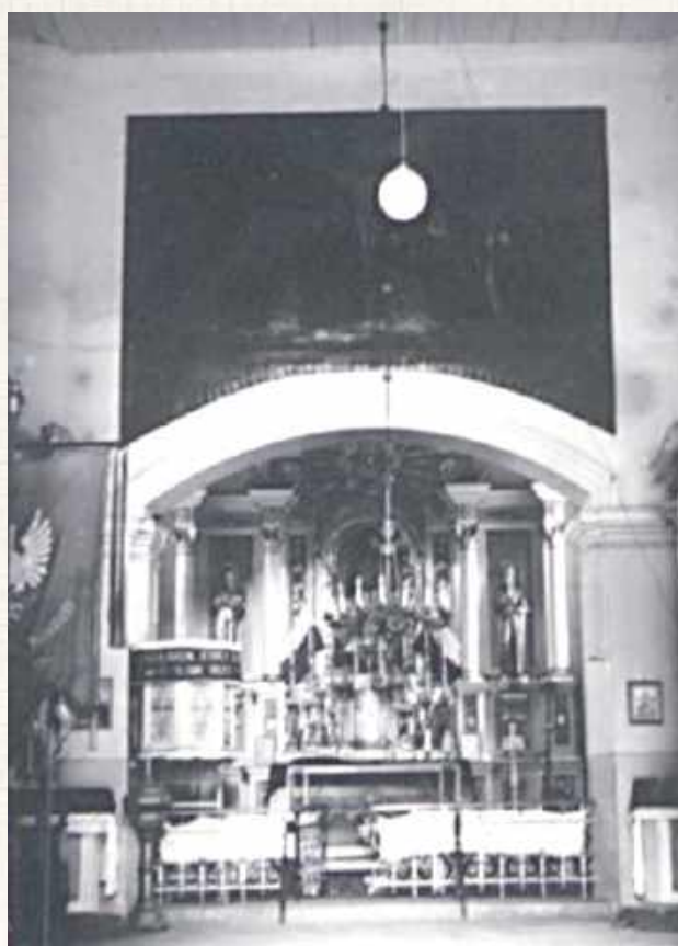
Wnętrze dawnej cerkwi unickiej, obecnie kościoła pw. Opieki świętego Józefa na zdjęciu z lat 60. XX wieku na tzw. „białej” karcie zabytku na portalu zabytek.pl