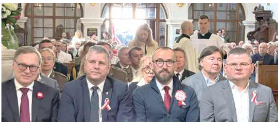
Msza Św. w intencji ojczyzny w Kościele św. Trójcy

Druga część uroczystości odbyła się pod pomnikiem na placu Ignacego Potockiego. Przy asyście wojskowej żołnierzy 2. Lubelskiej Brygady Obrony Terytorialnej podniesiono flagę państwową. Hymn odegrała Młodzieżowa Orkiestra Dęta Czemierniki Radzyna Podlaski. Na koniec, po wystąpieniach okolicznościowych, poloneza odtańczyli uczniowie