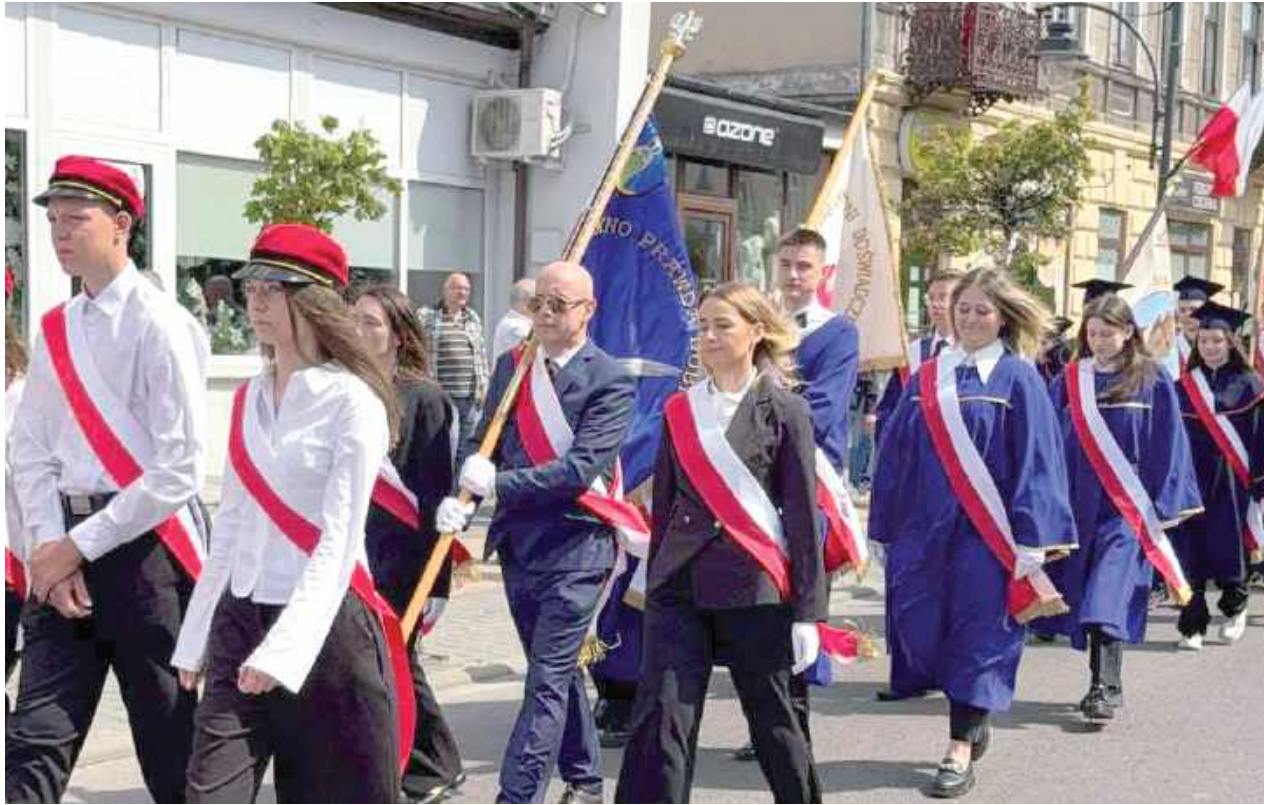
Pochód na Ostrowieckiej. Druga część uroczystości odbyła się pod pomnikiem na placu Ignacego Potockiego. Przy asyście wojskowej żołnierzy 2. Lubelskiej Brygady Obrony Terytorialnej podniesiono flagę państwową