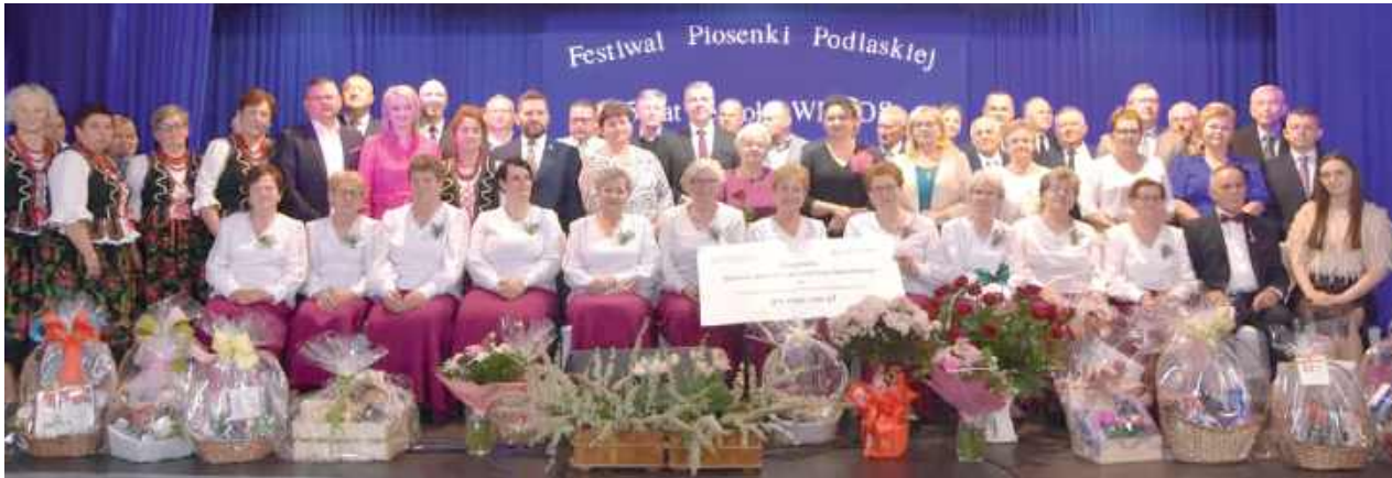
Na wydarzeniu pojawiły się dziesiątki sympatyków zespołu, który przez lata cieszy nas swoimi wykonaniami