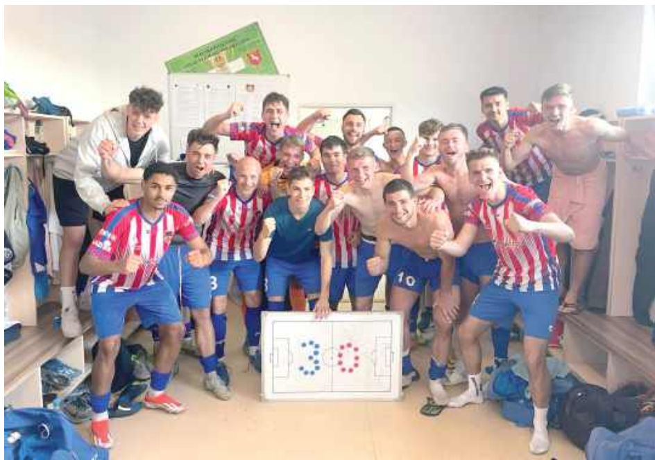
W meczach Huraganu nie można narzekać na nudę. Teraz czas na derby!