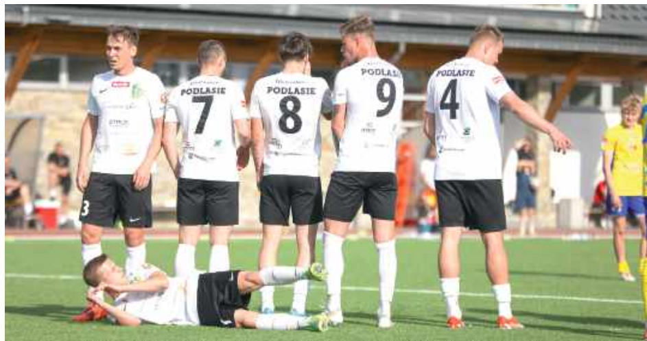
Piłkarze Podlasia musieli pogodzić się z minimalną porażką na najdalszym wyjeździe w sezonie

W dalszej części pierwszej połowy swoje szanse mieli Kozarzewski i Vaclavik, jednak brakowało precyzji i zimnej krwi pod bramką rywali. Podhale także nie próżnowało – Lipiec musiał wykazać się refleksem,