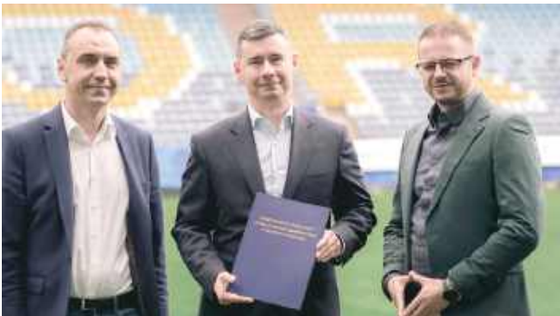
Radzyński szpital będzie współpracował z Motorem Lublin

Nowy partner klubu wesprze drużynę w zakresie medycyny sportowej, diagnostyki urazów oraz działań edukacyjnych i profilaktycznych. Wspólna inicjatywa ma na celu nie tylko rozwój naukowy i podnoszenie kwalifikacji, ale także promocję zdrowego stylu życia i aktywności fizycznej wśród mieszkańców regionu.