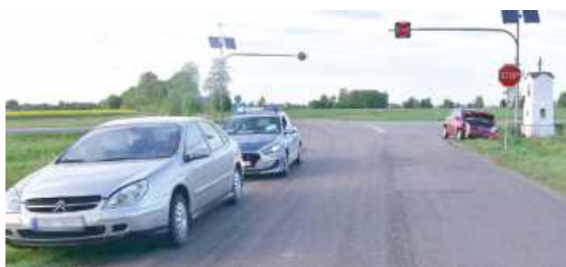
Badanie stanu trzeźwości przeprowadzone przez mundurowych na miejscu zdarzenia potwierdziło, że kierujące były trzeźwe

- 45-letnia mieszkanka gminy Wołyń, kierując Citroënem C5 na skrzyżowaniu nie ustąpiła pierwszeństwa przejazdu kierują-