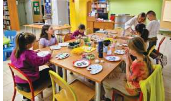
Zajęcia w Miejskiej Bibliotece Publicznej