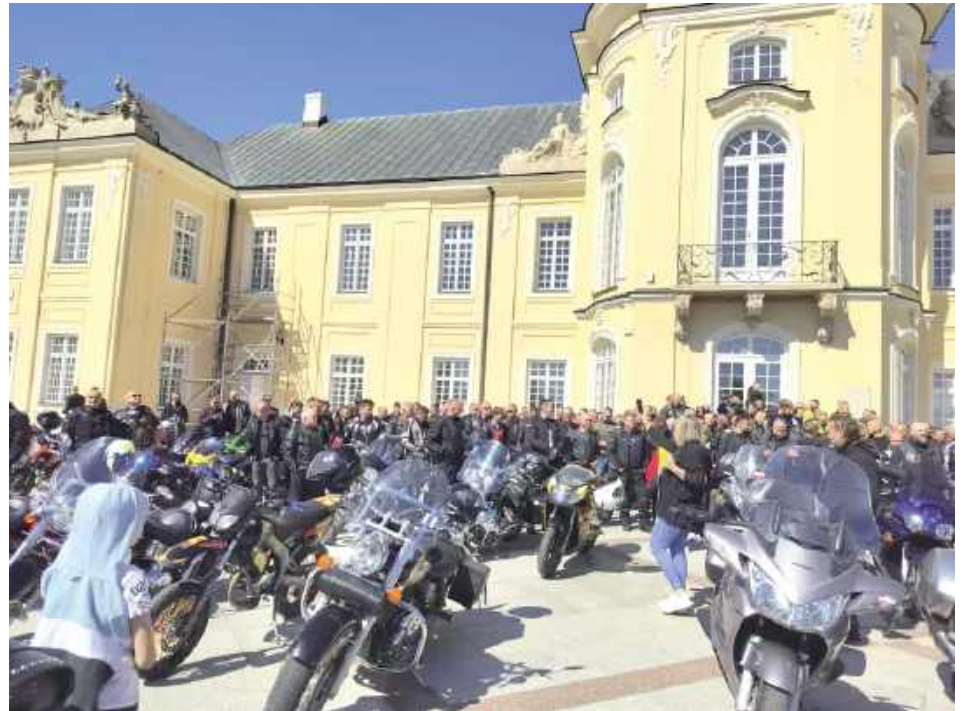
Zebrało się wielu motocyklistów z okolicy

Rozpoczęto w południe – w Sanktuarium MBNP w Radzynie odbyła się msza św., po której motocykliści przejechali na dziedziniec Pałacu Potockich. Następnie na pałacowej łączce zaczęła się część artystyczna, podczas której wystąpiły zespoły Garażowy Skład i NSC.