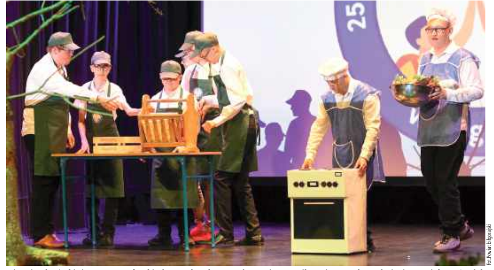
Historia placówki sięga 2000 roku, kiedy to uchwałą Zarządu Powiatu w Biłgoraju powołano do życia Specjalny Ośrodek Rewalidacyjno-Wychowawczy w Teodorówce. Początkowo szkoła funkcjonowała w wynajętych pomieszczeniach i była przeznaczona dla dzieci i młodzieży z niepełnosprawnością intelektualną, głównie mieszkańców miejscowego DPS-u