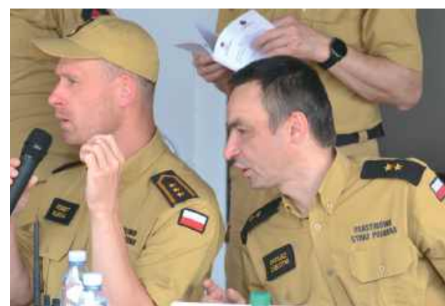
Nad przebiegiem zawodów czuwała PSP z Biłgoraja