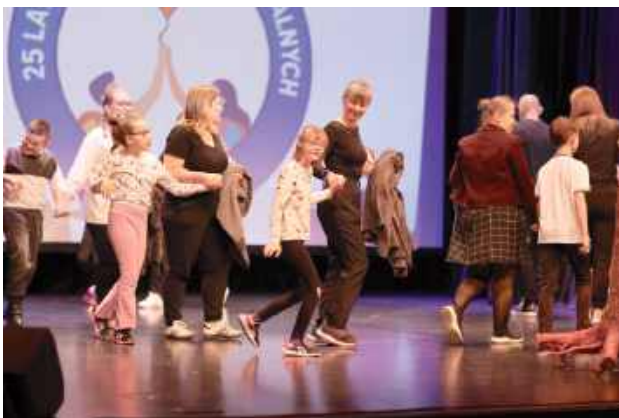
Zespół Szkół Specjalnych to dziś nowoczesna placówka z indywidualnym podejściem do ucznia, zapewniająca edukację, terapię i wsparcie dla dzieci i młodzieży z różnymi potrzebami rozwojowymi