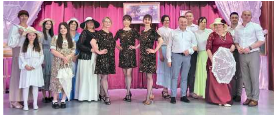
Na scenie wystąpili artyści z gminy Frampol

We Frampolu odbyły się uroczyste obchody Dnia Działacza Kultury, podczas których uhonorowano osoby szczególnie zaangażowane w tworzenie i rozwój życia kulturalnego gminy. Wydarzenie stało się okazją do wyrażenia wdzięczności tym, którzy swoją pasją, talentem i oddaniem budują lokalną tożsamość oraz integrują społeczność wokół wartości kultury i tradycji.