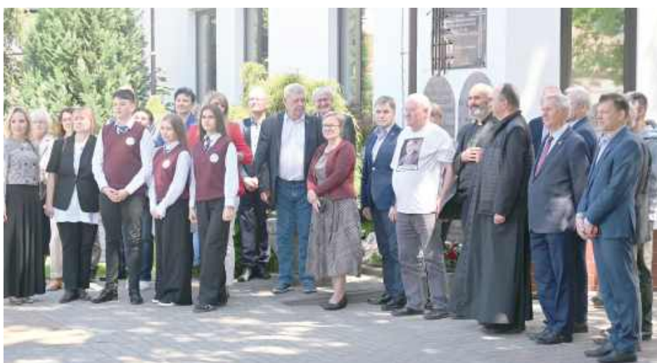
Uczestnicy złożyli kwiaty pod Tablicami Dekalogu

Na sympozjum miały miejsce trzy prelekcje, które wygło-