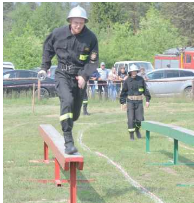
Niektórzy wznosili swe siły na wyżyny...