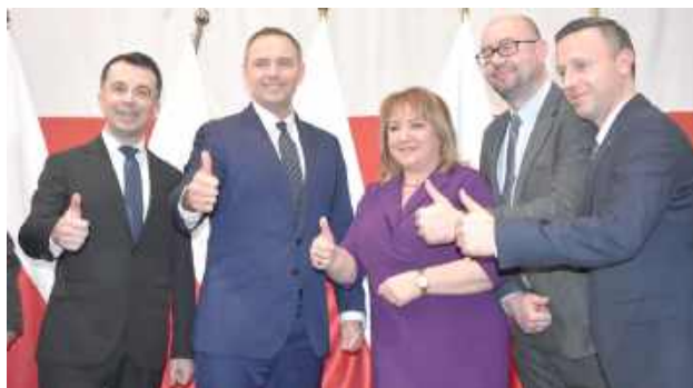
Zdecydowana większość samorządowców z Ziemi Biłgorajskiej od samego początku wspierała kandydaturę Karola Nawrockiego

Wybory prezydenckie wygrał Karol Nawrocki, uzyskując poparcie na poziomie 50,89 proc. Jego kontrkandydat Rafał Trzaskowski uzyskał 49,11 proc. głosów. W powiecie biłgorajskim daleko było od słynnego określenia „na żyłki”, bo przewaga Nawrockiego od samego początku we wszystkich gminach była ogromna. W 10 naszych gminach zdobył ponad 80 proc. poparcia. W sumie na Nawrockiego głos oddało 38 313