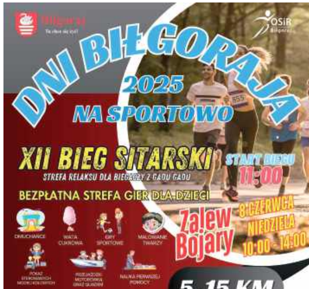
XII Bieg Sitariski w najbliższą niedzielę nad zalewem Bojary w Biłgoraju

9 - 10,30 - weryfikacja zgłoszeń, odbiór pakietów startowych, Biuro Zawodów umiejscowione nad Zalewem „Bojary” - parkingi na końcu ul. Romanowskiego,