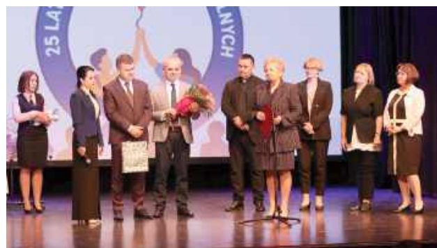
Goście, uczniowie, kadra i przyjaciele szkoły zebrali się w sali widowiskowej Biłgorajskiego Centrum Kultury, gdzie odbyła się część artystyczna