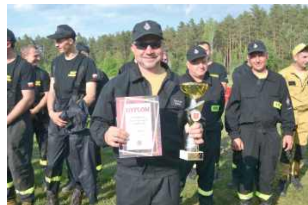
...i z pucharami