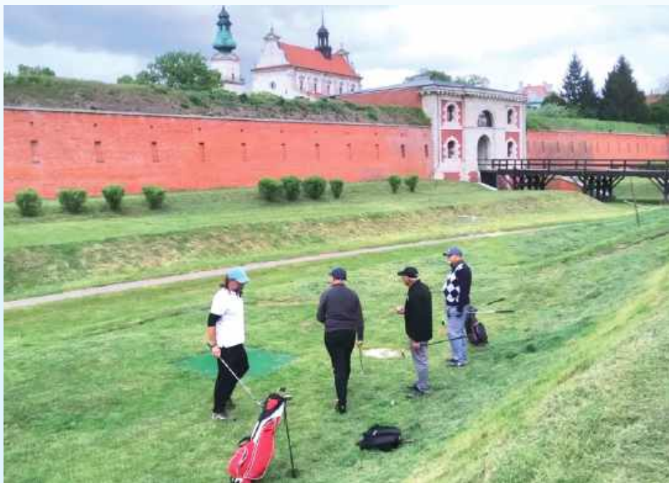
Dla nich niemożliwe nie istnieje. Pole golfowe powstało w samym centrum Zamościa. Teraz kolejny krok?

Dziś zawodnicy związani z zamojskim klubem nie tylko trenują regularnie, ale z powodzeniem wyjeżdżają do większych miast regionu, takich jak Lublin, Rzeszów, by rywalizować na pełnowymiarowych polach golfowych. Co więcej, reprezentują Zamość z klasą, zarażając innych swo-