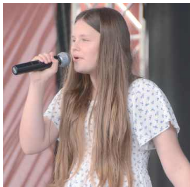
Artyści zachwycili publiczność nie tylko tańcem, ale też śpiewem