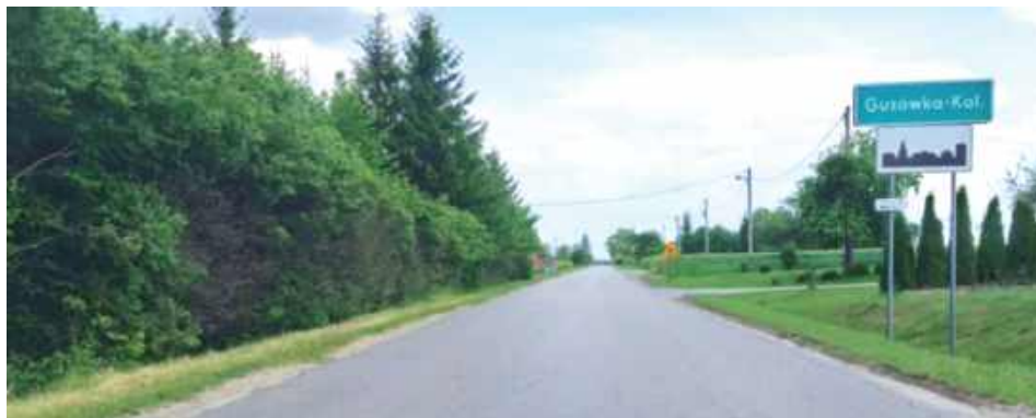
Wszystko zaczęło się od petycji w sprawie poszerzenia tej drogi w gminie Turobin. Pod petycją pracownicy starostwa dopatrzili się sfałszowanych podpisów

- Zwrócili się do mnie niezadowoleni mieszkańcy miejscowości Guzówka - Kolonia i Elizówka w sprawie słusznej inicjatywy społecznej poszerzenia drogi powiatowej w tych miejscowościach. Zebrali szereg podpisów, jednak właściwy organ w tej sprawie - starosta biłgorajski Andrzej Szarlip, zamiast drogę poszerzyć, zrobił, w moim przekonaniu, rzecz