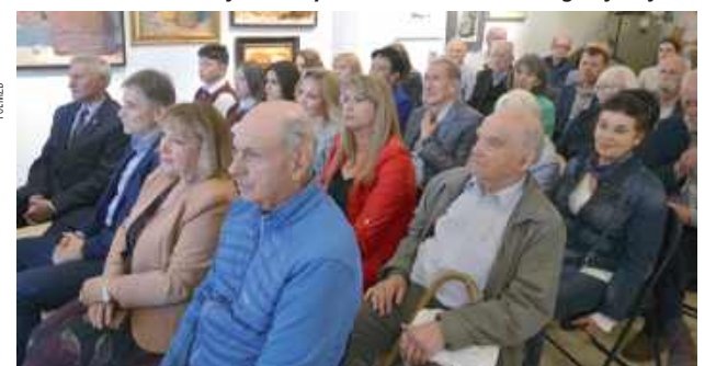
Po sympozjum miała miejsce dyskusja