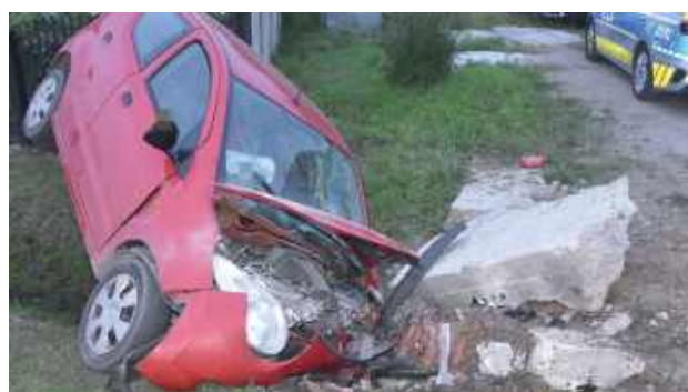
23-letni mieszkaniec gminy Potok Górny, kierując samochodem marki Suzuki, na prostym odcinku drogi zjechał z jezdni do przydrożnego rowu i uderzył w betonowy przepust

Jak wstępnie ustalili funkcjonariusze, 23-letni mieszkaniec gminy Potok Górny, kierując samochodem marki Suzuki, na prostym odcinku drogi zjechał z jezdni do przydrożnego rowu i uderzył w betonowy przepust. Pojazd został poważnie uszkodzony, a jego kierowca odniósł obrażenia ciała, w wyniku czego został przetransportowany do