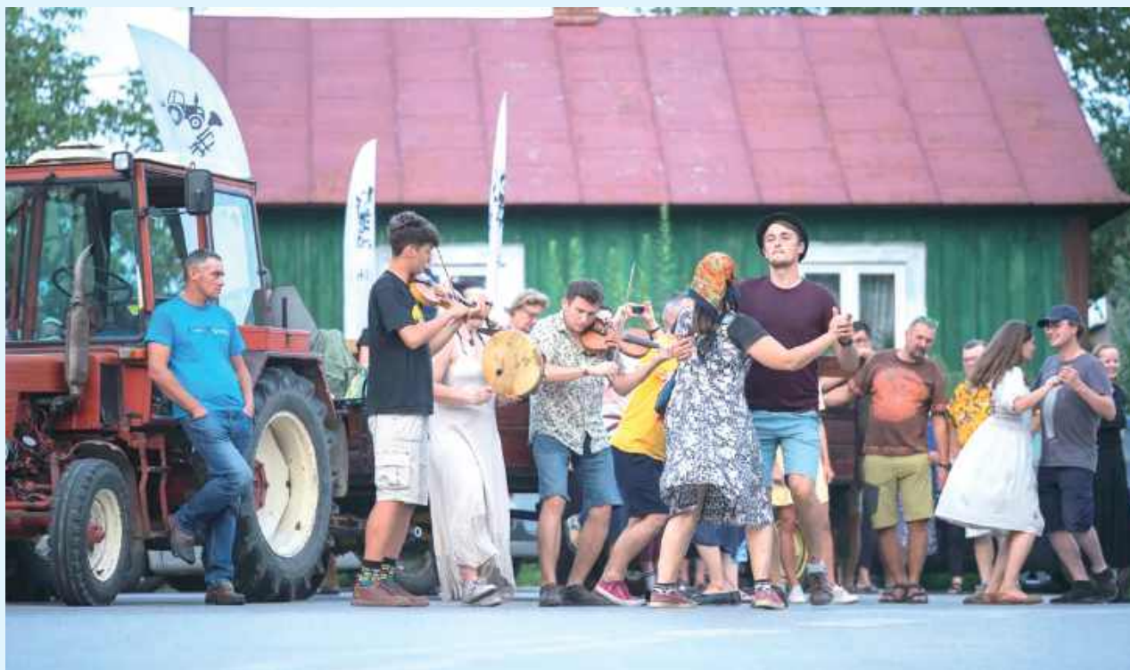
Festiwal Roztrąb wraca do gminy Radecznica

Zakłodzie było niegdyś miejscem tętniącym dźwiękami orkiestr i śpiewów. Teraz znów stanie się sceną dla koncertów, potańcówek, spotkań z mistrzami muzyki oraz wielu innych atrakcji. To właśnie tu historia spotka się z żywą tradycją, a muzyka znów połączy mieszkańców i gości.