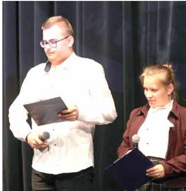
Uczniowie długo i solidnie przygotowali się do uroczystości