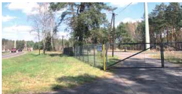
W Woli Dużej przy DW 858 (na trasie Biłgoraj-Zamość) ma powstać nowoczesny zakład do produkcji paliwa biokompozytowego E II generacji z biomasy leśnej i rolnej