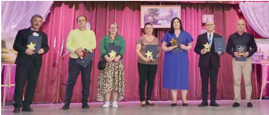
Zasłużeni działacze z gminy Frampol