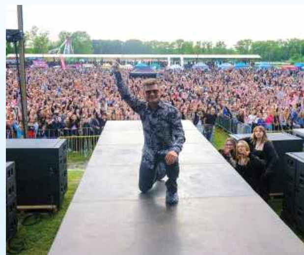
Na koncerty Zenka Martyniuka nie trzeba specjalnie namawiać mieszkańców. Wszędzie, gdzie się pojawi, przyciąga tłumy

W Skierbieszowie ogłosili właśnie gwiazdy muzyczne, które wystąpią na tegorocznym Jarmarku Kiliana. Niemal pewne, że będzie obłędnie, a niektórzy pewnie już planują wolne. Wystąpi sam Zenek Martyniuk, a do tego Czadoman i jeszcze zespół MiG.