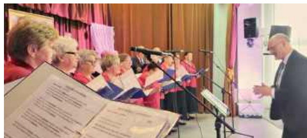
Nie zabrakło części artystycznej