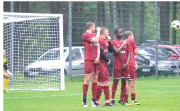
Na dwie kolejki przed końcem sezonu, Olimpiakos Tarnogród traci tylko trzy punkty do piątego miejsca. Teraz podejmuje Omegę, na pożegnanie jedzie do Sitna

Olimpiakos Tarnogród przebudził się na finiszu sezonu. Tydzień temu rozgromił Olimpię Miączyn 7:0, teraz pokonał na