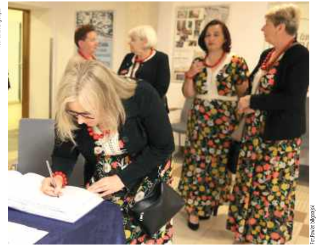
Wpis do pamiątkowej książki gości