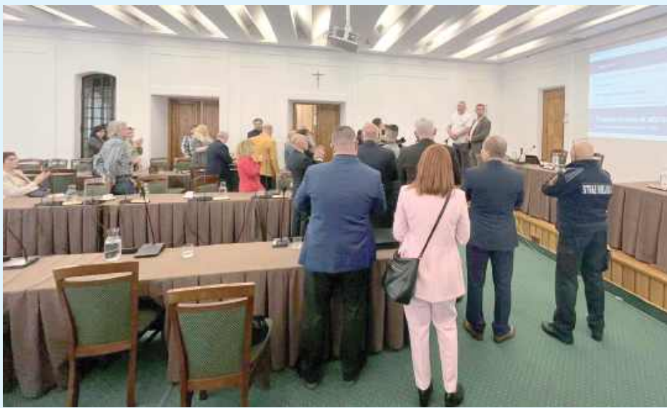
Tak gorąco na sesji RM w Zamościu jeszcze nie było

Nie widać końca kontrowersji po ostatniej sesji Rady Miejskiej w Zamościu. Prezydent miasta Rafał Zwolak złożył zawiadomienie o możliwym przestępstwie. - Liczę na to, że sprawa agitacji politycznej podczas sesji również trafi do prokuratury i sprawca poniesie konsekwencje prawne. A zawiadomienie może złożyć każdy: uczestnik sesji, mieszkaniec, obywatel - tłumaczy.