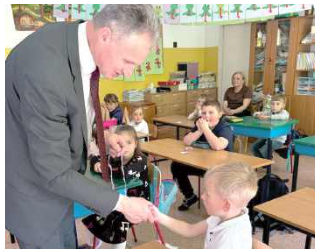
Wójt pęka z dumy, że ma w gminie tak zdolne przedszkolaki!