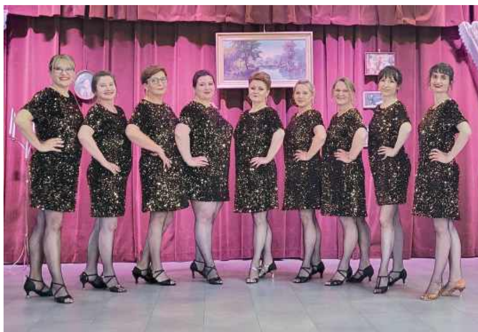
Tancerki z gminy Frampol uświetniły wydarzenie swoimi występami

Wydarzenie, pełne wdzięczności i wzruszeń, było pięknym świadectwem siły lokalnej kultury oraz dowodem na to, że Frampol może być dumny ze swoich działaczy, artystów i społeczników.