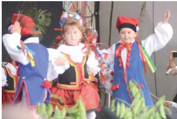
Przepiękne stroje, tańce i uśmiechy. Tak właśnie wyglądały dzieci na scenie BCK