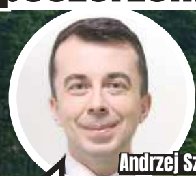
Andrzej Szarlip, starosta biłgorajski

W związku z otrzymanymi sygnałami, iż mogło dojść do posłużenia się podrobionymi podpisami, koniecznym stało się poinformowanie organów ścigania o możliwości popełnienia przestępstwa. Jeśli chodzi o drogę, to jak najbardziej popieram wszystkie postulaty mieszkańców.