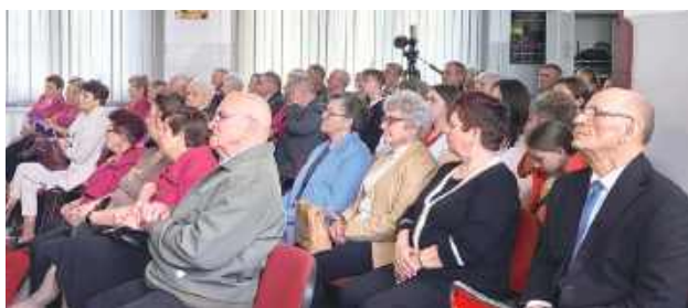
Wydarzenie cieszyło się sporym zainteresowaniem