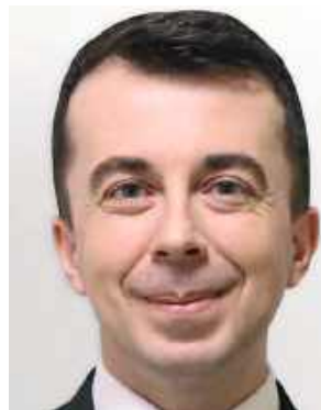
Andrzej Szarlip starosta biłgorajski

Podkreślam, co jest rzeczą oczywistą, nie można fałszować podpisów, dlatego tę sprawę bada prokuratura. Były uzasadnione podejrzenia, że mogło dojść do sfałszowania podpisów. To nie są działania wymierzone w mieszkańców, wręcz przeciwnie: to jest w interesie mieszkańców, aby wyjaśnić, czy ich podpisy zostały użyte wbrew ich wiedzy i ich woli, a tym samym, czy ich dane wrażliwe są bezpieczne.