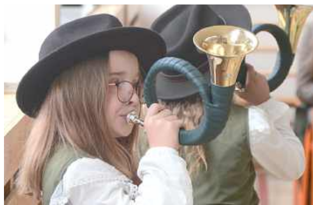
Nawet najmłodsi próbowali swoich sił