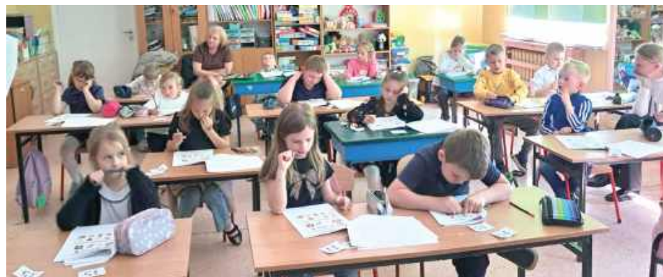
W Publicznej Szkole Podstawowej im. Św. Franciszka z Asyżu w Lipinach Dolnych odbyła się Gminna Olimpiada z Języka Angielskiego dla przedszkolaków