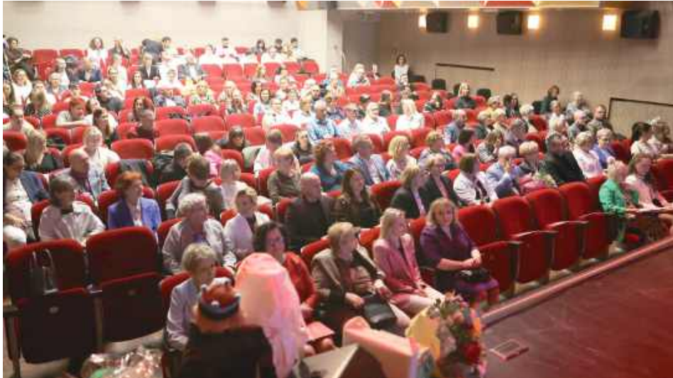
Obchody 25-lecia Zespołu Szkół Specjalnych rozpoczęły się od mszy świętej w sanktuarium św. Marii Magdaleny w Biłgoraju

Zespół Szkół Specjalnych w Biłgoraju obchodził wyjątkowy jubileusz – 25-lecie działalności placówki. Od ćwierć wieku ta edukacyjna i wychowawcza instytucja realizuje misję przygotowania uczniów i wychowanków do samodzielności, aktywnego życia, z poszanowaniem ich indywidualnych możliwości i potrzeb.