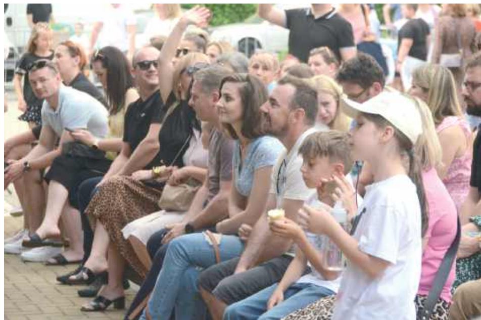
Występy podczas wydarzenia obserwowało ogromne grono widzów

BIŁGORAJ: Plac przed Biłgorajskim Centrum Kultury w niedzielne popołudnie 1 czerwca tętnił życiem. Odbyło się tam radosne świętowanie Dnia Dziecka, które przyciągnęło nie tylko najmłodszych mieszkańców Biłgoraja, ale i całe rodziny.