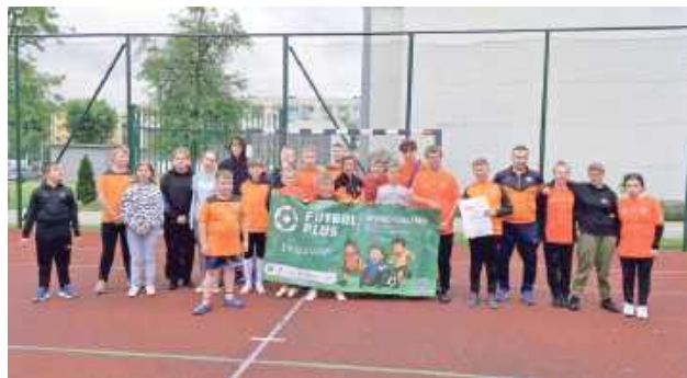
Do Nadrzecza przyjedzie blisko 200 młodych piłkarzy z niepełnosprawnościami

Ponad 200 zawodników i zawodniczek z całej Polski weźmie udział w Ogólnopolskim Turnieju Piłki Nożnej dla dzieci i młodzieży z niepełnosprawnościami w ramach projektu Futbol Plus. Zawody zostaną rozegrane 22 czerwca w kompleksie sportowym w podbiłgorajskim Nadrzeczu.