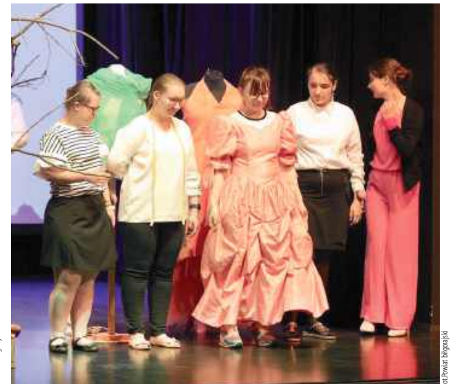
Uroczysta gala z okazji ćwierćwiecza istnienia szkoły specjalnej w Biłgoraju