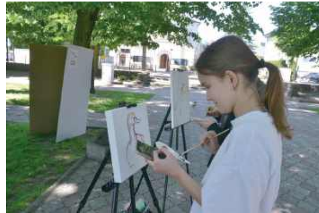
Podczas tego wydarzenia nie zabrakło atrakcji dla najmłodszych