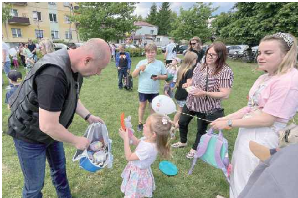
Jedną z niespodzianek były lody, które dzieci dostały od Spontanicznej Grupy Motocyklowej