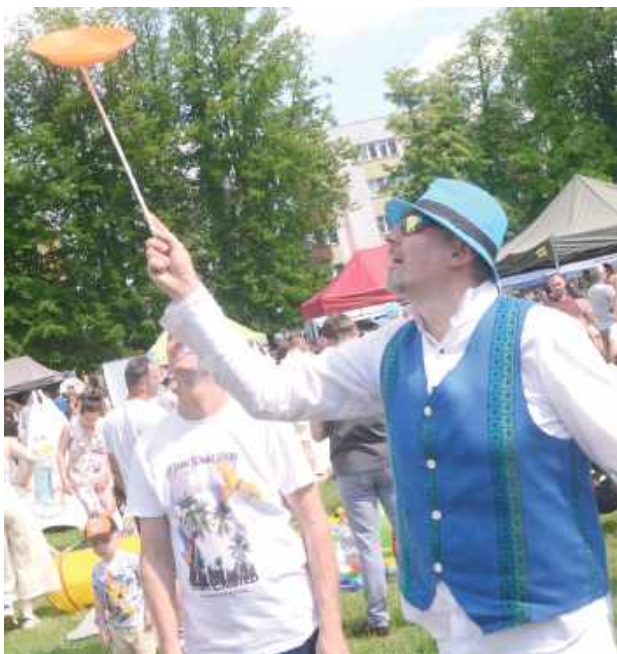
Nauka kręcenia talerzami? A czemu by nie