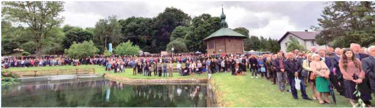
13 czerwca główne uroczystości odpustowe w Radecznicy

Radecznica to wyjątkowe miejsce na mapie religijnej Polski, znane jako „lubelska Częstochowa”. To tutaj,