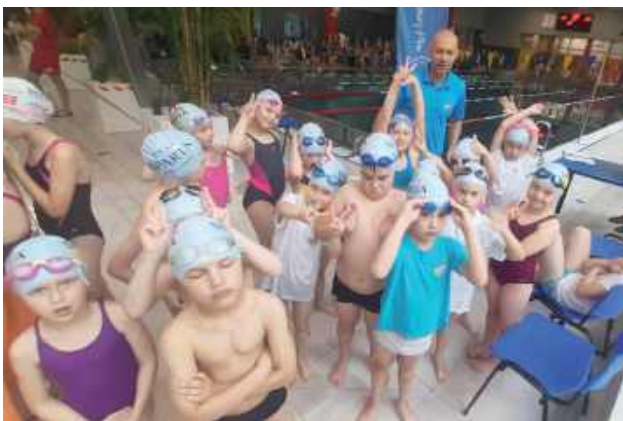
Młodzi zawodnicy Sparty Biłgoraj udanie rywalizowali w Tomaszowie Lubelskim

Młodzi pływacy RKWS Sparta Biłgoraj rywalizowali w zawodach zorganizowanych z okazji Dnia Dziecka w Tomaszowie Lubelskim. W imprezie uczestniczyły kluby z Lubaczowa, Horyńca-Zdroju oraz gospodarzy.