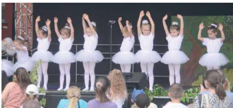
Występom nie było końca

Pogoda dopisała, humory również, a dzieci z uśmiechami na twarzach obchodziły swoje święto. Od godz. 12 na scenie letniej można było zobaczyć występy przygotowane przez lokalne przedszkola, grupy baletowe oraz seniorów z UTW, którzy zaprezentowali bajkę „Wróblek Elemelek”. Wokół sceny dzieci bawiły się na dmuchańcach, ustawiały się w kolejce po kolorowe tatuaże, malowanie twarzy i brokatowe warkoczyki. Nie brakowało też konkursów z nagrodami, animacji i stanowisk kreatywnych - prawdziwa gratka dla najmłodszych. Do akcji włączyła się również Spontanicz-