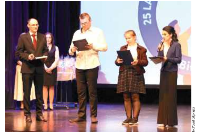
W jubileuszu wzięli udział pracownicy, uczniowie, rodzice, przedstawiciele władz samorządowych, instytucji współpracujących z placówką oraz zaprzyjaźnionych szkół i ośrodków.