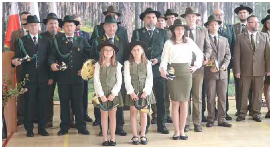
Wydarzenie to przyciągnęło wielu miłośników muzyki myśliwskiej