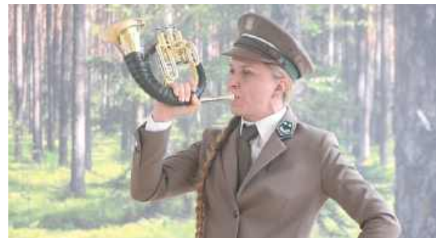
Podczas konkursu rozbrzmiewały między innymi: plessy i parforsy