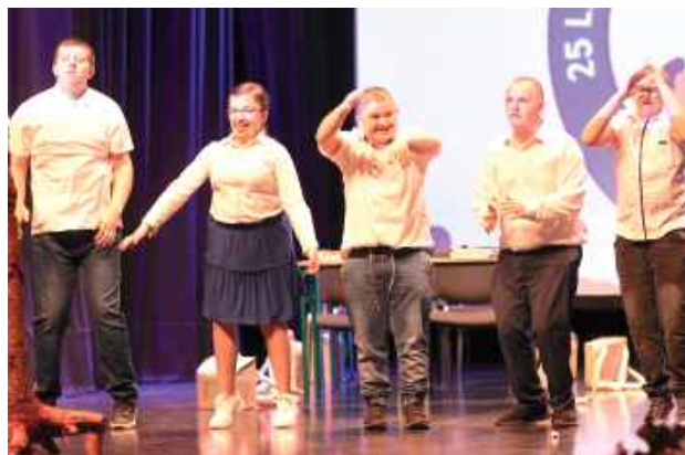
Nie zabrakło wspomnień i podziękowań dla wszystkich, którzy przez lata tworzyli szkołę - od kadry pedagogicznej po dyrektkę.