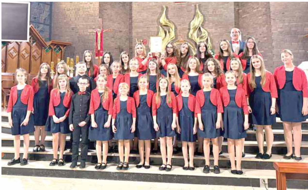
Gala Finałowa Igrzysk Chóralnych 2025 odbyła się w kościele PW. MB Matki Miłosierdzia w Warszawie. Podczas wydarzenia Harmonia wyśpiewała „Srebrne Pasma”