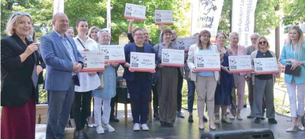
Granty dostało aż 12 organizacji. Wydarzenie te odbywało się w ramach 25-lecia „Działaj Lokalnie”