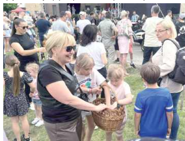
Każdy dostał coś na ochłodzenie podczas upalnego dnia