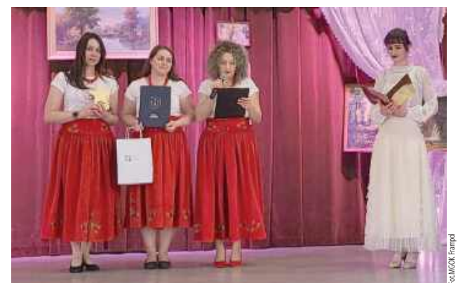
Frampolskie Gwiazdy przyznane