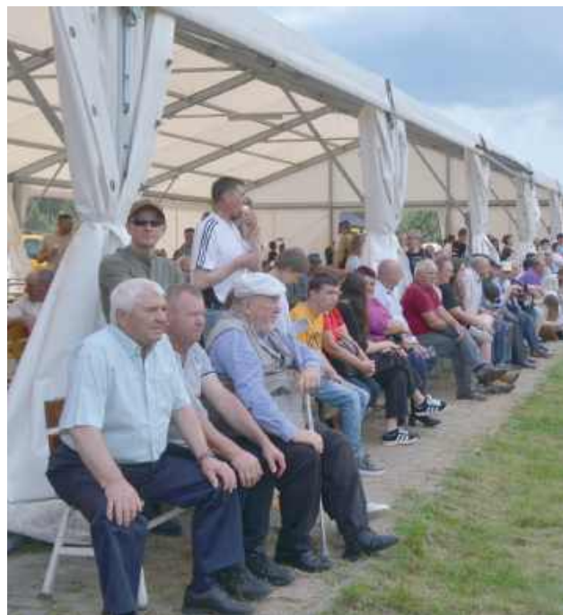
Poczynaniom strażaków przyglądała się liczna publiczność