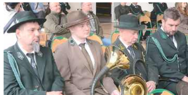
W konkursie wzięli udział zarówno myśliwi, jak i leśnicy