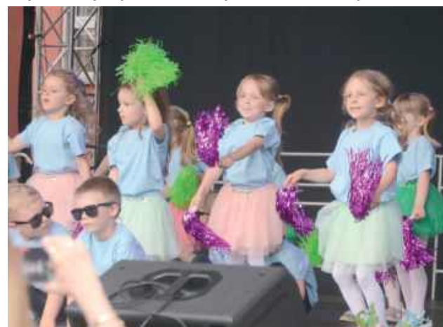
Spójrzcie sami, jak pięknie prezentowali się młodzi artyści!