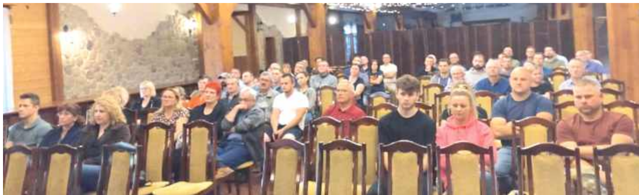
Mieszkańcy mieli wiele pytań dotyczących potencjalnej inwestycji, niestety, na większość nikt nie umiał odpowiedzieć

W poniedziałek, 26 maja w Karczmie w Woli odbyło się spotkanie mieszkańców miejscowości Wola Mała i Duża w związku z informacjami, jakie pojawiły się na temat planowanej budowy „nowoczesnego zakładu do produkcji paliwa biokompozytowego E II generacji z biomasy leśnej i rolnej na terenie gminy Biłgoraj”.