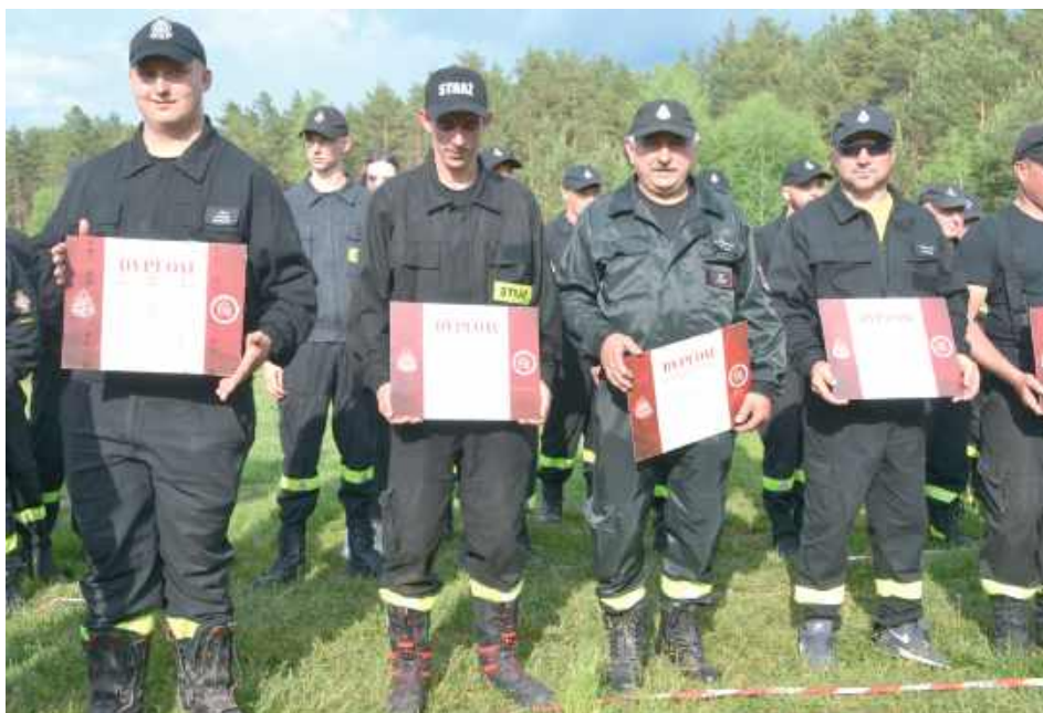
Dumni druhowie OSP z dyplomami