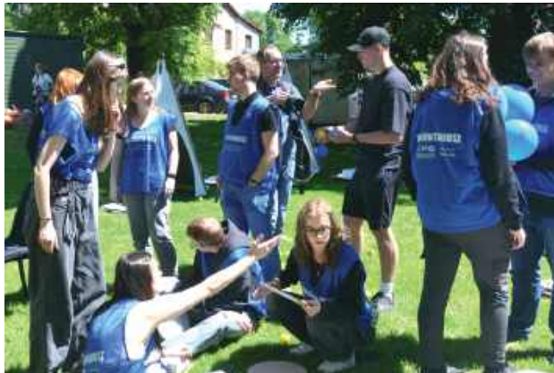
W wydarzeniu udział wzięli liczni wolontariusze

Głównym celem Programu jest aktywizowanie lokalnych społeczności na wsiach i w małych miastach wokół różnych działań o charakterze dobra wspólnego poprzez wspieranie projektów obywatelskich. Projekty te służą pobudzeniu aspi-