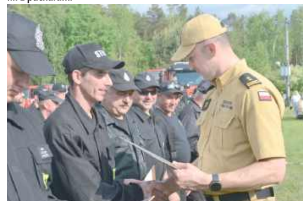
Jednostki OSP otrzymały także pamiątkowe dyplomy