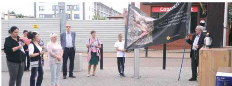
Na różańcach „o przebłaganie za grzech aborcji” pojawia się zazwyczaj kilka osób. Banery prezentują drastyczne treści

W niedzielę, 1 czerwca, gdy większość dzieci świętowała swój dzień, w Parku Solidarności odbyła się publiczna modlitwa różańcowa „o przebłaganie za grzech aborcji”.