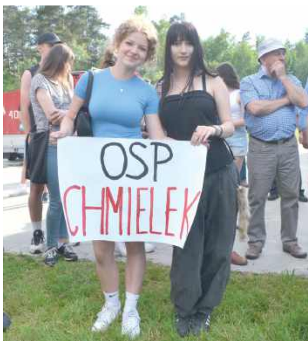
OSP w Chmielku miał bardzo wiernych kibiców