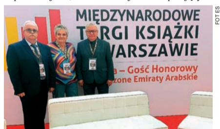
Przedstawiciele oddziału ciechanowskiego Związku Literatów na Mazowszu

Przez cztery dni liczne rzesze zwiedzających odwiedzały stoiska wydawnictw, księgarni i instytucji kultury, a także aktywnie uczestniczyły w bogatym programie wydarzeń przygotowanym przez organizatorów. Targi były nie tylko okazją do zapoznania się z najnowszymi publikacjami, ale także miejscem inspirujących