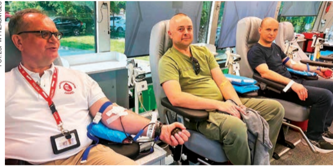
Krwiodawcy z ZSP Przasnysz

Pobrano aż 12 600 ml krwi. Za logistykę i koordynację odpowiadał wojskowy Oddział HDK Legion