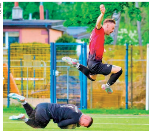
Zawodnicy z Ciechanowa zremisowali w Sierpcu z Kasztelanem 2:2

z poprzednich meczów oraz kontuzjami i tak dzielnie stawili czoła