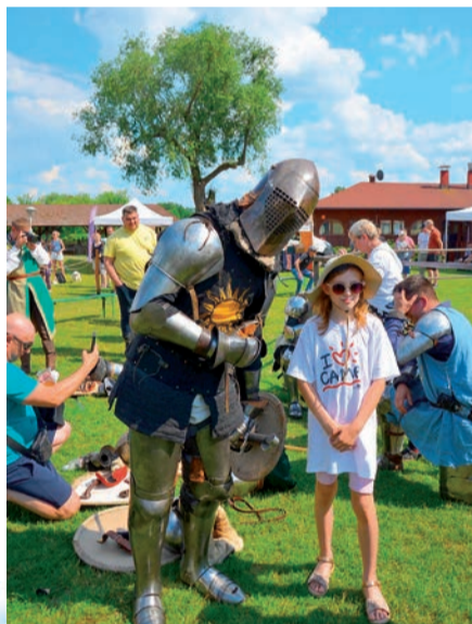
Nie brakowało chętnych do wspólnego zdjęcia z rycerzami

Sam turniej zgromadził tłum obserwatorów, żywo dopingujących rycerzy, jednak nie brakowało też zainteresowania pozostałymi atrakcjami. Organizatorzy: Chorągiew Zamkowa Miasta Pułtusk oraz Kapituła Rycerstwa Polskiego zadbała, by turniej pełnił również funkcję edukacyjną. Od godziny 13:00 uczestnicy mogli odwiedzać obóz rycerski, korzystać ze zbrojowni oraz szlifować swoje