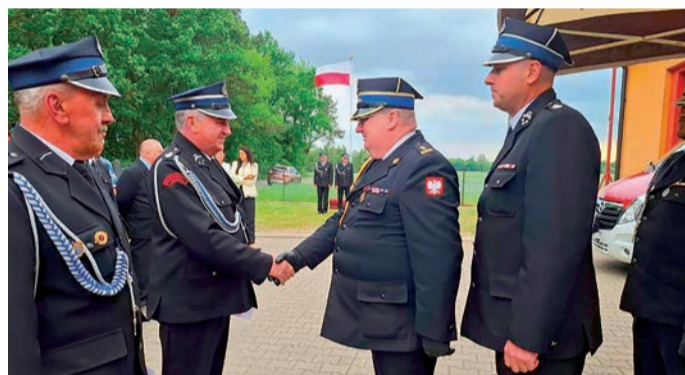
Strażacy z OSP Smulska świętowali 70-lecie