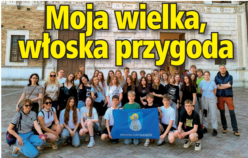
Uczniowie Czwórki odwiedzili Gradarę, Wenecję, Rimini, Urbino i San Marino

* Gradara, Wenecja, Rimini, Urbino, San Marino... jedno piękniejsze od drugiego! Które z tych miast wywarło na Was największe wrażenie?