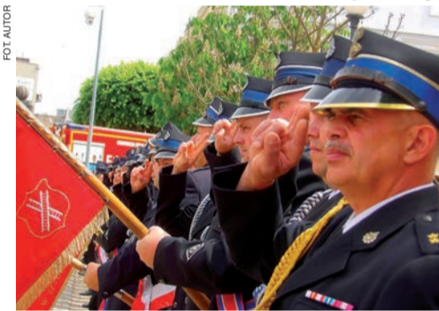
Baczność! Strażacy na uroczystości

Na zakończenie złożono kwiaty pod pomnikiem Józefa Piłsudskiego, po czym strażacy i ich goście spotkali się przy obiedzie. (kj)