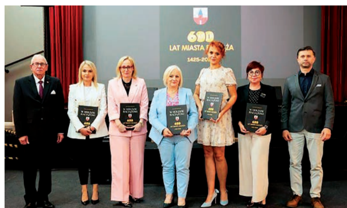
W Raciążu zaprezentowano kolejną publikację autorstwa Stefana Modrzejewskiego