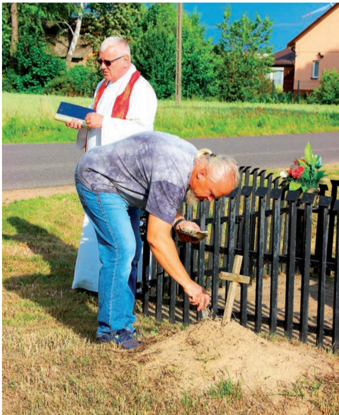
Święcenie pól w Grzybowie

Święcenie pól było dla rolników ważnym obrzędem, wynikającym z cyklu pracy i znaczeniem codziennego trudu. Miało uchronić przed nieurodzajem, strzec zasiewy przed gradobicem, wyłożeniem się zbóż oraz przed wszelkimi kaprysami przyrody zagrażającymi plonom.