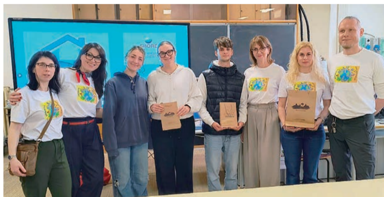
Erasmus to świetna okazja, aby poznawać kulturę i zwyczaje innych krajów