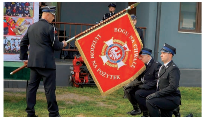
Przekazanie sztandaru dla OSP Kownaty