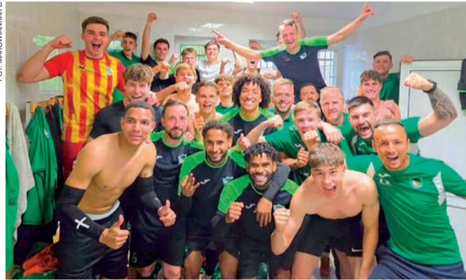
Radość piłkarzy Makowianki z pewnego utrzymania się w lidze