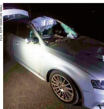
Wypadek z udziałem losia

Na miejscu policjanci wykonali niezbędne czynności procesowe, które pozwolą na szczegółowe ustalenie przebiegu oraz wszystkich okoliczności tego