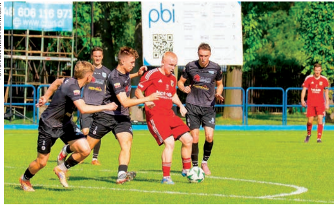
Przasnyszanie zremisowali w Garwolinie z Wilgą