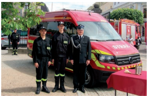
Ten wóz otrzymali druhowie z OSP przy ul. Z. Padlewskiego w Mławie

Uroczystość rozpoczęła się w kościele Świętej Trójcy, dokąd przemaszerowały zastępy strażaków zawodowych i ochotników z całego powiatu – ze sztandarami jednostek. Mszy św. przewodniczył ks. kapelan Jerzy Piątek.