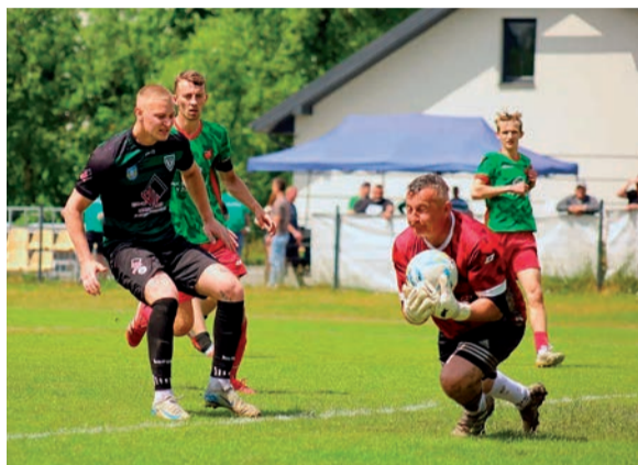
Opia Opinogóra odwróciła losy meczu