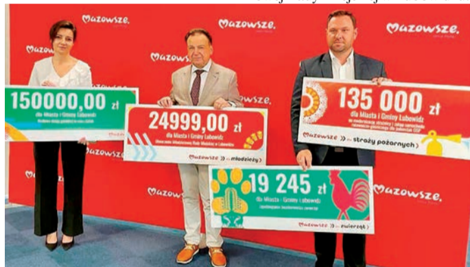
Marszałek A. Struzik i władze Lubowidza po podpisaniu umowy

Blisko 20 tys. zł trafi na działania związane z zapobieganiem bezdomności zwierząt. Prawie 25 tys. zł gmina otrzyma na utworzenie Młodzieżowej Rady Miejskiej w Lubowidzu.