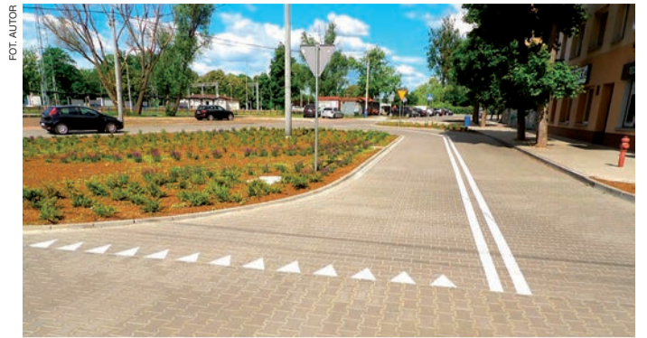
W rezultacie przebudowy infrastruktury w centrum Wólki poprawiła się też estetyka tego kwartału miasta

Do tego uzupełniono zielen. Na 13 arach zasadzono 1967 krzewów oraz 1,5 tys. traw i bylin, przede wszystkim gatunków odpornych na suszę. Takich jak suchodrzew chiński, sosna kosodrzewina, róża okrywowa, szalwia omszona czy ostnica mochna. Poza tym założono trawniki na powierzchni 500 m kw. Jak wiadomo, roślinność w czasie upałów przyczynia się do obniżenia