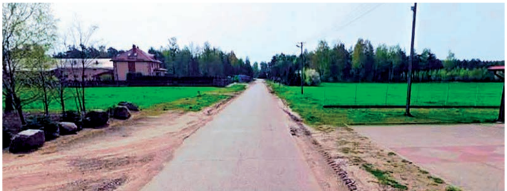
Tutaj powstanie arteria o szerokości 6 metrów

Wartość całej inwestycji wyniesie nieco ponad 9 mln zł, z czego 6,34 mln zł powiat pozyskał w ramach Rządowego Funduszu Rozwoju Dróg. Reszta kosztów rozbudowy będzie pokryta z budżetu powiatu. W.D.