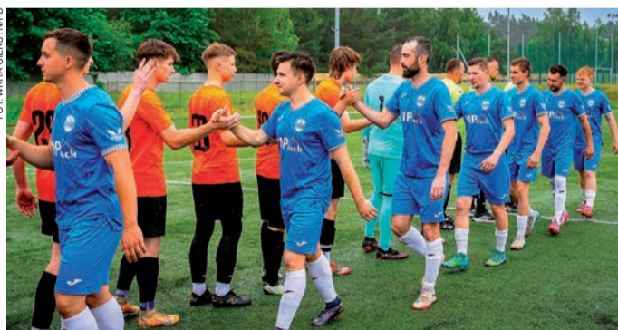
Wkra Ciekosyn wygrała na wyjeździe z Mazurem Ojrzeń 1:0

26. kolejka (12-14 czerwca): Wkra C. - Orzeł, Krasnosielc - Bartnik, Pelta - Łyse, Mazowsze - Wymakracz, Korona - Pokrzywnica, Przasnysz II - Iskra, Żbik II - Mazur.