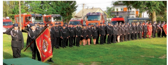
Podczas uroczystości odbyło się przekazanie sztandaru dla OSP Kownaty