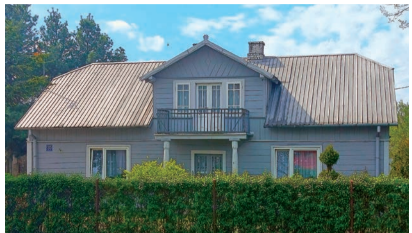
Budynek, w którym funkcjonowała karczma

Po poczcie, w czasach bardziej nam współczesnych funkcjonującej obok ośrodka zdrowia, pozostał do dziś jedynie... kod pocztowy. W sąsiedztwie zaś domu Czajkowskich od połowy zeszłego wieku działała Spółdzielnia Oszczędnościowo-