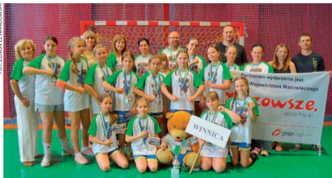
LUKS 19 Winnica – gospodynie zajęły drugie miejsce