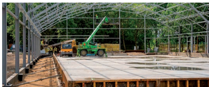
Zainstalowano już stalowe konstrukcje dachu

Za realizację inwestycji odpowiada miejska spółka Zakład Wodociągów i Kanalizacji w Ciechanowie. Na budowę pozyskano 2,8 mln zł dofinansowania z Ministerstwa Sportu i Turystyki. Generalnym wykonawcą przedsięwzięcia jest firma Rembud. erem