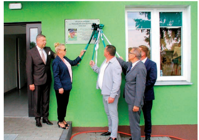
Odsłonięcie tablicy pamiątkowej

- To jest tak piękny, wspaniały dla nas gest. (...) Panie burmistrzu, my będziemy takim solidnym, bardzo