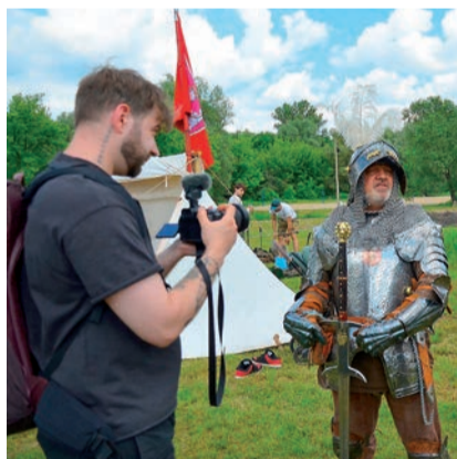
Imprezę odwiedził też znany youtuber OjWojtek