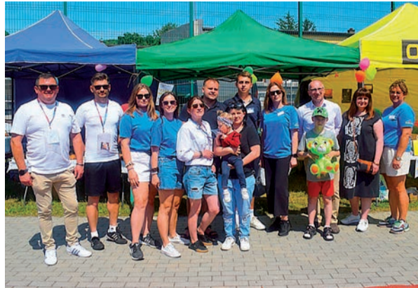
Podczas niedzielного wydarzenia zebrano ponad 11 tys. zł