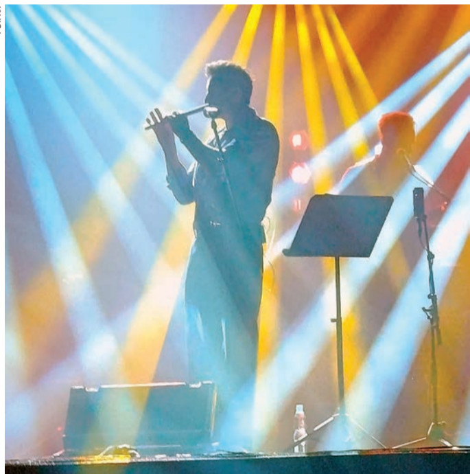
Gwiazdą Dni Makowa był zespół Zakopower