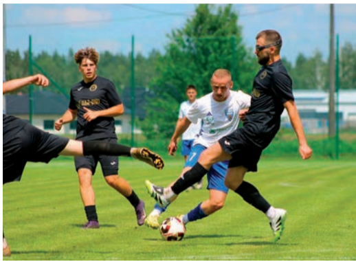
Gladiator nie dał szans Wkrze Radzanów

30. kolejka (wszystkie mecze 13 czerwca o godz. 17:00): Oldaki - Opia, Wkra Z. - Kryształ, Kurpik - Korona, Wkra B. - Rzekunianka, Strzegowo - Wkra R., Gladiator Słoszewo - Sona, Narew II - Ostrovia, Mławianka II - Konopianka.