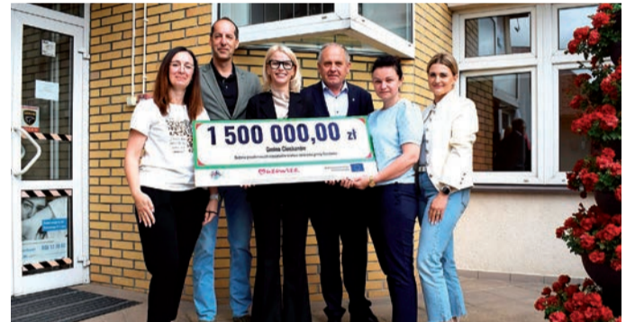
Gmina Wiejska Ciechanów z dofinansowaniem na przydomowe oczyszczalnie ścieków

Po raz pierwszy z programu skorzystała Gmina Wiejska Ciechanów, gdzie ma powstać blisko 70 przydomowych oczyszczalni. Powstaną