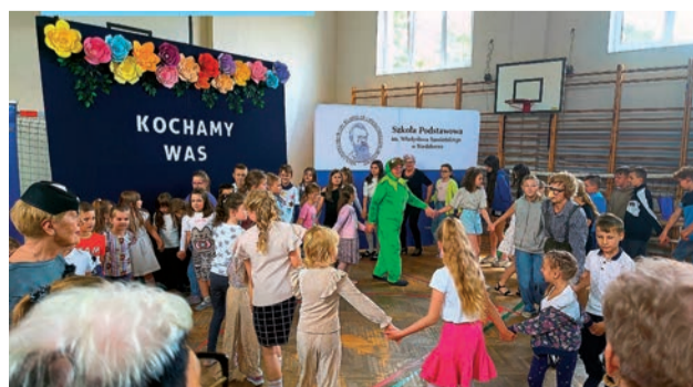
Wspólna wielopokoleniowa zabawa w Tuwimowie

Po części oficjalnej wszyscy uczestnicy zostali zaproszeni do wspólnej zabawy na placu szkolnym. Nie zabrakło atrakcji dla dzieci, śmiechu oraz integracji międzypokoleniowej.