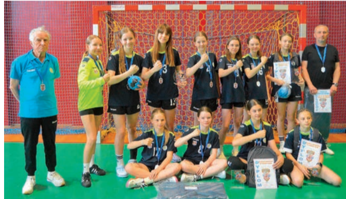
Zespół Zawrze Mława

O randze i wysokim poziomie organizacyjnym turnieju świadczy fakt, że po raz kolejny został on doceniony przez Warszawsko-Ma-