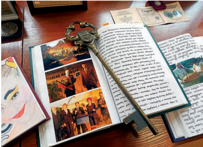
W urzędzie miejskim zaprezentowano dokumenty i przedmioty związane z historią miasta

Obchody otworzyła Scena Młodych. 3 czerwca na scenie w Ryнку wystąpiły dzieci i młodzież z makowskich szkół i przedszkoli. Zobaczyliśmy Miejski Zespół Przedszkoli Samorządowych, Przedszkole Samorządowe nr 2, Niepubliczne Przedszkole Językowo-Sportowe Happy Kids, Niepubliczne Przedszkole Pastelove i Specjalny Ośrodek Szkolno-Wychowawczy, a następnie SP nr 1 im. W. Broniewskiego, SP nr 2 im. J. Kochanowskiego oraz LO im. M. Curie-Skłodowskiej. Występom towarzyszyły rozmaite atrakcje dodatkowe przygotowane przez lokalne szkoły i organizacje, jak malowanie twarzy, kolorowe warkoczki, warsztaty kwiatowe, duże bańki, popcorn i wata cukrowa. Swoją obecność zaznaczyły również powiat makowski, Sanepid i ZUS. Po południu w Kinie Mazowsze miały miejsce dwa seanse kinowe - „Zwierzogród 2” oraz „Za duży na bajki 3”.