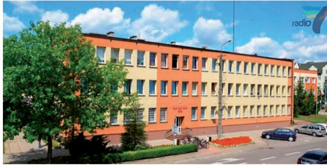
Siedziba władz miasta i gminy

Wkrótce rozpocznie się realizacja zadania z Budżetu Obywatelskiego – „Rewitalizacja terenu w Wólce Kliczewskiej”, które zdobyło największe