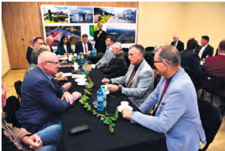
Temat wzbudził duże zainteresowanie ze względu na potencjalne korzyści komunikacyjne dla regionu i realne szanse na włączenie inwestycji do rządowych programów infrastrukturalnych.