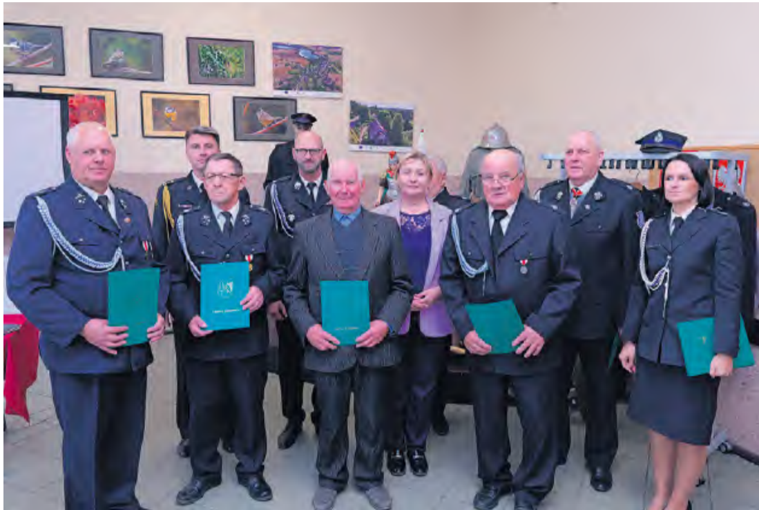
Część wyróżnionych weteranów z gminy Lubiewo.