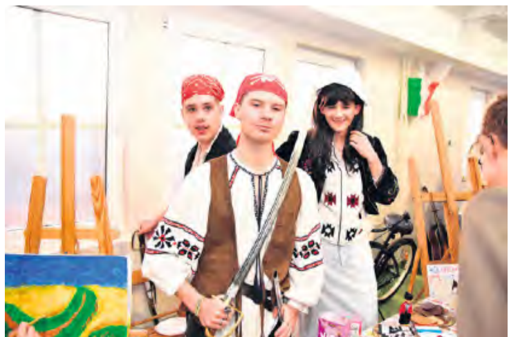
II b (Holandia) i piracka przeszłość.