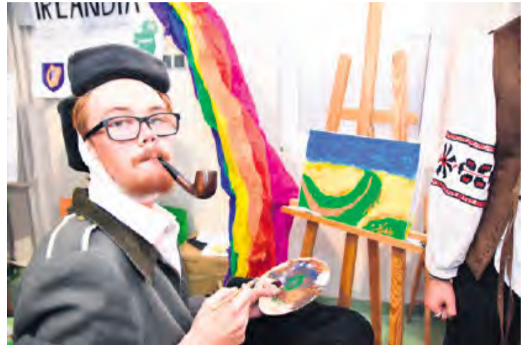
Takich wydarzeń w szkołach powinno być zdecydowanie więcej.