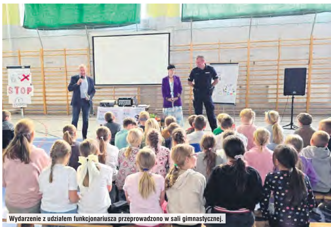
Wydarzenie z udziałem funkcjonariusza przeprowadzono w sali gimnastycznej.