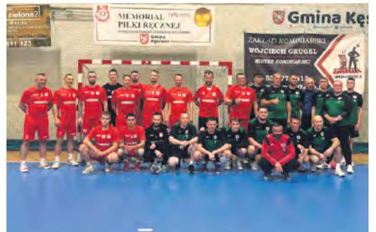
LKS Kęsowo (czerwone stroje) i Pokolenie Człopa – dwa zespoły, które zmierzyły się w meczu kontrolnym.

LKS Kęsowo – MGKS Pokolenie Człopa 30:24 (18:13)