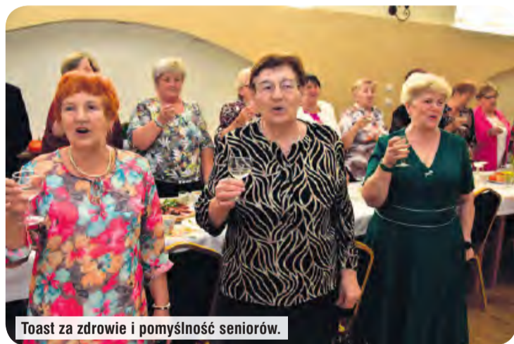
Toast za zdrowie i pomyślność seniorów.