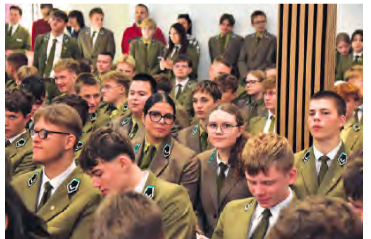
W piątek ważna była wspólna zabawa i integracja.