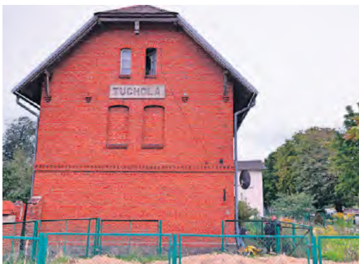
Do pożaru doszło w dobrze widocznym kolejowym budynku u zbiegu ulic Kolejowej, Chopina i Starego Dworca.