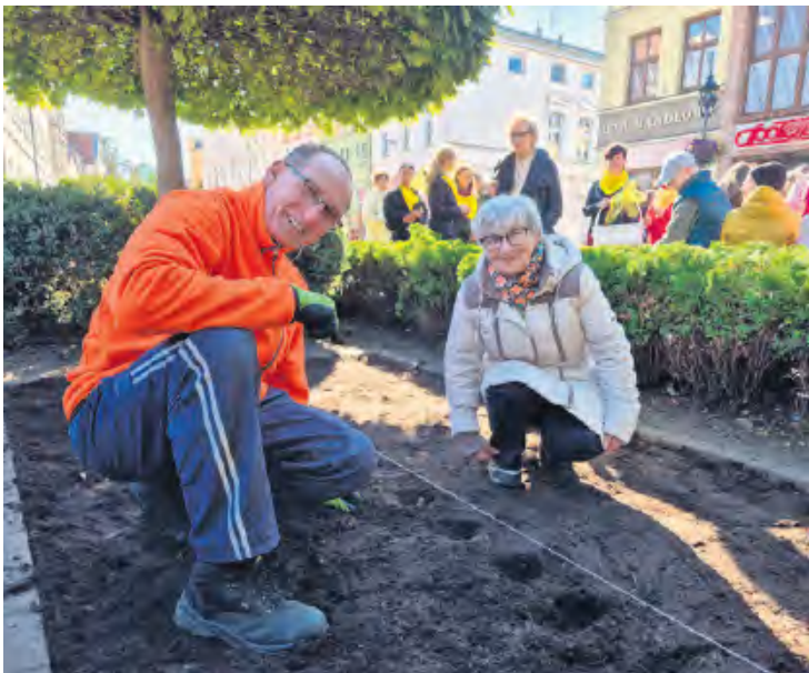
Piątkowym sadzeniem żonkili w symboliczny sposób zainaugurowano kolejną edycję opisywanej tutaj akcji charytatywnej.