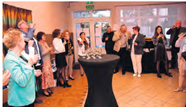
Lampką bezalkoholowego szampana wzniesiono toast, a następnie oddano się rozmowom.

– Można powiedzieć, że wreszcie znalazła swoje miejsce na ziemi. Swoją rolę, w którym książki, czytelnicy i bibliotekarze czują się doskonale. Od tamtej pory wiele się