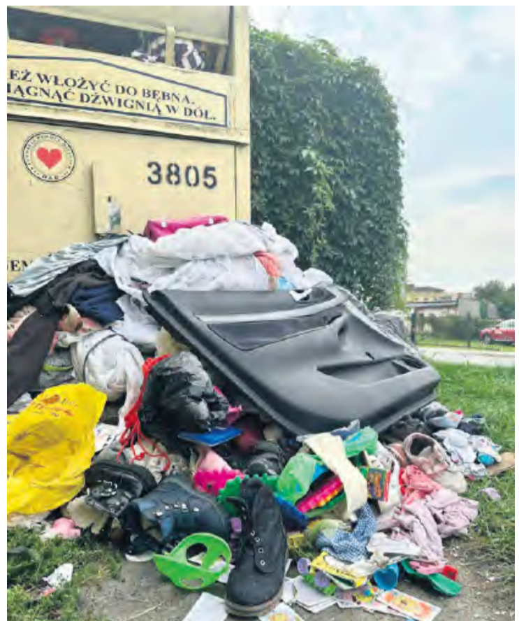
Mieszkańcy, chcąc pozbyć się tekstyliów, korzystają m.in. z pojemników na odzież. Pozostawione odpady zalegają często także w ich bezpośrednim sąsiedztwie.