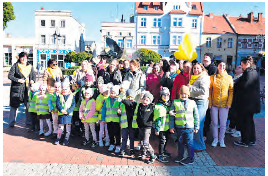
Sadzenie cebulek żonkili poprzedziło wspólne pamiątkowe zdjęcie.