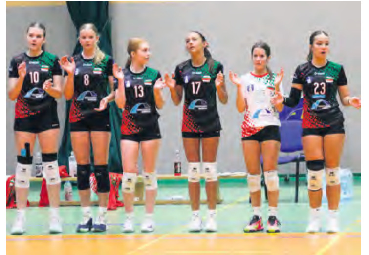
Dziewczęta przystąpiły do gry w wymienionych nastrojach.

urwała. Energia uszła z dziewcząt w bardzo krótkim czasie i rozpoczęła się znów pełna chaosu gra pod siatką. To nie był dzień tucholank, bo mimo ambicji i poświęcenia nie było zgrania na parkiecie, a Culmen dokończył tego seta z wyraźną swobodą i przewagą.