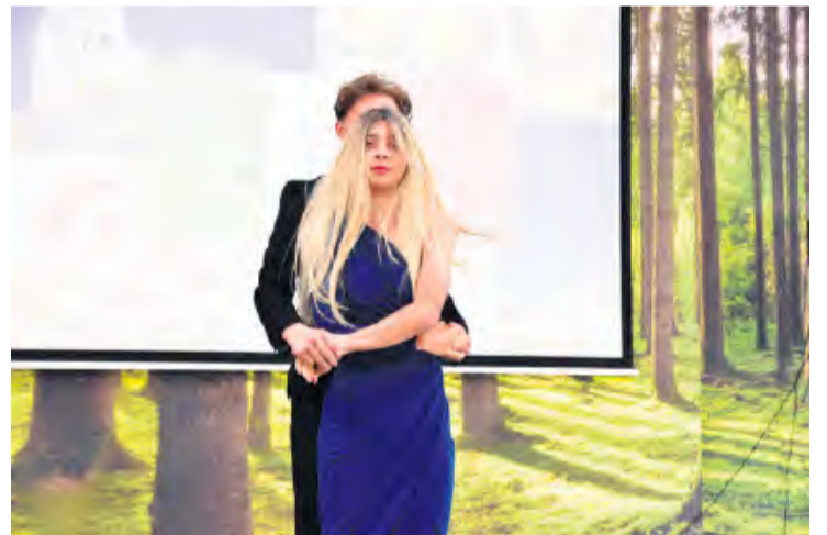
Włoski pokaz mody zrobił furorę.