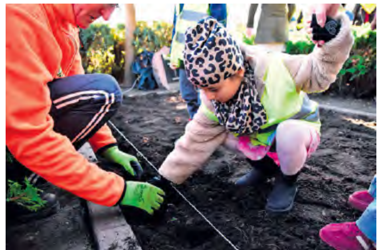
Do akcji sadzenia dołączyli przedszkolacy z Przedszkola nr 2 w Tucholi.