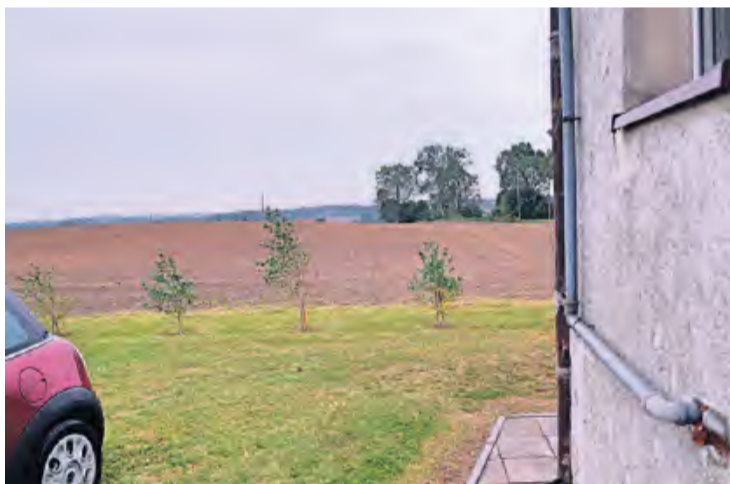
Mieszkańcy wskazywali, na których działkach – według pierwotnego planu – miałyby pojawić się instalacje. Skarżą się, że część ma być blisko zabudowań.