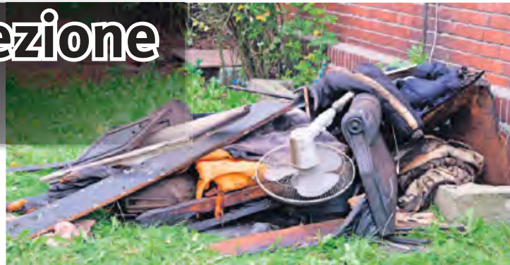
Część wyposażenia, która została usunięta z wnętrza budynku podczas akcji gaśniczej.

– Policjanci pod nadzorem prokuratora wykonali oględziny oraz przesłuchali świadków. Ciało zostało zabezpieczone celem przeprowadzenia sekcji. Wstępnie wykluczono udział osób trzecich – informuje funkcjonariusz