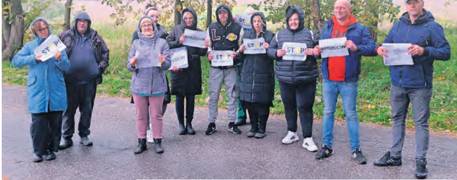
Grupa mieszkańców, która w sobotę przyszła na zebranie/protest przeciwko planom budowy potężnej farmy fotowoltaicznej. Nadmienić należy, że pod wcześniejszą petycją w tej sprawie pojawiło się niespełna 50 podpisów.