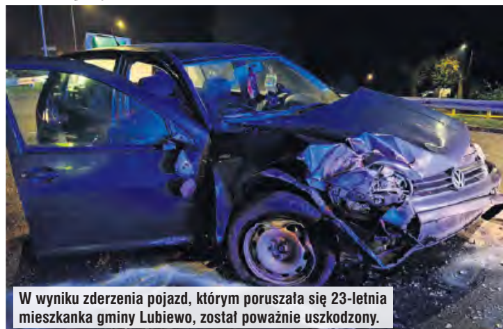
W wyniku zderzenia pojazd, którym poruszała się 23-letnia mieszkanka gminy Lubiewo, został poważnie uszkodzony.

– Prowadzone będą czynności wyjaśniające w celu ustalenia