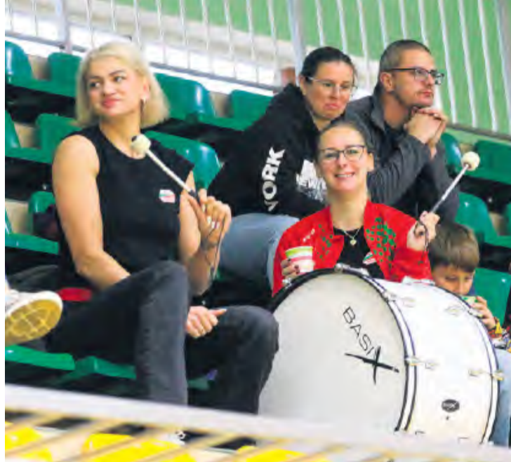
Bęben nie miał wytchnienia w całym turnieju.

bo te były w rozsypce. Mimo to klub kibica, czyli rodzice, wspierał młode sportsmenki z całych sił i hala była wypełniona hałasem bębna i okrzykami. Atak gości działał nienagannie