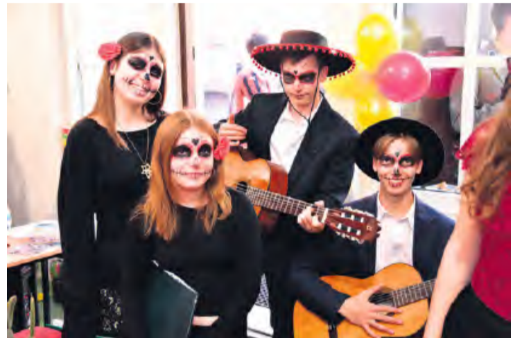
Do temperamentnej Hiszpanii nawiązała klasa I b.