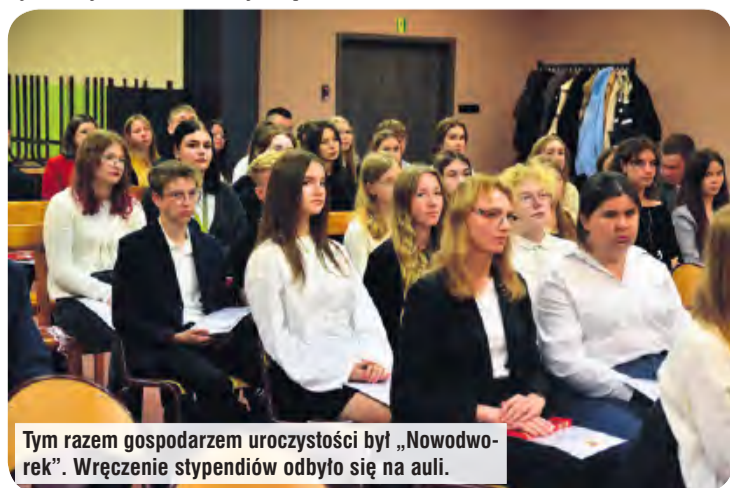
Tym razem gospodarzem uroczystości był „Nowodwórka”. Wręczenie stypendiów odbyło się na auli.