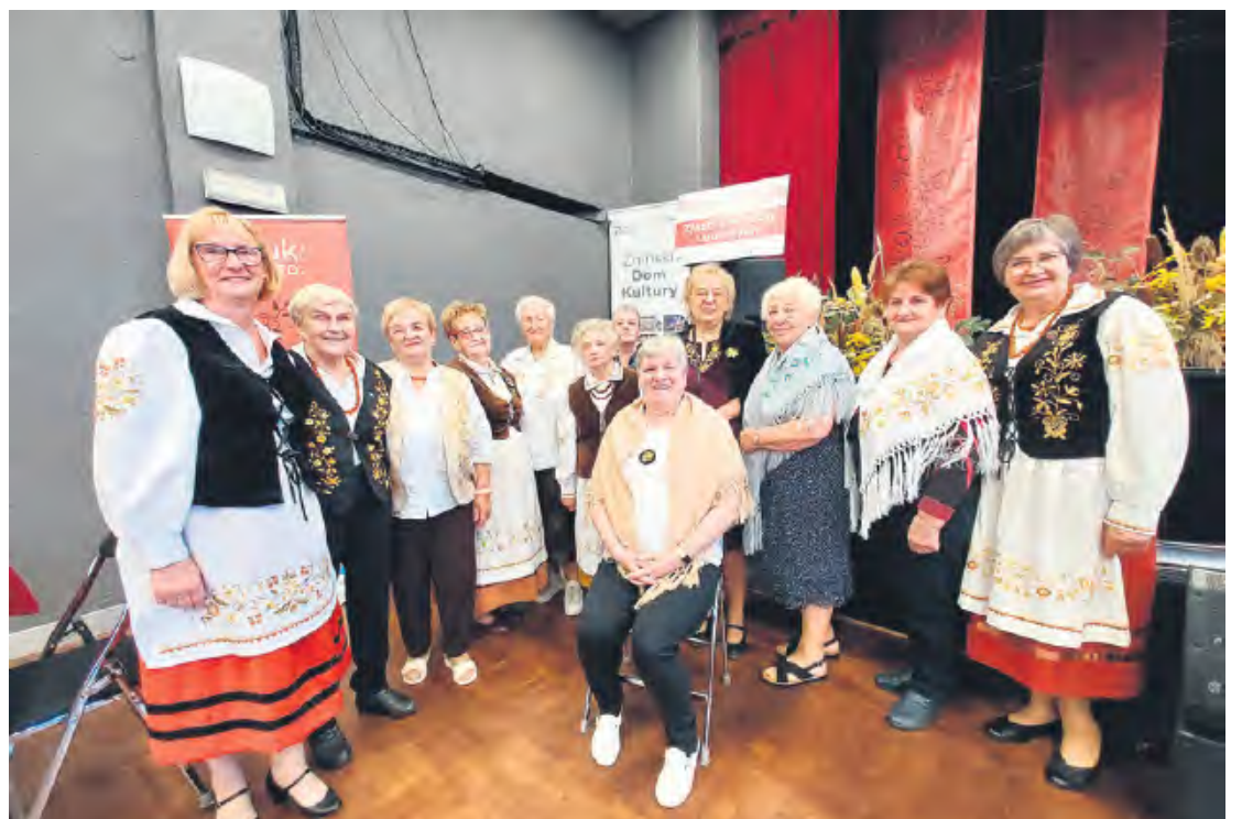
Hafciarki z Borów Tucholskich stanowiły żywą reklamę swoich prac i talentu.

Wydarzeniu towarzyszyły wybory, w trakcie których wy-