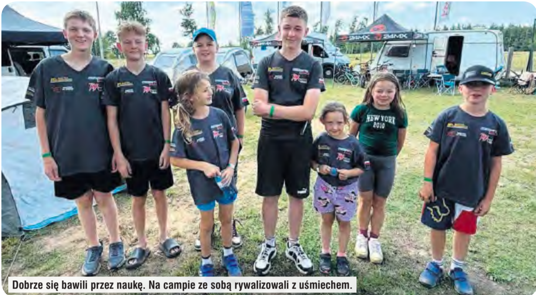
Dobrze się bawili przez naukę. Na campie ze sobą rywalizowali z uśmiechem.