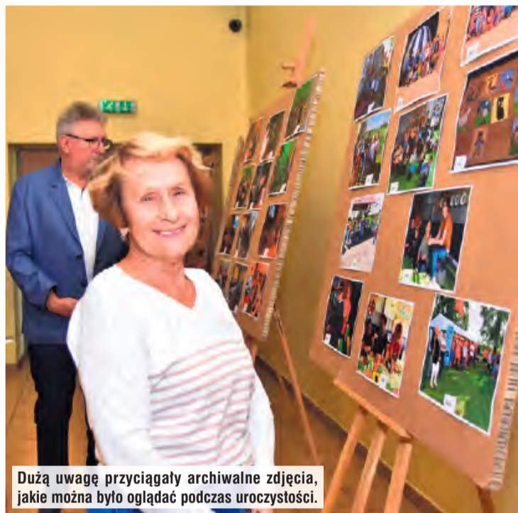
Dużą uwagę przyciągały archiwalne zdjęcia, jakie można było oglądać podczas uroczystości.

ją pracę. Z czytelnikami, którzy wracali tutaj po kolejne książki i z wszystkimi, którzy wspierali jej działalność. Dzisiejszy jubileusz, to tak naprawdę święto nas wszystkich. Biblioteka nie istnieje bez ludzi – bez tych, któ-