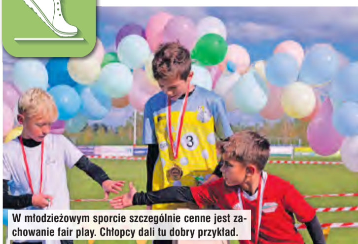
W młodzieżowym sporcie szczególnie cenne jest zachowanie fair play. Chłopcy dali tu dobry przykład.

Na raciąskim starcie stanęli zwycięzcy tucholskiego Biegu Borowiaków, który zrealizowany został tydzień wcześniej. Niektórym w Raciążu poszło gorzej, ale z drugiej strony byli i tacy młodzi sportowcy, którzy z przytupem odbili sobie dalszą pozycję z Tucholi.