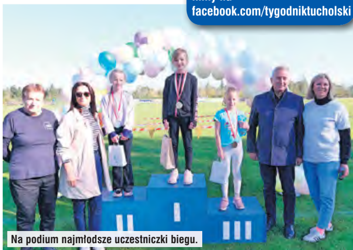
Na podium najmłodsze uczestniczki biegu.

więcej zdjęć na tygodnik.pl filmy na facebook.com/tygodniktucholski