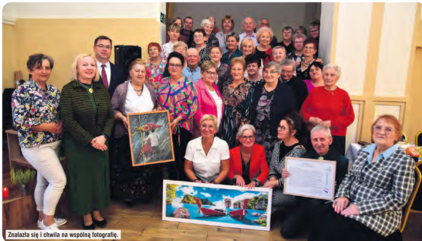
Znalazła się i chwila na wspólną fotografię.