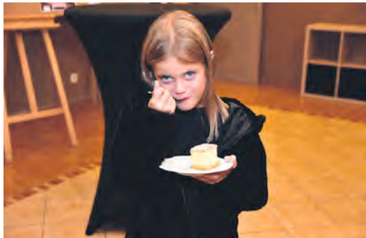
W wydarzeniu uczestniczyły dzieci i młodzież.