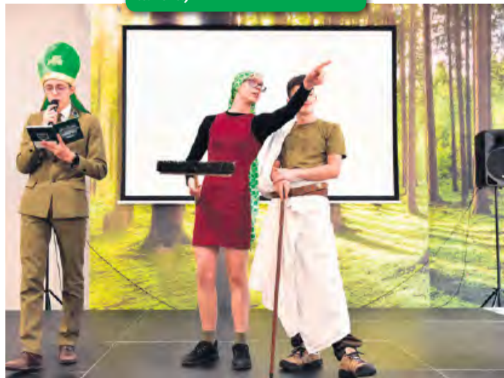
Kreatywność młodzieży po raz kolejny zaskoczyła w dobrym znaczeniu tego słowa.

W tym celu śmiało można stwierdzić, że uczniowie Technikum Leśnego wyszli z założenia: nauka przez zabawę. Każda z klas miała jedno przypisane państwo, które wymieniliśmy powyżej i zgodnie, z tym, co się kojarzy z nim, przygotowali: pla-