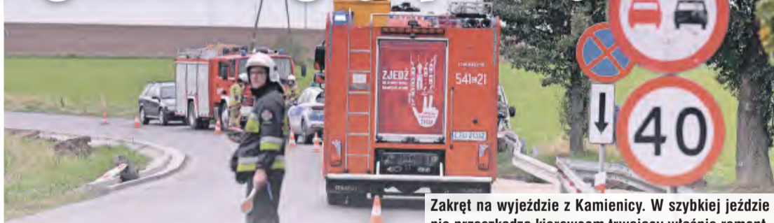
Zakręt na wyjeździe z Kamienicy. W szybkiej jeździe nie przeszkadza kierowcom trwający właśnie remont.