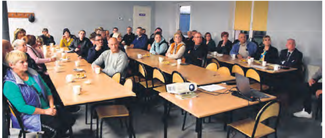
Blisko trzygodzinne zebranie wiejskie zakończone głosowaniem na „nie”. Taką decyzję podjęło 20 osób, 6 było „za”.

– Na ostatnim spotkaniu trochę mnie to przeraziło. Dodatkowo w sezonie będą wyjeżdżać też z pofermentem. Myślę, że 3/4 tych aut będzie przyjeżdżać od strony drogi wojewódzkiej i ewentualnie Świekatowa. Od nas mniej. Z ciekawości zapy-