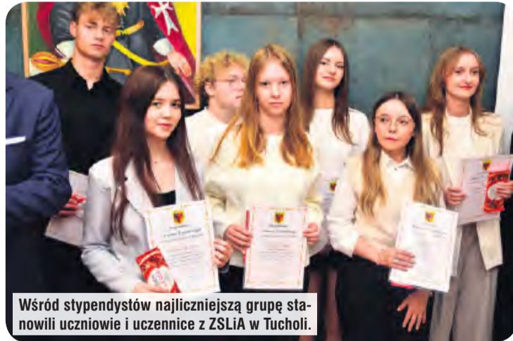
Wśród stypendystów najliczniejszą grupę stanowili uczniowie i uczennice z ZSLiA w Tucholi.

W podobnym tonie wypowiedział się również starosta, który zauważył, że współcześnie dostęp do wiedzy jest powszechny dzięki internetowi. Problemem pozostaje jednak to, że w przestrzeni cyfrowej równie łatwo jak spraw-