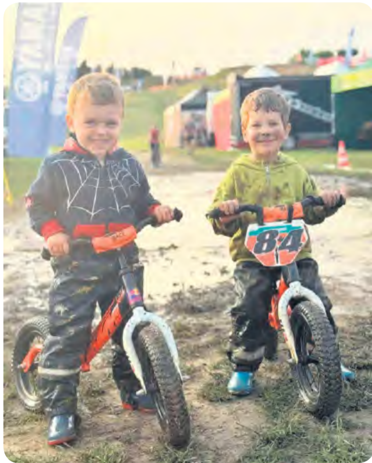
Najmłodszy miłośnicy motocrossu tymczasowo muszą zadowolić się jazdą na rowerkach.

W drugiej połowie września odbyła się ostatnia, szósta runda