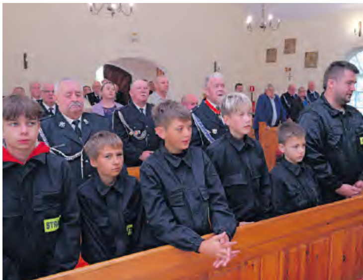
Ważna idea ochotniczej straży pożarnej. Poszczególne pokolenia przekazują wiedzę młodszym.