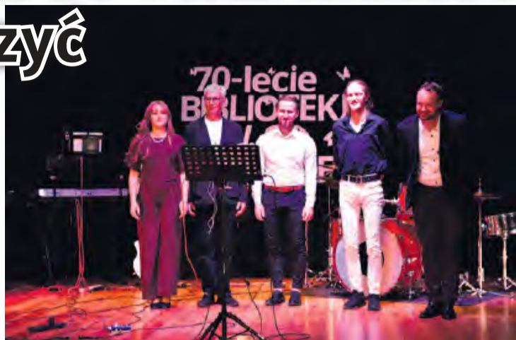
Koncert zespołu MelodyBand zachwycił każdą z osób siedzących na widowni.

zmieniło. Biblioteka to nie tylko półki pełne literatury – to przestrzeń spotkań, warsztatów, wystaw, dyskusji. To miejsce, w którym, najmłodszy robią swoje pierwsze czytelnicze kroki, młodzież rozwija swoje pasje a starsi odnajdują wspomnienia z dawnych lat. To miejsce, w którym słowo pisane łączy się z kulturą, sztuką i ludzkimi historiami. I wiecie państwo, co jest w tym wszystkim najpiękniejsze? Że przez te wszystkie lata biblioteka tworzyła swoją historię z ludźmi. Z bibliotekarzami, którzy z pasją wykonywali swo-