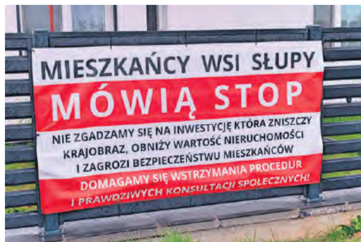
Zarówno w dolnej i górnej części Słupów pojawiły się banery protestacyjne.

– Nie chcemy przesunąć instalacji. Chcemy, aby w ogóle odstąpiono od tej inwestycji w Słupach pod naszymi domami – ostro apelowali mieszkańcy. Planowany obiekt nazywali stosem plastiku, który przesłoni na kilka dekad tradycyjny, wiejski krajobraz. Zresztą wyrażali też obawy, co stanie się za 30 lat, gdy panele będą podlegać utylizacji. Mieli wątpliwość, kto miałby się tym zająć. Głośno zastanawiali się, czy firma będzie istnieć.