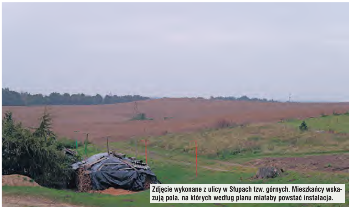
Zdjęcie wykonane z ulicy w Słupach tzw. górnych. Mieszkańcy wskazują pola, na których według planu miałyby powstać instalacje.

Inwestor przekonuje też, że krótkotrwały transport odby-