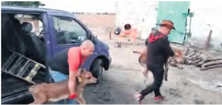
Pierwsze cielaki Agroza dostarczyła pokrzywdzonemu rolnikowi 17 września.

Rolnicza społeczność nie zostawiła go jednak w potrzebie. 17 września do mieszkańca Wtelna