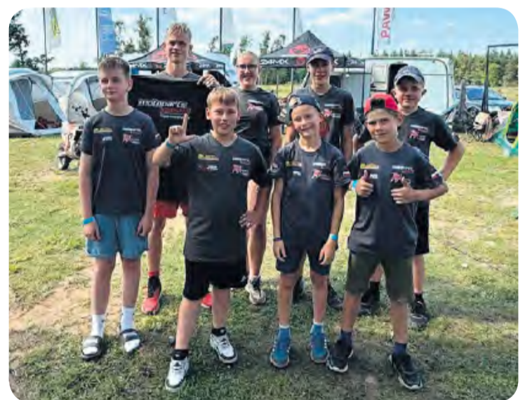
Jedna z trzech drużyn uczestniczących w obozie.