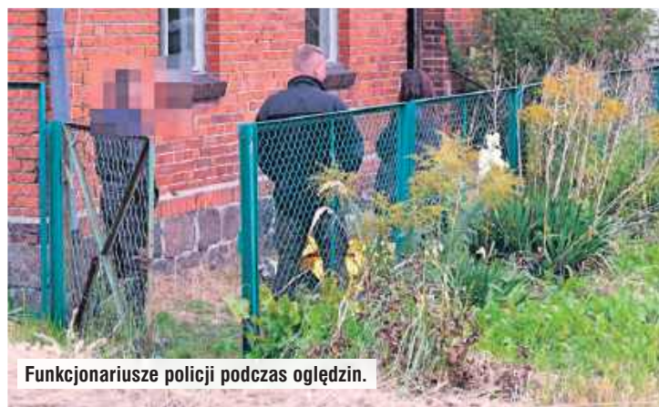
Funkcjonariusze policji podczas oględzin.