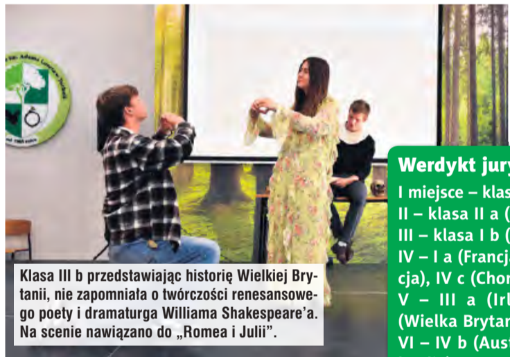
Klasa III b przedstawiając historię Wielkiej Brytanii, nie zapomniała o twórczości renesansowego poety i dramaturga Williama Shakespeare'a. Na scenie nawiązano do „Romea i Julii”.