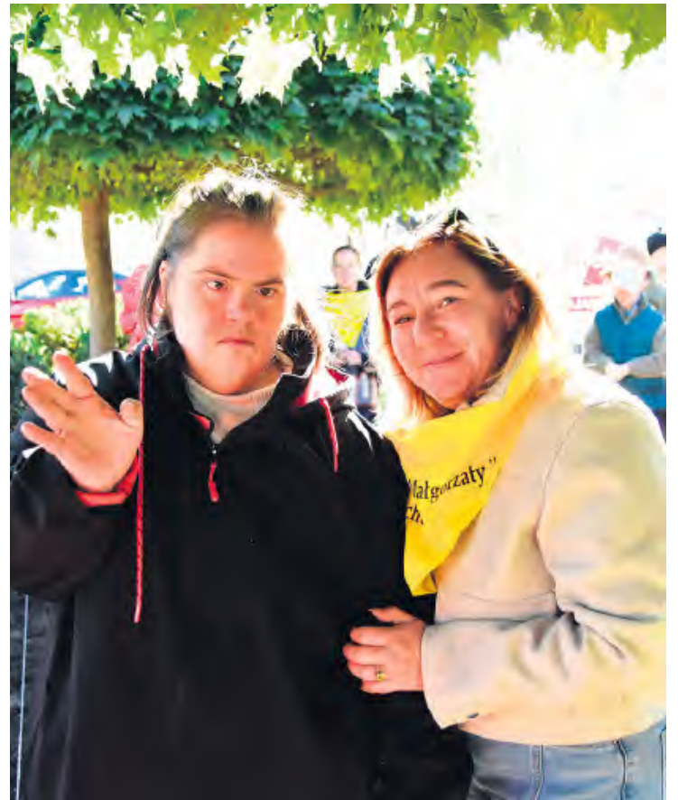
Podopieczni Warsztatów Terapii Zajęciowej z zaangażowaniem wsparli tucholskie hospicjum.