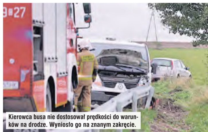
Kierowca busa nie dostosował prędkości do warunków na drodze. Wyniosło go na znanym zakręcie.

Mieszkanka Kamienicy przyznaje, że ustawienie barier nieco poprawiło sytuację. Wcześniej