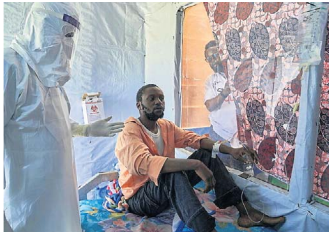
15 maja władze DRK ogłosiły wybuch 17. epidemii eboli w kraju od czasu wykrycia tej choroby w 1976 r.