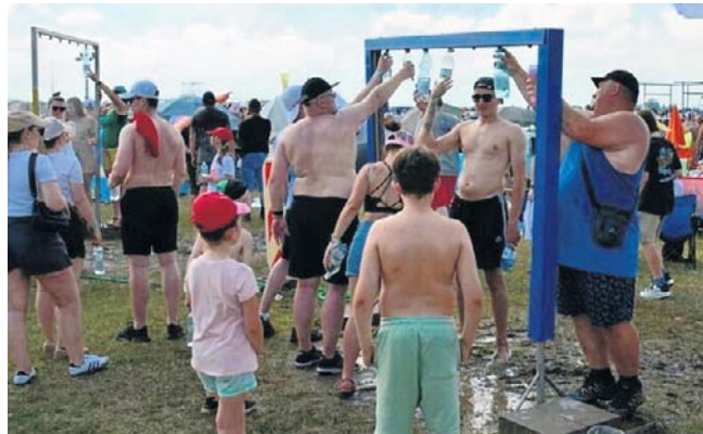
W sobotę na leszczyńskim lotnisku największą popularnością cieszyły się punkty z wodą

Sobotnie pokazy rozpoczęły się wcześniej niż początkowo zakładano, około godziny 12. Wszystko ze względu na pogodę, która znów mogła się zalać. Organizatorzy ogłosili w pewnym momencie alert, pokazy szybko zostały wznowione. Wisienką na torcie był sobotni, wieczorny finał.