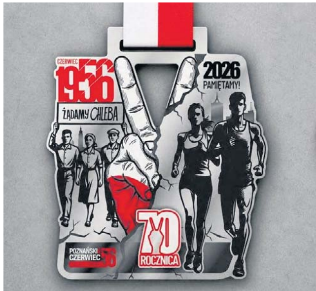
Hasło „Żądamy chleba” znalazło się na medalach tegorocznego Biegu Poznańskiego Czerwca 56

Z możliwością zastrzeżenia praw autorskich do hasła „Żądamy chleba” nie spotkał się dotąd poznański oddział IPN. Dokumenty i zdjęcia z tym napisem są często wykorzystywane w działalności edukacyjnej instytucji. - Trudno napisać te słowa wyłącznie