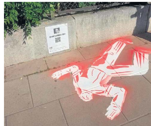
Akcja dedykowana jest głównie młodym ludziom, którzy za pomocą kodów QR zwrócą uwagę na historię

- Gdyby ktoś chciał przejść cały szlak z grafikami, odwiedzając wszystkie i kierując się mapą umieszczoną na stronie FB Teatru Ósmego Dnia, to powinien zarezerwować sobie czas około godziny, na taką niecodzienną lekcję historii - mówi Szymon Bojdo. - W przyszłości warto pomyśleć też o innych symbolicznych formach upamiętniania tych, co tu zginęli.