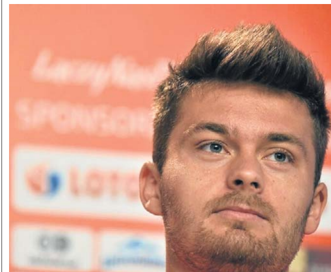
Karol Linetty aktywował klauzulę w swoim kontrakcie i czeka na rozwój wydarzeń

Pierwszy mecz II rundy eliminacji Ligi Mistrzów z mistrzem Danii, Aarhus GF zaplanowany jest na wtorek 21 lipca. ©©