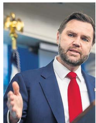
J.D. Vance przybył do Szwajcarii w niedzielę

W skład irańskiej delegacji wchodzi m.in. główny negocjator i przewodniczący parla-