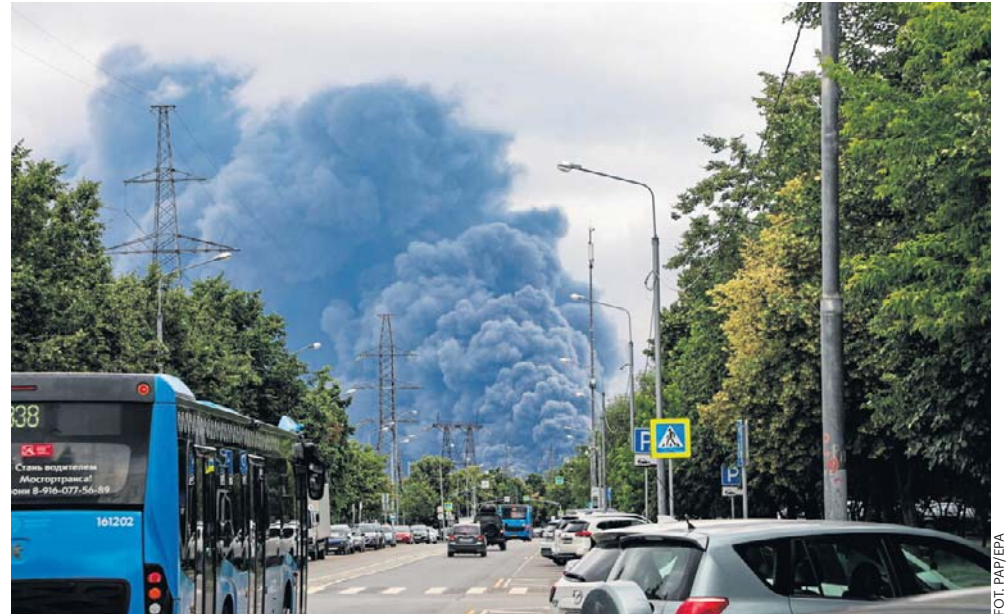
Ukraińskie ataki dronowe na Moskwę i okupowany Krym powodują braki w dostawach paliw. Mieszkańców obowiązują zakazy lub całkowite ograniczenia

W sobotę ukraińska armia przeprowadziła ataki z wykorzystaniem dronów na obiekty