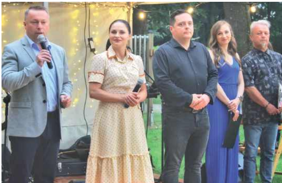
Wydarzenie rozpoczęło oficjalne powitanie przybyłych mieszkańców