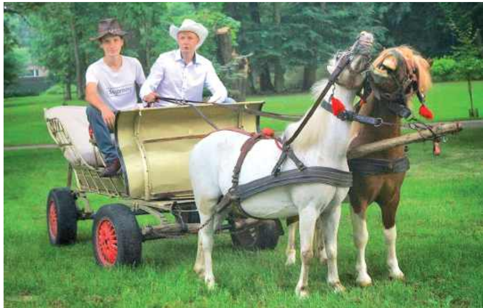
Chętni mogli przejechać się dorożką

Łęczna: W niedzielę (27 lipca) zespół dworsko-parkowy Podzamcze w Łęcznej zamienił się w przestrzeń pełną historii, muzyki i lokalnych tradycji. Wszystko za sprawą historycznego pikniku pod hasłem „Niedziela u Blocha”.