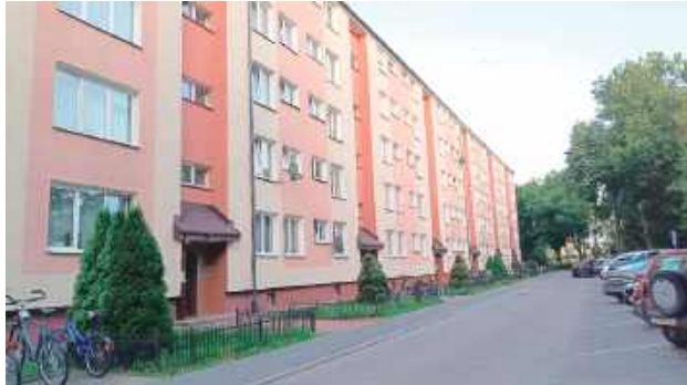
To w tym bloku dokonano makabrycznego odkrycia

Jak informuje puławska policja, z jednego z mieszkań wydobywał się brzydki zapach. Mieszkańcy zawiadomili spółdzielnię. Przekazali jednocześnie, że mieszkającego w nim sąsiada nie widzieli od kilku dni. Prezes spółdzielni powiadomił o tym fakcie policję. Pod wskazany adres udał się policyjny patrol. Niestety pukanie do drzwi i nawo-