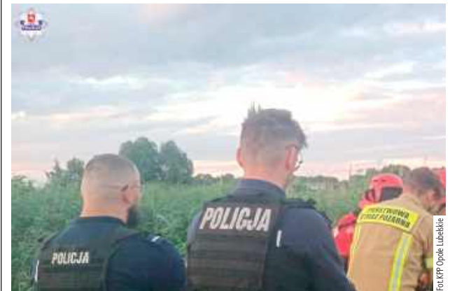
kierowani na miejsce strażacy przy użyciu łodzi wydobyli na brzeg zwłoki mężczyzny, które znajdowały się w odległości 20 metrów od brzegu