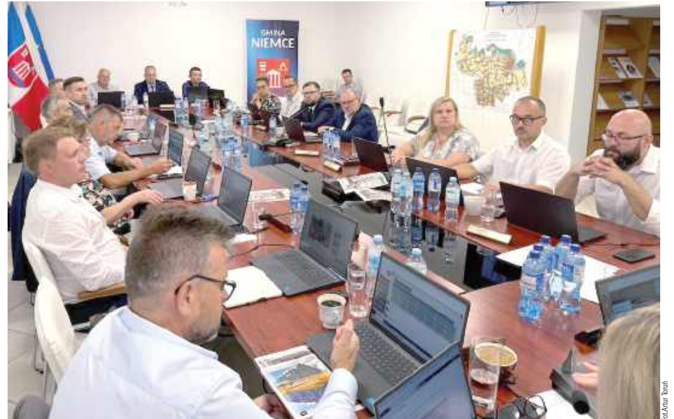
Obrazy ostatniej sesji Rady Gminy Niemce trwały dwa dni

Za radnymi gminy Niemce długa i momentami burzliwa sesja. Po dwudniowych obradach odrzucono blisko 400 uwag do „Studium uwarunkowań i kierunków zagospodarowania przestrzennego”, a sam dokument został uchwalony w formie przedstawionej przez władze gminy.