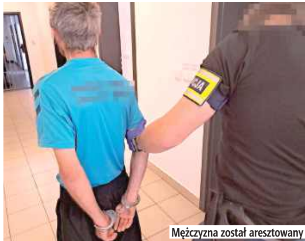
Mężczyzna został aresztowany

- Jednak w toku prowadzonego postępowania okazało się, że