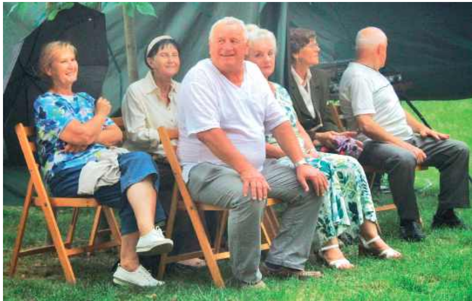
Mimo deszczowej aury humor dopisywał mieszkańcom