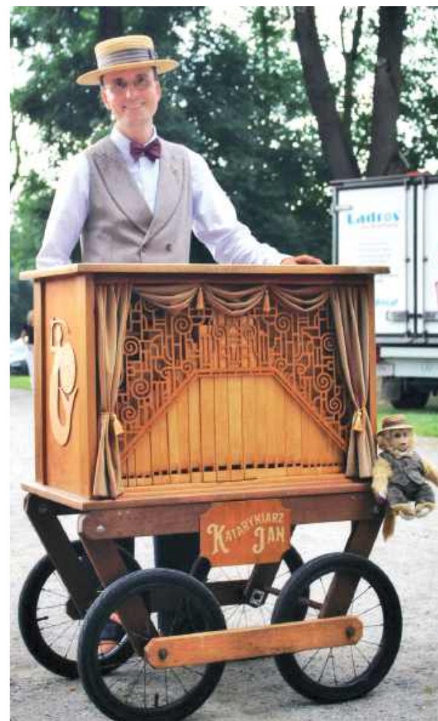
W parku można było spotkać kataryniarza