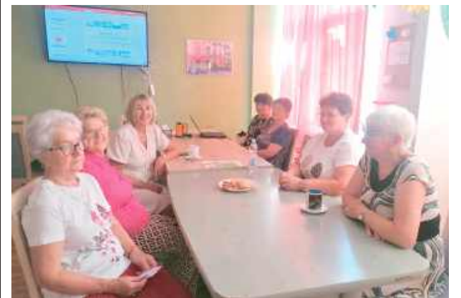
Spotkanie stanowiło drugą część cyklu wirtualnych spacerów po powiecie realizowanych przez Klub Seniora

23 lipca odbyło się 25. spotkanie klubu czytelniczo-dyskusyjnego „Seniorzy z książką na ty” funkcjonującego przy Powiatowej Bibliotece Publicznej w Łęcznej.