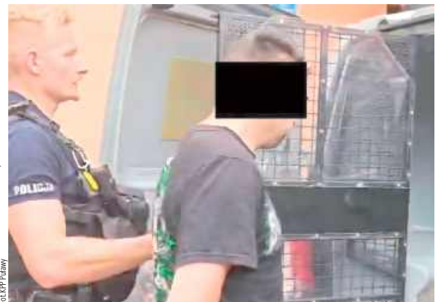
28-latek usłyszał szereg zarzutów, m.in. wytworzenia środków odurzających w znacznej ilości oraz przygotowania do wprowadzenia ich do obrotu