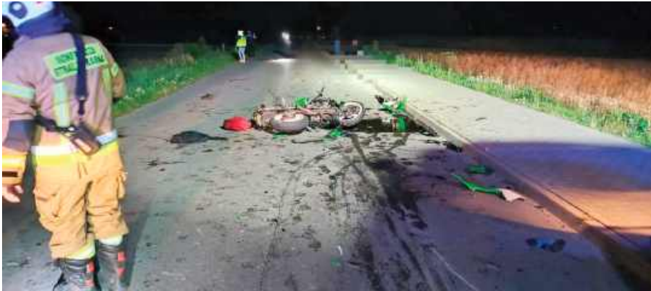
Motocyklista podróżował z 26-letnim pasażerem

- Ze wstępnych ustaleń policjantów wynika, że 22-letni kierowca motocykla Kawasaki podróżujący wraz z 26-letnim pasażerem najechał na nieoświetlony opryskiwacz podczepiony pod ciągnik rolniczy Ursus jadący w tym samym kierunku. Następnie oderwane elementy motocykla uszkodziły przedni zderzak jadącego w przeciwnym kierunku pojazdu Skoda. Kierujący motocyklem z obrażeniami ciała został przetransportowany śmigłowcem Lotniczego Pogotowia Ratunkowego do szpitala w Lublinie. Z kolei pasażer trafił