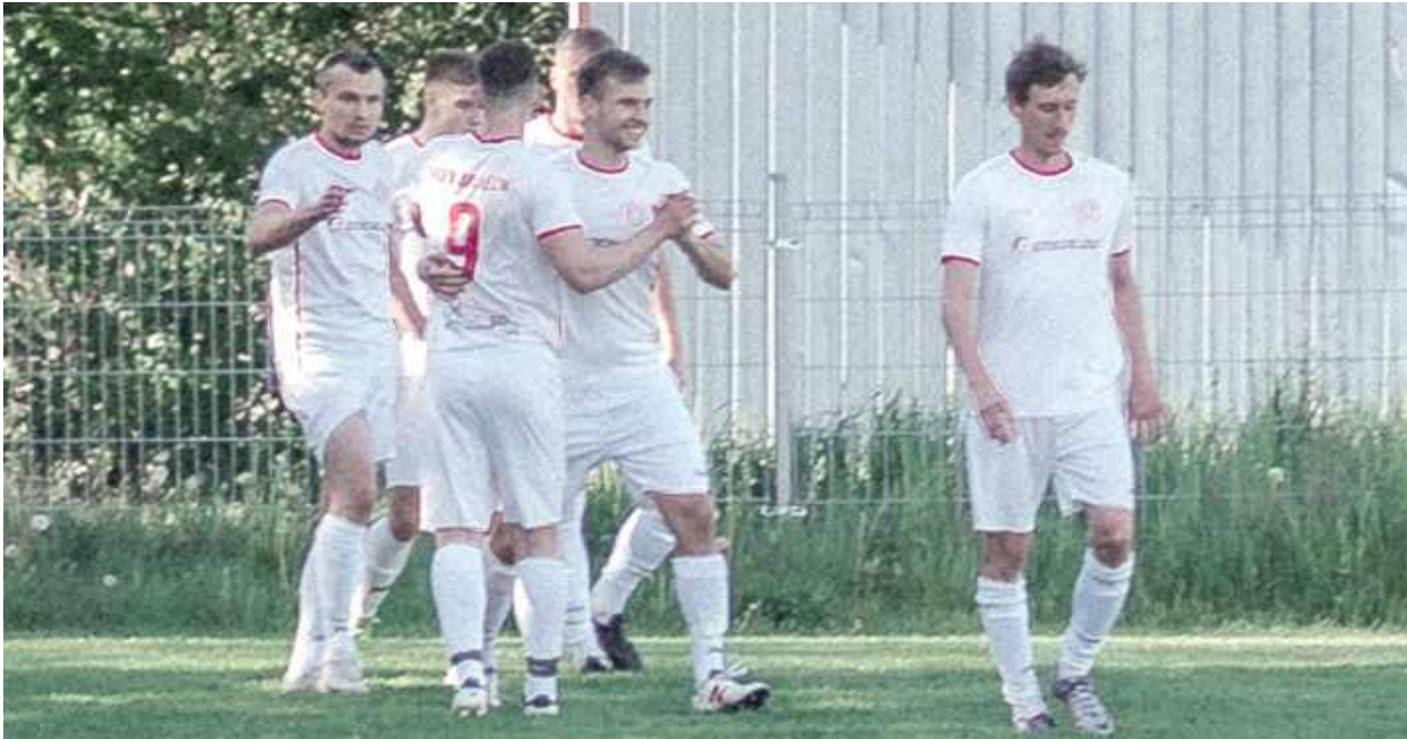
Zespół Wiary w drugiej połowie kompletnie odmienił losy meczu i wygrał w Garbowie 5:3