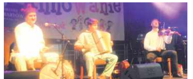
Do tańca przygrywała Kapela z Borówka