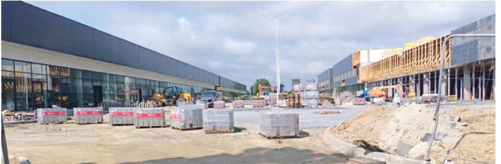
Targowa Park - na miejscu widać przygotowania do układania parkingów, zamontowane zostały szyby wystawowe

W południowej części Lubartowa równolegle realizowane są dwie inwestycje handlowe. Przy ulicy Targowej trwa budowa centrum sprzedażowego Park Targowa, natomiast przy Lubelskiej powstaje kompleks trzech nowych obiektów handlowo-usługowych na terenach po dawnym Tesco o podobnej nazwie - Citi Park. Obydwa przedsięwzięcia znacząco wpływają na przekształcenie przestrzeni miejskiej i przeniesienie osi handlowej na południową część miasta.