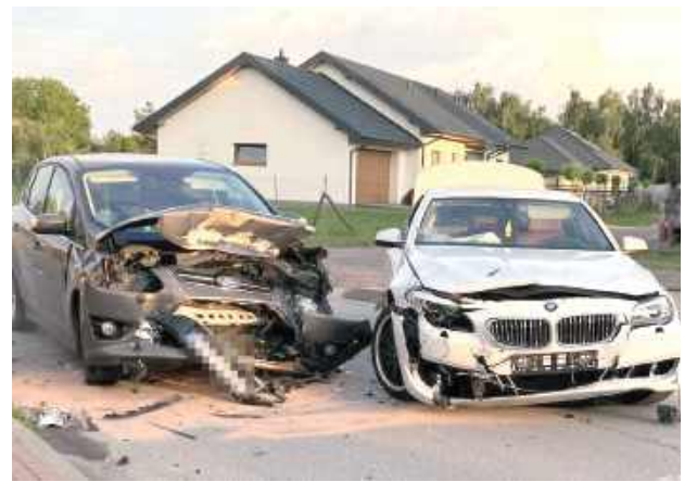
Po zderzeniu BMW i Forda do szpitala zostały przewiezione trzy osoby. Dwie zostały wypisane po badaniach, a w przypadku jednej medycy zdecydowali o hospitalizacji

Kierująca BMW nie ustąpiła pierwszeństwa kierowcy Forda. Okoliczności zdarzenia wyjaśnia puławska policja.