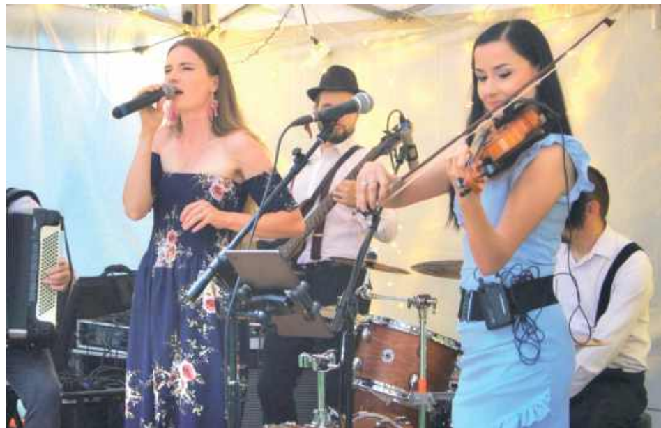
Na miejscu postuchać można było muzyki na żywo