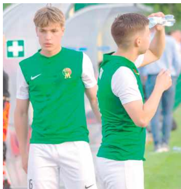
Tur po bardzo dobrym meczu pokonał Ładę Biłgoraj 5:3. Sparing rozgrywano w formacie 4x30