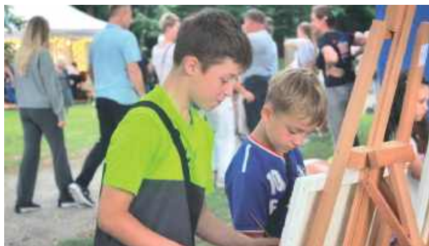
Dzieci mogły namalować własny obraz