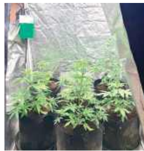
Część konopi znajdowała się w specjalnym namiocie, reszta stała na zewnątrz

- Jest podejrzany o uprawę konopi innych niż włókniste w ilości mogącej dostarczyć znacznej ilości ziela konopi innych niż włókniste, wytworzenie środków odurzających w znacznej ilości oraz przygotowanie do wprowadzenia ich do obrotu - wymienia rzeczniczka puławskiej policji.