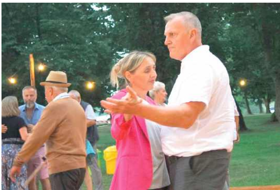
Wiele osób wzięło udział w potańcówce

Na odwiedzających czekały również liczne atrakcje o charakterze edukacyjnym i rekonstrukcyjnym. Słowiński Gród z Wólki Bieleckiej prezentował codzienne życie dawnych Słowian – można było zobaczyć pokazy łucznic-