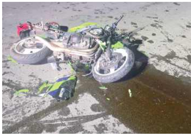
Motocyklista podróżował z 26-letnim pasażerem