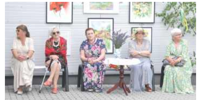
Nie mogło zabraknąć kawiarenki i ciepłych rozmów