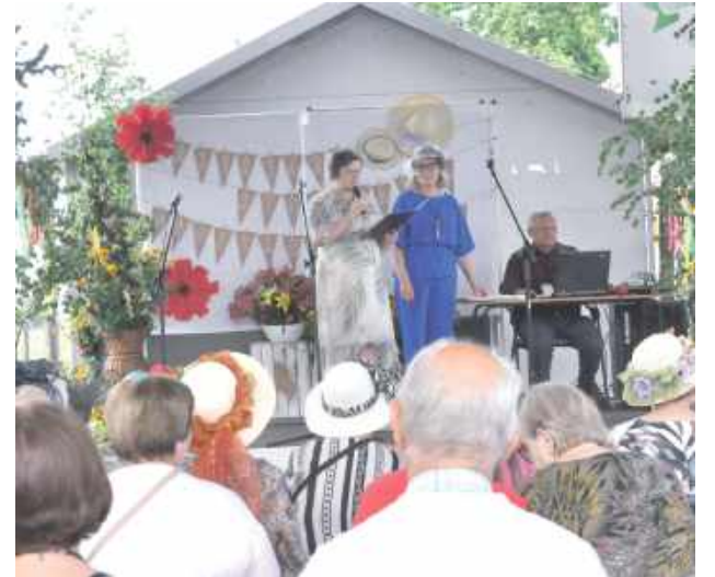
Dopisała pogoda oraz frekwencja