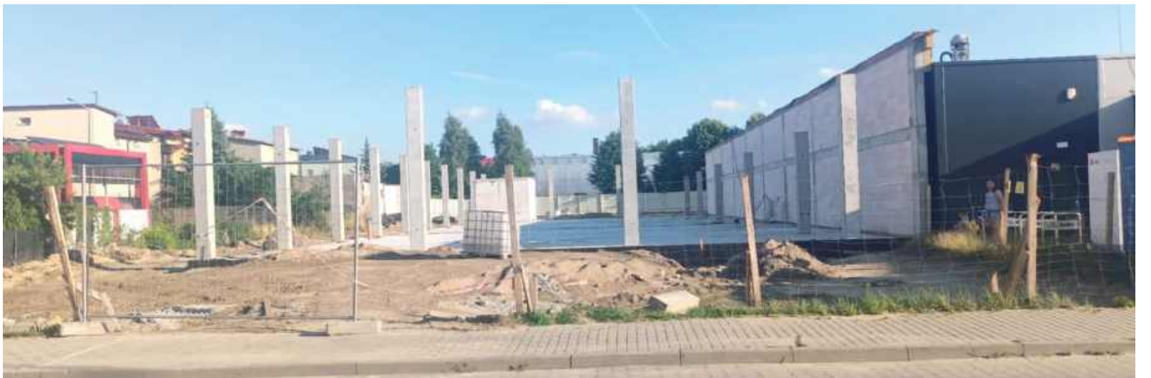
Citi Park - inwestycja realizowana jest w sąsiedztwie obecnego sklepu Netto, na działkach po dawnym Tesco