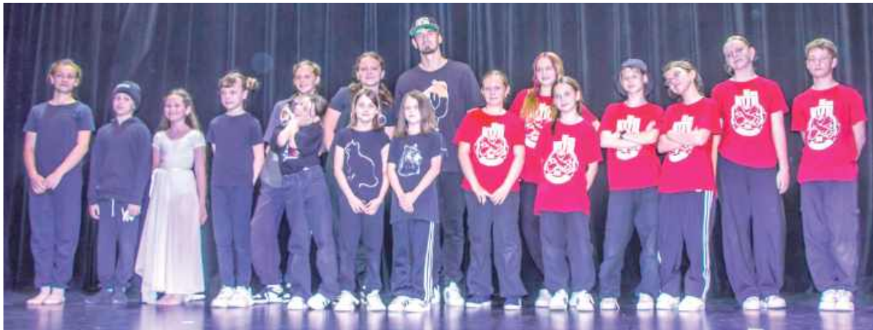
Wydarzenie zakończyło sezon 2024/2025 dla formacji breakingu w GOK Milejów