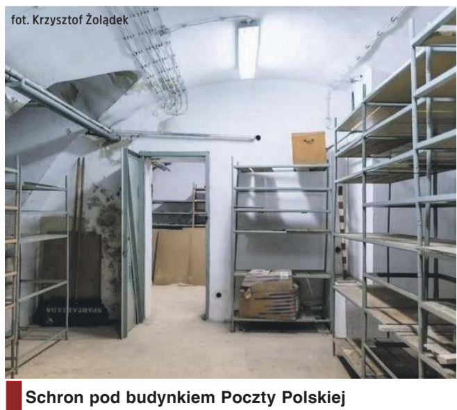
Schron pod budynkiem Poczty Polskiej