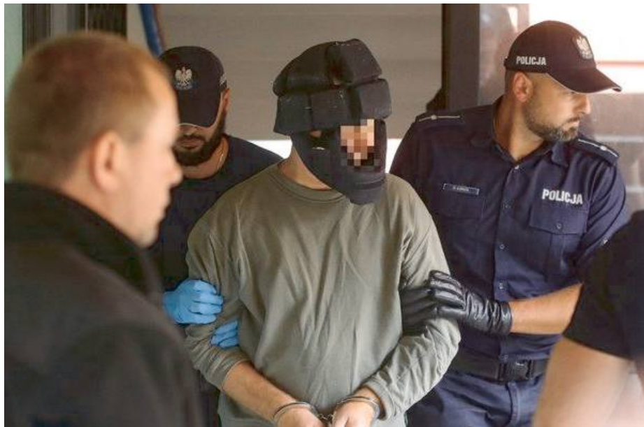
45-letni mieszkaniec Siedlec usłyszał zarzut zabójstwa.