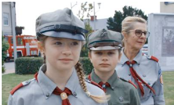
W miejskich obchodach wzięli udział między innymi harcerze.