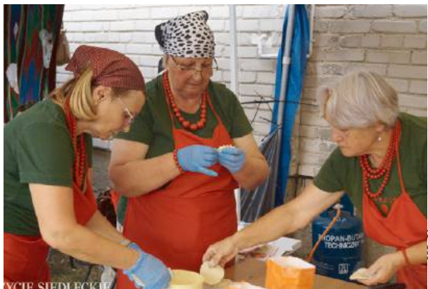
Konkurs na najlepsze pierogi był kluczowym punktem programu.

Festiwal Pieroga to jednak nie tylko kulinarna uczta. To przede wszystkim okazja do integracji mieszkańców, wymiany doświadczeń, a także do wspólnej zabawy.