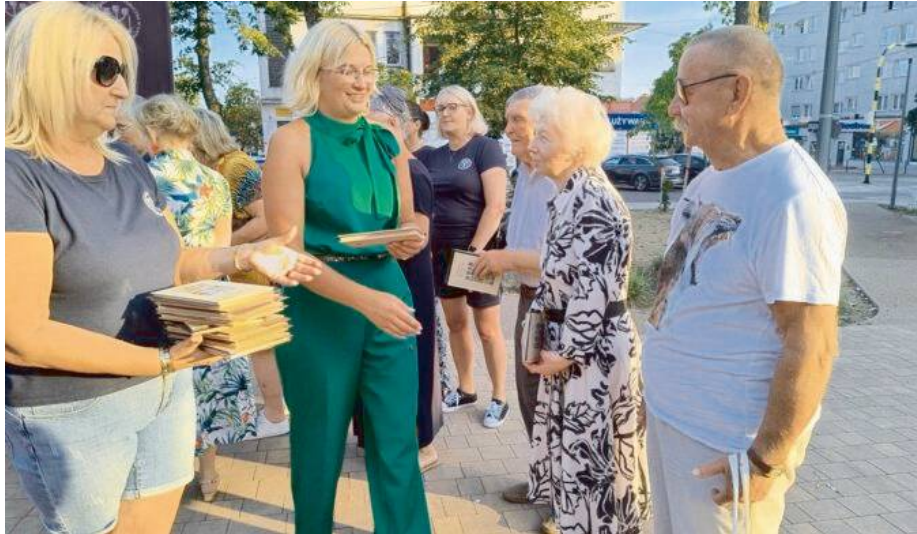
Leksykon cieszył się ogromnym powodzeniem wśród mieszkańców

- Na druk „Leksykonu Garwolińskiego” pozyskaliśmy dotację w wysokości 31 815,00 zł z Samorządu Województwa Mazowieckiego ze środków Unii Europejskiej w ramach poddziałania objętego Programem Rozwoju Obszarów Wiejskich na lata 2014-2020. Całkowity koszt projektu wyniósł 50 000,00 zł. W ramach tego budżetu otrzy-