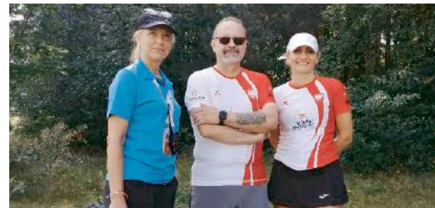
Praca zespołowa dodaje siły i napędu do walki.

Ogromne gratulacje i brawa dla obojga Vice-Mistrzów Świata.