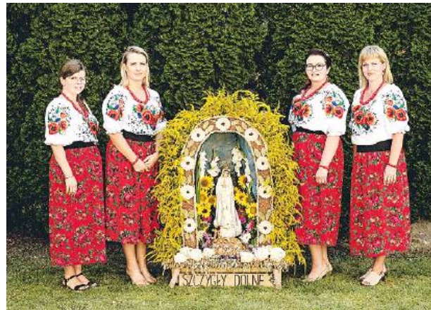
W konkursie na najładniejszy wieniec jury oceniło 19 kompozycji. Doceniono kompozycje z Zalesia, Szczygłów Górnych i Krynki.

Tradycyjnym punktem święta plonów było rozstrzygnięcie