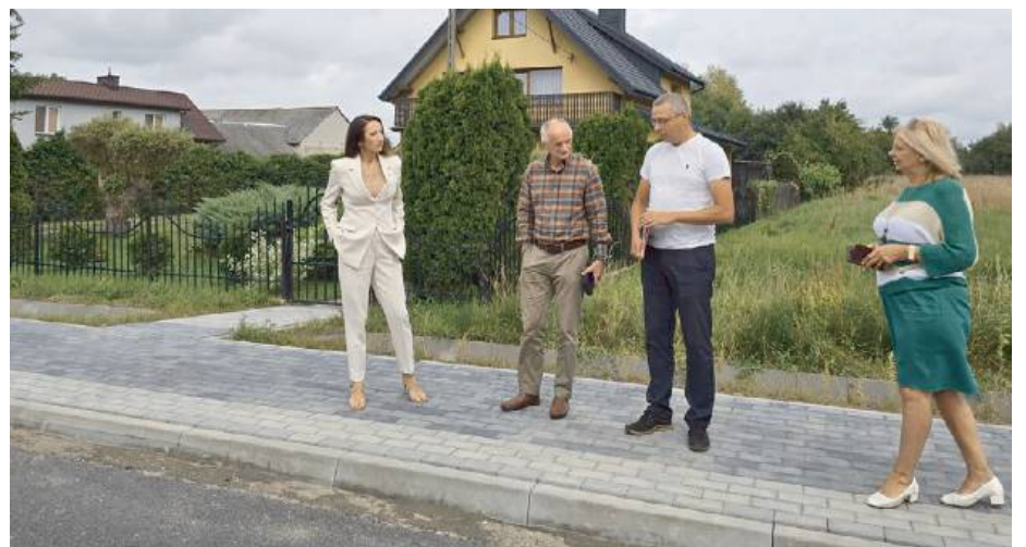
Inwestycje drogowe obejmują obecnie teren kilku miejscowości i gmin

Kwota wszystkich wymienionych inwestycji to blisko mln zł, w tym: Fundusz Ochrony Gruntów Rolnych - 200 000 zł; środki własne powiatu: 2 486 172,7 zł; Rządowy Fundusz Rozwoju Dróg - 2 473 802,88 zł; Polski Ład - 34 175 426,12 zł; Gmina Górzno - 400 000 zł. MAT.OPRAC.