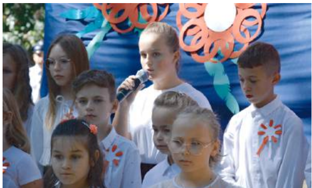
Akademii przygotowała Szkoła Podstawowa w Radzikowie Wielkim.