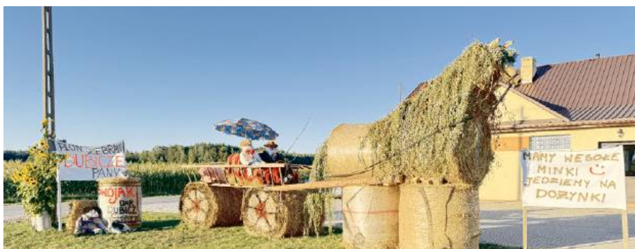
Pomysłowość wykonanych prac przerosła najsmielsze oczekiwania.

Widać było ogrom pracy i zaangażowania włożonego w ich realizację, dlatego po niezwykle trudnych obradach komisji konkursowej, która w swojej ocenie kierowała się kryteriami