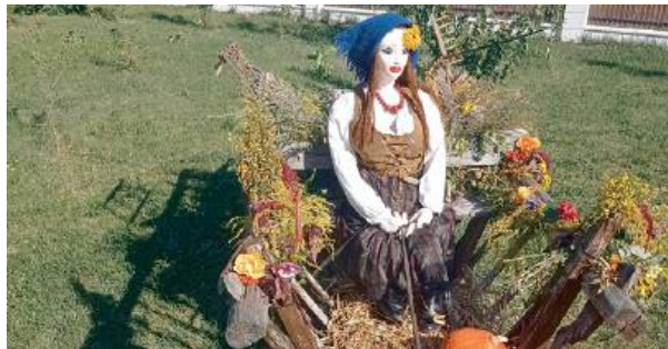
Nawiązanie do tradycji rolniczej były ważnym elementem prac.