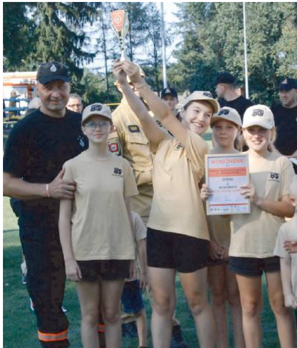
Młodzieżówka również pokazała klasę!

z OSP Wielgorz i to oni będą reprezentować miasto i gminę na zawodach powiatowych, które odbędą się w wrześniu w Siedlcach. Drugie miejsce zajęła OSP Czeplielin, trzecie - OSP Mordy. Na czwartej lokacie uplasowała się OSP Stara Wieś, piąte miejsce zajęła OSP Radzików Wielki, a szóste - OSP Wojnow. Brawa należą się dla wszystkich! Również dla MDP Radzików Wielki, która pokazała siłę młodzieżowego zapалу.