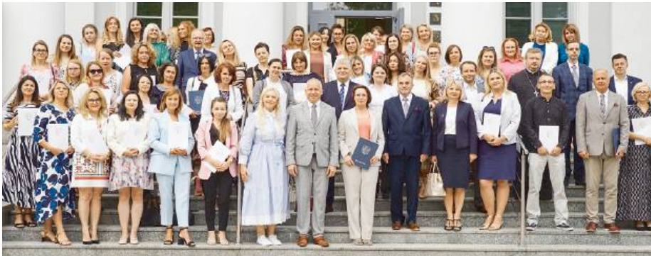
Podczas uroczystości wręczono akty nadania stopnia awansu zawodowego nauczyciela mianowanego.

nych konkursów od 1 września 2024 r. pracę na stanowisku dyrektora będą kontynuowali: