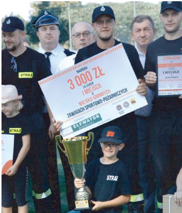
OSP Wielgorz zwyciężyła w zawodach

Zawody Sportowo-Pożarnicze odbywają się w dwóch konkurencjach. Pierwsza to sztafeta z przeszkodami (7x50 metrów). Oprócz szybkości, liczy się tu sprawność, bowiem trzeba przebiec przez ławeczkę (na której nie łatwo utrzymać równowagę!) oraz pokonać tzw. ściankę. Drugą konkurencją to ćwiczenia bojowe. Na czym polegają? - Na sprawieniu węży ssawnych, podłączeniu ich do motopomp i podaniu wody na dwie rotacje. Jedną z nich strąca