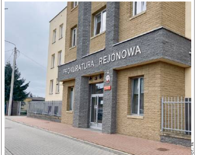
Czy tej tragedii dało się uniknąć?