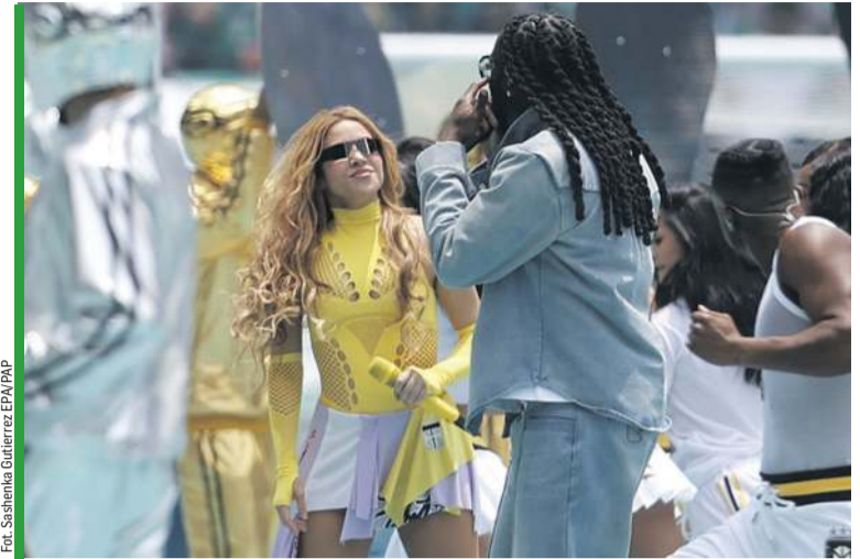
Shakira na mundialu zaśpiewała już po raz czwarty.