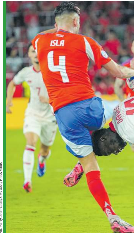
Nie da się ukryć, że w ostatnim czasie gw... gruntu po nogami...

A w międzyczasie mistrzowie Bundesligi dopinają transfer lewego obrońcy reprezentacji Niemiec. Za niecałe 65 mln euro (już z bonusami) biorą z Eintrachtu Frankfurt trzy lata młodszego Nathaniela Browna. Co będzie z Davie-