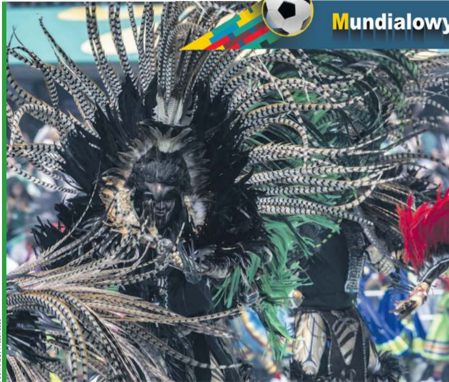
Meksykańska ceremonia otwarcia była bajecznie kolorowa, ale miała i niepokojący pierwiastek diabelstwa.

M eksyk to kraj kontrastów – zachwycającej cywilizacji, starożytnej kultury i niezwykłej... brutalności. Pięciu meksykańskich policjantów straciło życie w strzelaninie w stanie Michoacan, kontrolowanym przez jeden z najgroźniejszych karteli narkotykowych świata. Mrok śmierci nad Azteca nie dotarł. Tam było hałaśliwie, barwnie, błyszcząco. Uroczystość otwarcia mundialu zawsze przyciąga gwiazdy. Na Estadio Azteca, przed meczem Meksyku z Republiką Południowej Afryki, też oczywiście się pojawiły. Wszystkich – a mnie na pewno – zachwycała „Santánico Pandemonium”. Pamiętacie „Od zmierzchu do świtu” w reżyserii Roberto Rodriguez z szalonym scenariuszem Quentina Tarantino?! Trudno uwierzyć, że ten niezwykły film powstał