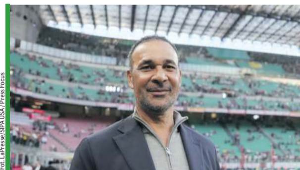
Ruudowi Gullitowi nie podoba się, co FIFA robi z mistrzostwami świata.