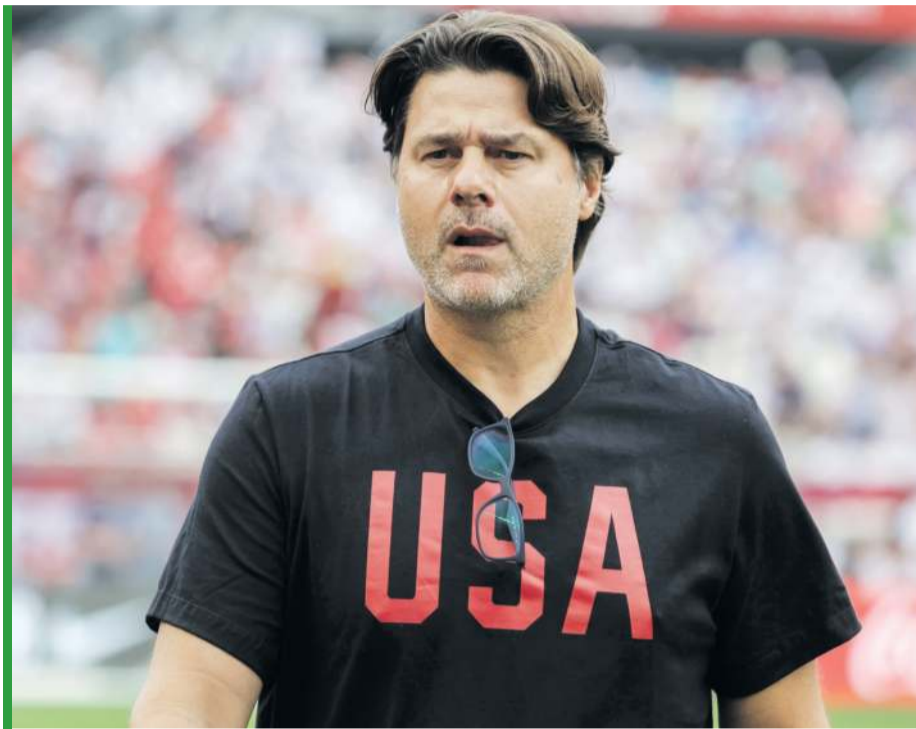
Argentyński szkoleniowiec żyje marzeniem o sukcesie.

Reprezentacja Stanów Zjednoczonych jest lekceważona przed startem mistrzostw świata. I nie ma w tym oczywiście nic dziwnego – przez lata w piłce nożnej Amerykanie niczego nie osiągnęli. Cały świat naśmiewa się z nich, choćby z bardzo prostego powodu, że na piłkę nożną mówią soccer, a nazwa „futbol” zarezerwowana jest dla tego „amerykańskiego”. Piłka nożna nie jest dla Amerykanów czymś naturalnym. Profesjonalna liga piłkarska powstała w tym kraju w 1993 roku i to tylko dlatego, że taki był wymóg FIFA przed mundialem w 1994 roku. Nie jest też dla większości kibiców sportem numer jeden, choć oczywiście popularność dyscypliny z roku na rok rośnie. Nadal jest jednak za plecami wspomnianego futbolu amerykańskiego czy koszykówki. Tylko 10 procent Amerykanów uważa soccer za swoją ulubioną dyscyplinę. MLS się rozwija, ale nadal dla najlepszych piłkarzy liga ta pozostaje miejscem na spędzenie cie-