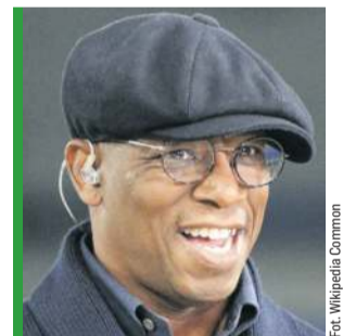
Ian Wright to byłby świetny napastnik Arsenalu, teraz ceniony piłkarski ekspert.

Do całej sytuacji odniósł się w swoich mediach społecznych Ian Wright, świetny napastnik Kanonierów w latach 90., reprezentant Anglii – 33 mecze, 9 bramek. – Co kilka godzin pojawia się kolejna historia o tym, jak to kibice nie wjechali do USA, zawodnikom odmówiono wiza, sędziogo odrzucono. To samo tyczy dziennikarzy. Śmieję się, ale