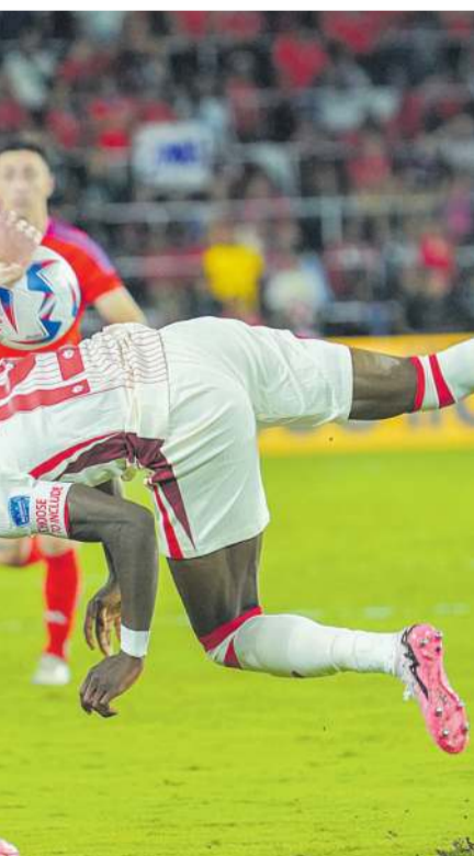
Wjazdor kanadyjskiej reprezentacji stracił