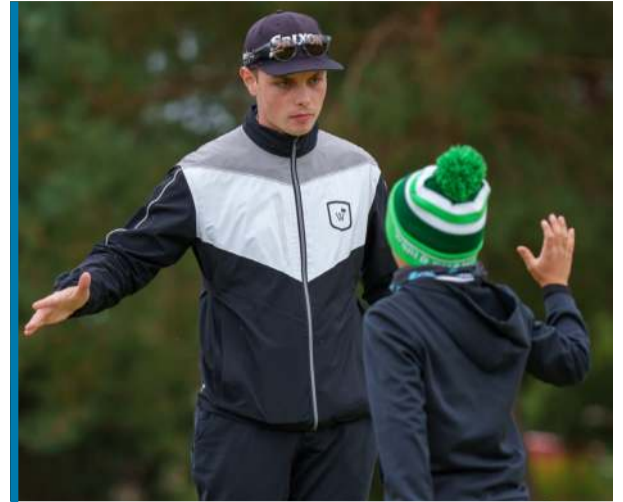
Bo dobry trener to podstawa!