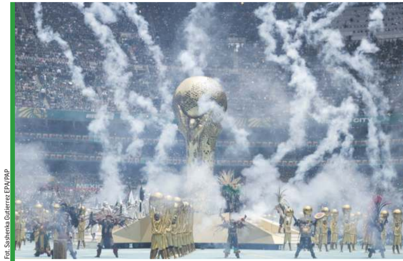
Ceremonia otwarcia amerykańskiego mundialu była krótka i treściwa.