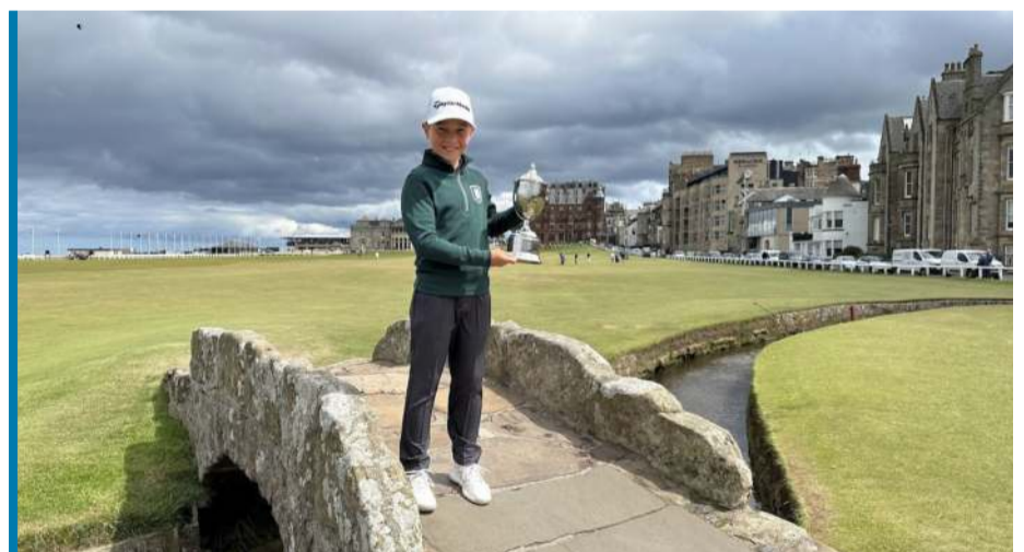
Trofeum pojechało też na Old Course w St. Andrews