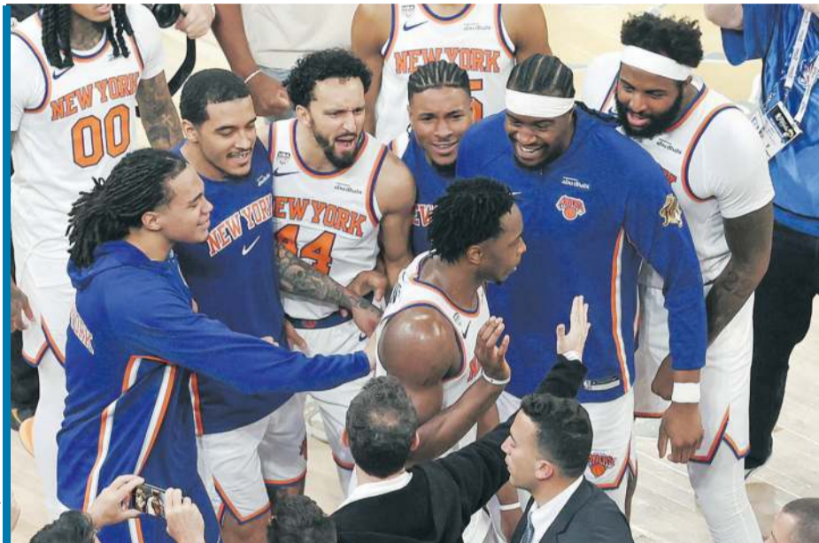
Knicks wygrali przegrany mecz, więc mieli prawo cieszyć się tak, jakby już zdobyli tytuł!

Teksańczycy tego meczu jednak nie wygrali. Knicks przetrwali nawałnicę, ro-