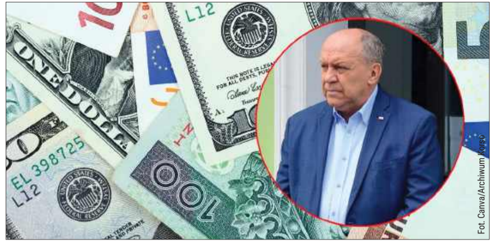
Nie tylko złotych. Jaki majątek zgromadził poseł z Kolbuszowej?

Swoją działalność samorządową rozpoczął w latach 90., kiedy zaangażował się w lokalne życie polityczne w Kolbuszowej. W latach 1994–2002 zasiadał w Radzie Miasta i Gminy Kolbuszowa. W 1990 roku został kierownikiem wydzia-