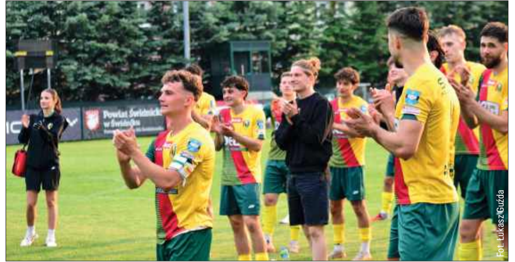
Sokół Kolbuszowa Dolna oficjalnie utrzymał się w Betclie 3. Lidze.

Drużyna z Kolbuszowej Dolnej na wiosnę zdobyła 26 punktów i w tabeli rundy wiosennej