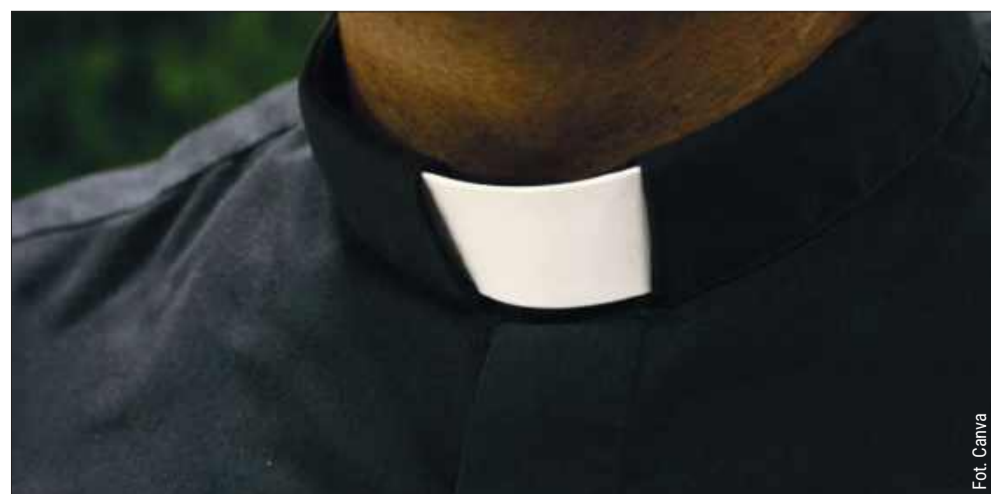
Zmiany w powiecie kolbuszowskim są niewielkie, ale istotne dla wiernych.