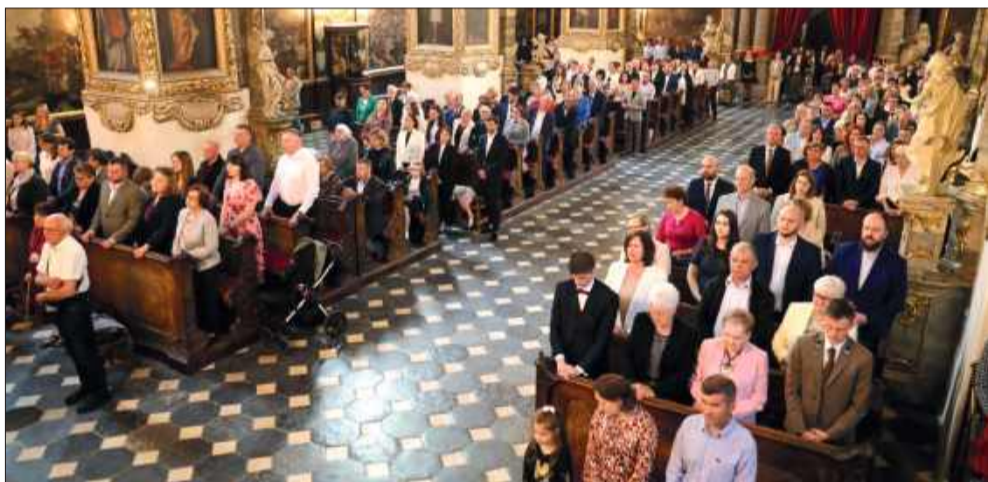
Diakonom towarzyszyli ich najbliżsi. Kościół wypełnił się wiernymi.