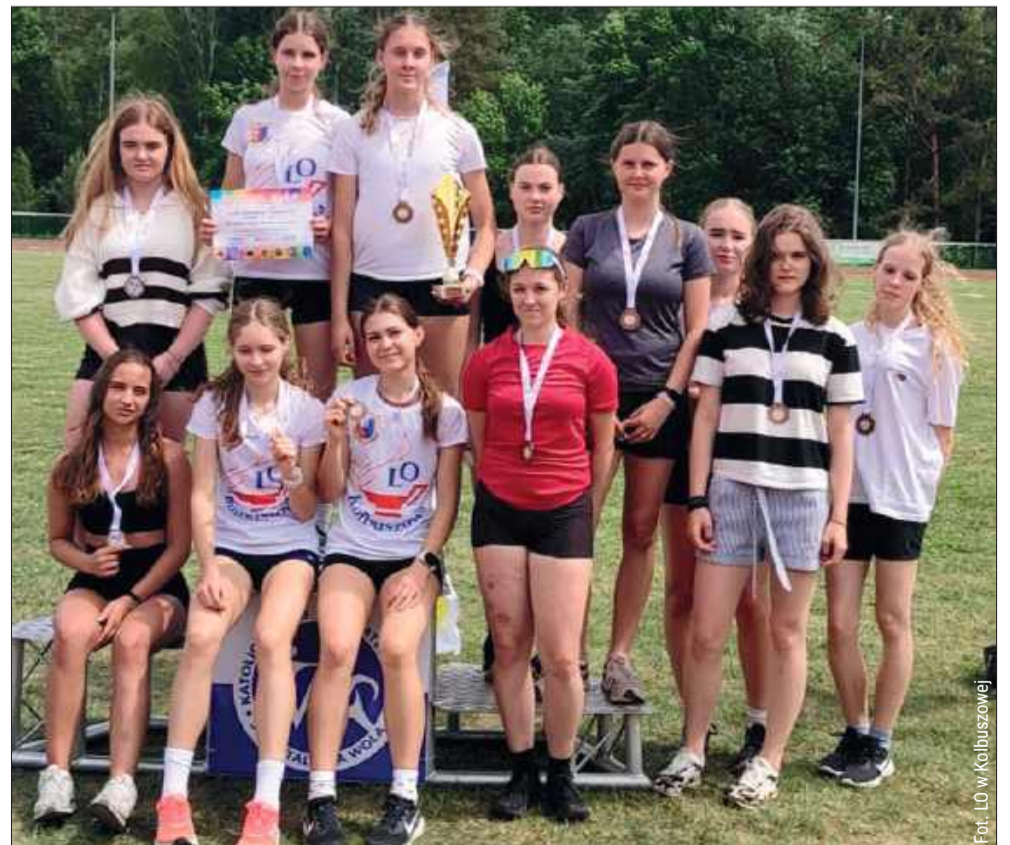
Uczennice Liceum w Kolbuszowej zdobyły brązowe medale podczas finału Szkolnej Korespondencyjnej Ligi Lekkoatletycznej.