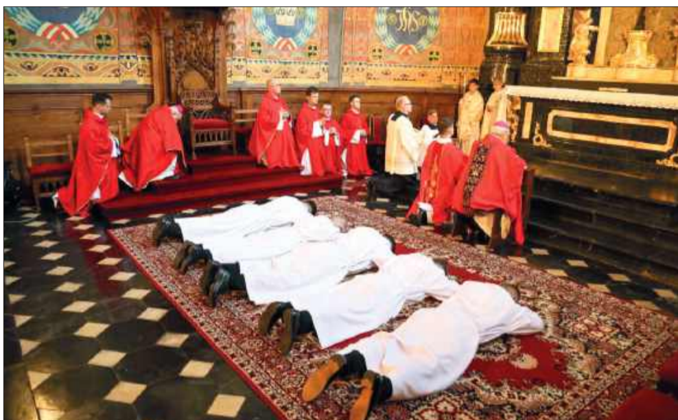
Leżenie krzyżem w kościele podczas obrzędu święceń diakonatu nazywa się prostracją. Jest to gest całkowitego uniesienia przed Bogiem, oddania się do Jego dyspozycji oraz wyraz gotowości do służby.