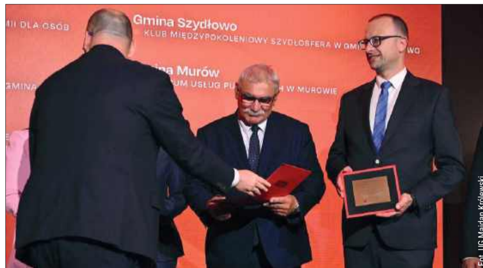
Wyróżnienie odebrał Jerzy Wilk, wójt majdańskiej gminy.

„Brzostowe Wzgórze” powstało z myślą o osobach z niepełnosprawnościami. Dziś wspiera 20 osób - 18 korzysta z pobytu dziennego, a 2 mieszkają tam na stałe.