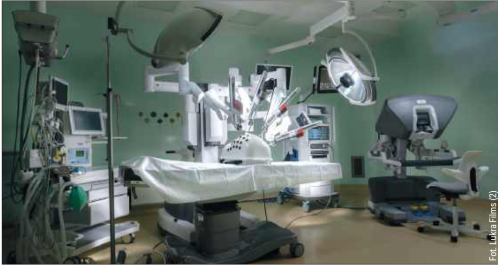
Tak wygląda robot da Vinci w całej swojej okazałości.