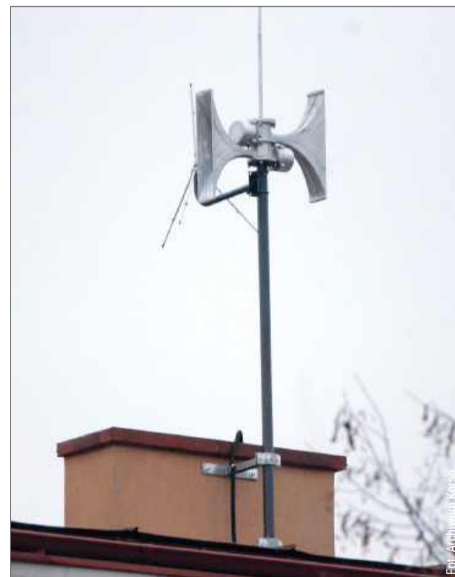
W powiecie zrobi się głośno.

Służby informują o zagrożeniach na kilka sposobów: przez syreny, megafony, radio i telewizję, internet, Regionalny System