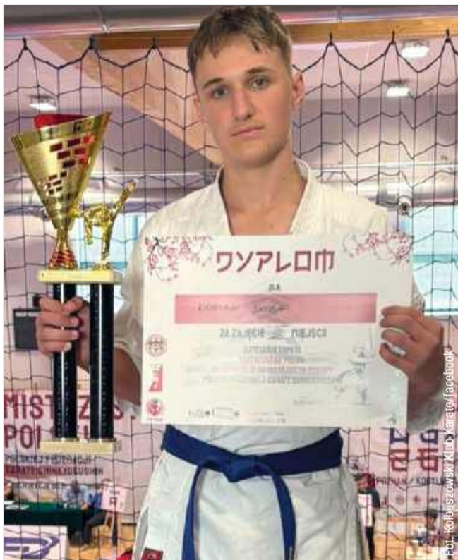
Karateka z Kolbuszowej zdobył brązowy medal Mistrzostw Polski.