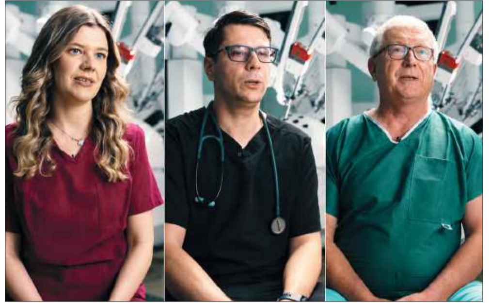
Lekarze opowiadają, jak teraz wygląda praca w kolbuszowskim szpitalu.

To przedsięwzięcie to nie tylko oszczędności, ale przede wszystkim inwestycja w bezpieczeństwo i zdrowie mieszkańców Powiatu Kolbuszowskiego.