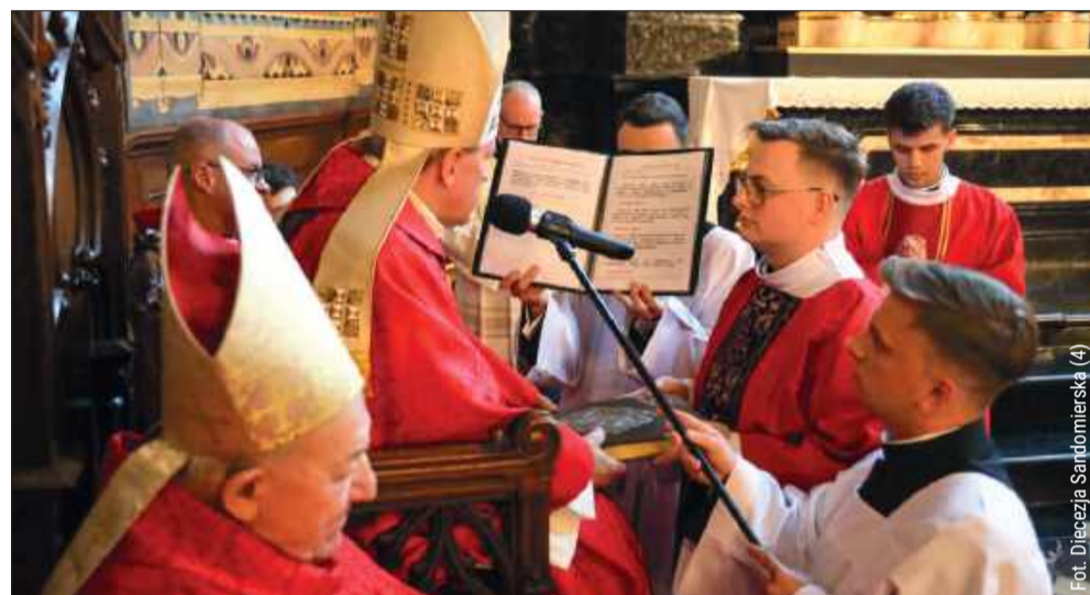
Po homilii kandydaci złożyli m.in. przyrzeczenie posłuszeństwa.