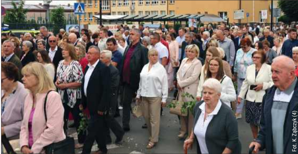
Fot. K. Ząbczyk (4)

W czwartek (4 czerwca) mieszkańcy powiatu kolbuszowskiego wzięli udział w uroczystościach Bożego Ciała. Tłumnie przeszli ulicami wsi i miasta, uczestnicząc w procesjach.