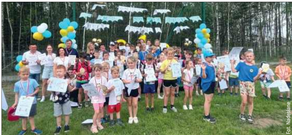
Dzieci dumnie stanęły do zdjęcia z dyplomami.

Choć nie zabrakło sportowej rywalizacji, najważniejsza była dobra zabawa, ruch i wspólne przeżywanie emocji. kz