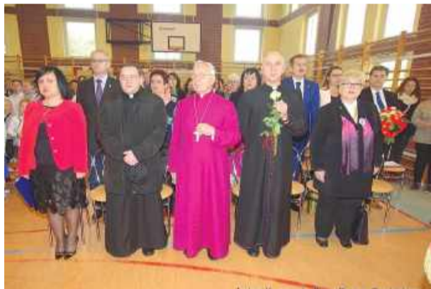
Kadr sprzed 10 lat...

Jubileusz był okazją nie tylko do wspomnień, ale także do podkreślenia rozwoju szkoły na przestrzeni lat. W poprzedzających go latach placówka przechodziła istotne zmiany. W roku szkolnym 2013/2014 doposażono oddział przedszkolny w tablice multimedialne, laptopy i pomoce dydaktyczne, współfinansowane ze środków Unii