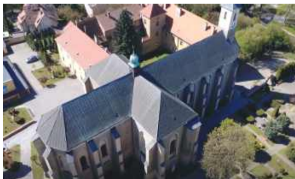
Wnętrze kościoła wypełnią brzmienia instrumentów

ny przeniesie uczestników w czasie, oferując niezapomniany koncert w tym historycznym miejscu. W ramach festiwalu koncerty odbędą się także we Wrocławiu