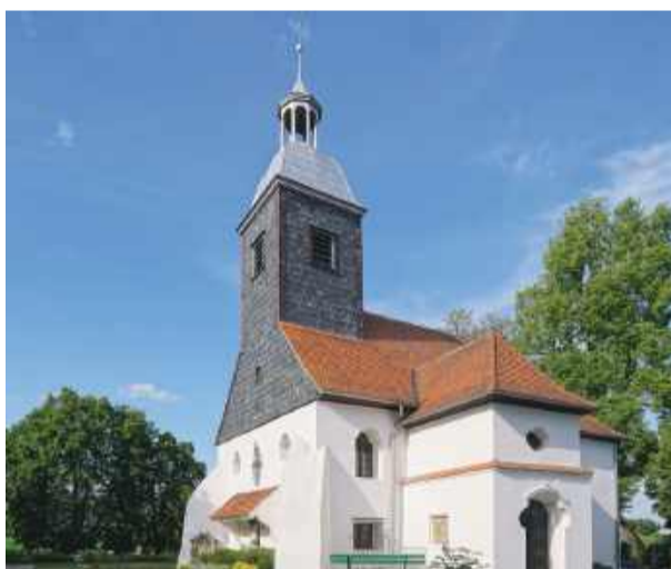
W ramach dotacji w kościele filialnym w Żeleźniku zostanie wymieniona część instalacji elektrycznej.

Podczas ostatniej sesji Rady Miejskiej Strzelina samorządowcy zdecydowali o zwiększeniu wydatków o 139 tys. zł na realizację Programu Ochrony Zabytków. Dotychczas w budżecie zabezpieczonych było już 100 tys. zł. Do Urzędu Miasta i Gminy w Strzelinie wpłynęły wnioski beneficjentów, którzy ubiegają się w 2026 roku o przyznanie dotacji celowej na prace konserwatorskie, restauratorskie i roboty budowlane przy zabytkach niestanowiących własności Gminy Strzelin. Jak informuje strzeński magistrat, o dotację