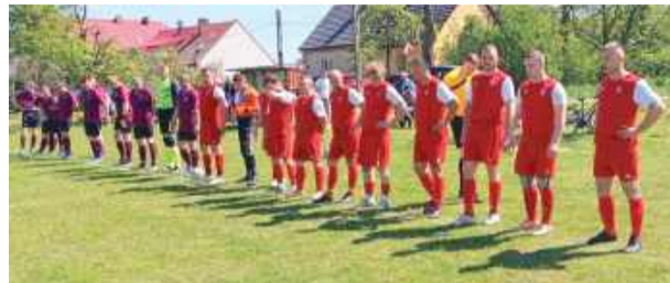
Ognisko przed meczem z Iskrą

kwietnia oglądaliśmy dwa mecze, w których padło aż 16 goli. Słęża Borów rozgromiła KS Kurów 8:0, choć po pierwszej połowie prowadziła tylko jedną bramką. Po przerwie gospodarze wrzucili wyższy bieg i całkowicie zdominowali rywala. Największym bohaterem spotkania był