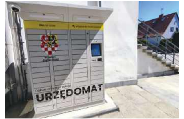
Urzędomat ma wspomagać pracę urzędników i ułatwiać odbiór dokumentów petentom

Po przygotowaniu dokumentu mieszkaniec otrzyma specjalny kod, który umożliwi otwarcie skrytki i odbiór przesyłki. Co ważne, korzystanie z urzędomatu będzie dobrowolne – tradycyjna forma odbioru dokumentów pozostaje bez zmian.