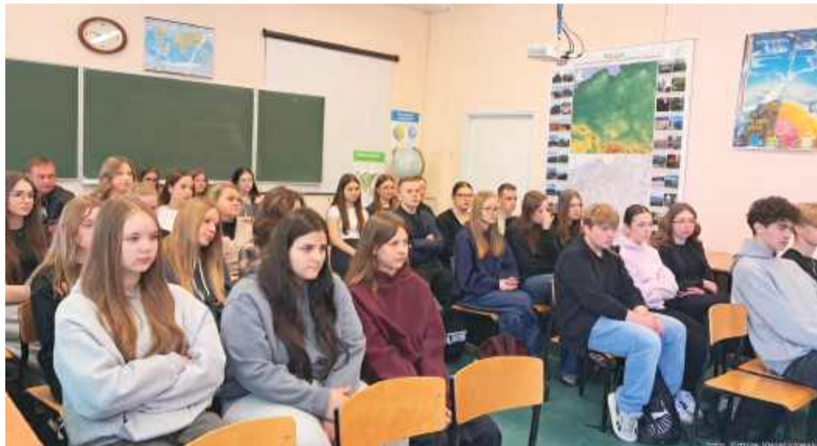
W wydarzeniu wzięli udział uczniowie szkół podstawowych z terenu powiatu strzelińskiego.