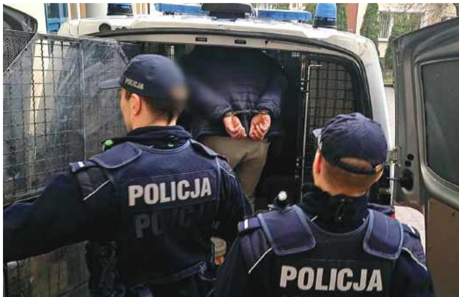
W trakcie zatrzymania mężczyzna był całkowicie zaskoczony. Po 14 latach ukrywania się liczył, że dalej będzie skuteczny w swoich działaniach.

– Jednym z przestępców był mieszkaniec z okolic Strzelina, który dokonał brutalnego pobicia z użyciem noża. Ofiara doznała poważnych ran brzucha. Za ten czyn sąd w 2012 roku skazał sprawcę na ponad dwa lata więzienia. Ponadto mężczyzna podejrzewany był również o handel nar-