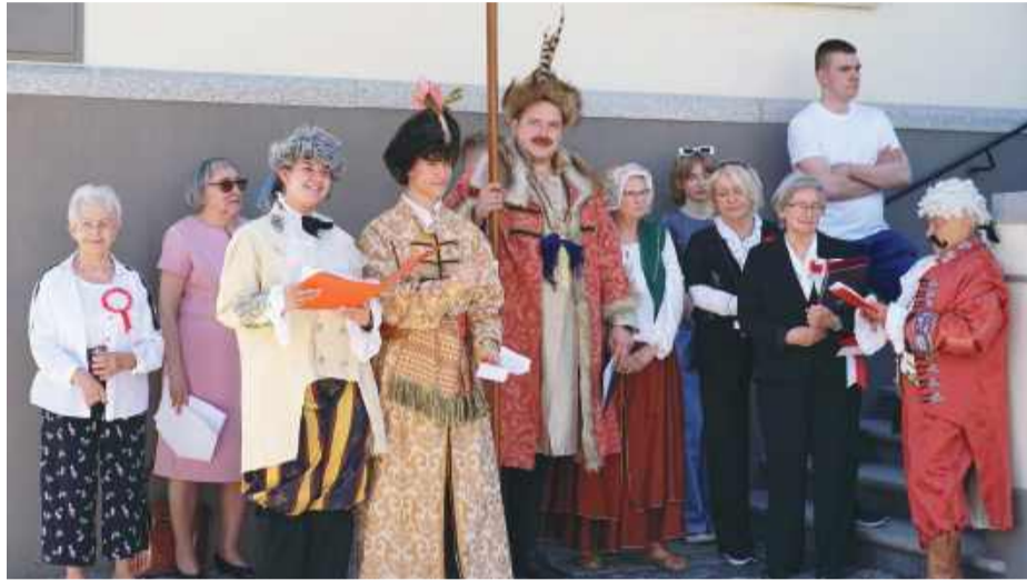
Aktorzy prezentujący inscenizację pt. „Konstytucja – most pomiędzy przeszłością a teraźniejszością”.