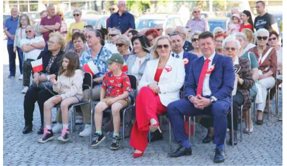
Samorządowcy i mieszkańcy podczas uroczystości 3 Maja.

świętować od 30 kwietnia do 3 maja, a program przygotowany przez Gminę Strzelin i Strzeleński Ośrodek Kultury przyciągnął wielu uczestników.