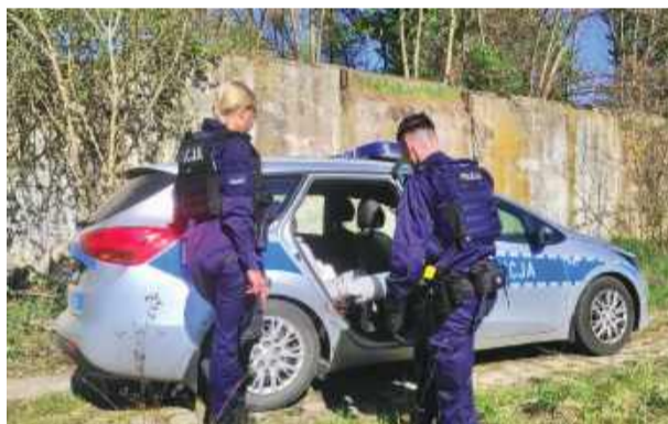
Ucieczka 17-latką zakończyła się w Jegłowej. Mieszkańcom powiatu brzeskiego grozi nawet 8 lat więzienia.

nie posiadał prawa jazdy. Ponadto w policyjnym rejestrze widniał jako osoba poszukiwana. W trakcie brawurowej ucieczki wielokrotnie złamał przepisy drogowe, m.in. wjechał na strzebińskie rondo pod prąd, wymusił pierwszeństwo przejazdu, chcąc wyprzedzić ciężarówkę, wjechał na chodnik, i przekroczył dopuszczalną prędkość