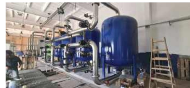
W ramach inwestycji przeprowadzono modernizację stacji uzdatniania wody w Wiązowie.

sne urządzenia z odczytem radiowym (zdalnym), co