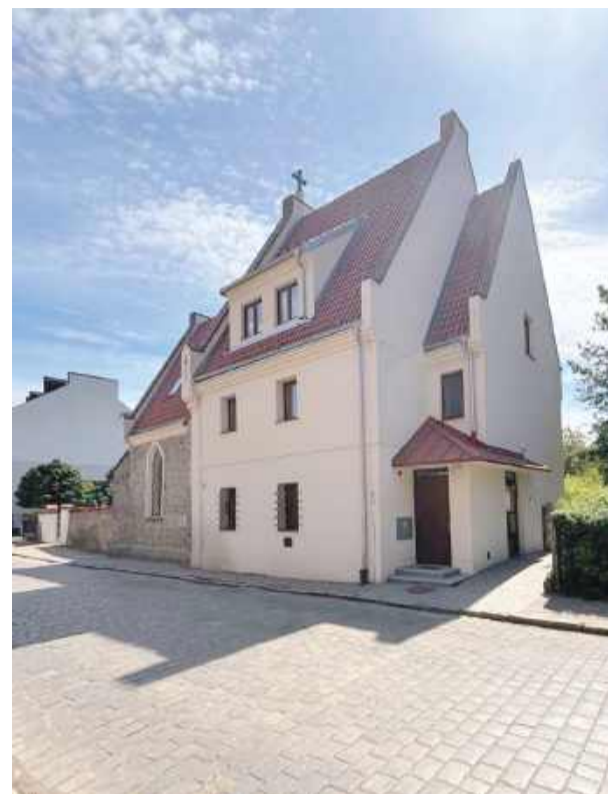
Przygotowany przez Galerię Skalną program Nocy Muzeów obejmuje zarówno propozycje dla najmłodszych, jak i dorosłych miłośników sztuki

Warto również wspomnieć o kulturalnej ofercie Galerii Skalnej, działającej pod egidą Strzeleńskiego Ośrodka Kultury. Przygotowany przez galerię program obejmuje zarówno propozycje dla najmłodszych, jak i dorosłych miłośników sztuki. Tutaj również obchody rozpoczną się