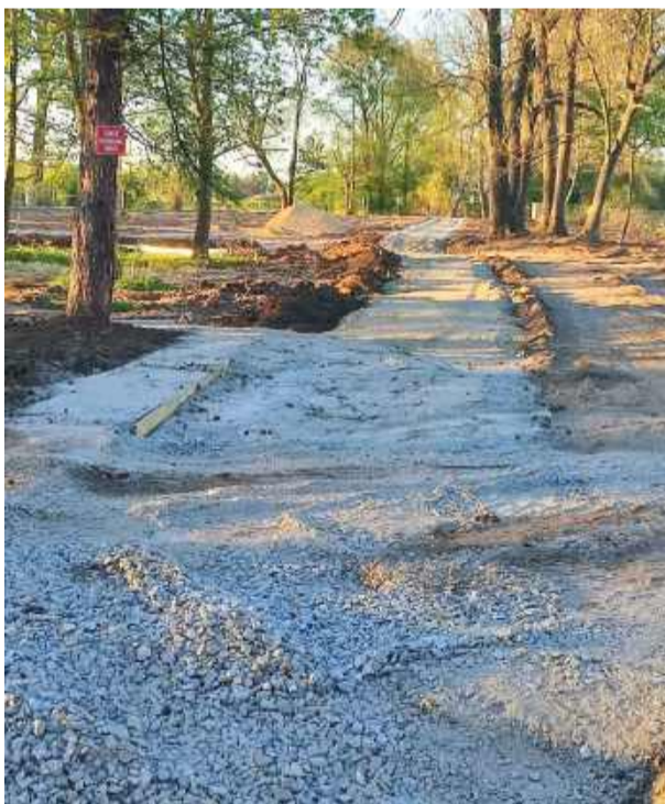
Obecnie na placu budowy wyznaczane i utwardzane są przyszłe chodniki i alejki

Przypomnijmy, że gmina pozyskała ponad 2 mln zł dofinansowania na zagospodarowanie tego terenu. W planach jest stworzenie ogólnodostępnej przestrzeni o funkcji rekreacyjnej i edu-