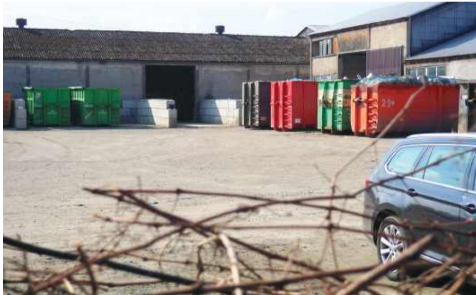
Z końcem kwietnia zakład przy ul. Kolejowej nie ma prawa działać