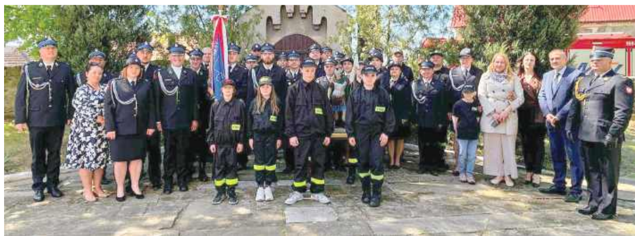
Strażackie uroczystości rozpoczęły się Mszą św. w Starym Wiązowie. Uczestniczyli w nich strażacy i samorządowcy.