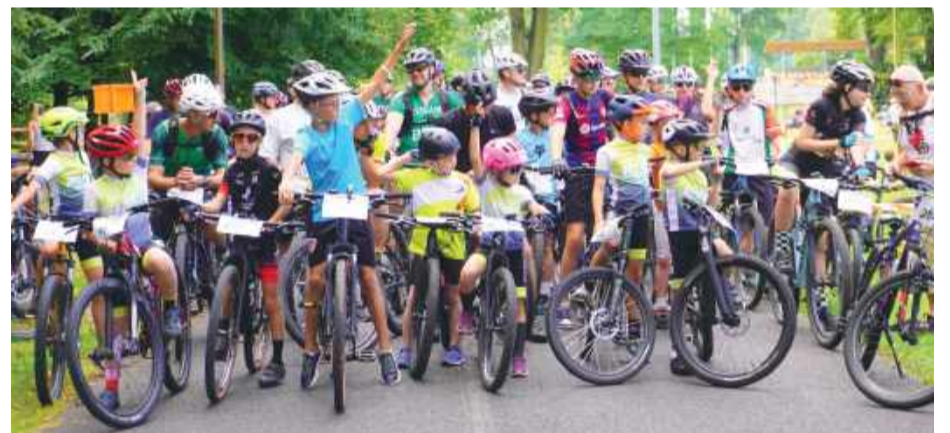
W imprezach rowerowych udział wezmą całe rodziny

nym piknik, podczas którego każdy uczestnik otrzyma