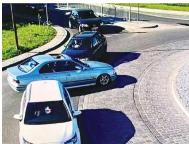
Kierowca BMW na strzebińskim rondzie jechał pod prąd.

w obszarze zabudowanym, gdzie obowiązuje ograniczenie do pięćdziesięciu kilometrów na godzinę – poruszał się z prędkością przekraczającą 150 km/h. Uciekając, naraził pieszych