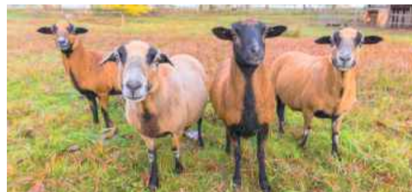
Owce kaukaskie są cenione za produkcję wysokiej jakości wełny i dużą wytrzymałość na trudne warunki klimatyczne.

– Na drogę nie wychodzą, bo przebiegają blisko prywatnych kamieniołomów. Można je zobaczyć rano, przejeżdżając ulicą Lipową na Dębniaki w Gęsińcu. Wodę piją na dole w wyrobisku. Dzikich psów już nie ma, więc hasają. Gdy podejdziesz bliżej, uciekają