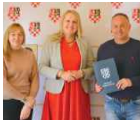
Powiat Strzeliński wsparł lokalne projekty sportowe, kulturalne i społeczne.

Powiat Strzeliński rozdysponował środki na realizację szeregu inicjatyw – od wydarzeń sportowych po projekty kulturalno-społeczne. Podpisane umowy obejmują zarówno działania skierowane do dzieci i młodzieży, jak i wydarzenia integrujące lokalne społeczności oraz promujące dziedzictwo regionu.