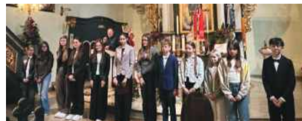
Pełna zapału młodzież, która swoim montażem słowno-muzycznym wzruszyła uczestników obchodów.

który dziękował za wybranie na tegoroczne świętowanie kościoła w Borku Strzeleńskim Waldemarowi Grochow-