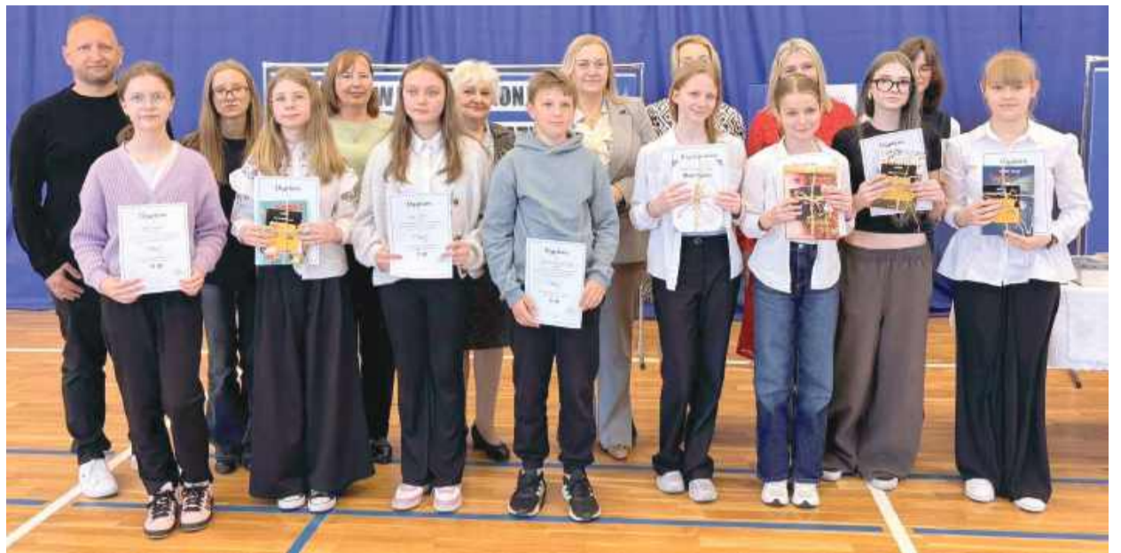
Pamiątkowe zdjęcie uczestników i organizatorów konkursu.