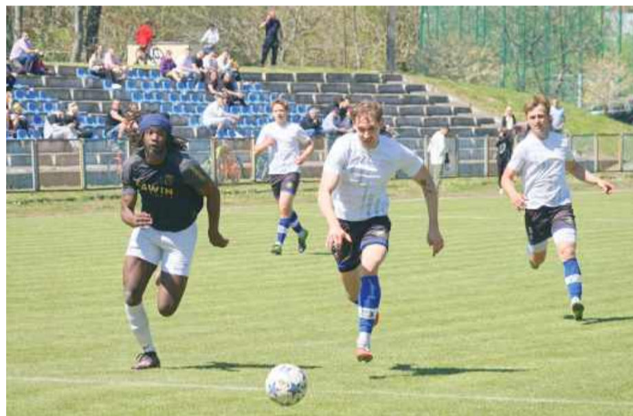
Strzelinianka pokonała Zenit