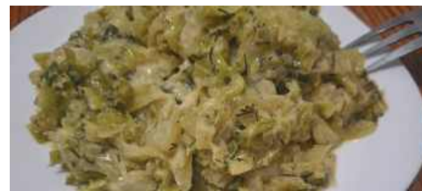
Zasmażana młoda kapusta to jedno z najlepszych sezonowych dań

Składniki: 1 kg młodej kapusty, 1,5 łyżki soli, pę-