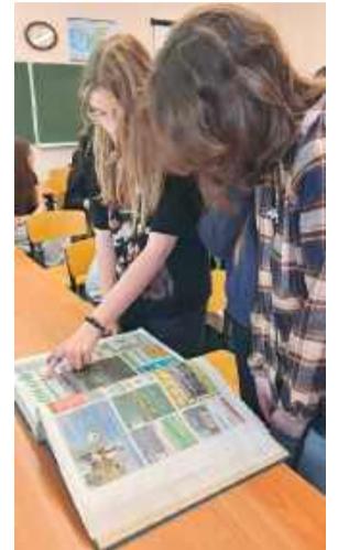
Uczestnicy wydarzenia z zainteresowaniem przeglądali archiwalne numery naszej gazety.