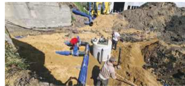
Inwestycja ma być zrealizowana do 29 maja.

Jak informuje wiazowski magistrat, trwają intensywne prace związane z przebudową stacji uzdatniania wody w Wiązowie. Równolegle na terenie gminy trwa wymiana tradycyjnych wodomierzy na nowocze-