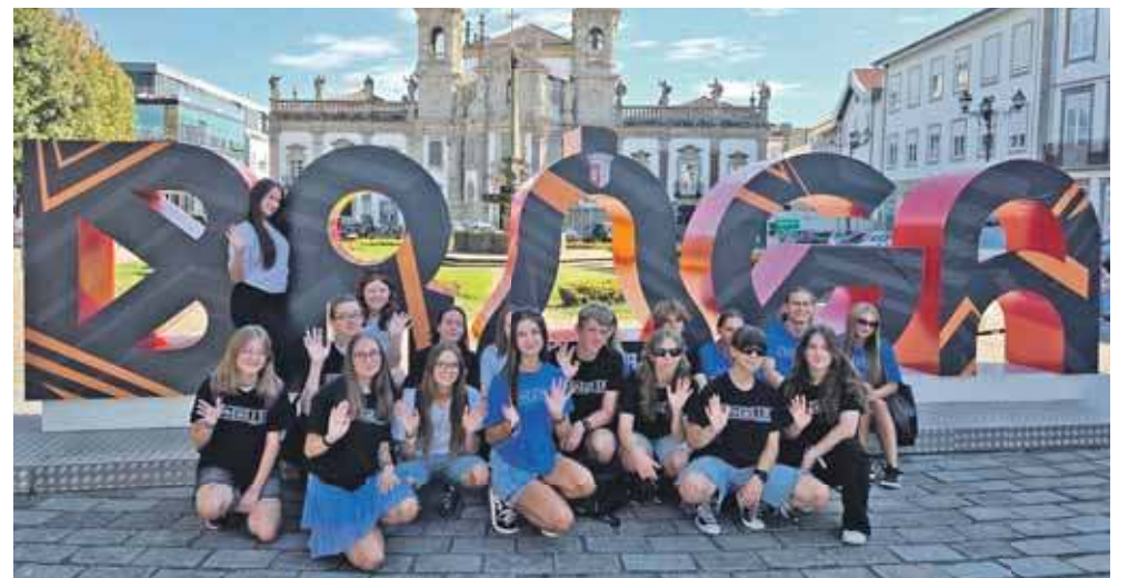
Uczniowie „Chemika” nie tylko zdobyli cenne doświadczenie zawodowe, ale też mieli okazję poznać historię i kulturę Portugalii

Uczniowie zrealizowali czterotygodniowe praktyki zawodowe w Portugalii. Mobilność odbyła się w terminie: 22.09.2025-17.10.2025 r. Wyjazd do Barcelos w Portugalii umożliwił uczniom podniesienie nie tylko umiejętności i kompetencji zawodowych, ale także zwiększył szansę na wzrost umiejętności posługiwania się językiem angielskim, wzrost kompetencji społecznych, organizacyjnych i interpersonalnych. Była to okazja do nawiązania nowych międzynarodowych kontaktów, które mogą zostać wykorzystane w przyszłości. To również możliwość podniesienia świadomości międzykulturowej, poprawy postawy tolerancji i otwartości, wzrostu umiejętności pracy zespołowej i brania