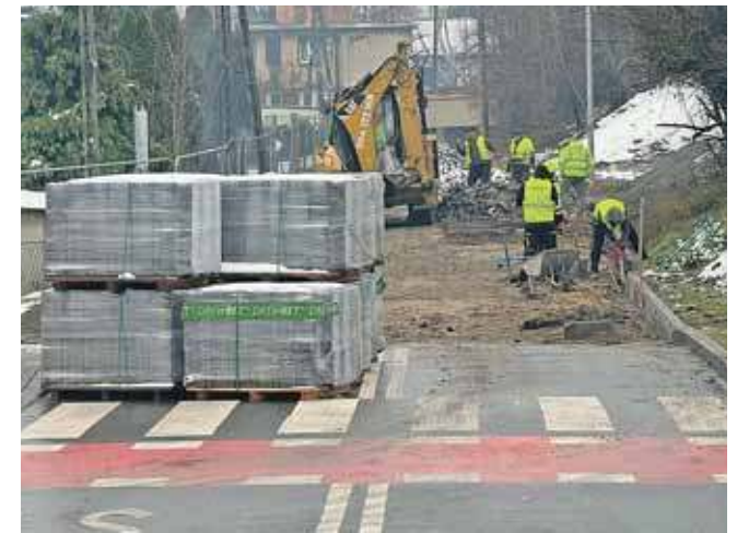
Naprawa jest konsekwencją uszkodzenia nawierzchni ulic podczas przebudowy linii kolejowej nr 131