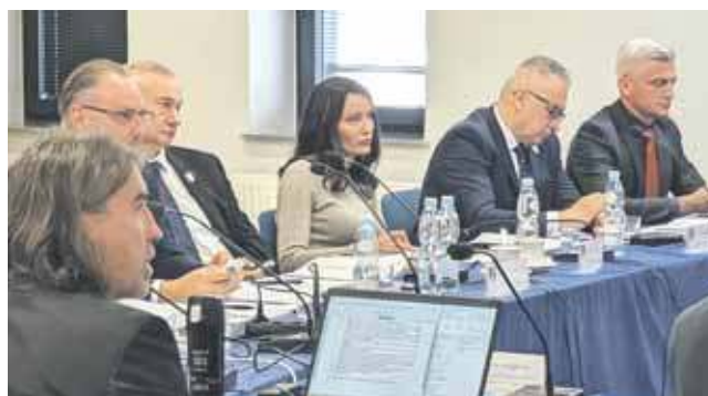
Szpital stracił ponad 11 mln zł między innymi z powodu zawieszenia działalności oddziałów