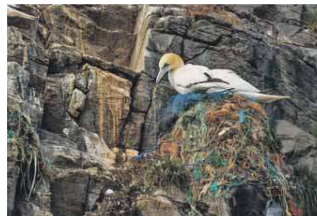
Nagrodzona „Plastikowa wysiadka”

Bliska jest mu fotografia dokumentalna przyrody z wyraźnym akcentem artystycznym – taka, która nie tylko pokazuje piękno zwierząt, ale także opowiada o ich zachowaniach i relacjach z otoczeniem. Jego zdjęcia były publikowane m.in. w The Times, The Guardian i Daily Star.