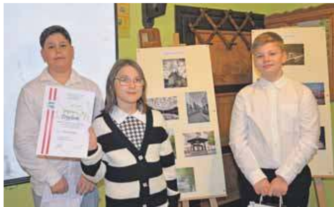
Pierwsza trójka w kategorii dzieci

29 osób wzięło udział w konkursie fotograficznym „Wędrówki z aparatem fotograficznym po Tarnowskich Górach”. W środę, 26 listopada, w siedzibie tarnogórskiego oddziału PTTK wręczono nagrody najlepszym uczestnikom.