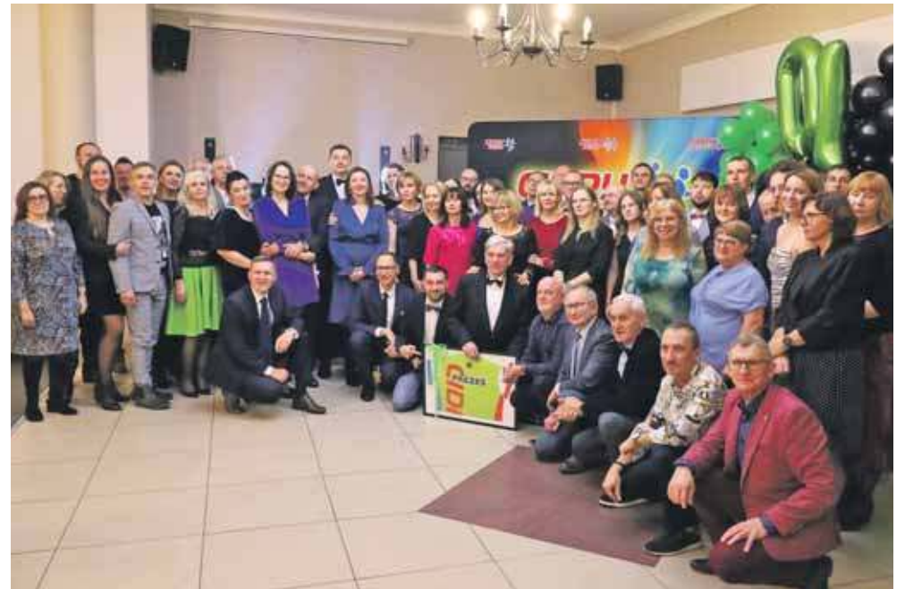
Podczas gali jubileuszowej w Radzionkowie