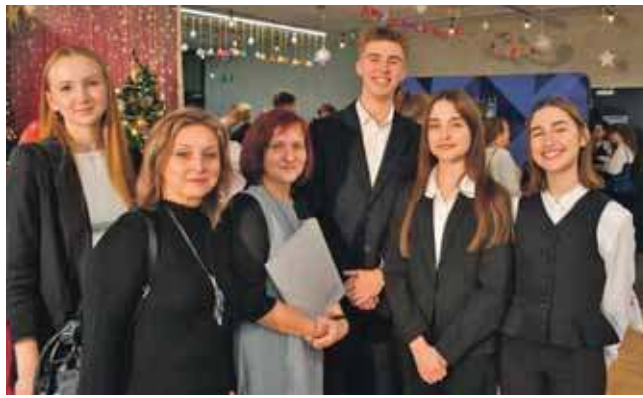
Uroczystość odbyła się w TCK