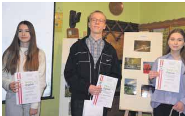
Autorzy najlepszych fotografii wśród młodzieży