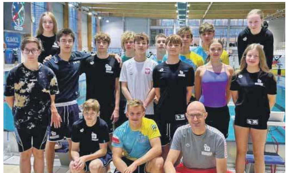
Silna pływacka ekipa z MKS Park Wodny