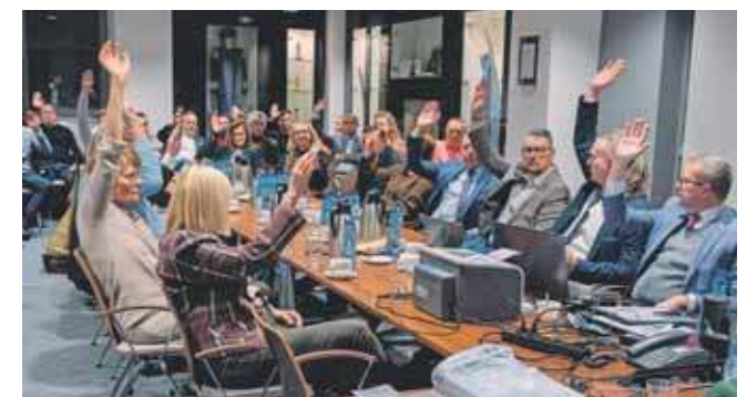
Zebranie założycielskie odbyło się 20 listopada

– Powinniśmy się skupić nie na politykowaniu, tylko