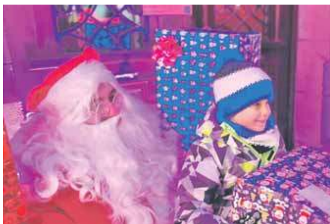
Spotkanie z Mikołajem organizuje także TCK

Pojawi się i Mikołaj, wręczenia prezentów zaplanowano o godz. 11.30, 12.30 i 13.30. Podpisane podarki (imię, nazwisko i wybrana godzina)