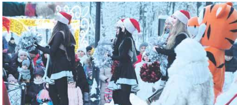
Mikołaj ze swoją świtą pojawi się m.in. przed Pałacem Kawalera w Świerkłańcu

Weekend ze św. Mikołajem w Pniowcu będzie 5 i 6 grudnia. W piątek o godz. 16.30 ruszy Orszak Świętego Mikołaja. Przejedzie ulicami dzielnicy, by spotkać się z najmłodszymi mieszkańcami. Na pierwszy ogień idą ul. Świerkowa, Poczty Gdańskiej i Borówkowa, na koniec, ok. godz. 19.15 będą ul. Jeżynowa, Na Glinkach i Rzeczna.