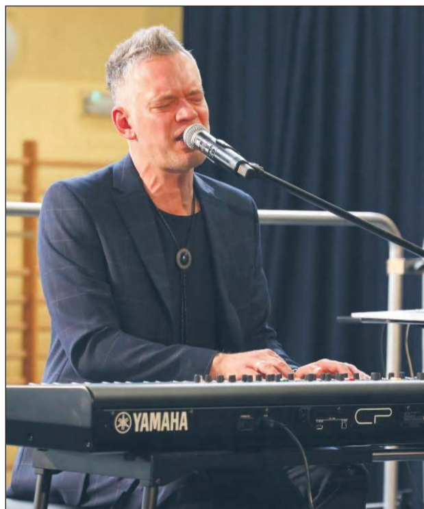
KŁOCZEW Gwiazdą Gminnego Święta Kobiet był popularny polski wokalista Krzysztof Antkowiak

To był weekend pełen życzeń dla kobiet. Jak powiat długi i szeroki wszędzie świętowano Dzień Kobiet. Po raz pierwszy obchodzony był 28 lutego 1909 roku. Ustanowiony przez amerykańską socjalistyczną partię po zamieszkach i strajkach w Nowym Jorku. Rok później w Kopenhadze ustanowiono Międzynarodowy Dzień Kobiet, który służyć miał krzewieniu idei praw kobiet i budowaniu społecznego wsparcia dla powszechnych praw wyborczych dla pań. Dzień ten przypadł na 8 marca i tak zostało do dzisiaj.