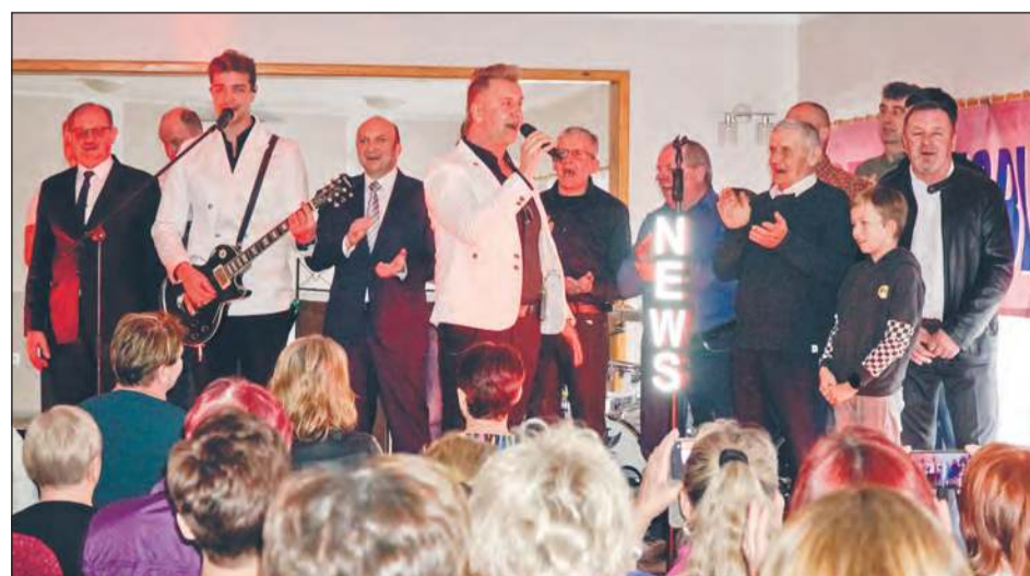
NOWODWÓR Gwiazdą spotkania z okazji Dnia Kobiet był zespół „News”, który wspólnie ze wszystkimi mężczyznami obecnymi na uroczystości zaśpiewał głośno „Sto lat” dla wszystkich pań