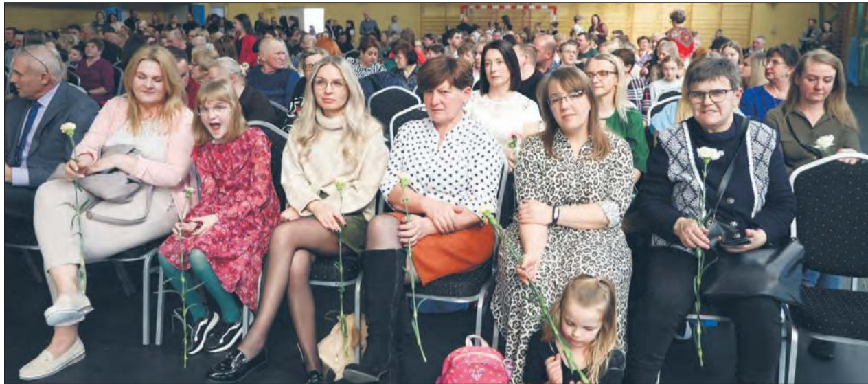
KŁOCZEW Na zaproszenie wójta i przewodniczącego rady gminy do obchodów Gminnego Święta Kobiet odpowiedziało wiele osób.