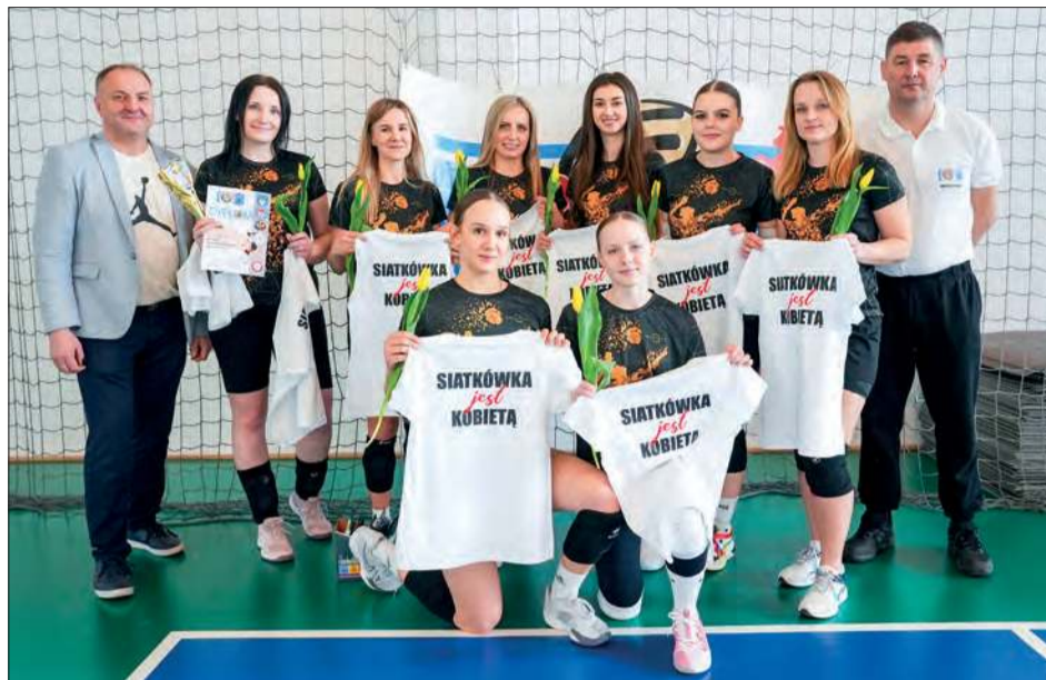
DD Team - mistrzynie ALS Kobiet 2024/25

Siatkarze Developmentu wygrali 3:2 z Powiślakiem Końskowola w finale męskiej ALS, a DD Team pokonał 2:0 obrończynię tytułu z Dragona Wojcieszków w kobiecej części ALS