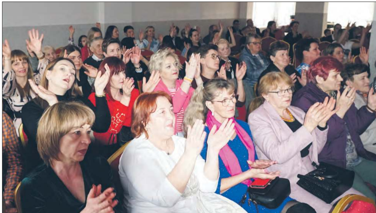
NOWODWÓR Panie zgromadzone w świetlicy były bardzo zadowolone z tego, że zostały docenione w dniu swojego święta