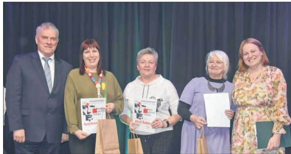
DĘBLIN Podczas koncertu w MDK wręczono dyplomy i upominki dla kobiet, które zgłosiły swoje prace plastyczne na wystawę zbiorową „Kobieta, Przestrzeń, Sztuka”