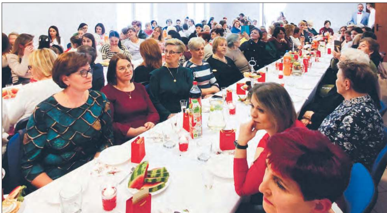
PIOTROWICE Parafialny Dzień Kobiet był nie tylko okazją do podziwiania talentów dzieci, ale także do integracji lokalnej społeczności. Uroczystość, zorganizowana z okazji tego święta zgromadziła mieszkanki pobliskich wiosek oraz licznych gości i odbyła się w ciepłej, radosnej atmosferze. Po części artystycznej wszyscy mogli wspólnie spędzić czas przy poczęstunku i na rozmowach