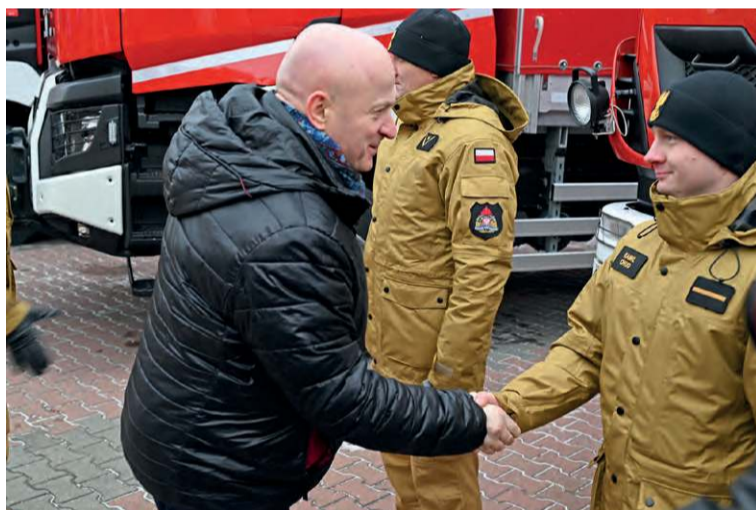
Przekazanie sprzętu w Radzynie Podlaskiej, 19 lutego 2025 roku