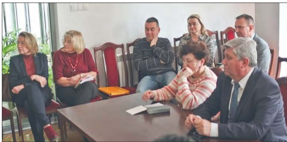
W spotkaniu dotyczącym wiat wzięli udział przedstawiciele władz miasta oraz zarządów ryckich osiedli

pokazał przykłady z Rumi, Śremu czy Zamościa. W Rykach system oparto by na wiatkach śmietnikowych - estetyczniejszych od obecnych i z nowinkami technologicznymi. Mieszkańcy osiedla dostaliby arkusze dla różnych odpadów. Po segregacji nakleją kod na worek i zanoszą do wiaty. Tam będą pojemniki 1100-litrowe na każdy rodzaj śmieci.