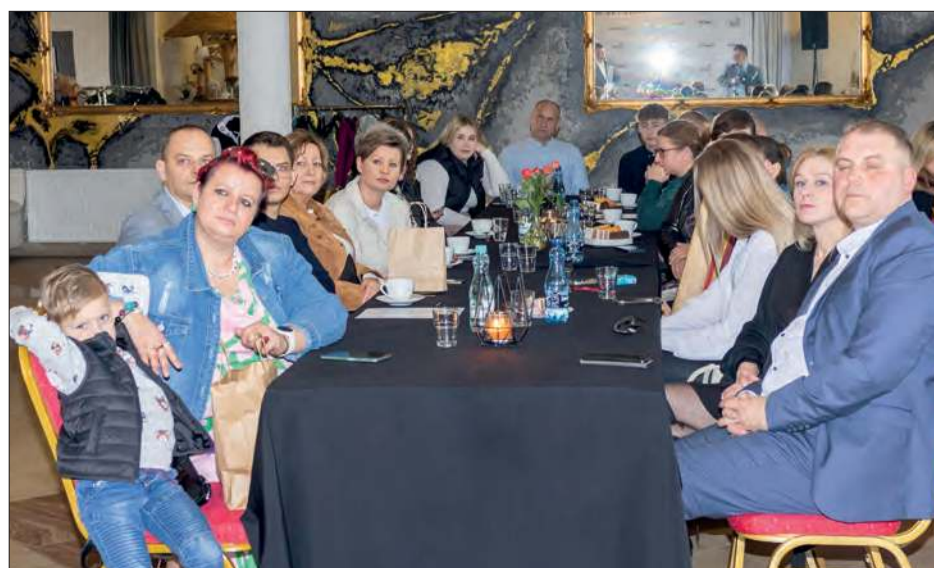
W oczekiwaniu na kolejne rozstrzygnięcia XXIV Plebiscytu Twojego Głosu