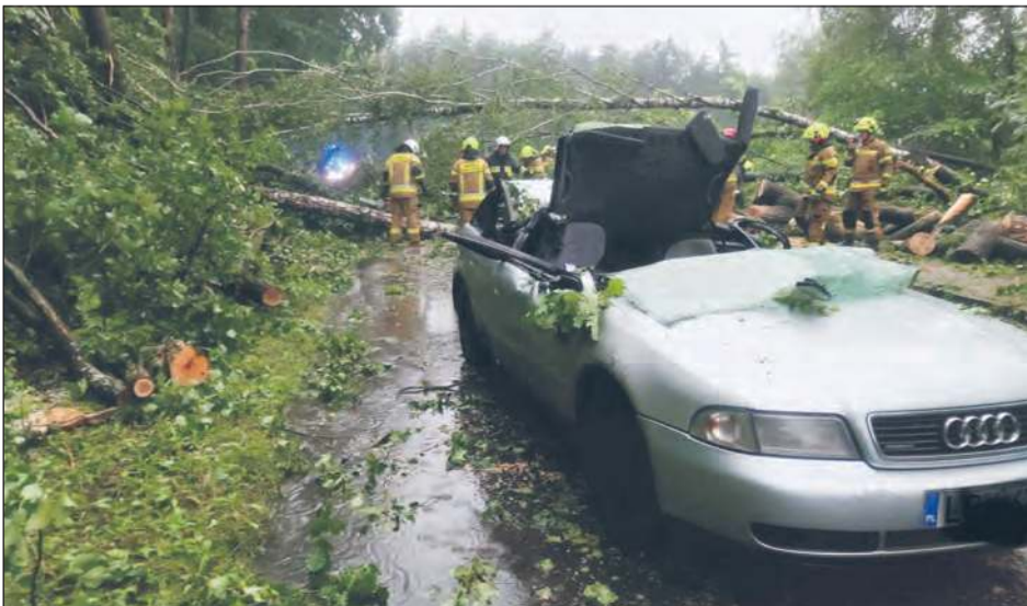
W 2024 roku strażacy z powiatu ryckiego najczęściej wyjeżdżali do miejscowych zagrożeń - 73% wszystkich interwencji. Najwięcej, bo 244 razy, usuwali skutki silnych wiatrów. Do groźnego zdarzenia doszło na drodze między Nowodworem a Grabowem Ryckim - wiatr powalił drzewo na audi. 57-letnia kierująca trafiła do szpitala