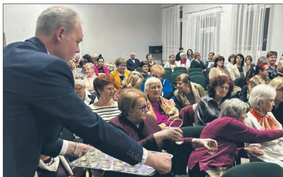
STĘŻYCA Na zaproszenie Gminnego Ośrodka Kultury odpowiedziało wiele pań. Były życzenia i toast za ich zdrowie