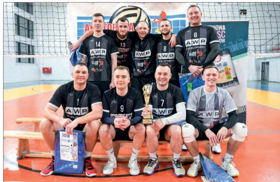
AWP Development - mistrzowie ALS Mężczyzn 2024/25