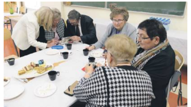
Absolwenci ogólniaka spotkali się w klasach ze swoimi dawnymi koleżankami i kolegami