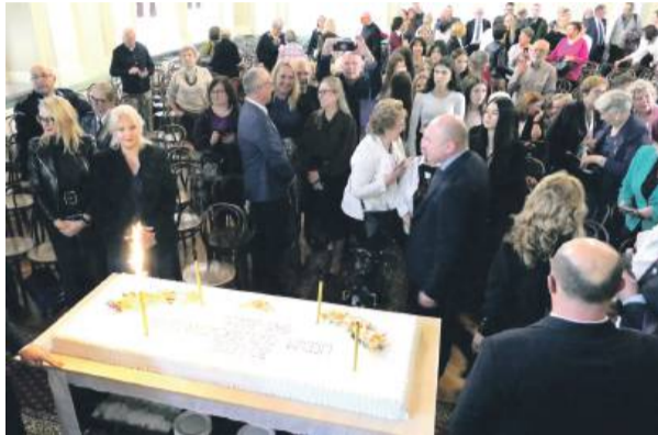
Absolwenci i goście zostali poczęstowani jubileuszowym tortem