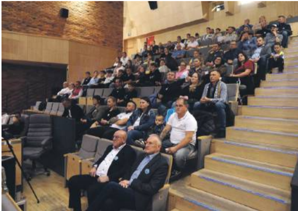
W uroczystej gali udział wzięło wielu gości