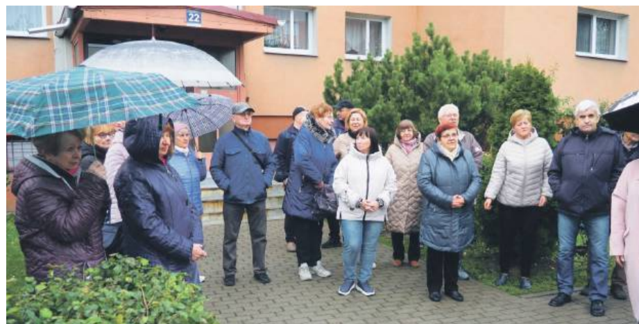
Ludzie żądają od spółdzielni wydania kluczy od kotłowni i kodów do alarmu. Zawiadomili komornika, aby zadziałał w ich sprawie i wyegzekwował wyrok sądu