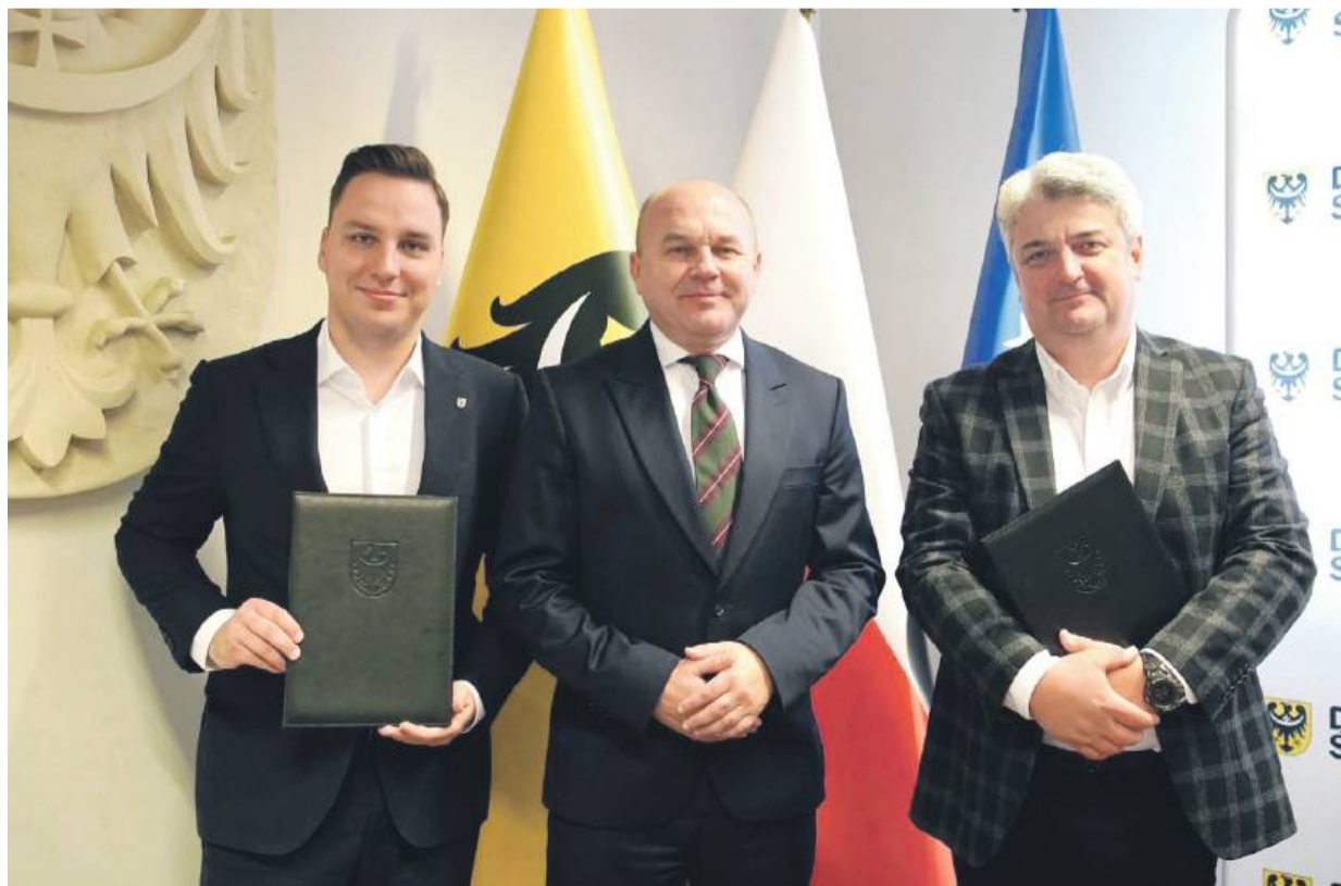
Umowę parafowała formalnie Dolnośląska Służba Dróg i Kolei (DSDiK) z renomowaną pracownią projektową, która na przestrzeni maksymalnie 15 miesięcy przygotuje pełną dokumentację.