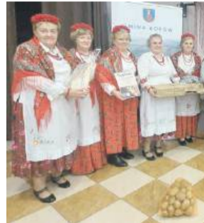
Przedstawicielki KGW Ślężanki, odbierające nagrodę w konkursie.

Uroczystość Wszystkich Świętych zbliża się wielkimi krokami. U nas w rodzinie to takie „trzecie święta”, bo wszyscy się wtedy spotykają. Jest oczywiście nostalgicznie, bo wspomniamy tych, z którymi kiedyś usiadziemy „przy stole bez pustych miejsc”, ale to też czas bycia razem tu i teraz. Spotkania to również okazja do wspólnego jedzenia. Tak sobie pomyślałam, że warto zaskoczyć czymś swoich gości. Idealnie do tego nadaje się danie, które zajęło drugie miejsce w konkursie „Potrawa ziemniaczana na wiejski stół”, zorganizowanym przez wójta gminy Borów, Gminną Bibliotekę Publiczną w Borowie oraz panią sołtys i radę sołecką Borka Strzeleńskiego. Prze-