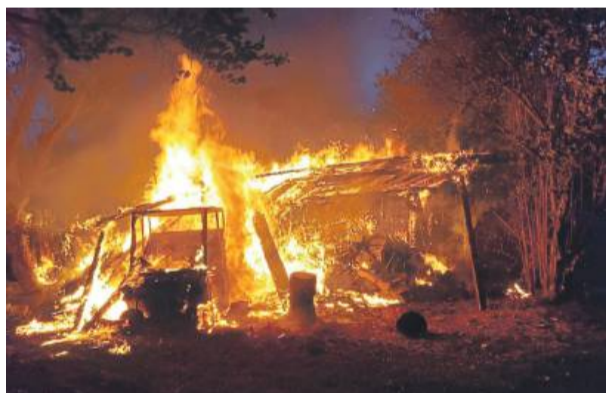
Mężczyzna stwierdził, że podpalał, bo lubi straż pożarną i syreny wozów bojowych.

Policja zatrzymała 29-latkę, który jest podejrzany o podpalenie elektrycznego meksa i stosu drewna przygotowanego na opał. Do tych zdarzeń doszło we wsi Pogroda niedaleko Przeworna.