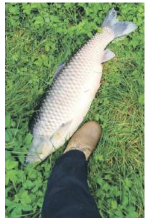
Wśród śniętych ryb były takie okazy jak ten amur

W piątek, 17 października, na stawach przy Cukrowni Strzelin doszło do masowego śnięcia ryb. Na miejsce przyjechały zastępy Państwowej Straży Pożarnej, w tym jednostka chemiczna z Wrocławia, strażacy ochotnicy, przedstawiciele Wód Polskich i wędkarze. Służby natleniały wodę, a kto mógł – odławiał ryby, aby zapobiec dalszym stratom. Jak się okazało, nie doszło do skażenia chemicznego – przyczyna była inna.