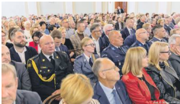
Aula strzeńskiego ogólniaka wypełniła się po brzegi.