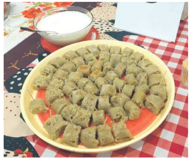
Wspaniała kiszka przygotowana do degustacji.

Składniki: 1,5 kg ziemniaków, 2 cebule, 30 dag boczku wędzonego, 4 łyżki smalcu, 250 g mąki, 2 łyżeczki majeranku, pieprz, sól, jelita wieprzowe ok. 2 m.