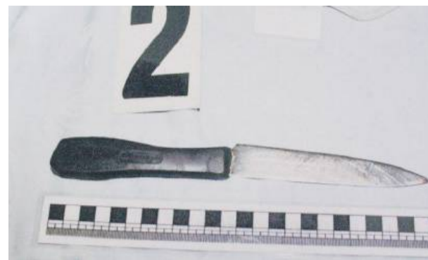
Prokuratura przygotowuje akt oskarżenia. Kobięcie grozi kilka lat więzienia. Fot. ilustracyjne

Przypomnijmy. Do dramatycznych wydarzeń doszło nad ranem, 8 października. Po całonocnej balandze doszło do awantury domowej. Partnerka mężczyzny chwyciła za 22-centymetrowy nóż kuchenny i pchnęła Grzegorza K. w okolicę serca. Mężczyznę zabrano do szpitala. Jego stan określono jako ciężki. W szpitalu rannego przesłuchała strzelińska policja. 48-latek dokładnie opowiedział