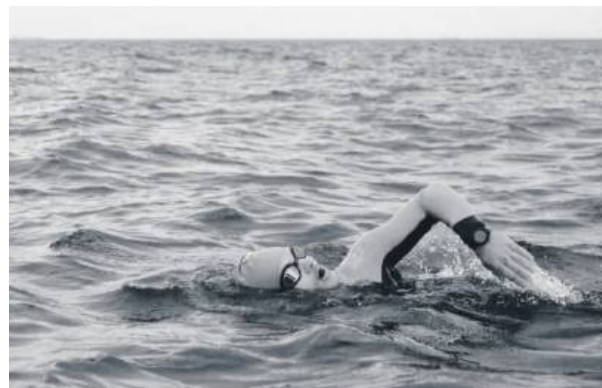
Mikołaj i wielka woda.

- Ja też tak mam (śmiech). Siedziałem w domu z tym gipsem i nie mogłem się nigdzie ruszyć. Uświadomiłem sobie wtedy, że mam dwie zdrowe nogi, bo ta pięta to tylko czasowo i w ogóle jestem sprawny. Dlatego po-