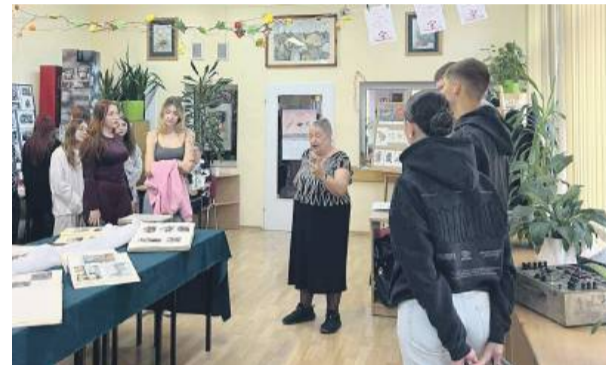
Wystawa „80 lat oświaty strzelińskiej” w Centrum Kształcenia Zawodowego i Ustawicznego w Strzelinie.

Jeśli nie widzieliście jeszcze wystawy, to od 21 października do 6 listopada można ją oglądać w Galerii Skalnej przy ul. Brzegotwej w Strzelinie we wtorki i piątki w godzinach 16-18,