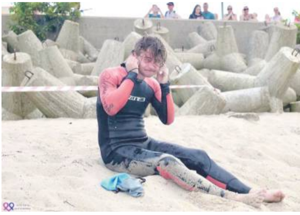
Nie było łatwo, ale było warto.

- Cześć! Popłynąłem na rzecz Fundacji „Życie warte jest rozmowy”, żeby zwrócić uwagę na społeczny temat zdrowia psychicznego, który w przestrzeni publicznej jest