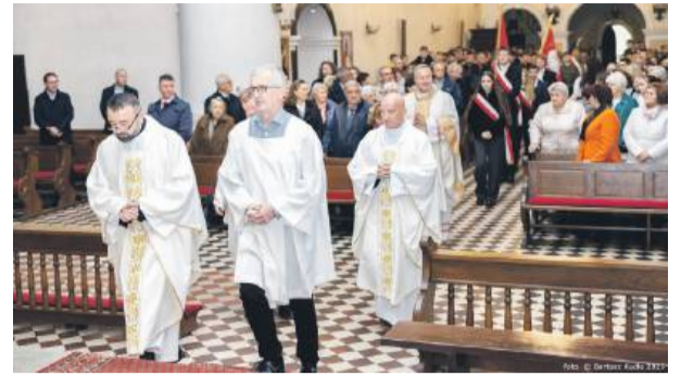
Uroczystość rozpoczęła się Mszą świętą w kościele pw. Podwyższenia Krzyża Świętego w Strzelinie.