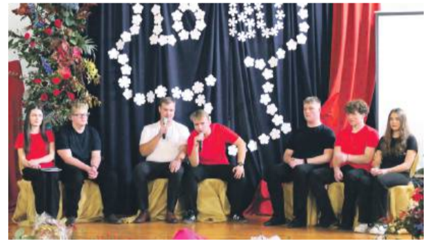
Część artystyczna była i sentymentalna i... zabawna