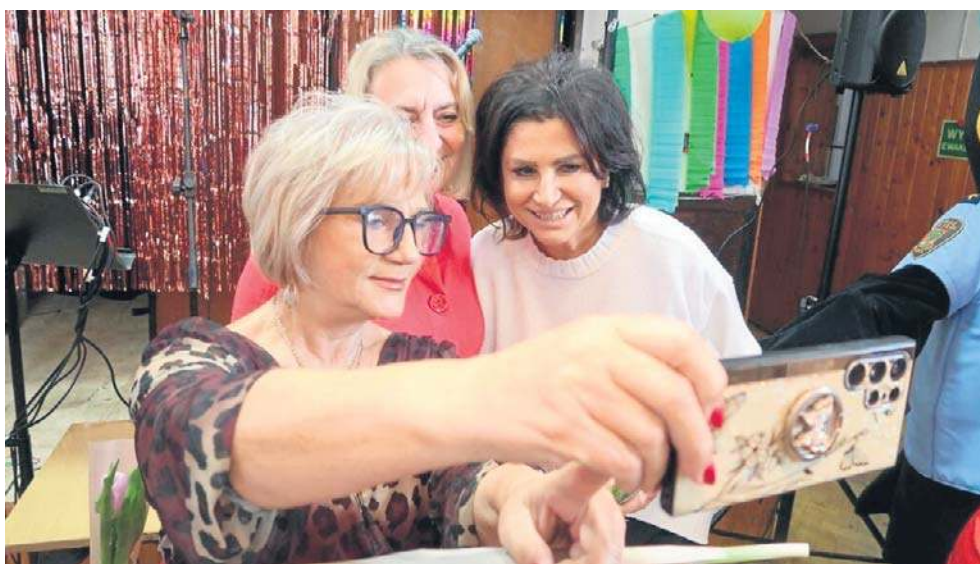
Panie doskonale się bawiły. Udokumentowały to setkami wykonanych fotografii.