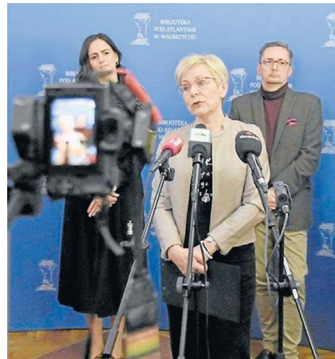
Jak ogłoszono, „Filmowy Wałbrzych” zorganizują: „Biblioteka pod Atlantami”, DCF oraz CNKiS Stara Kopalnia.

- Biblioteka pod Atlantami jest nie tylko współorganizato-