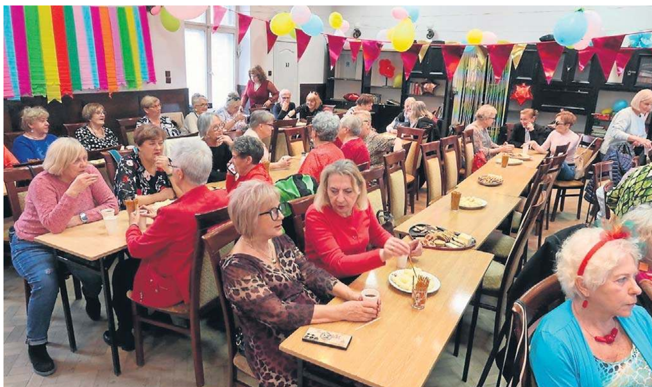
Zaproszenie przyjęło niemal sto pań. Wiele z nich gustownie się ubrało, część miała nawet barwne fascynatory.