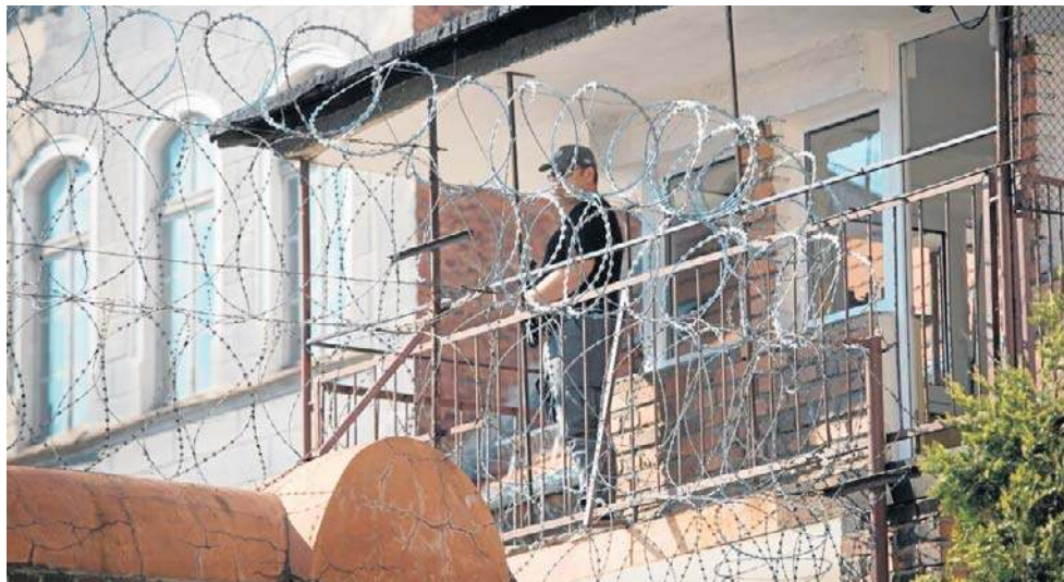
Sąd Okręgowy w Świdnicy postanowił: zwyrodnialec z Kłodzka spędzi za kratami 25 lat.

10 marca 2026 roku w Sądzie Okręgowym w Świdnicy zapadł wyrok w sprawie 45-letniego mężczyzny, oskarżonego o liczne przestępstwa seksualne, w tym pedofilskie i zoofilskie. Czyny obrzydliwe i ze wszech miar zasługujące na potępieniu, bo ofiarami padały dzieci i zwierzęta. Czyli ci naj-