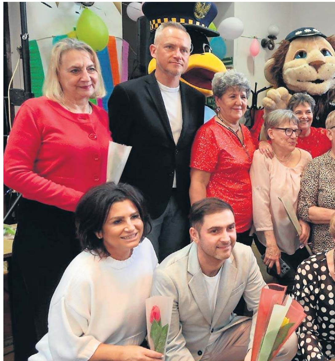
Mieszkanke Śródmieścia przyjęły zaproszenie na imprezę z okazji ich święta, organizowaną cor