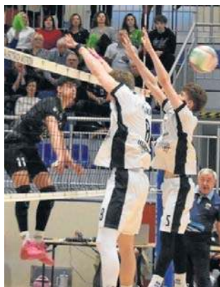
Juniorzy młodszy Chełmca byli u siebie niepokonani.

Czy młodzi wałbrzyskanie pójną śladami słynnych, starszych kolegów? ©©