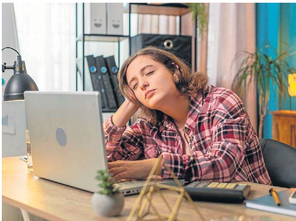
Badania pokazują, że przerwy co 60-90 minut pomagają ominąć kryzys koncentracji.

Mikrosen to moment, w którym nie masz kontroli. W tej sytuacji żaden trik lub wspomaganie się specyfikami nie są warte zaufania, gdy na szali jest zdrowie i życie. Otwieranie okna czy podkręcanie radia także nie zastąpi realnego odpoczynku. Potwierdzają to badania m.in. NASA, gdzie od lat bada się mikrosen u pilotów i astronautów, pokazując, że strategiczną 10-20-minutową drzemką (tzw. NASA nap) można zredukować mikrosen o 50-100% i poprawić wydajność o 34%.