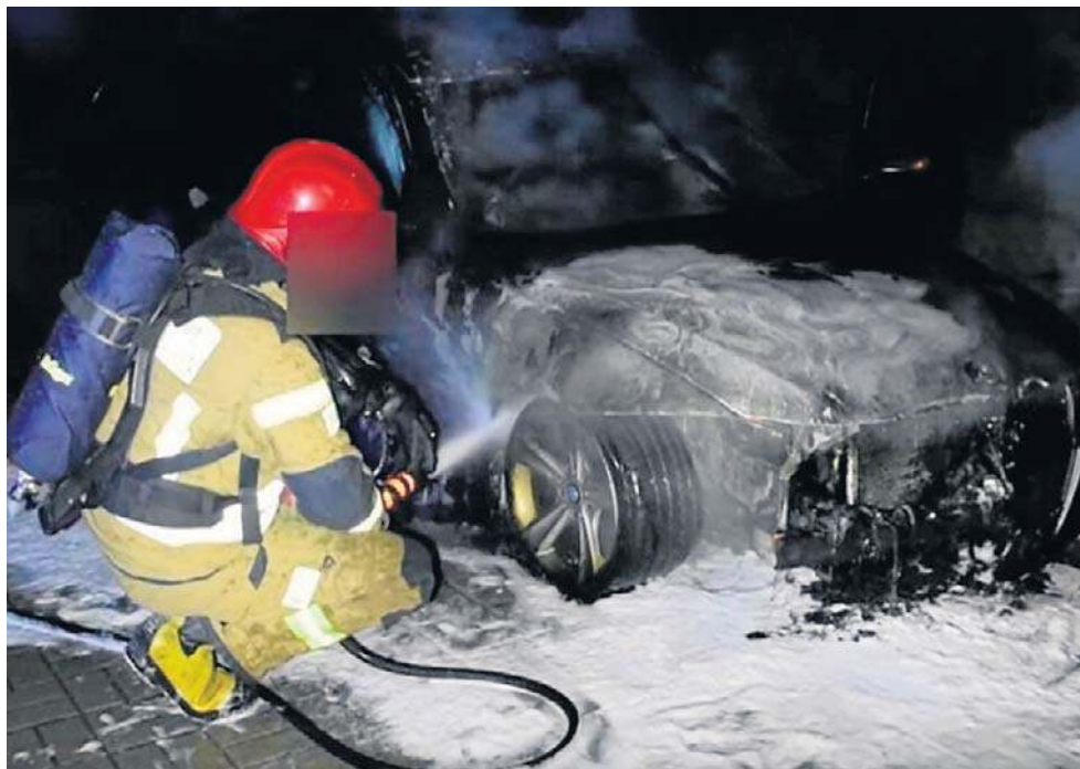
Podpalenia - w sumie miało ich być siedem - miał zlecić oficer straży pożarnej ze Świdnicy.