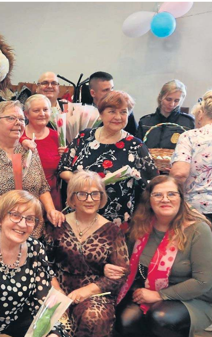
...ocześnie w Radzie Wspólnoty Samorządowej przy ul. Chrobrego.