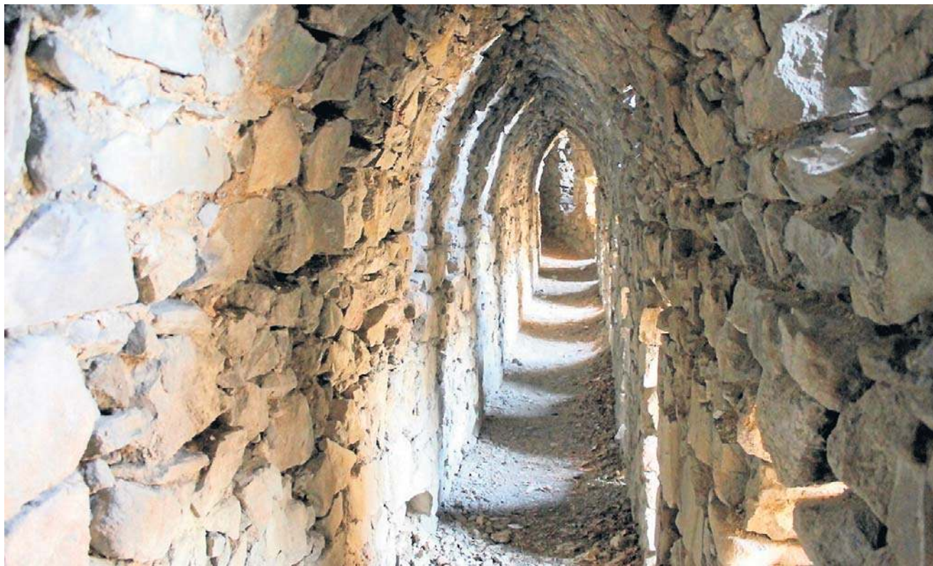
Z wąskich okienek zamkowych korytarzy Starego Książa w Wałbrzychu roztaczały się cudowne widoki na okolicę.

Dlaczego po obu stronach zamurowano wejścia do tunelu w Starym Książu? Swój decyzję Nadleśnictwo Wałbrzych tłumaczy względami bezpieczeństwa turystów. Sklepienie zbudowano z kawałków kamieni,