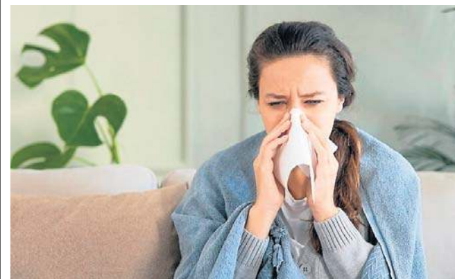
Po przebytej grypie znacząco wzrasta ryzyko zawałów serca i udarów mózgu. Dlatego warto się szczepić.

Szczyt zachorowań na grypę trwa do końca marca i początków kwietnia, jednak profilaktyka w postaci szczepień może zagwarantować spokój i bezpieczeństwo na dłużej.©©