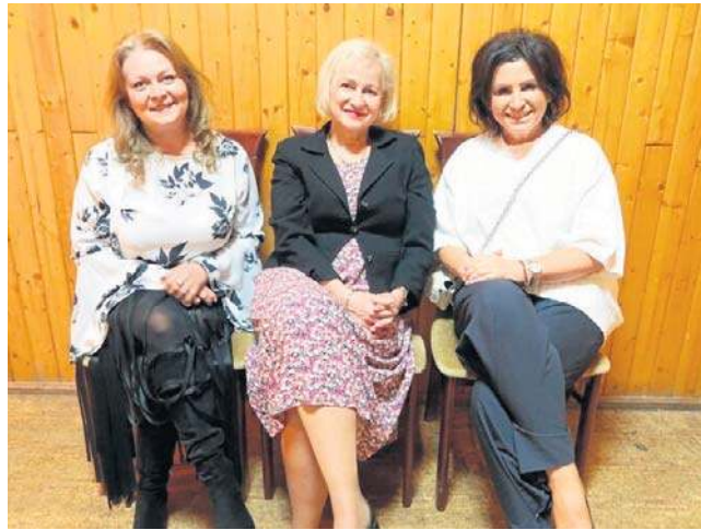
- Dzień Kobiet to szczególny czas, kiedy można spojrzeć na siebie inaczej, przestać być silną - mówiły panie.