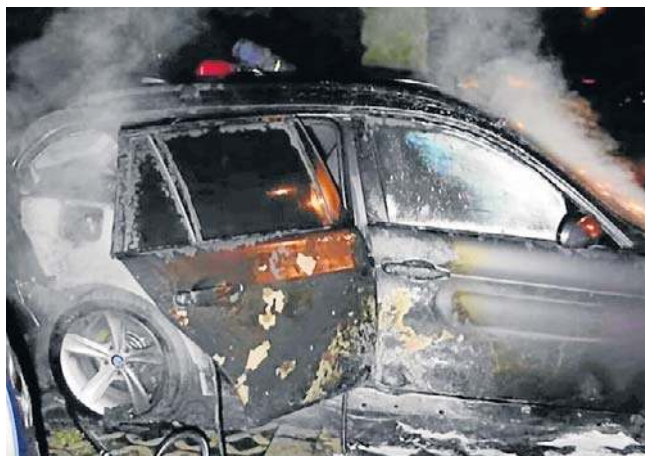
Za każde doszczętnie spalone auto zleceniodawca - znany policji młody mężczyzna - miał otrzymać 500 zł.