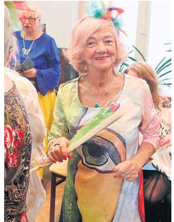
8 marca każda kobieta chce być zauważona i doceniona. Wiedzą o tym doskonale w RWS „Śródmieście”.