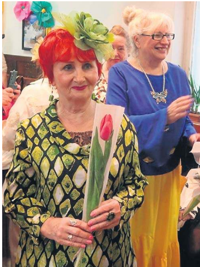
Panowie wręczyli paniom wiosenne tulipany. A potem na wszystkich czekał słodki poczęstunek i koncert.