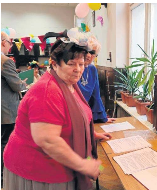
Zgrany zespół RWS doskonale poradził sobie z organizacją imprezy. Wszystko zostało dopięte na ostatni guzik.