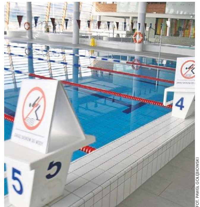
Zaczęła się przerwa technologiczna w Aqua Zdroju. Potrwa do 29 marca br. Prace obejmą basen i strefę saun.

Prezydent podkreśla, że po raz pierwszy podczas przerwy technologicznej nie będzie spuszczana woda z basenu sportowego. Dzięki zakupionemu specjalistycznemu robotowi będzie możliwe dokładne czyszczenie niecki bez jej opróżnienia.