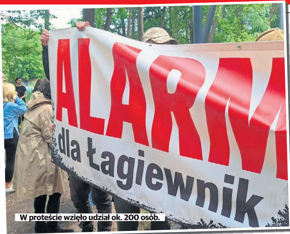
W proteście wzięło udział ok. 200 osób.

● Katarzyna Gałązka mówi, że jest otwarta na nowe aktorskie wyznania STR. 18