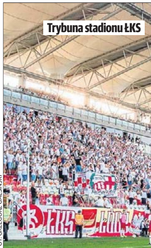
Trybuna stadionu ŁKS

A to oznacza, że obiekt na ten czas mistrzostw globu zostanie przejęty przez przedstawicieli FIFA, którzy będą