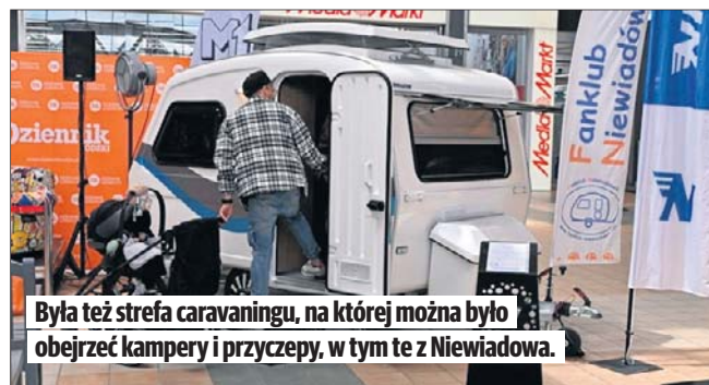
Była też strefa caravaningu, na której można było obejrzeć kampery i przyczepy, w tym te z Niewiadowa.

Oprócz prelekcji były też inne atrakcje. Na parkingu przed M1 pojawiła się strefa caravaningu na której można było obejrzeć kampery, kamperwany i przyczepy, w tym tzw. niewiadówki czyli słynne przyczepy z Niewiadowa.