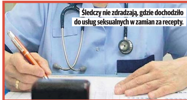
Śledczy nie zdradzają, gdzie dochodziło do usług seksualnych w zamian za recepty.

Nieoficjalnie wiadomo, że kobiety płaciły mu własnym ciałem. Śledczy nie zdradzają, gdzie dochodziło do usług seksualnych w zamian za recepty. Śledczy ustalili także, że od września do grudnia 2025 roku 31-letni lekarz wystawił 4 recepty na swoje nazwisko i przekazał nastolatce. Recep-