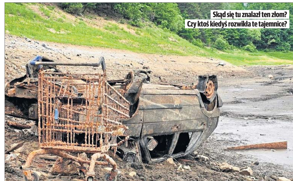
Skąd się tu znalazł ten złom? Czy ktoś kiedyś rozwikła te tajemnice?