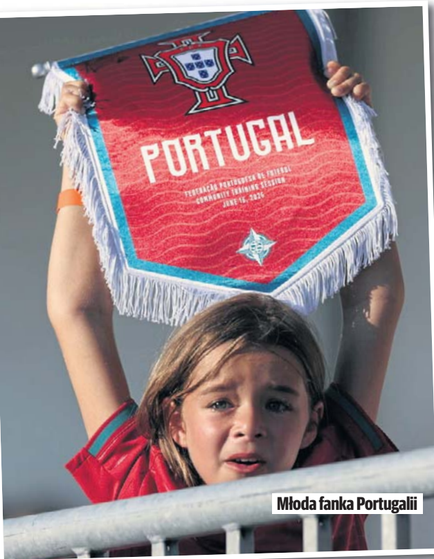
Młoda fanka Portugalii

Zlatan Ibrahimović, były kapitan piłkarskiej reprezentacji Szwecji, będzie podczas mistrzostw świata w USA, Kanadzie i Meksyku komentatorem stacji FOX.