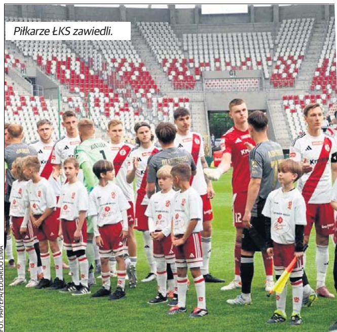
Piłkarze ŁKS zawiedli.