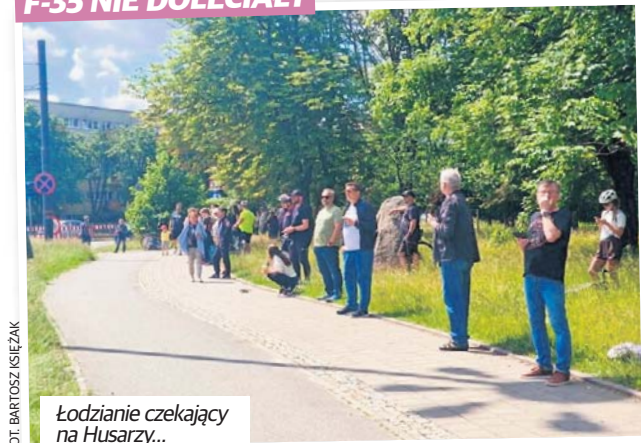
Łodzianie czekający na Husarzy...