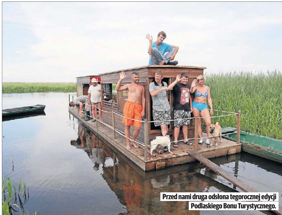
Przed nami druga odsłona tegorocznej edycji Podlaskiego Bonu Turystycznego.