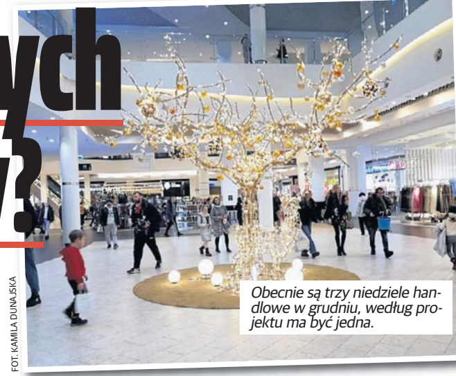
Obecnie są trzy niedziele handlowe w grudniu, według projektu ma być jedna.

Czy dojdzie do kolejnej zmiany przepisów dotyczących weekendowych zakupów w Polsce? W Sejmie jest petycja, której autor proponuje m.in. skrócenie godzin otwarcia sklepów w soboty. Markety większości handlowych sieci są otwarte tego dnia do późnych godzin.