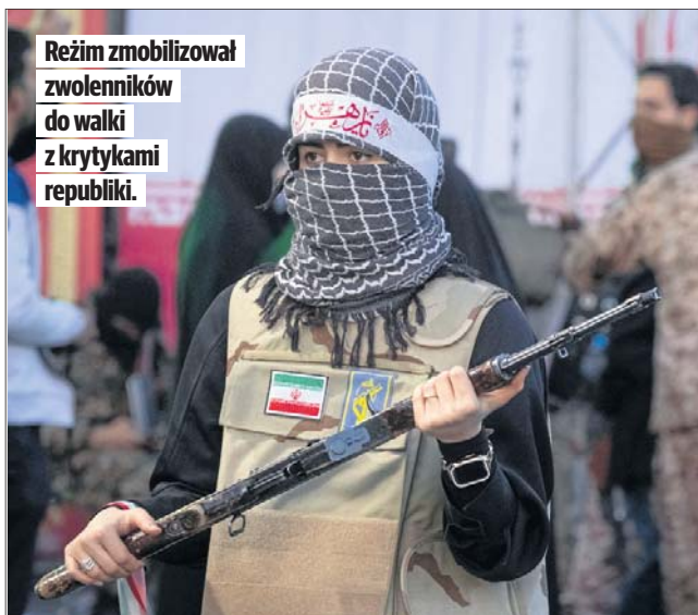
Reżim zmobilizował zwolenników do walki z krytykami republiki.

W prowincji Isfahan reżimowy wymiar sprawiedliwości