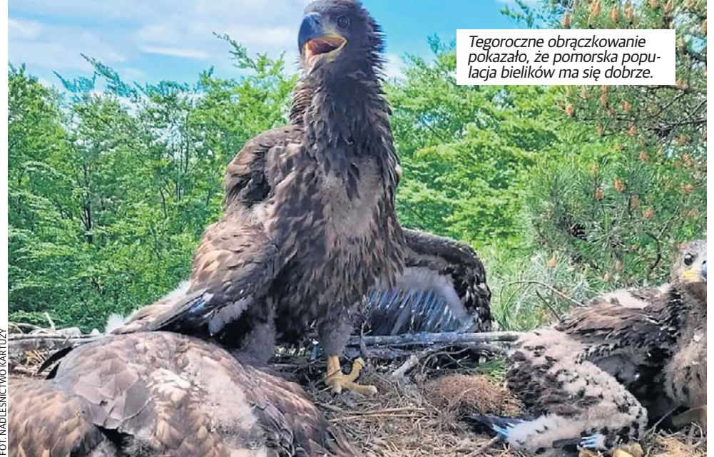
Tegoroczne obrączkowanie pokazało, że pomorska populacja bielików ma się dobrze.

Tymczasem w leśnictwie Dzierżążno uwagę zwraca-