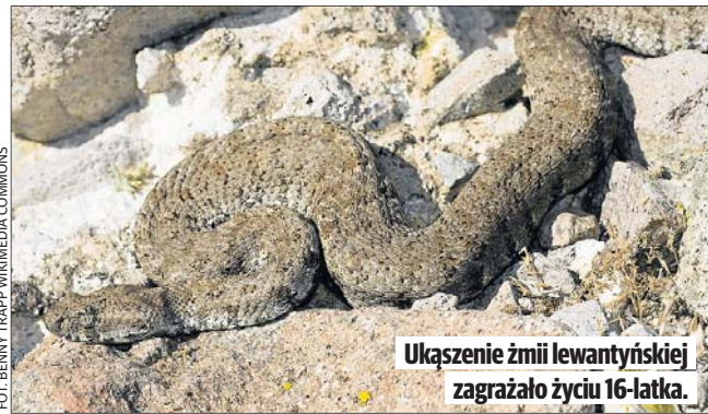
Ukąszenie żmii lewantyńskiej zagrażało życiu 16-latka.

Sytuacja była dramatyczna. Jad żmii lewantyńskiej, która ukąsiła 16-latka, jest bowiem niezwykle niebezpieczny dla człowieka. Gatunek ten naturalnie występuje głównie na Bli-