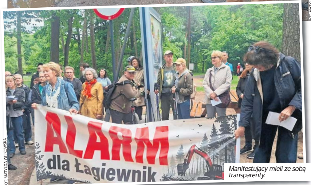
Manifestujący mieli ze sobą transparenty.

we atrakcje Akademii Leśnej Przyjaciela.