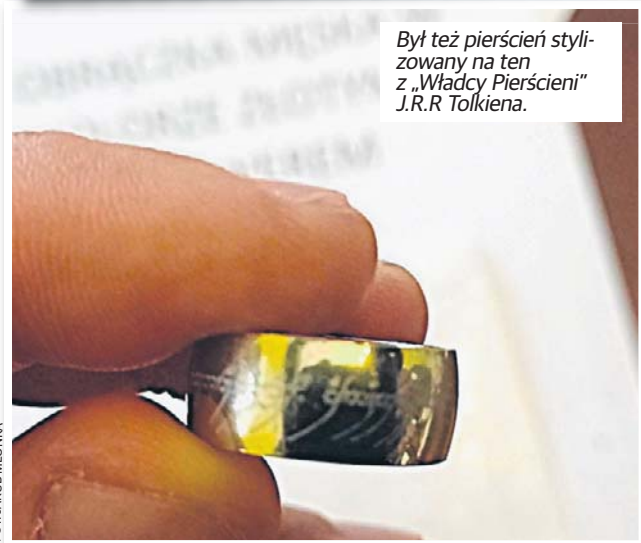
Był też pierścień stylizowany na ten z „Władcy Pierścieni” J.R.R. Tolkiena.

złoty, dzięki czemu nowy właściciel zdobył go za symboliczną cenę.