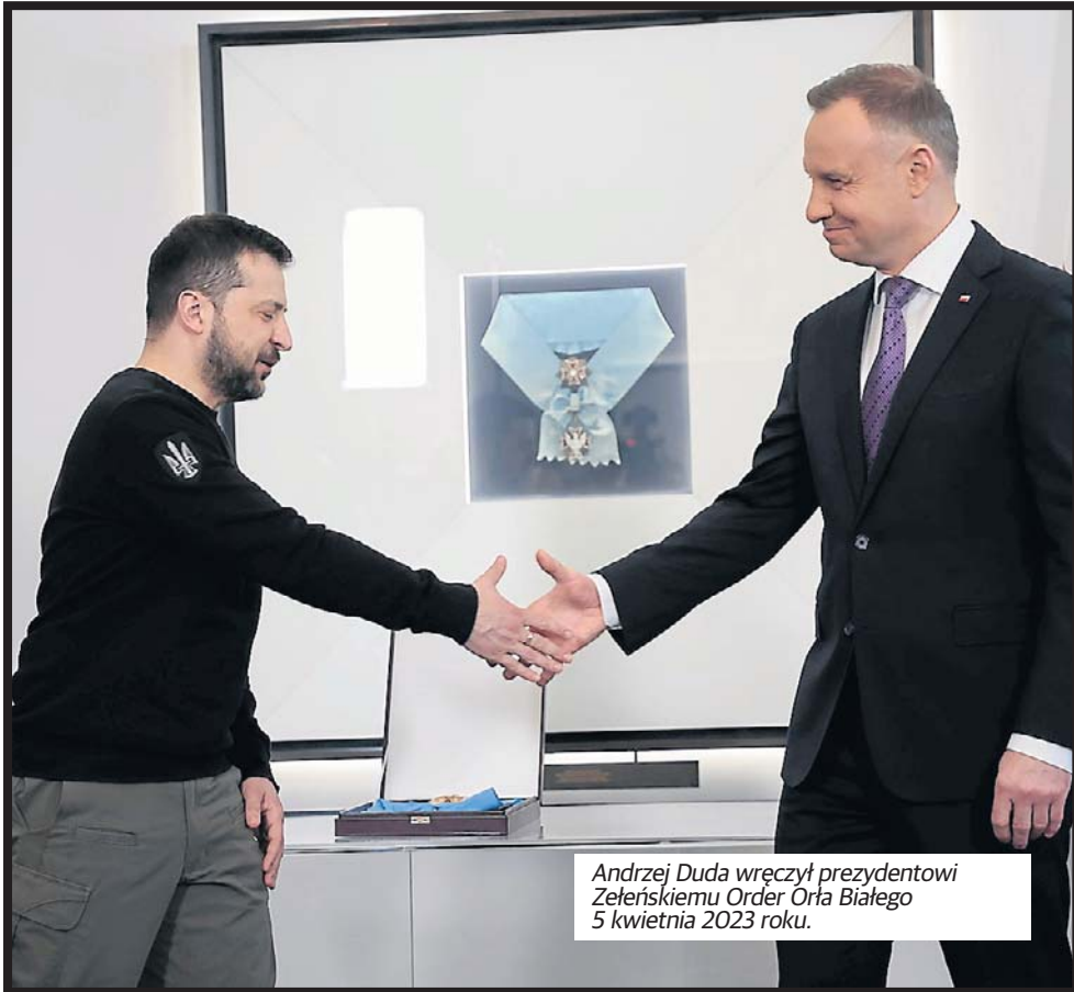
Andrzej Duda wręczył prezydentowi Zeleńskiemu Order Orła Białego 5 kwietnia 2023 roku.