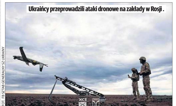
Ukraińcy przeprowadzili ataki dronowe na zakłady w Rosji.