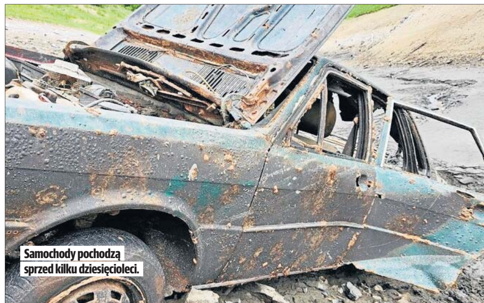
Samochody pochodzą sprzed kilku dziesięcioleci.