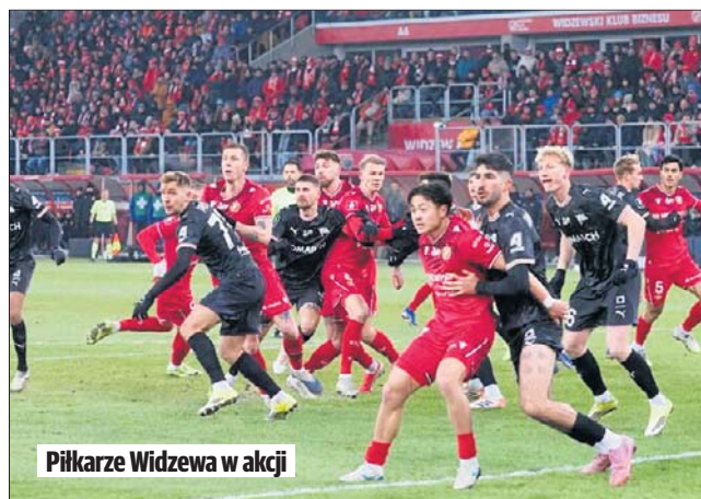
Piłkarze Widzewa w akcji

w jaki dzień odbędzie się ten mecz. Kolejka rozłożona jest na cztery dni, zaczyna się w piątek, a kończy w poniedziałek. Pozostałe pary pierwszej serii: Wisła Kraków - GKS Katowice , Radomiak - Wieczysta Kraków , Pogoń Szczecin - Legia Warszawa , Raków Częstochowa - Wisła Płock , Jagiellonia Białystok - Korona Kielce , Górniki Zabrze - Śląsk Wrocław , Zagłębie Lubin - Piast Gliwice , Lech Poznań - Cracovia