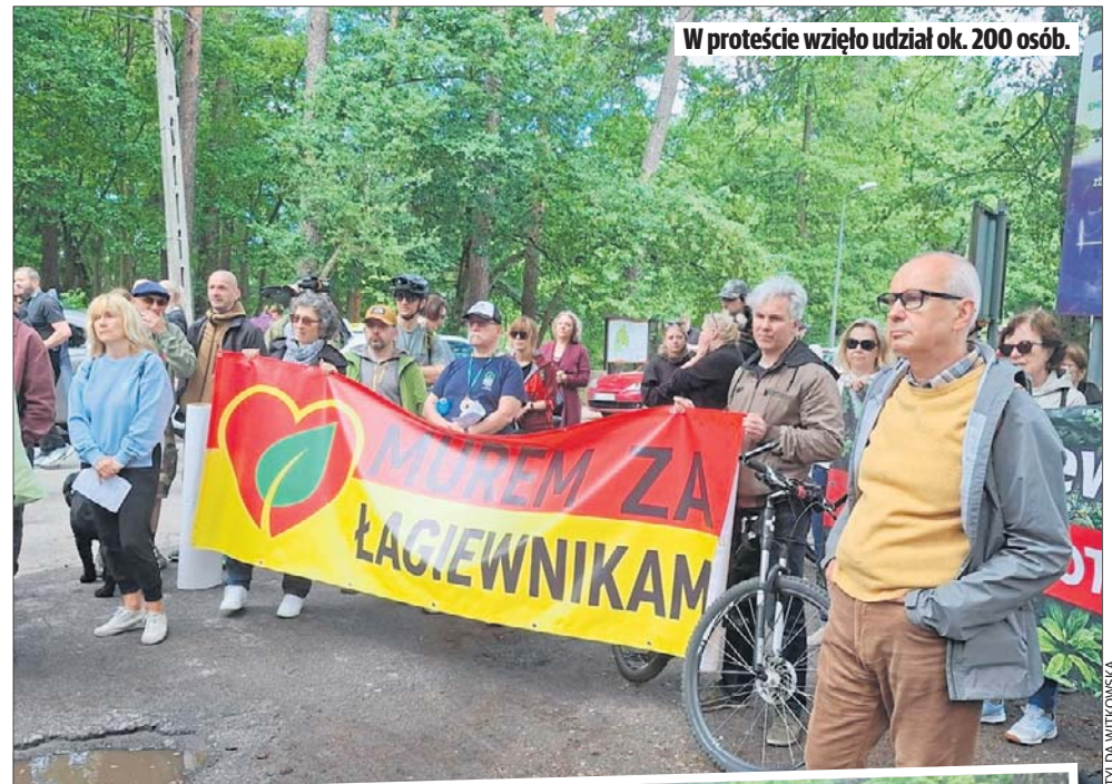
W proteście wzięło udział ok. 200 osób.

Kilka dni temu, przed długim weekendem prezydent Łodzi Hanna Zdanowska i jej urzędnicy na stronach internetowych magistratu pochwalili się projektami, które mają być zrealizowane w Łągiewnikach w najbliższych latach. Na liście pojawiły się m.in. wieża widokowa na Górze Rogowskiej, stumetrowa ścieżka w koronach drzew na nieznaną jeszcze działkę, kładki spacerowe przy Okólnej, ścieżka do źródeł Bzury i no-