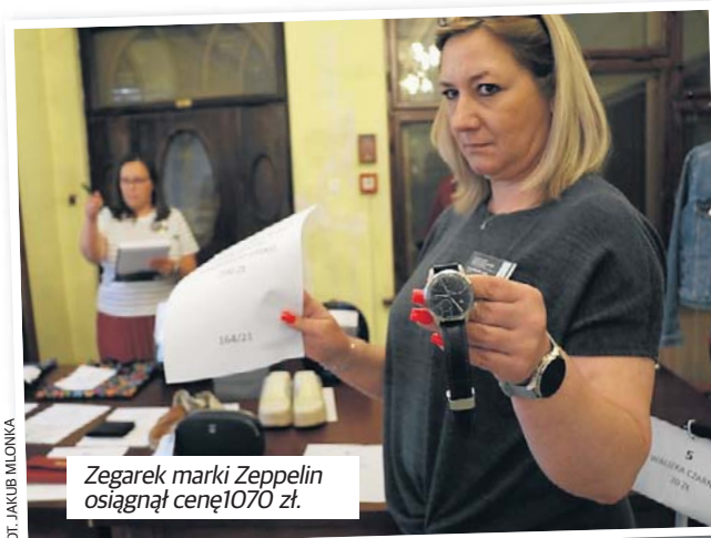
Zegarek marki Zeppelin osiągnął cenę 1070 zł.

Z kolei najtańszym przedmiotem wystawionych podczas aukcji był portfel. Licytacja zakończyła się na kwocie zaledwie 5