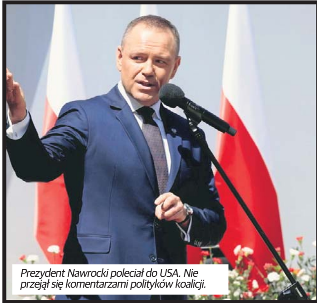
Prezydent Nawrocki poleciał do USA. Nie przejął się komentarzami polityków koalicji.

- Ja nawet lubię oglądać sporty walki, ale takie, w których funkcjonują jakieś zasady związane z tradycją rycerską - stwierdził Jarosław Kaczyński, komentując zaproszenie dla prezydenta Nawrockiego od Trumpa. - Na przykład, bokser, który obala na ziemię uderzeniem innego boksera, nie rzuca się na niego i nie bije go