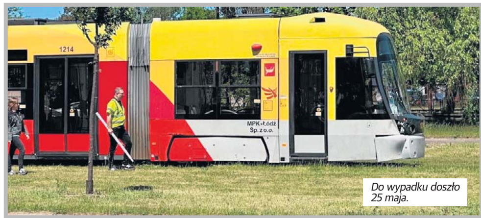
Do wypadku doszło 25 maja.