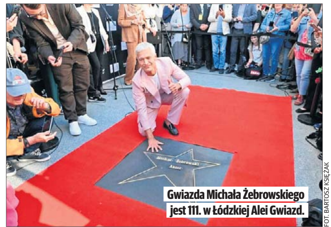
Gwiazda Michała Żebrowskiego jest 111. w Łódzkiej Alei Gwiazd.

Sapkowski. W dodatku już na początku swojej artystycznej drogi zdobył trzy najważniejsze nagrody na XIII Festiwalu Szkół Teatralnych w Łodzi w 1995 roku, co nigdy wcześniej się nie zdarzyło. Zdobyl nagrodę za najlepszą rolę męską w przedstawieniach „Odprowa posłów greckich”, „Opowiadanki Pana Cogito” oraz „Miłość i gniew”, a także nagrodę publiczności i nagrodę Jana Machulskiego. Od 2010 r. jest na stałe związany artystycznie i biznesowo z Teatrem 6.piętro w Warszawie,