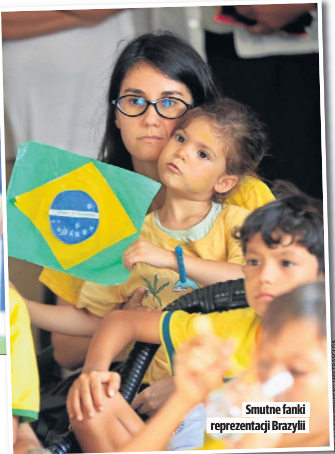
Smutne fanki reprezentacji Brazylii

W drugim meczu tej grupy Szkocja wygrała z Haiti 1:0 (1:0). Bramki: John McGinn (28). W drugiej kolejce fazy grupowej Brazylii zmierzy się z Haiti, a Maroko - ze Szkocją.