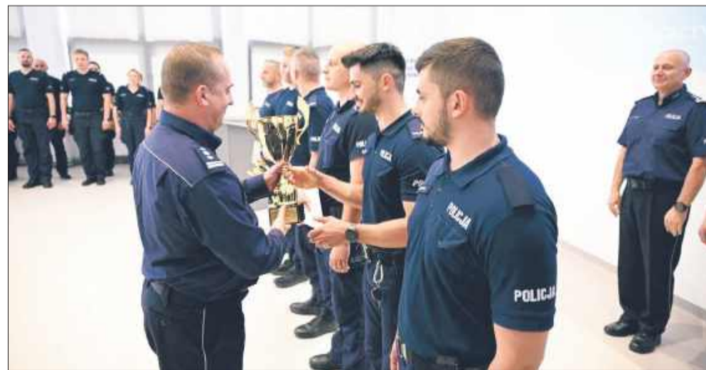
Zwycięstwo w finale konkursu „Patrol Roku 2025” dla mielczan.

Policjanci rywalizowali w trzech konkurencjach: teście wiedzy zawodowej, strzelaniu z broni palnej, oraz torze prze-