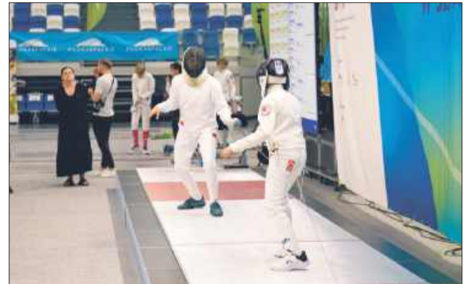
Chwila skupienia przed uderzeniem.

W hali sportowo-widowiskowej MOSiR w Mielcu odbyły się indywidualne zmagania w ramach Mistrzostw Polski Młodzików w Szpadzie 2025. Wydarzenie zgromadziło setki młodych zawodniczek i zawodników z całego kraju, którzy rywalizowali o tytuł mistrza Polski w swoich kategoriach. Atmosfera była gorąca nie tylko na planszach – trybuny wypełniły się kibicami, którzy głośnym dopingiem wspierali uczestników.