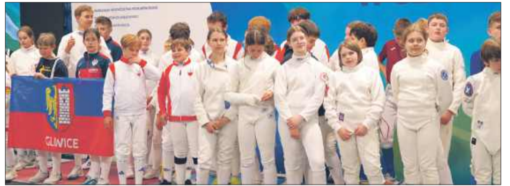
Zawodnicy z różnych zakątków Polski zebrali się w Mielcu, by rywalizować fair play.

W hali sportowo-widowiskowej MOSiR w Mielcu odbyły się indywidualne zmagania w ramach Mistrzostw Polski Młodzików w Szpadzie 2025. Wydarzenie zgromadziło setki młodych zawodniczek i zawodników z całego kraju, którzy rywalizowali o tytuł mistrza Polski w swoich kategoriach. Atmosfera była gorąca nie tylko na planszach – trybuny wypełniły się kibicami, którzy głośnym dopingiem wspierali uczestników.