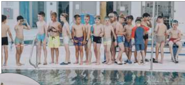
W zawodach wzięło udział wiele dzieci z mieleckich szkół.

W środę na Pływalni Krytej Hali MOSiR w Mielcu odbyła się III runda finałowa Zawodów Pływackich dla uczniów klas I-III szkół podstawowych. Wydarzenie zostało zorganizowane przez MKS IKAR Stal Mielec i zgromadziło młodych pływaków z całego regionu.