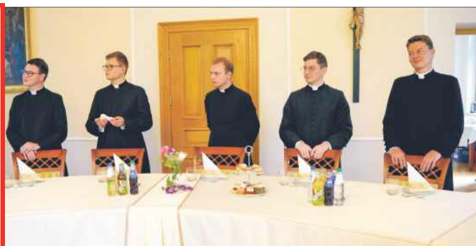
Neoprezbiterzy w oczekiwaniu na przydzielenie do pierwszej parafii.