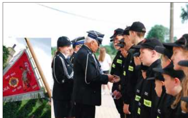
Wyróżnienia dla MDP w Trzcianie.