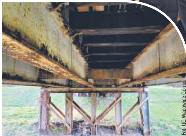
Nowy most na Jamnicy coraz bliżej!