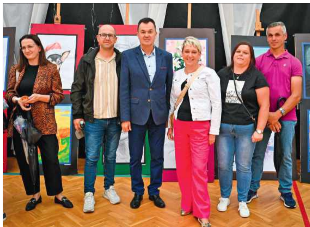
Na wystawie prac uczestników warsztatów plastycznych.