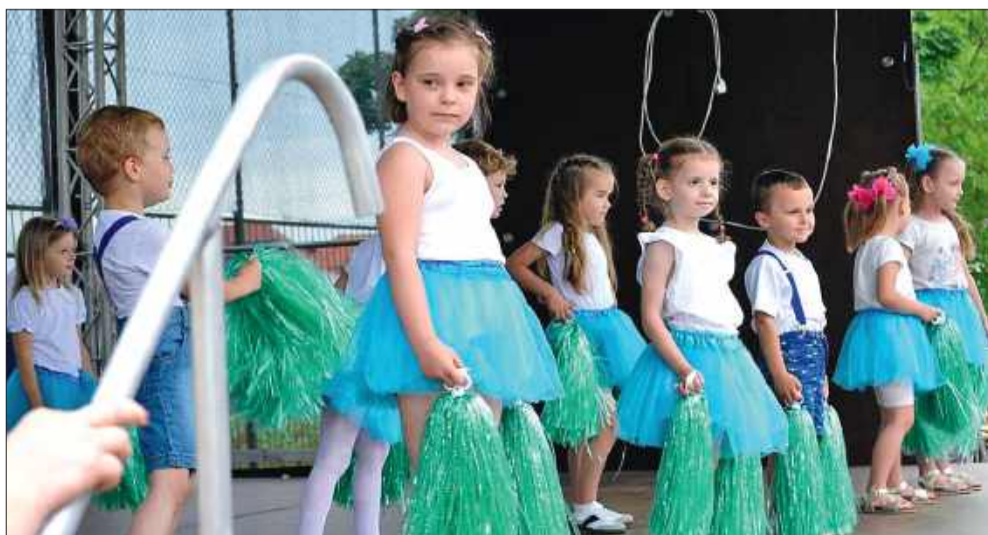
Na scenie zaprezentowały się dzieci i młodzież z lokalnych szkół i przedszkoli.