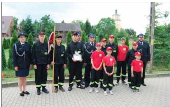
Uroczystość Nadania Proporca MDP.

Nadanie proporca to symbol dumy, odpowiedzialności i służby – wartości, które młodzi druhowie będą nieść ze sobą przez całe życie. „Bogu na chwałę ludzimu na pożytek”. ak