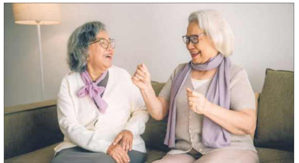
Uśmiech to najlepszy lek.

Sposobów na poprawę samopoczucia może być znacznie więcej, zawsze jednak chodzi o przekierowanie uwagi z tego, co nieprzyjemne i negatywne, na coś, co budzi przyjemne odczucia i generuje pozytywny nastrój. Warto pamiętać, że dobry humor