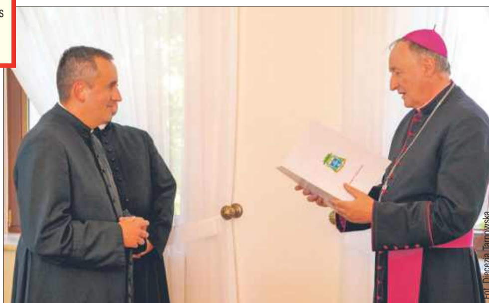
Nowi proboszczowie rozpoczną swoją posługę w parafiach w najbliższych tygodniach.