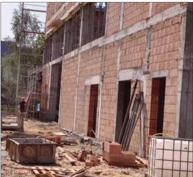
Hala rośnie z dnia na dzień.