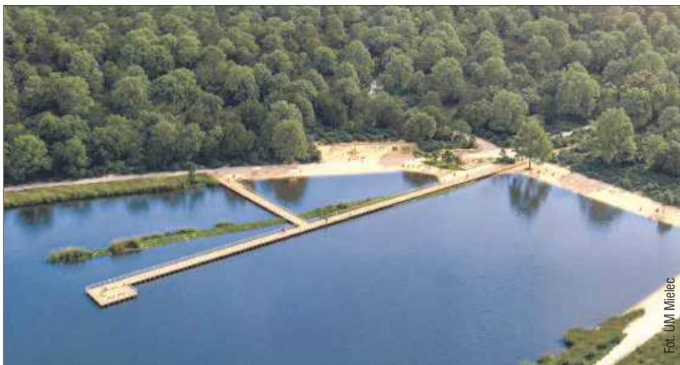
Tak Stawy Cyranowskie mają wyglądać po rewitalizacji.