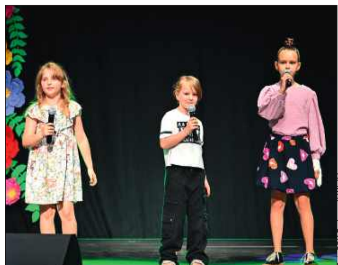
Oprawę muzyczną wydarzenia zapewnili uczniowie z Samorządowego Ogniska Muzycznego.