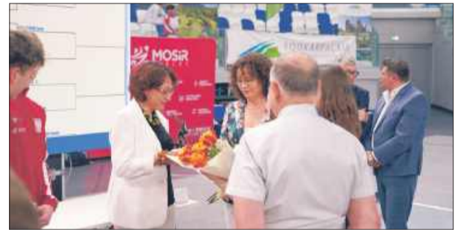
Z udziałem zawodników, trenerów i zaproszonych gości rozpoczęto sportowe święto mieleckiej szermierki.

W sobotę rozegrano walki grupowe kobiet i mężczyzn, a także odbyła się uroczysta ceremonia otwarcia, podkreślająca wyjątkowy charakter tegorocznych mistrzostw. W 2025 roku mielecka szermierka obchodzi jubileusz 70-lecia, co nadaje imprezie jeszcze większego znaczenia i splendoru.