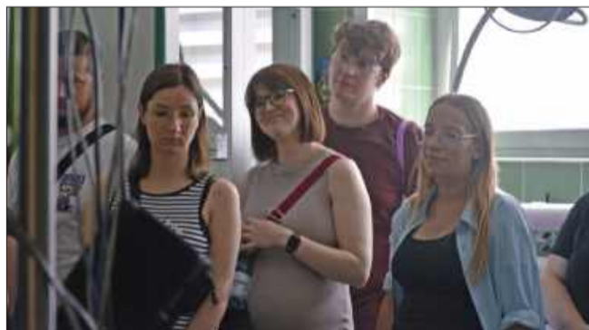
Przyszli rodzice na oddziale noworodkowym.