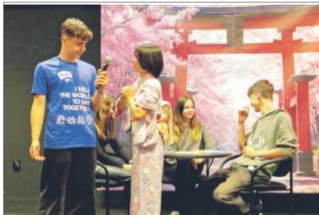
Dzięki takim inicjatywom, świat staje się nieco mniejszy, a Mielec – bardziej międzynarodowy niż kiedykolwiek.

Jak mają się sushi, ramen, origami i ceremonia parzenia herbaty do pizzy, prosciutto crudo, makaronów i... tortilli? Tak samo jak kultura Japonii do kultury Włoch i Gwatemali – różnią się, ale każda z nich ma coś wyjątkowego do zaoferowania. Właśnie to udowodniło wydarzenie edukacyjne „Kultura na talerzu”, które odbyło się 3 czerwca w Domu Kultury Samorządowego Centrum Kultury w Mielcu.