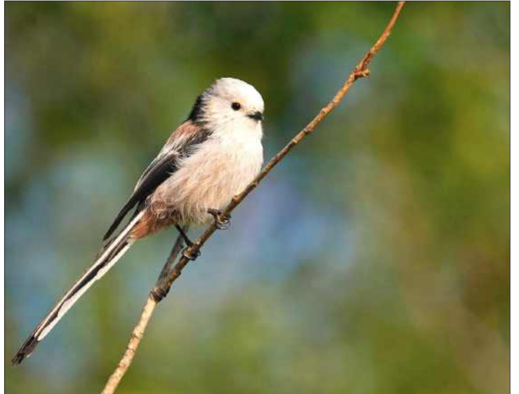
... i raniuszek.

W Mielcu ponownie narasta sprzeciw wobec planowanej przez miasto inwestycji na terenie Dzikich Stawów Cyranowskich – unikatowego obszaru przyrodniczego, który od dziesiątek lat stanowi ostoję dzikiej fauny i flory oraz miejsce odpoczynku dla mieszkańców. Nowe plany zagospodarowania tego terenu przedstawione przez miasto budzą ogromne kontrowersje. Organizacje ekologiczne, przyrodnicy i fotografowie alarmują: ingerencja w ten ekosystem doprowadzi do jego nieodwracalnej degradacji.