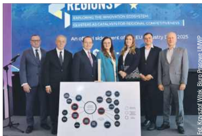
Polskie Centrum Certyfikacji i Rozwoju Systemów Bezzałogowych, planowane w Tuszowie Narodowym, może odegrać istotną rolę w kształtowaniu europejskiego ekosystemu technologii dronowych.