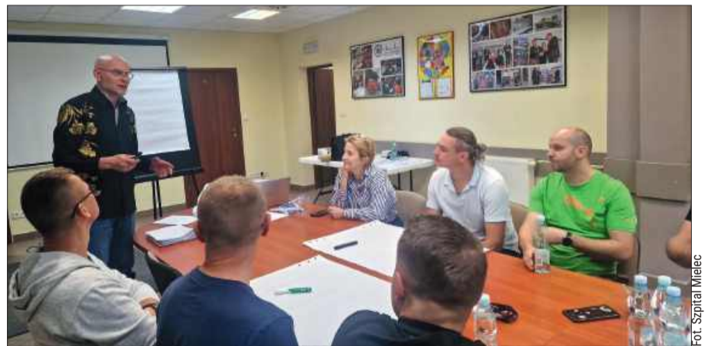
Mieleccy ratownicy uczą się rozmawiać z agresywnym pacjentem.

– Podczas szkolenia ratownicy mogli podawać przykłady sytuacji, które były dla nich