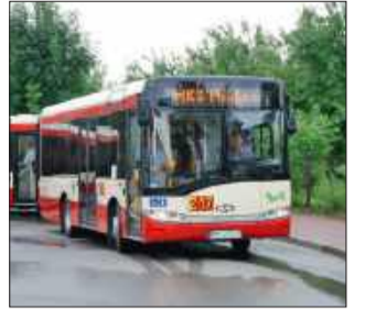
Jaka będzie przyszłość mieleckiego MKS-u?