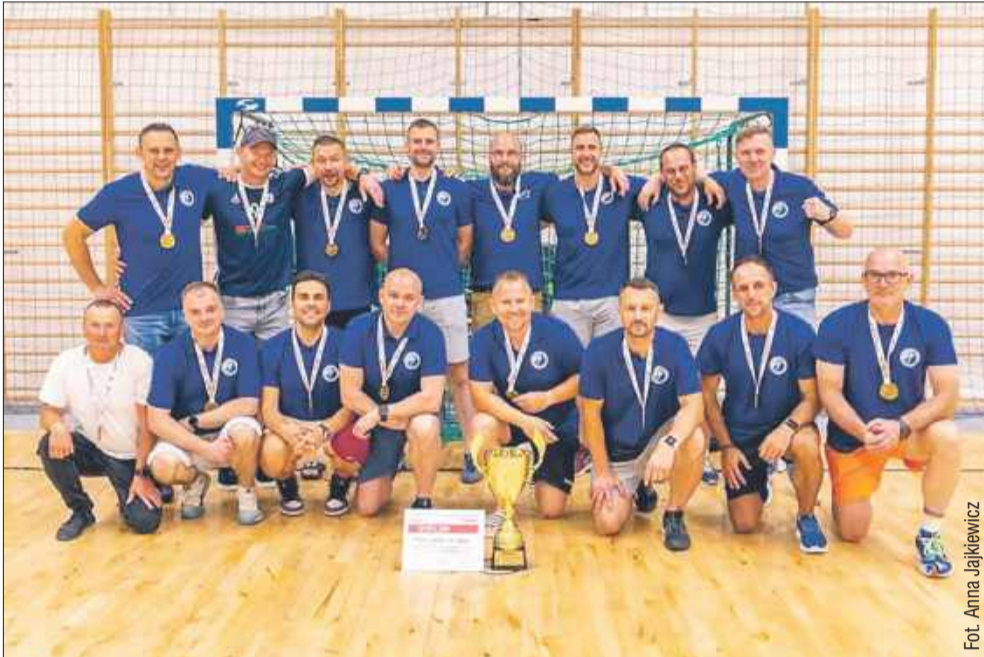
Mielczanie wygrali wszystkie mecze.

Sukces naszej drużyny! Drużyna Masters Handball Stal Mielec została mistrzem Polski w kategorii +35 mężczyzn.