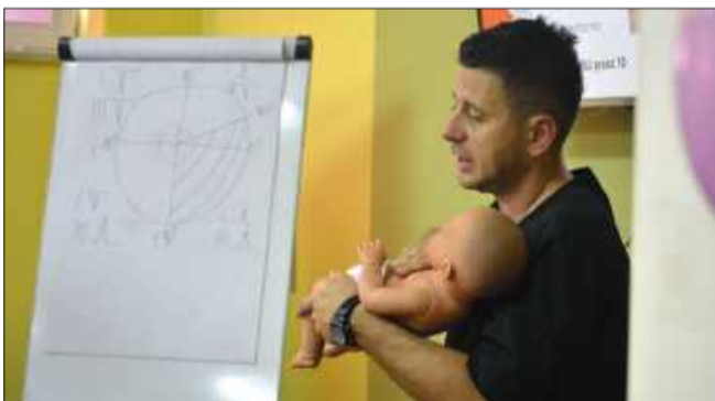
Jednym z głównych punktów zwiedzania była nauka pierwszej pomocy.