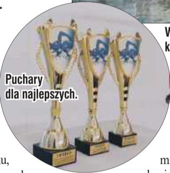
Puchary dla najlepszych.

w a n i pamiątkowymi dyplomami, medalami oraz nagrodami. Wydarzenie zakończyło się oficjalną klasyfikacją szkół, w której udział wzięły: