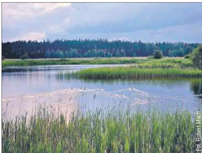
A tak wyglądają teraz.

W ramach projektu zaplanowano kompleksową modernizację otoczenia jednego ze stawów – tego położonego najbliżej ulicy Partyzantów. Znajdzie się tam m.in. duży, wygodny parking na kilkadziesiąt samochodów, pomost na wodzie, plac zabaw, wiatka piknikowa oraz niezbędne udogodnienia – ławki, kosze na śmieci, stojaki rowerowe i przenośne toalety. Dodatkowo powstaną plaże oraz wygodna, utwardzona ścieżka o szerokości trzech metrów, prowadząca do samego stawu.