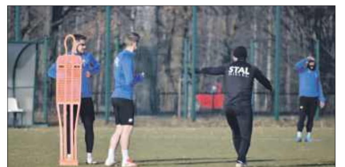
Rozgrywki Fortuna 1 Ligi rozpoczną się w weekend 18 lipca.