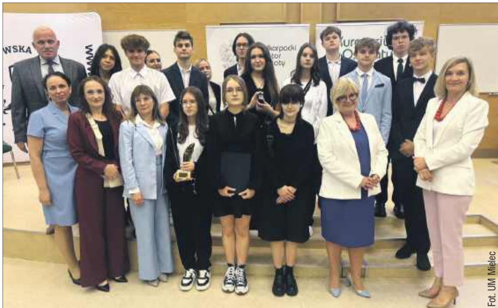
Wielki sukces na Gali Kuratorskiej w Rzeszowie.

W murach WSPiA Rzeszowskiej Szkoły Wyższej odbyła się uroczysta Gala Laureatów konkursów przedmiotowych organizowanych przez Podkarpackiego Kuratora Oświaty. To właśnie podczas tego wydarzenia wyróżniono najlepszych uczniów województwa podkarpackiego.