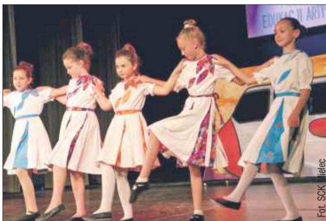
Uczniowie w finałowym popisie pokazali, na co ich stać!