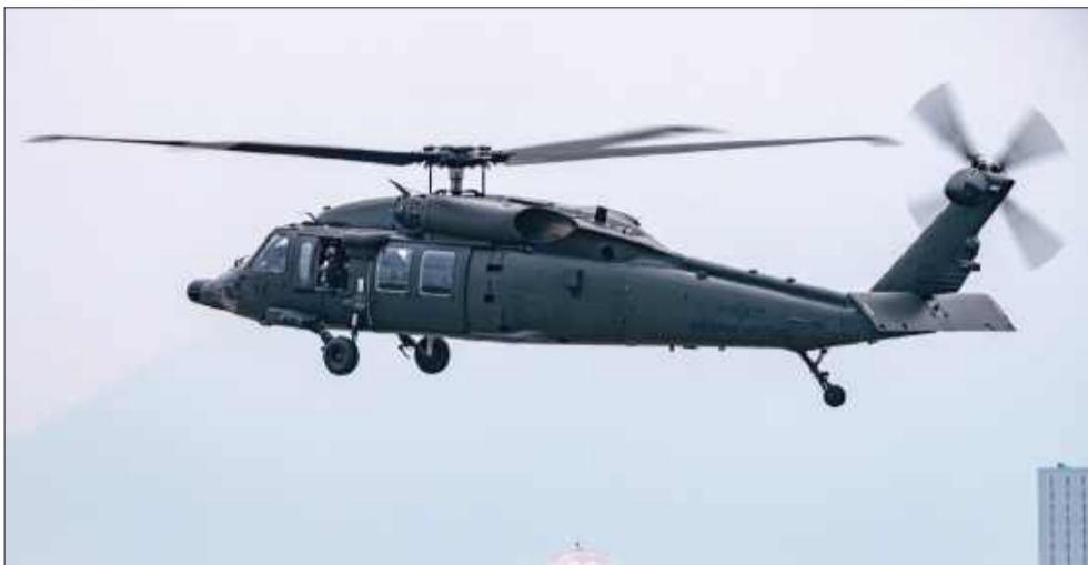
Agencja Uzbrojenia unieważniła przetarg na Black Hawki.

„Polscy użytkownicy polegają obecnie na śmigłowcach Black Hawk podczas swoich misji i jesteśmy głęboko przekonani, że Black Hawk jest idealną platformą do dalszego wspierania i wzmocnienia bezpieczeństwa narodowego Polski. Będziemy kontynuować naszą długoletnią współpracę z Polską, w ramach której lokalny przemysł i 1700 pracowników PZL Mielec uczestniczy w produkcji myśliwców F-16 i śmigłowców Black Hawk,