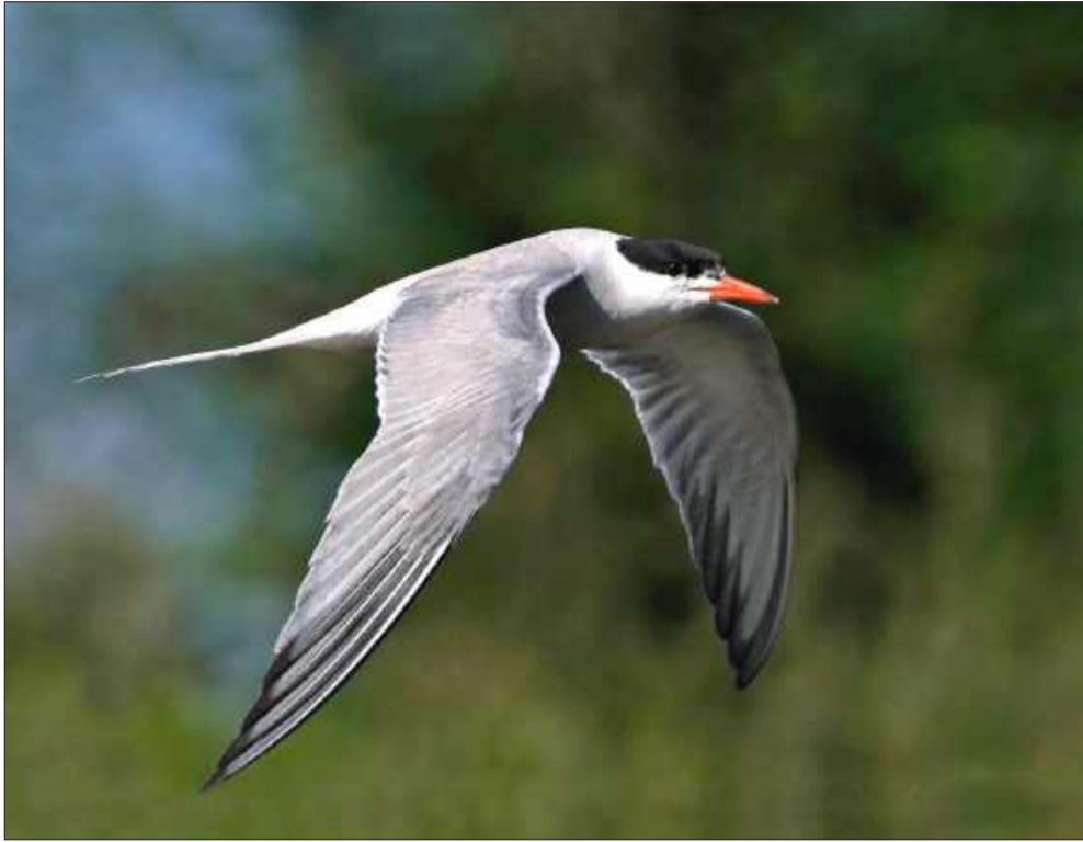
Bywalcy Stawów Cyranowskich: rybitwa rzeczna...