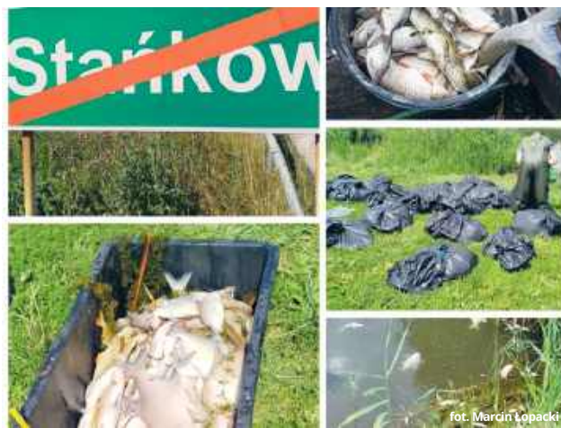
Śledczy na nowo podejmą wątek niebezpiecznego incydentu, jaki miał miejsce w lipcu ubiegłego roku na zbiorniku w Stańkowie.

Wszystkie czynności prowadzone były „w sprawie nieumyślnego zanieczyszczenia w dniach 10-11 lipca 2025 r. w Chełmie wody rzeki Uherka oraz zbiornika retencyjnego Stańków substancją, która spowodowała istotne obniżenie jakości wody, a także zniszczenie w świetle zwierzęcym o znacznych rozmiarach, poprzez dokonanie zrzutu nieprzetworzonych ścieków przez pracowników Miejskiego Przedsiębiorstwa Gospodarki Komunalnej w Chełmie do rzeki Uherka w związku z eksploatacją instalacji działającej w ramach zakładu, w zakresie korzystania ze środowiska, na