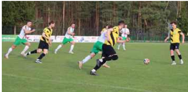
Vitrum Wola Uhruska - Eko Różanka