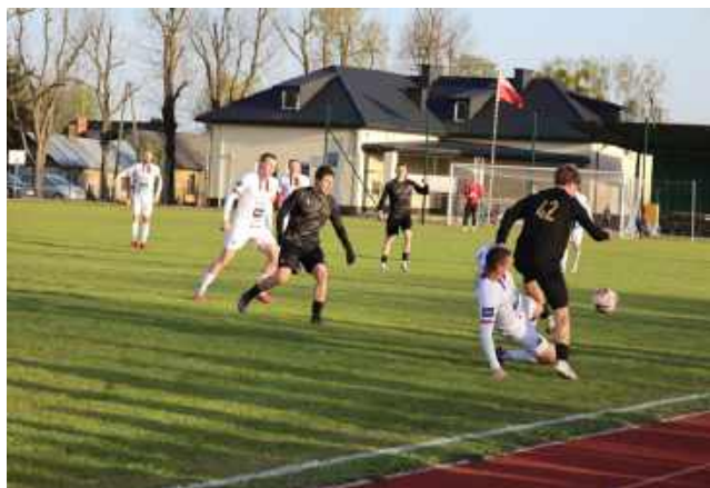
Unia Rejowiec - Astra Leśniowice