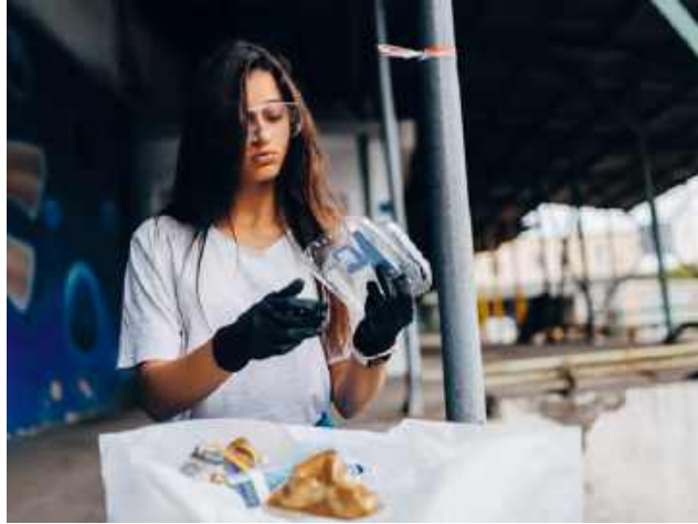
Władze gminy zapewniają, że inwestycja związana z organizacją lokalnego PSZOK będzie jeszcze szczegółowo analizowana i dyskutowana z mieszkańcami.

W odpowiedzi na te zarzuty, zastępczyni wójta gminy Sawin, Ewa Zalewska, wyjaśniła nam, że spotkania w Łowczej-Kolonii oraz Malinówce miały charakter wyłącznie informacyjny i służyły wstępnemu rozeznaniu opinii publicznej. Podkreśla, że żadna z wymienianych działek nie