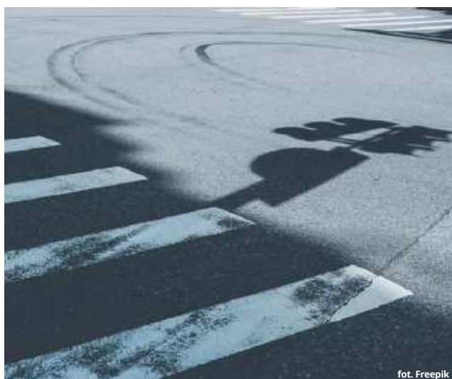
O dodatkowe przejście dla pieszych gmina zabiega już od dłuższego czasu. W tej chwili trudno jednak powiedzieć, kiedy konkretnie mieszkańcy mogliby skorzystać z nowej infrastruktury.