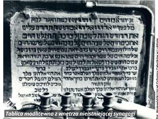
Tablica modlitwenna z wnętrza nieistniejącej synagogi

Tablica ta była unikalnym zapisem aszkenazyjskiej liturgii synagogałnej. Udało się ustalić, że