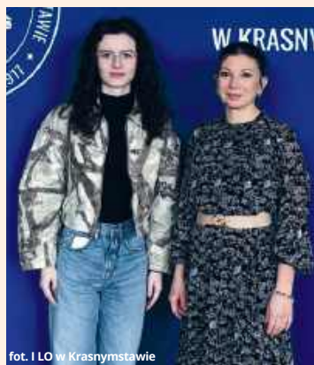
fol. I LO w Krasnymstawie

we zadania i swobodnie poruszać się po zagadnieniach wykraczających daleko poza podstawę programową.