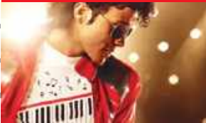
Muzyczny, Biograficzny, Dramat

MICHAEL to film o życiu i spuściznie jednego z najbardziej wpływowych artystów, jakich kiedykolwiek znał świat. To film o pełnej emocji podróży Jacksona od początków jego kariery w Jackson Five, aż do zdobycia statusu wizjonerskiego artysty napędzanego nieustającą twórczą ambicją. W tytułową rolę wcieliła się Jaafar Jackson, bratanek Michaela, debutant, który w wyjątkowy sposób oddaje fizyczność i emocjonalną prawdę kryjącą się za ewolucją Michaela od cudownego dziecka do światowej ikony. CHELM CKF ZORZA: 30.04 – 21.00, 01.05 – godz. 18:00, 02.05 – godz. 17:00, 03.05 – godz. 15:15, 04.05 – godz. 18:00, 05.05 – godz. 20:30, 06.05 – godz. 18:00, 07.05 – godz. 21:00.