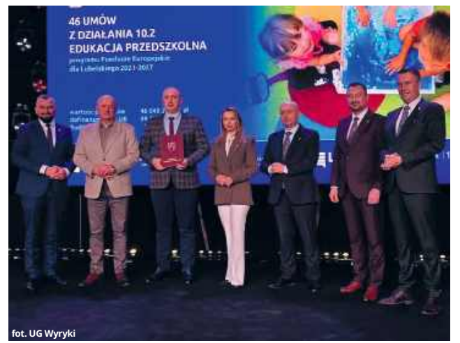
Ujęcie: UG Wyryki