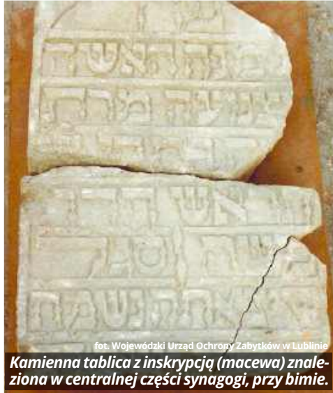
Kamienna tablica z inskrypcją (macewa) znaleziona w centralnej części synagogi, przy bimie.

Synagoga została wzniesiona pod koniec XVI w., prawdopodobnie w latach 1583-1585, na terenie kahału, na miejscu drewnianej synagogi, która