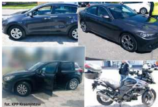
fort. KPP Krasnystaw

ściach kraju - na terenie województw śląskiego, dolnośląskiego i małopolskiego, a także lo-