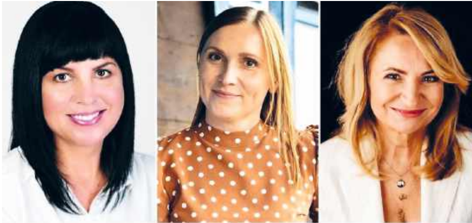
Kobiety w samorządzie: głos praktyki, doświadczenia i zmiany

Kobiet w polskiej polityce lokalnej jest coraz więcej, ale wciąż rzadko sięgają po najwyższe stanowiska. Choć ich udział w samorządach systematycznie rośnie, bariery społeczne, kulturowe i systemowe nadal ograniczają ich realny wpływ na decyzje. A to – jak podkreślają ekspertki – ma znaczenie nie tylko dla samej polityki, ale i jakości życia mieszkańców. O wyzwaniach, barierach i stylu zarządzania mówią samorządczynie z Chełma, Sawina i Białopola.