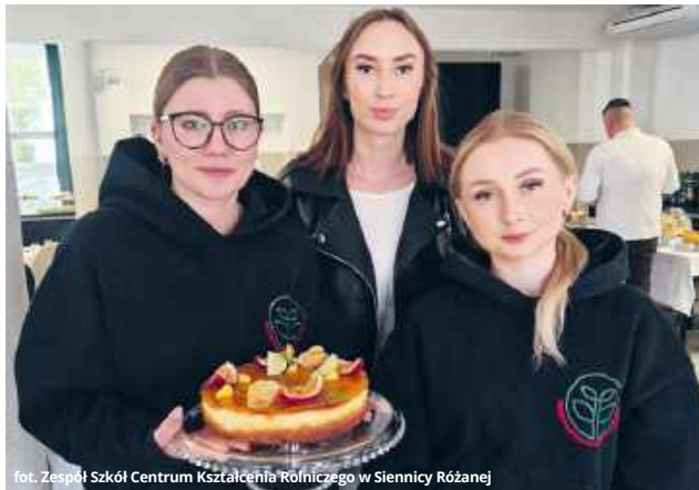
fol. Zespół Szkół Centrum Kształcenia Rolniczego w Siennicy Różanej

Tegoroczna edycja konkursu została w całości poświęcona sernikowi – jednemu z najbardziej klasycznych, ale jednocześnie wymagających deserów.