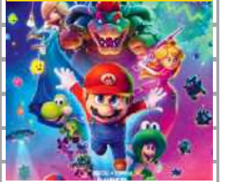
Przygodowy, Animacja, Komedia

Po tym jak Mario i Luigi udaremnił plan Bowsera na poślubienie Księżniczki Peach, muszą teraz zmierzyć się z nowym zagrożeniem ze strony jego syna. Bowser Jr. jest zdeterminowany, by uwolnić swojego uwięzionego ojca i przywrócić potęgę swojej rodziny. Z pomocą starych i nowych sojuszników bracia wyruszają w międzygwiazdową podróż, przemierzając kolejne planety, aby powstrzymać ambitnego dziedzica i jego niebezpieczną misję.