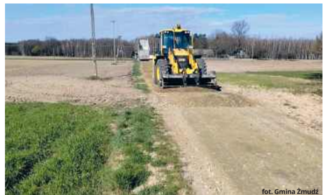
Na poprawę stanu dróg gruntowych gmina przeznaczyła tym razem ponad 162 tys. zł.

Głównym celem zadania była poprawa parametrów technicznych nawierzchni dróg gruntowych. Firma z miejsco-