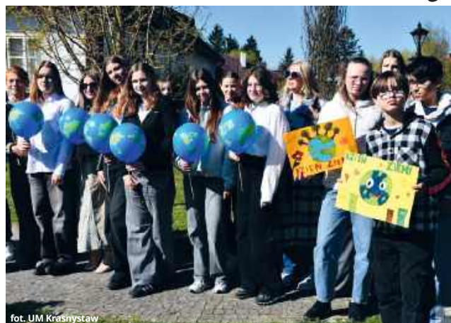
fol. UM Krasnystaw

To właśnie tam posadzono klon palmowy. Wybór nie był przypadkowy. Drzewo to uznawane jest za symbol harmonii, równowagi i piękna natury. Wyróżnia się charakterystycznymi, powycinanymi liśćmi oraz dużą zmiennością kolorystyczną – od