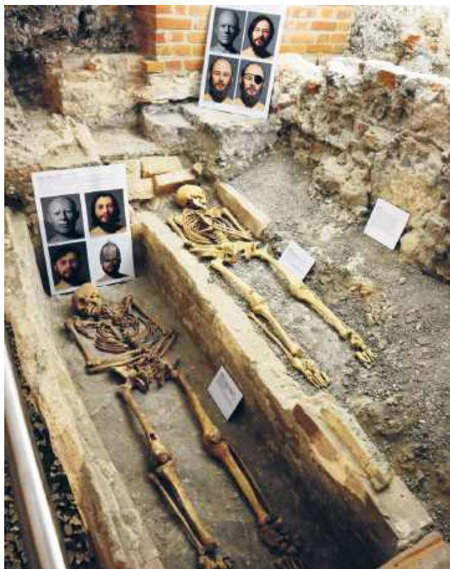
Chełm, bazylika pw. Narodzenia NMP, krypty, pomieszczenie pod północną zakrystią, rekonstrukcja twarzy kobiety, fot. archiwum Delegatury WUOZ w Chełmie

Jednym z kluczowych elementów było uporządkowanie przestrzeni krypt. W krypcie nr 2 oraz korytarzu prowadzącym do kolejnych pomieszczeń wykonano posadzkę z historycznej cegły, odtwarzając tzw. wążek wendyjski. Dzięki temu wyraź-