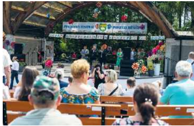
Amfiteatr w Nowinach podczas imprez tętni życiem.

● POW. CHEŁMSKI W czasie ostatniej sesji Rady Powiatu w Chełmie starosta Piotr Deniszcuk przedstawił plany dotyczące zagospodarowania terenu w miejscowości Nowiny. Kluczowym elementem nowej strategii zarządu powiatu jest lepsze wykorzystanie istniejącej tam infrastruktury kulturalnej.