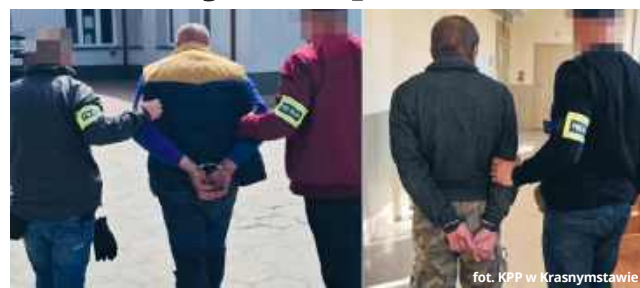
fort. KPP w Krasnymstawie

Agresja narastała, aż przerosła się w drastyczną przemoc fizyczną. Podczas jednej z ostatnich