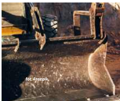
Władze gminy nie powinny mieć problemu z wyborem odpowiedniego wykonawcy dużej inwestycji drogowej.

Najniższą cenę przedstawiło Przedsiębiorstwo Wielobranżowe „Sadex” Janusz Sądlik z Sitna, wyceniając prace na nieco ponad 2,2 mln zł. Pozostałe propozycje wahają się od około 2,46 mln zł do 2,92 mln zł. Wśród oferentów znalazły się firmy z Lubartowa, Kraśnika, Zamościa, Siedlec oraz lokalny zakład z Pawłowa. Każdy z potencjalnych wykonawców zadeklarował 60-miesięczny okres gwarancji na wykonane prace. RC