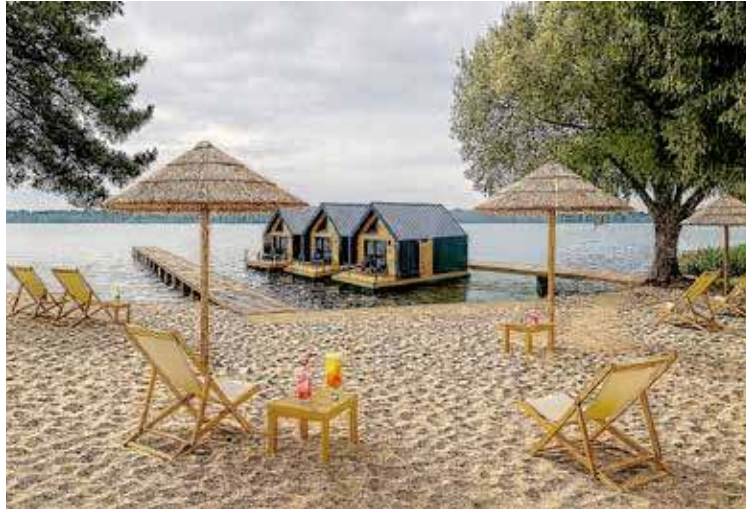
To jeden z wielu „projektów” atrakcji nowogardzkich Hawai

Warto w tym miejscu przypomnieć, że we wrześniu 25 roku Rada udzieliła burmistrzowi na jego wniosek zgody na zawarcie umowy dzierżawy około 2 ha terenu, który obejmowała całą plażę miejską wraz z infrastrukturą. Wydzierżawiający teren - za opłatę dzierżawną 100 zł miesięcznie! - zaprezentował projekt zagospodarowania z własnych środków tego obszaru z atrakcjami, których i Hawaje mogłyby pozazdrościć. Oczywiście dla rozsądnych to już wtedy pachniało śmieszna bajeczką, ale rada