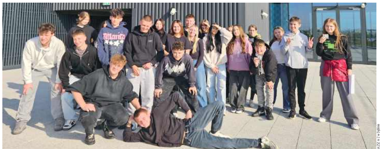
Kolejnym punktem programu była wizyta w Fabryce Czekolady E. Wedel, jednej z najbardziej rozpoznawalnych marek w Polsce. Uczniowie mieli niepowtarzalną okazję poznać tajniki produkcji czekolady, a także odkryć fascynujące historie związane z tą słodką tradycją

Po intensywnym wysiłku fizycznym przyszedł czas na chwilę relaksu i przyjemności. Kolejnym punktem programu była wizyta w Fabryce Czekolady E. Wedel, jednej z najbardziej rozpoznawalnych marek w Polsce. Uczniowie mieli niepowtarzalną okazję poznać tajniki produkcji czekolady, a także odkryć fascynujące historie związane z tą słodką tradycją. Wizyta w fabryce była nie tylko słodką przyjem-