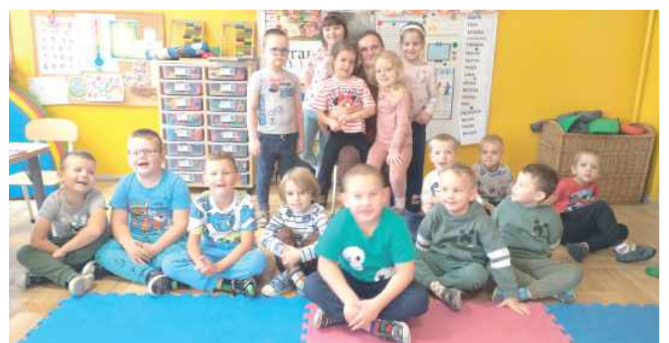
Przedszkolaki z Miejskiego Przedszkola nr 1 „Bajka” w Dęblinie - grupy „Sówki” i „Pszczółki” z zacięciem obejrzały animacje „Do góry nogami” oraz „Kopytka na łyżwach”

W kolejnych dniach w naszej bibliotece gościli uczniowie ze Specjalnego Ośrodka Szkolno-Wychowawczego im. Józefa Piłsudskiego w Dęblinie. Wzięli w nich udział zarówno uczniowie Szkoły Przesposabiającej do Pracy, jak i Szkoły Podstawowej nr 1. Wspólnie obejrzały film „Biuro Detektywistyczne Lassego i Mai. Rabuś z pociągu”, który wciągnął widzów w pełną tajemnicę i humor historii młodych detektywów.