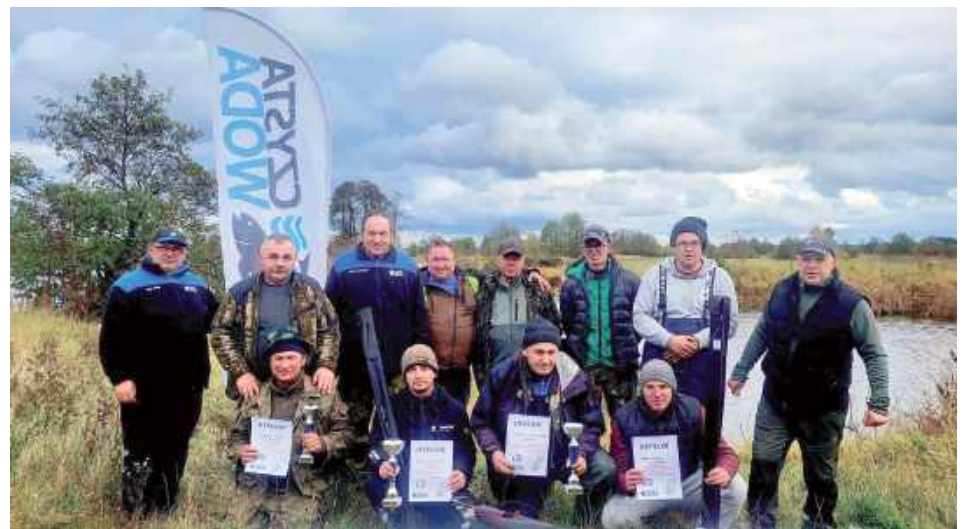
Pamiątkowe zdjęcie uczestników rywalizacji z wędką w wodzie

Organizatorzy podkreślają, że tego typu wydarzenia to nie tylko sportowa rywalizacja, ale przede wszystkim integracja środowiska wędkarskiego.