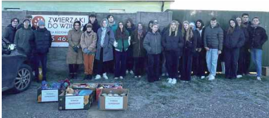
W trakcie wizyty uczniowie mieli okazję spędzić czas z podopiecznymi schroniska, spacerując z nimi i bawiąc się, co było dla wszystkich niezapomnianym przeżyciem

W poniedziałek, 20 października wolontariusze oraz uczniowie Liceum Marii Skłodowskiej-Curie w Rykach wzięli udział w wyjątkowej inicjatywie, która połączyła miłość do zwierząt i literatury. Pierwszym celem ich wycieczki było odwiedzenie schroniska dla