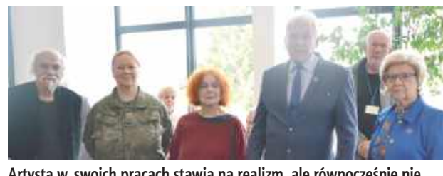
Artysta w swoich pracach stawia na realizm, ale równocześnie nie zapomina o atmosferze, która pozwala widzowi poczuć bliskość natury i jej przemiany

nicze pejzaże lasów oraz majestatyczne drzewostany, a w szczególności wizerunki króla puszczy – żubra. Gra światła i kolorystyka obrazów nadawały im niezwykle charakter, przyciągając uwagę każdego widza. Szerokie płótna oddały majestat puszczańskich sosen i brzoź, a ich rozmiary