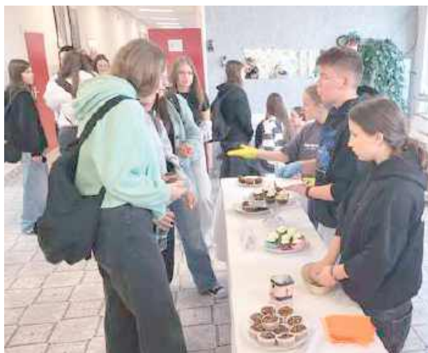
Wydarzenie cieszyło się dużym zainteresowaniem, a zebrane środki zostały przekazane na wsparcie Schroniska dla Bezdomnych Zwierząt w Puławach

Uczniowie samodzielnie przygotowali smaczne wypieki, które spotkały się z dużym zainteresowaniem ze strony społeczności szkol-