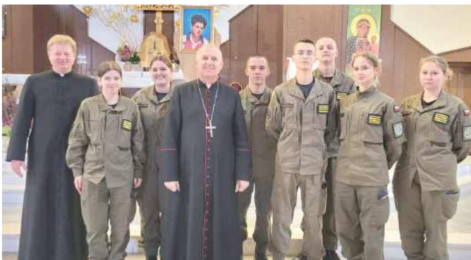
Młodzież z Zespołu Szkół im. Kajetana hr. Kickiego w Sobieszynie wzięła udział w Diecezjalnej Pielgrzymce Maturzystów do Sanktuarium w Radzynie Podlaskim. Wydarzenie, które organizowane jest corocznie, zgromadziło setki abiturientów z całej diecezji. To wyjątkowa okazja, aby tuż przed nadchodzącym egzaminem maturalnym powierzyć swoją przyszłość Bogu i Matce Bożej.