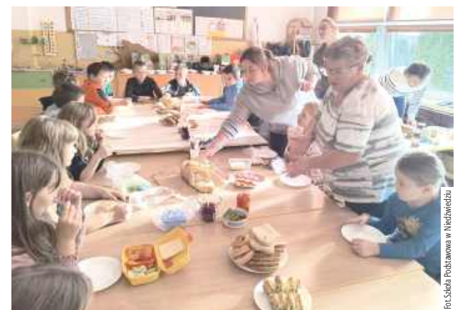
Był to pełen radości i smaku dzień, który na długo pozostanie w pamięci uczestników

W ramach obchodów Dnia Chleba mamy uczniów upie-