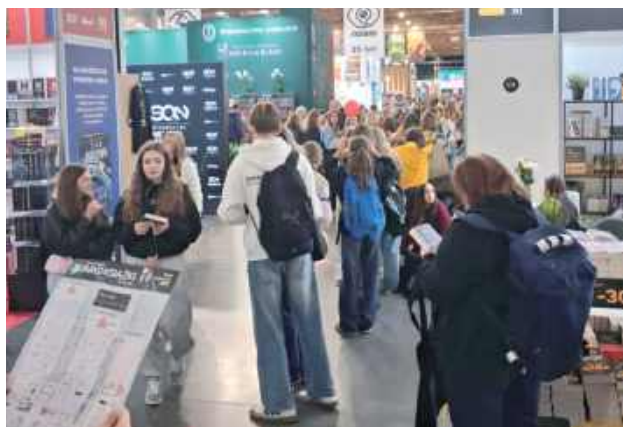
Udział w targach to dla nas nie tylko możliwość poznania nowości wydawniczych, ale też ogromna dawka inspiracji i motywacji do dalszej pracy - podsumowują bibliotekarki z Dębina

Wyjazd został zorganizowany z inicjatywy Stowarzyszenia Bibliotekarzy Polskich - Koła w Lublinie. Tegoroczna edycja wydarzenia odbyła się pod hasłem „Nie jestem ma-