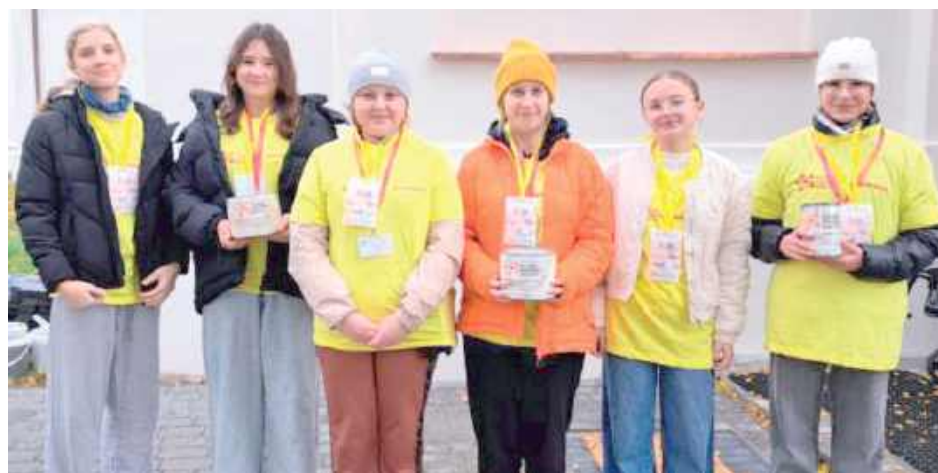
Dzięki wsparciu lokalnej społeczności udało się zebrać znaczną kwotę, która wesprze działalność fundacji

Zebrałe fundusze będą przeznaczone na dalszą działalność Fundacji, której celem jest