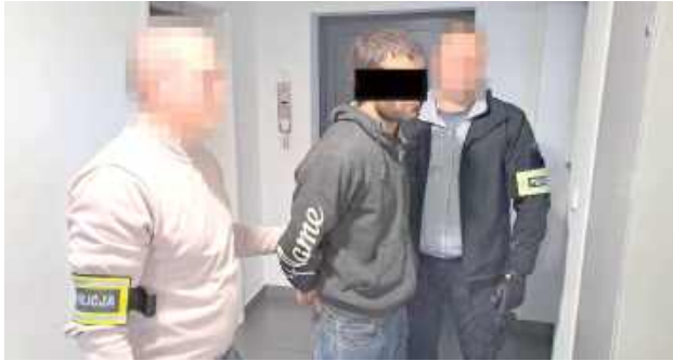
Ryccy kryminalni zatrzymali obywatele Gruzji i Ukrainy

Ryccy kryminalni zatrzymali obywateli Gruzji i Ukrainy podejrzanych o włamanie do domu w gminie Kłoczew. Oba grozi długa kara więzienia.