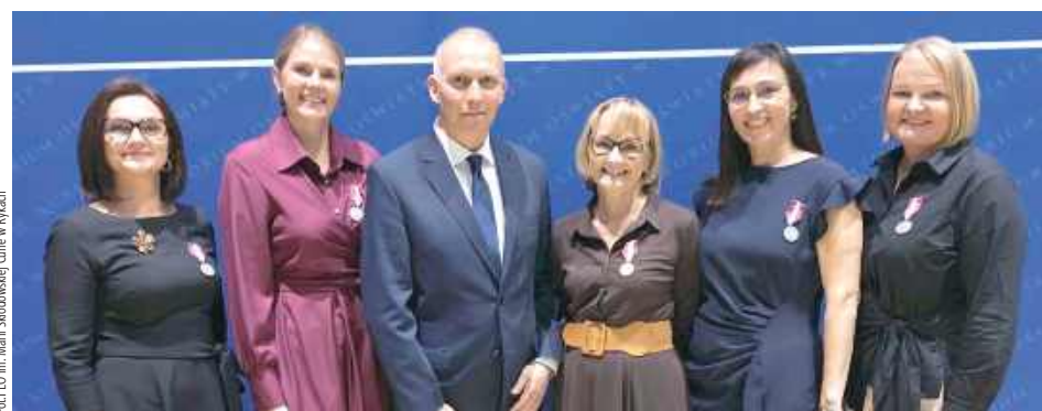
Wydarzenie było nie tylko wyrazem uznania dla wieloletniego zaangażowania nauczycieli, ale również stanowiło inspirację dla młodszych kolegów po fachu

Wręczenie medali miało miejsce w uroczystej atmosferze, a same nauczycielki odbierające wyróżnienia podkreślały, jak ważna jest dla nich możliwość dzielenia się swoją pasją i wie-