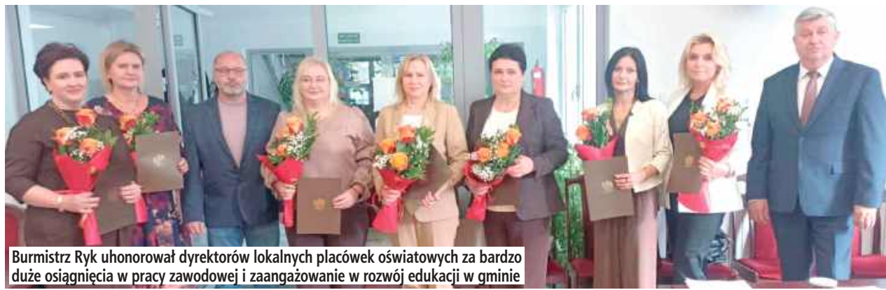
Burmistrz Ryk uhonorował dyrektorów lokalnych placówek oświatowych za bardzo duże osiągnięcia w pracy zawodowej i zaangażowanie w rozwój edukacji w gminie

Burmistrz Ryk uhonorował dyrektorów lokalnych placówek oświatowych za bardzo duże osiągnięcia w pracy zawodowej i zaangażowanie w rozwój edukacji w gminie. Wyróżnienia przyznano ze specjalnego funduszu burmistrza.