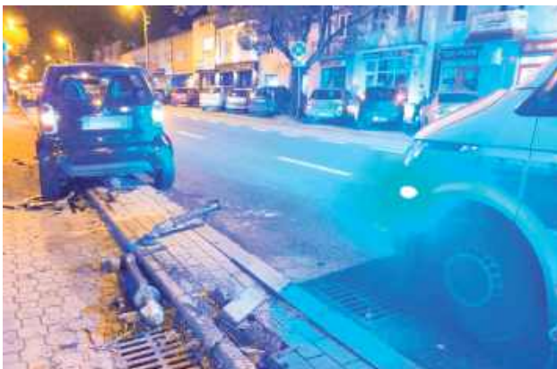
Kierowca Smarta wydmuchał 2,5 promila. Okazało się też, że ma cofnięte uprawnienia do kierowania pojazdami

2,5 promila alkoholu w organizmie miał mieszkaniec Puław, który spowodował kolizję w centrum miasta. Mężczyzna będący świadkiem i zgłaszający zdarzenie okazał się poszukiwanym przez policję.