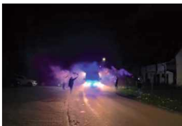
Uroczysty przyjazd nowego auta do jednostki w Stężyczy