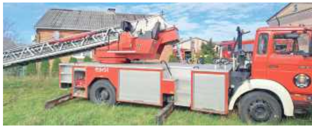
W akcji brały udział zastępy OSP z Ostrowa Lubelskiego, Kaznowa i Jam oraz JRG Lubartów

Jak informuje Ochotnicza Straż Pożarna w Ostrowie Lubelskim, w Kaznowie 1 listopada wybuchł pożar. Palił się dom mieszkalny. Straż pożarna otrzymała zgłoszenie około godziny 11.45.