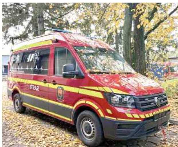
Ochotnicza Straż Pożarna w Stężyczy wzbogaciła się o zupełnie nowy, nowoczesny samochód ratowniczo-gaśniczy. To Volkswagen Crafter z 2025 roku, wart 396 306 zł, wyposażony w napęd 4x4, automatyczną skrzynię biegów i silnik o mocy 177 KM