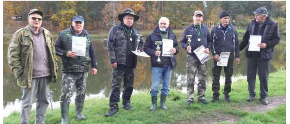
Pamiątkowe zdjęcie uczestników zmagania