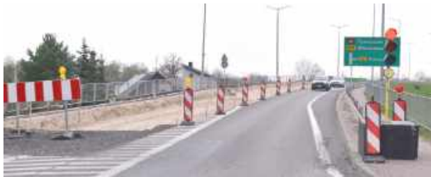
Wydaje się, że przed mieszkańcami Dęblina, ale nie tylko długie oczekiwanie na normalność

- Rozumiemy frustrację mieszkańców, ale prosimy o cierpliwość. To bardzo złożona inwestycja.