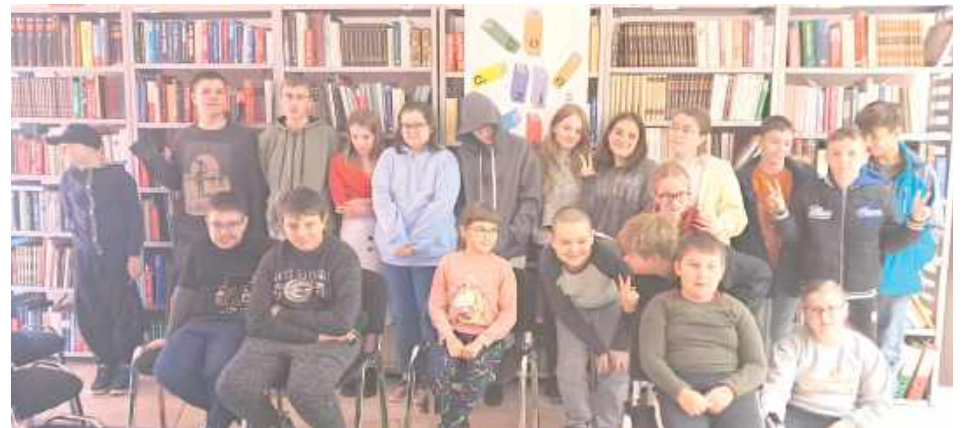
W bibliotece gościli uczniowie ze Specjalnego Ośrodka Szkolno-Wychowawczego im. Józefa Piłsudskiego w Dęblinie

W dniach tegorocznej Nocy Bibliotek nasza biblioteka zamieniła się w prawdziwe kino! W ramach ogólnopolskiej akcji, odbywającej się pod hasłem „Do dzieła!”, przez trzy dni zaprosiliśmy dzieci i młodzież na wyjątkowe filmowe spotkania.