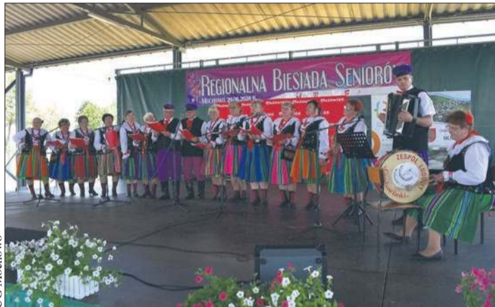
Wśród uczestników ubiegłorocznej Regionalnej Biesiady Seniorów w Mochowie był Zespół Ludowy „Grzybowianki”