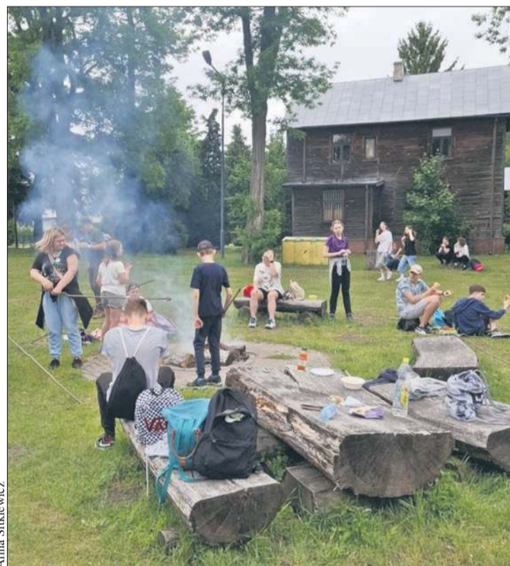
Zakończenie rajdu na polanie w Nadleśnictwie Łąck

W maju uczniowie płockich szkół podróżowali rowerami, hulajnogami, na rolnkach i deskorolkach. Znamy wyniki „Rowerowego maja”.