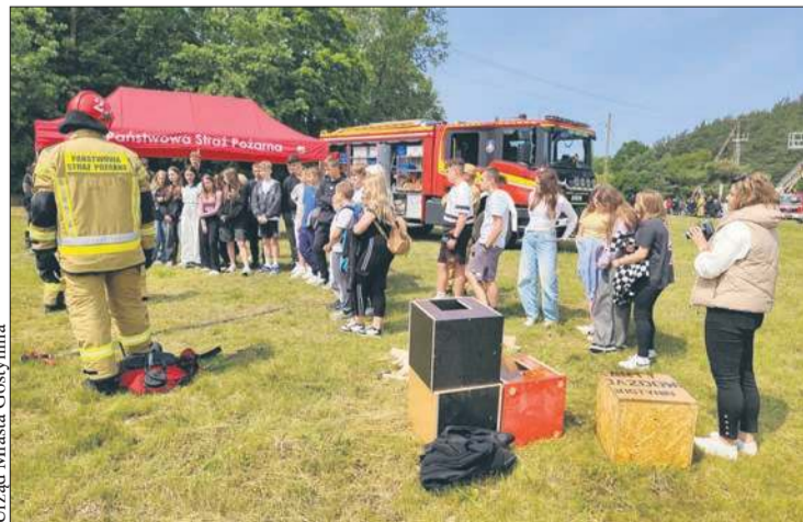
Wydarzenie pn. „Bezpieczne wakacje z Młodzieżowymi Drużynami Pożarniczymi” zgromadziło wiele dzieci i młodzieży z terenu powiatu gostynińskiego