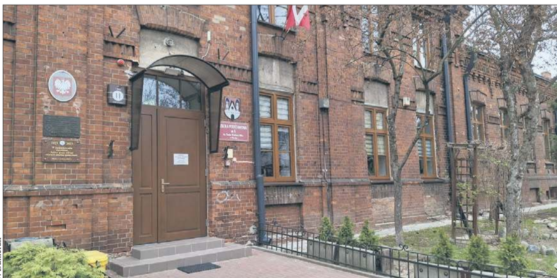
Szkoła Podstawowa nr 6 przy ul. 1 Maja