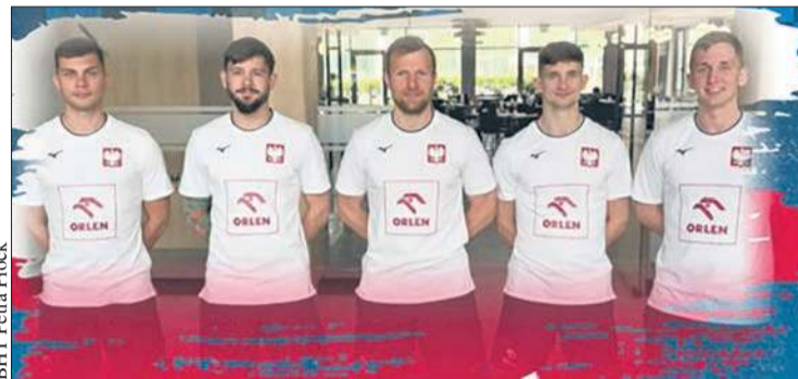
BHT Petra Płock

Płocka drużyna spisuje się w tym sezonie znakomicie. Po zdobyciu