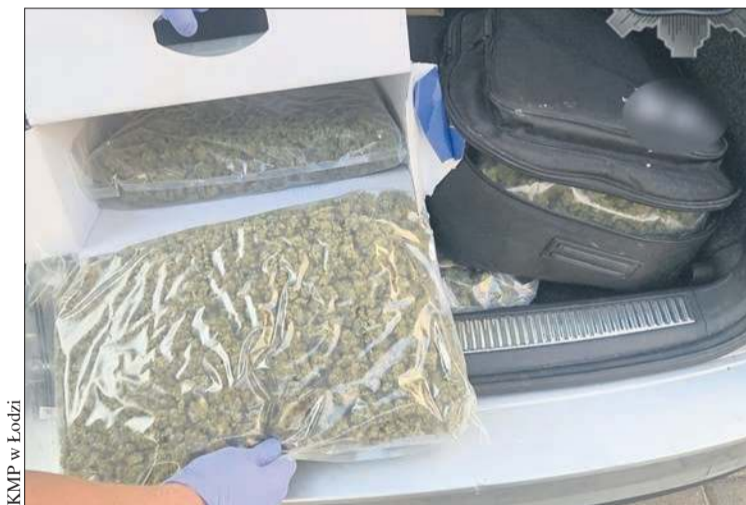
KMP w Łodzi

Kiedy patrolowali ten rejon, ich uwagę przykuł zaparkowany w okolicy pojazd i siedzący w nim mężczyzna, który był już wcześniej notowany. Podczas legitymowania poczuł silny zapach marihuany wydobywający się z wnętrza pojazdu. 26-latek zapytany, czy posiada jakieś niedozwolone substancje, przyznał, że w bagażniku jest 5 kilogramów różnych narkotyków – suszu roślinnego z THC, mefedronu i kokainy. Część z tych substancji schowana była w pokrowcu na gitarę. Podczas przeszukania stróża prawa znaleźli też przy mężczyźnie klucze. 26-latek nie chciał jednak zdradzić do czego one są. Funkcjonariusze szybko jednak ustalili mieszkanie, do którego zamka pasowały klucze,