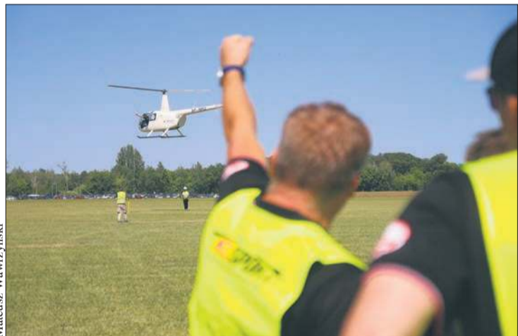
Widzowie mogli podziwiać umiejętności załóg startujących w zawodach

Sobota w Płocku to przede wszystkim Międzynarodowe Zawody Śmigłowcowe FAI, połączone ze Światowym Złotem Śmigłowców!