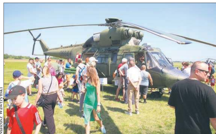
Podczas imprezy dużym zainteresowaniem cieszyła się prezentacja śmigłowców wojskowych