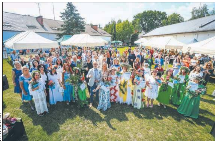
Laureatki konkursu na „Piękną Świteziankę”