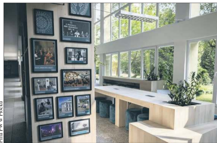
Filia PW w Płocku

Nowa strefa relaksu i nauki to miejsce otwarte i przyjazne, stworzone z myślą o potrzebach studentów. Znajdują się w niej nie tylko miejsca siedzące, drukarka, ale także zieleni i elementy roślinne tworzące przyjazną atmosferę, szafka na książki, które są uzupełnia-