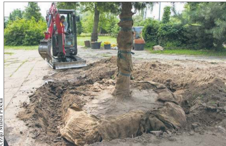
Zanim rozpocznie się rozbudowa i termomodernizacja budynku ZST przy al. Kilińskiego, niezbędne jest przesadzenie drzew

Przypomnijmy, że szkoła kształci między innymi w Branżowych Szkołach I i II stopnia, gdzie młodzież uczy się na: monterów maszyn, mechaników samochodowych, operatorów obrabiarek, ślusarzy czy