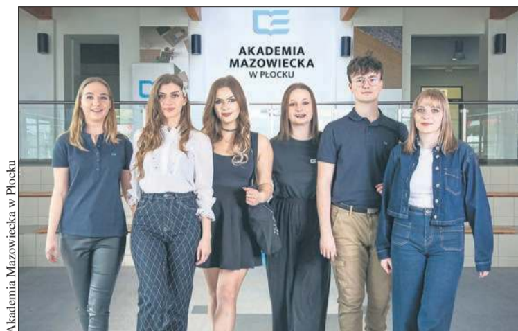
Akademia Mazowiecka w Płocku rozpocznie tegoroczną rekrutację 23 czerwca. W swojej ofercie ma 21 kierunków kształcenia

Na uczelni prowadzone są studia dwustopniowe – inżynierskie, licencjackie i magisterskie oraz studia po-