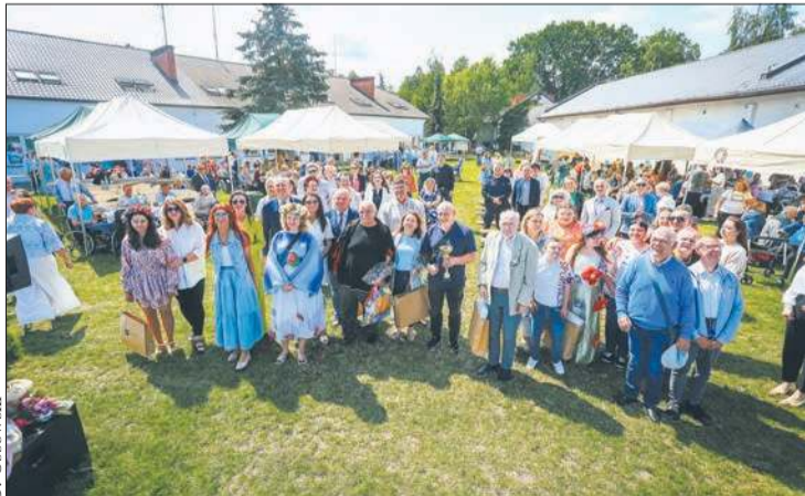
Podczas uroczystości nagrodzono osoby, które przygotowały najpiękniejsze wianki