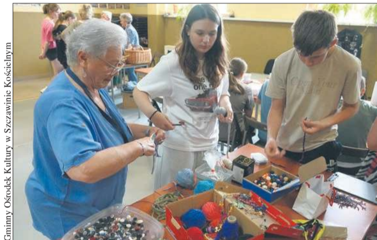
Dzięki warsztatom Fundacji Mody Cyrkularnej młodzież i seniorzy mogli stworzyć unikalne rzeczy ze zużytych materiałów

Bezpieczne wakacje z Młodzieżowymi Drużynami Pożarniczymi