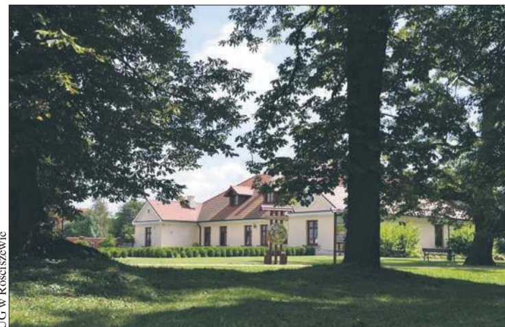
UG w Rościszewie