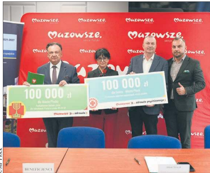
Samorząd Płocka otrzymał z budżetu samorządu województwa mazowieckiego dofinansowanie na realizację dwóch programów zdrowotnych: profilaktycznego badania piersi dla mieszkank Płocka oraz działań profilaktycznych zaburzeń psychicznych wśród uczniów szkół ponadpodstawowych w Płocku

W trakcie zajęć zostaną omówione w szczególności zagadnienia takie jak: czynniki wpływające na zdrowie psychiczne, profilaktyka depresji, zaburzeń nastrojów i zaburzeń lękowych, zapoznanie z pojęciami „hejtowanie” oraz „mowa nienawiści”, problem obrażania w sieci, świadomość roli słów w relacjach