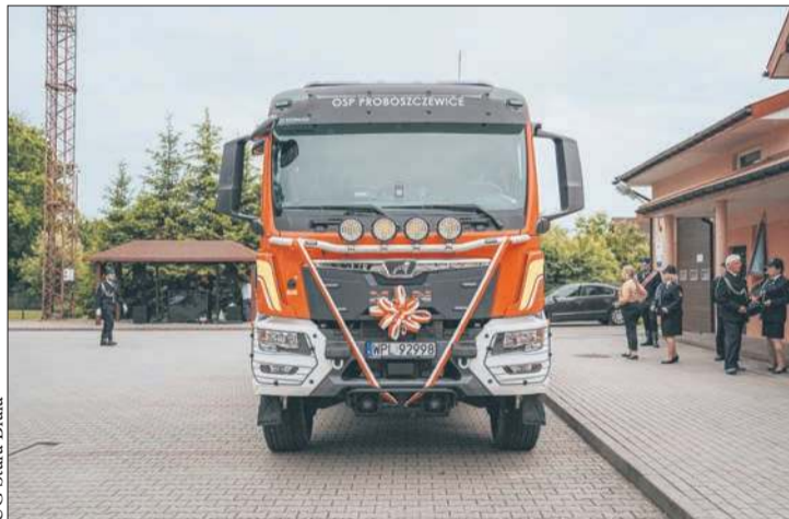
Nowy samochód OSP Proboszczewice to MAN TGM-320

Auto poświęcili ks. Kazimierz Dziadak – proboszcz parafii św. Flo-