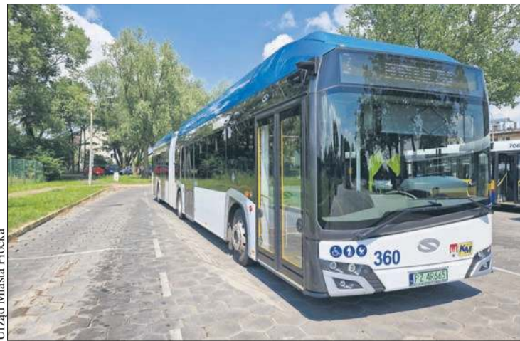
Urząd Miasta Płocka

Płocki samorząd chce kupić cztery autobusy klasy maxi, czyli 12-metrowe i pięć pojazdów dłuższych,