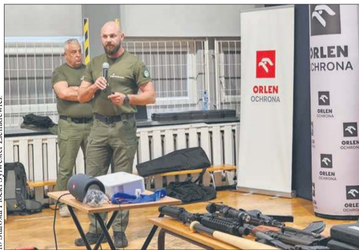
Szkolenie w zakresie bezpieczeństwa poprowadzili byli żołnierze

Wydarzenie rozpoczęło cykl zaplanowanych działań edukacyjno-szkoleniowych z zakresu bezpieczeństwa i ochrony ludności,