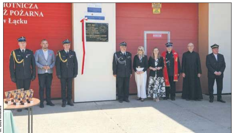
Na budynku strażnicy odsłonięto pamiątkową tablicę