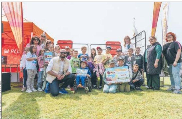
Wręczenie nagród na zakończenie akcji „Rowerowy maj”

Nie zabraknie nagród. Dla 3 kobiet i 3 mężczyzn, którzy przejadą najwięcej kilometrów w ramach akcji,