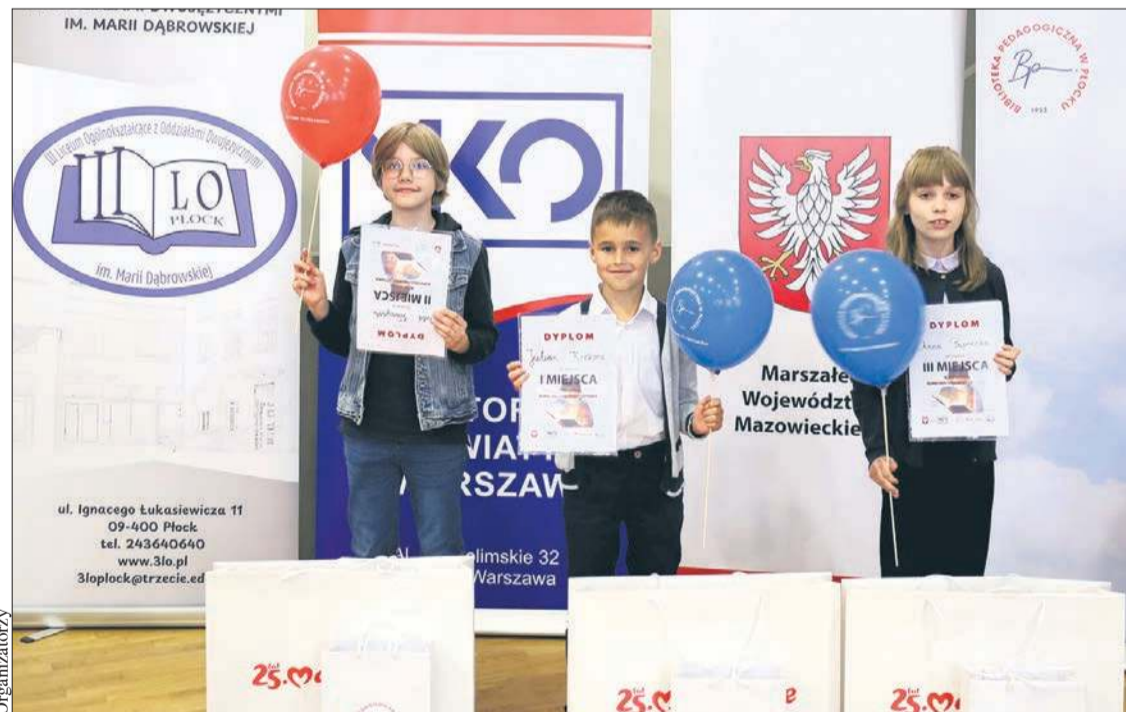
Zwycięcy konkursu w kategorii szkół podstawowych