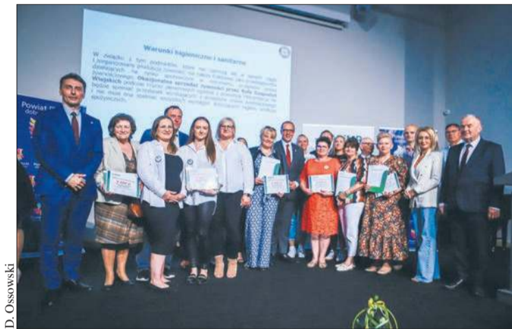
KGW z powiatu płockiego otrzymały symboliczne czeki od ARiMR

Podczas uroczystości podkreślano rolę współpracy na rzecz rozwoju lokalnej społeczności oraz podziękowano kołom za ich nieoceniony wkład w rozwój kultury, tradycji i integracji mieszkańców. – Dzisiejsze spotkanie to okazja, aby podziękować wam za to, co robicie. To wy jesteście solą tej ziemi, to wy tworzyacie społeczną siłę naszego powiatu i ziemi płockiej. I za to wam z całego serca dziękujemy. Powiat płocki zawsze słynął z Ochotniczych Straży Pożarnych. Dzisiaj można śmiało powiedzieć, że słynie też z Kół Gospodyń Wiejskich, bo jest was już więcej niż OSP. Wspólnie jesteście symbolem społecznej siły naszego powiatu. To wy budujecie silny i obywatelski powiat płocki. To jest ważne i piękne, bo dzięki wam