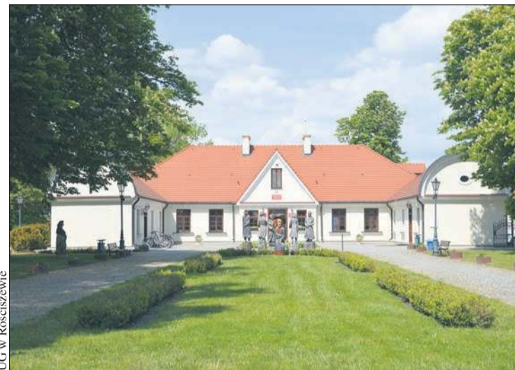
UG w Rościszewie

Dzięki pozyskanym środkom zewnętrznym – w tym z Samorządu Województwa Mazowieckiego – przeprowadzono kompleksowy remont. Osuszono fundamenty, odbudowano ściany, odnowiono dach, wykonano prace konstrukcyjne i stolarskie, przywrócono zabytkowy charakter wnętrza i elewacji. Uroczyste otwarcie odbyło się 10 listopada 2007 roku z udziałem mieszkańców, samorządowców, duchownych i potomka rodu Rościszewskich.