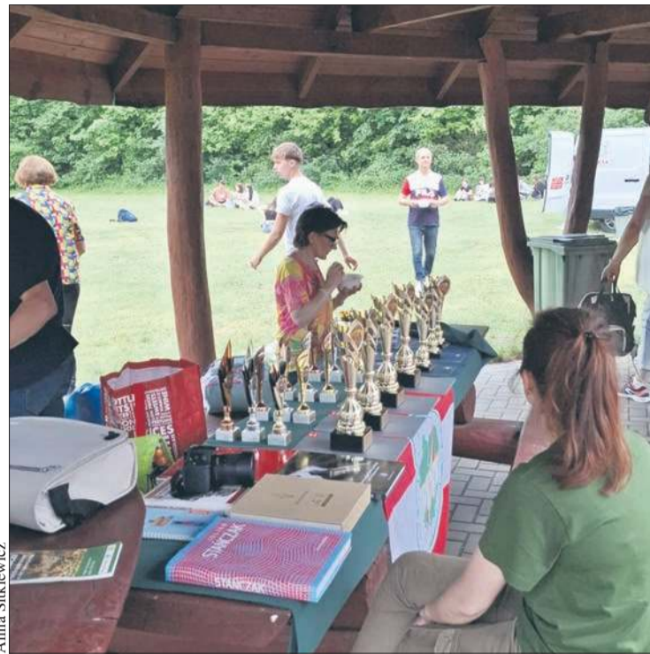
Nagrody i puchary ufundował ORLEN S.A.