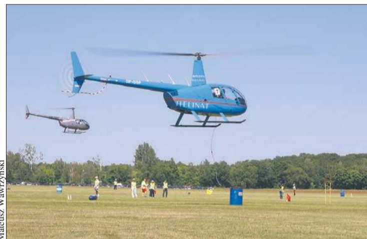
Zawody w slalomie wymagały od zawodników precyzji i opanowania