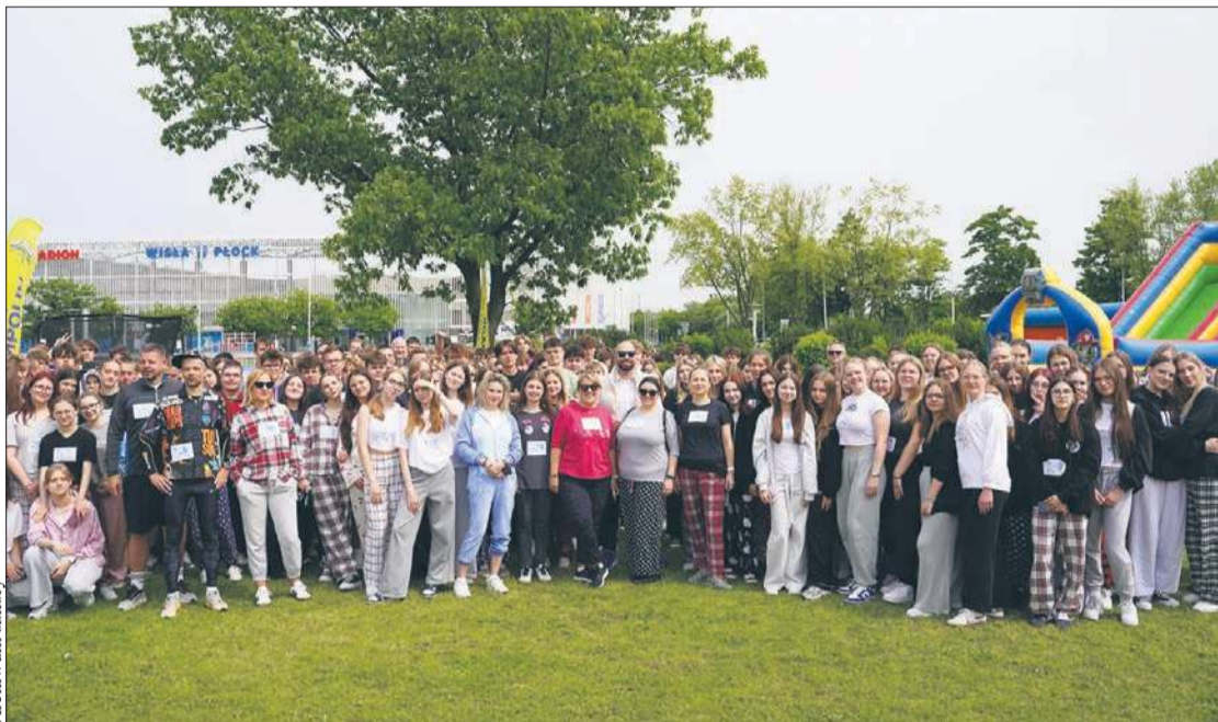
Uczniowie i nauczyciele III LO podczas wtorkowej akcji

Opowiada również, dlaczego akurat w ten sposób jak piżama strój ubrani byli uczestnicy wtorkowej akcji. - To standardowe ubranie chorych dzieci, a celem organizacji tego wydarzenia