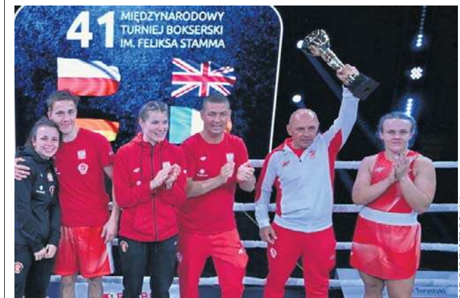
Reprezentacja Polski w boksie olimpijskim okazała się bezkonkurencyjną w 41. Memoriale Feliksa Stamma