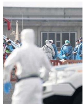
Pierwszego statku opuścili Hiszpanie

Na statku należącym do holenderskiej firmy Oceanwide Expeditions znajduje się około 150 osób z ponad 20 krajów. Proces zejścia na ląd będzie nadzorowany przez trzech hiszpańskich ministrów, w tym minister zdrowia Monikę Garcíę i ministra spraw wewnętrznych Fernando Grande-Marlasque, a także szefa Światowej Organizacji Zdrowia (WHO) Tedrosa Adhanoma Ghebreyesusa. W nocy z soboty na niedzielę Garcia ponownie zapewniła, że