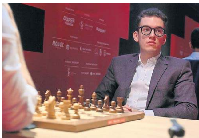
Jan-Krzysztof Duda gra w szachy od 5. roku życia. Tytuł arcymistrza otrzymał mając zaledwie 15 lat i 21 dni!

Po czterech dniach rywalizacji, Jan-Krzysztof Duda zajmował 6. miejsce. Jednak ostatniego dnia, arcymistrz z Wieliczki zanotował dwa remisy i aż cztery porażki.