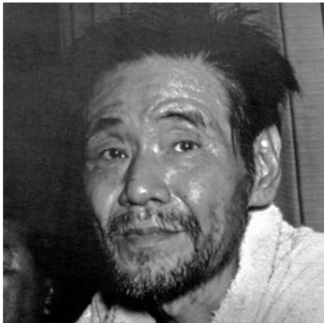
Dwa tygodnie po odnalezieniu Yokoi wrócił do Japonii, a jego powrót stał się medialną sensacją

Aż trudno uwierzyć, że Yokoi trwał na posterunku aż 28 lat. Żył w dżungli, korzystając z umiejętności wyniesionych z rodzinnego domu i wojskowego szkolenia. Swoją podziemną schron wzmocnił bambusem i wyposażał w przy-