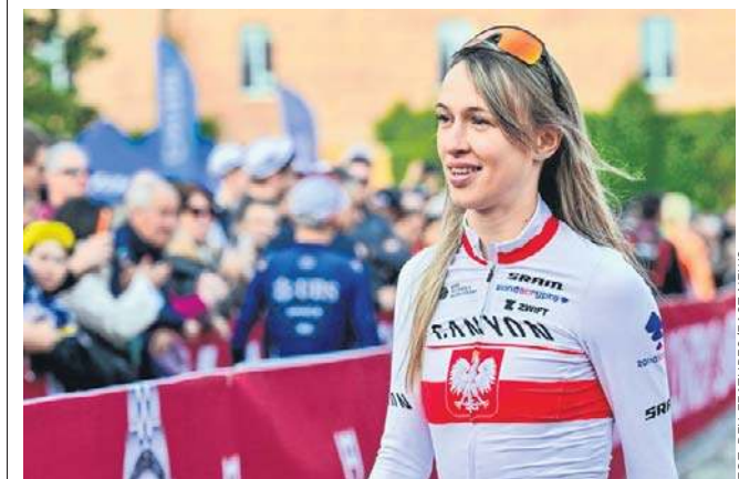
Pojawia się coraz więcej informacji o podpisaniu przez Katarzynę Niewiadomą kontraktu z nową grupą - Lidl-Trek