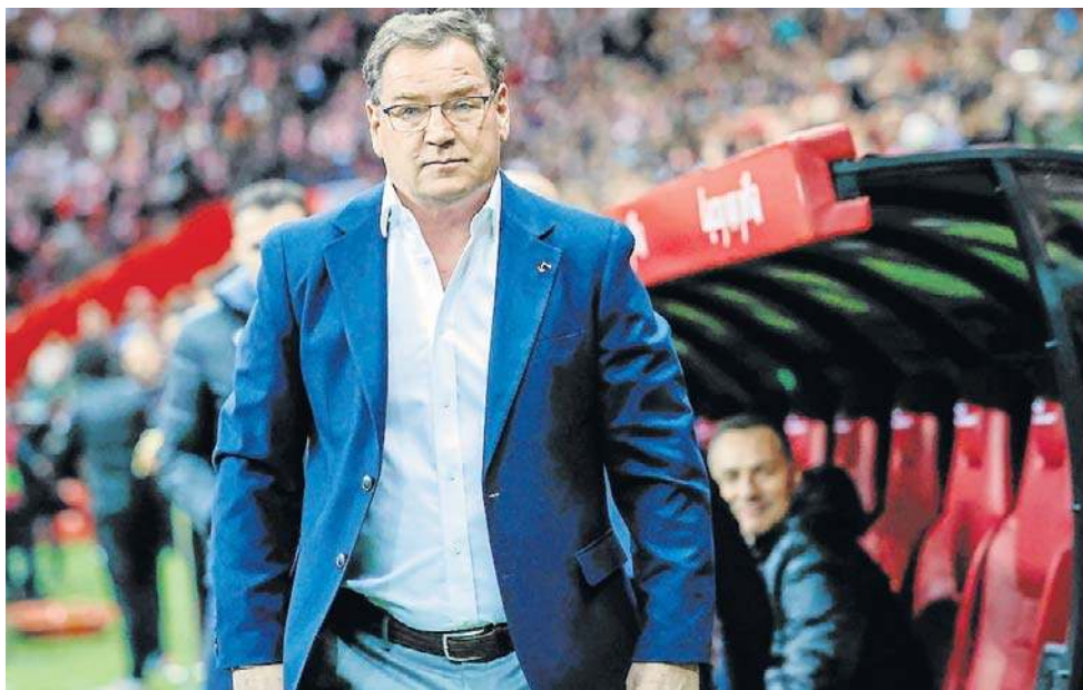
Najbliższe zgrupowanie kadry powinno być poligonem doświadczalnym dla Jana Urbana

Trzy dni po spotkaniu z Ukrainą Biało-Czerwoni za-