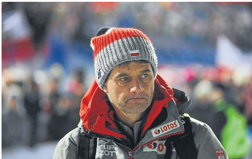
Stefan Horngacher zamierza ponownie wprowadzić polskich skoczków na szczyt

Taka decyzja zapadła po osobistej rozmowie w moim biurze związku z Adamem Małym