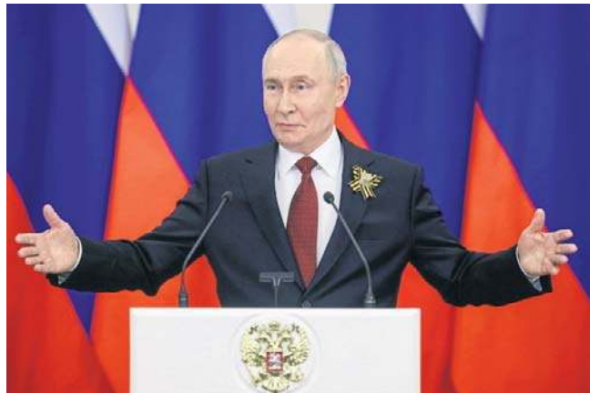
Putin powiedział, że jego zdaniem „specjalna operacja wojskowa”, czyli wojna w Ukrainie, ma się ku końcowi

Rosyjski dyktator został także zapytany o możliwość negocjacji z Europą. Tu wskazał na potencjalnego mediatora - miałby nim być były kanclerz Niemiec Gerhard Schröder.