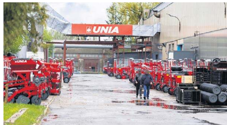
W zakładzie maszyn rolniczych Famarol w Słupsku, należącym do Grupy Unia, pracę może stracić 170 osób