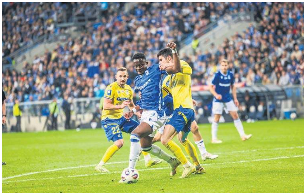
Przewodzący tabeli Lech niespodziewanie tylko zremisował z zagrożoną spadkiem Arką

Niebywały przebieg miał drugi piątkowy mecz. Przewodzący tabeli Lech Poznań dopingowany przez rekordową liczbę widzów (ponad 41 tysięcy) niespodziewanie tylko zremisował z zajmującą miejsce w strefie spadkowej Arką Gdynia. Trudno racjonalnie wytłumaczyć ten rezultat, skoro faworyt miał przytłaczającą przewagę, która przejawiała się przez 25 oddanych strzałów i aż 80