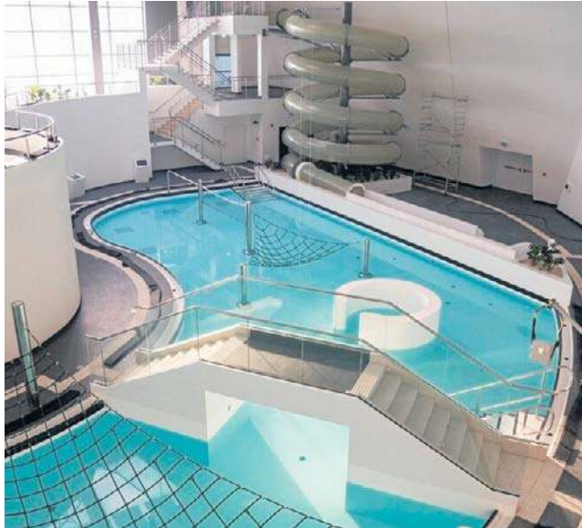
Jedną z inwestycji zbudowanej za kredyt jest aquapark. Dług, ponad 400 mln zł będziemy spłacać do 2041 r.

- To filharmonia, stadion, rewolucja torowa, fabryka wody, obiekty sportowe, termomodernizacja obiektów użyteczności publicznej, a nawet elewacja magistratu, której zielony kolor wywoływał tyle emocji. Jesteśmy o tyle w dobrej sytuacji, bo nie braliśmy kredytów na działalność bieżącą tylko na realizację programu inwestycyjnego. Gdybyśmy tego długu nie mieli, musieliśmy nasz program zrewidować. Nie byłoby nowego zadłużenia, ale ograniczylibyśmy inwestycje. Poza tym mamy tu wzorcowy układ. Jedną trzecią programu inwestycyjnego była