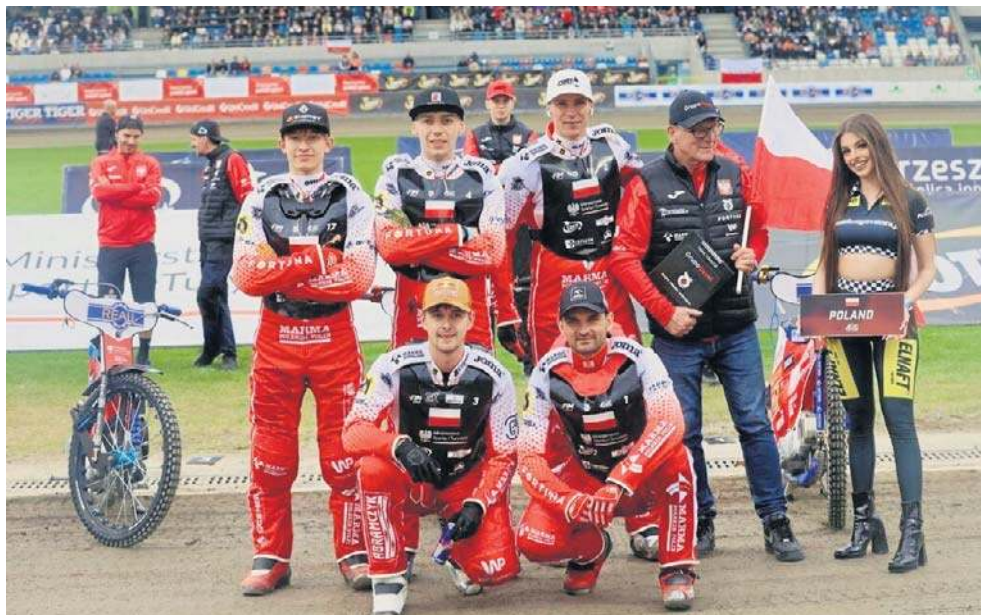
Żużlowa reprezentacja Polski zdobyła srebrny medal Drużynowych Mistrzostw Europy

Zgodnie z regulaminem każda z reprezentacji w rozgrywanym w stolicy województwa podkarpackiego finale mogła skorzystać z jednego zawodnika startującego w cyklu Speedway Grand Prix, musiała mieć także w składzie - na pozycji rezerwowego - żużlowca