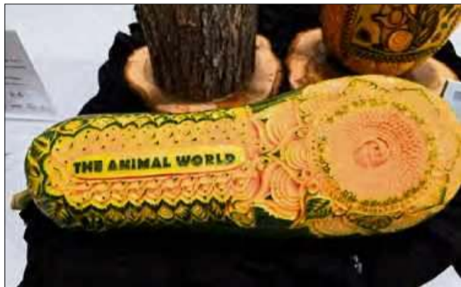
Dzieła młodego artysty są imponujące.

– Cieszę się, że mogę po raz kolejny pokazać moją pra-