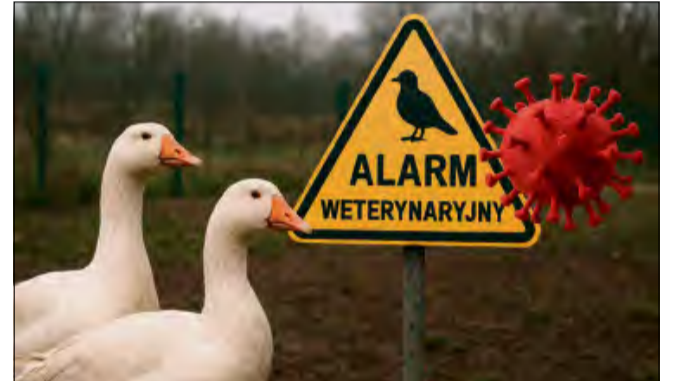
Hodowcy drobiu w regionie muszą stosować zaostrzone środki bezpieczeństwa po decyzji wojewody opolskiego.

Wszystkie te środki mają obowiązywać przez co najmniej dwadzieścia jeden dni, aż do momentu przeprowadzenia badań wykluczających obecność wirusa. Tereny objęte zakazami i nakazami będą oznakowane