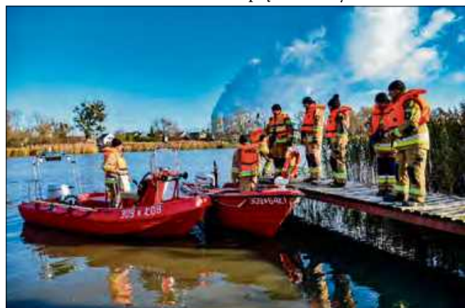
W tym roku ćwiczenia odbywały się na terenie sołectwa Żelazna.