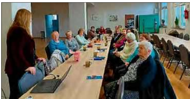
Seniorzy z uwagą wysłuchali wykładu.

Prelegentka opisała tzw. koktajl szczęścia. Są to innymi słowy neuroprzekazniki odpowiedzialne za dobre samopoczucie. Wymieniła dopaminę, związaną z nagrodą i motywacją, serotoninę, dającą poczucie