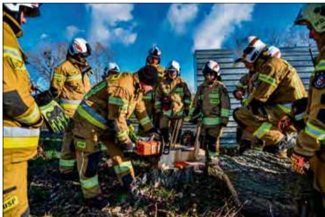
Podczas ćwiczeń ochotnicy sprawdzali swoje umiejętności, m.in. w posługiwaniu się pilarką.

Podczas tegorocznych zajęć strażacy doskonalili m.in. umiejętności udzielania pierwszej pomocy, w tym triage, czyli procedury medycznej polegającej na ustalaniu kolejności udzielania pomocy poszkodowanym w zależności od stopnia zagrożenia