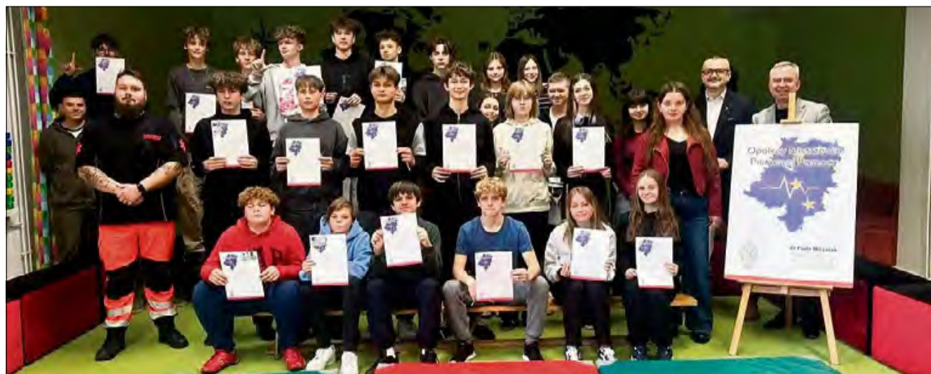
Uczniowie zdobywali bezcenne umiejętności ratowania życia podczas specjalnych zajęć.

Głównym celem inicjatywy jest poszerzenie wiedzy uczniów oraz praktyczne przygotowanie ich do właściwego reagowania w sytuacjach zagrożenia życia. Organizatorzy podkreślają, że to właśnie szybka, prawidłowa reakcja świadka zdarzenia często decyduje o szansach poszkodowanego na przeżycie.