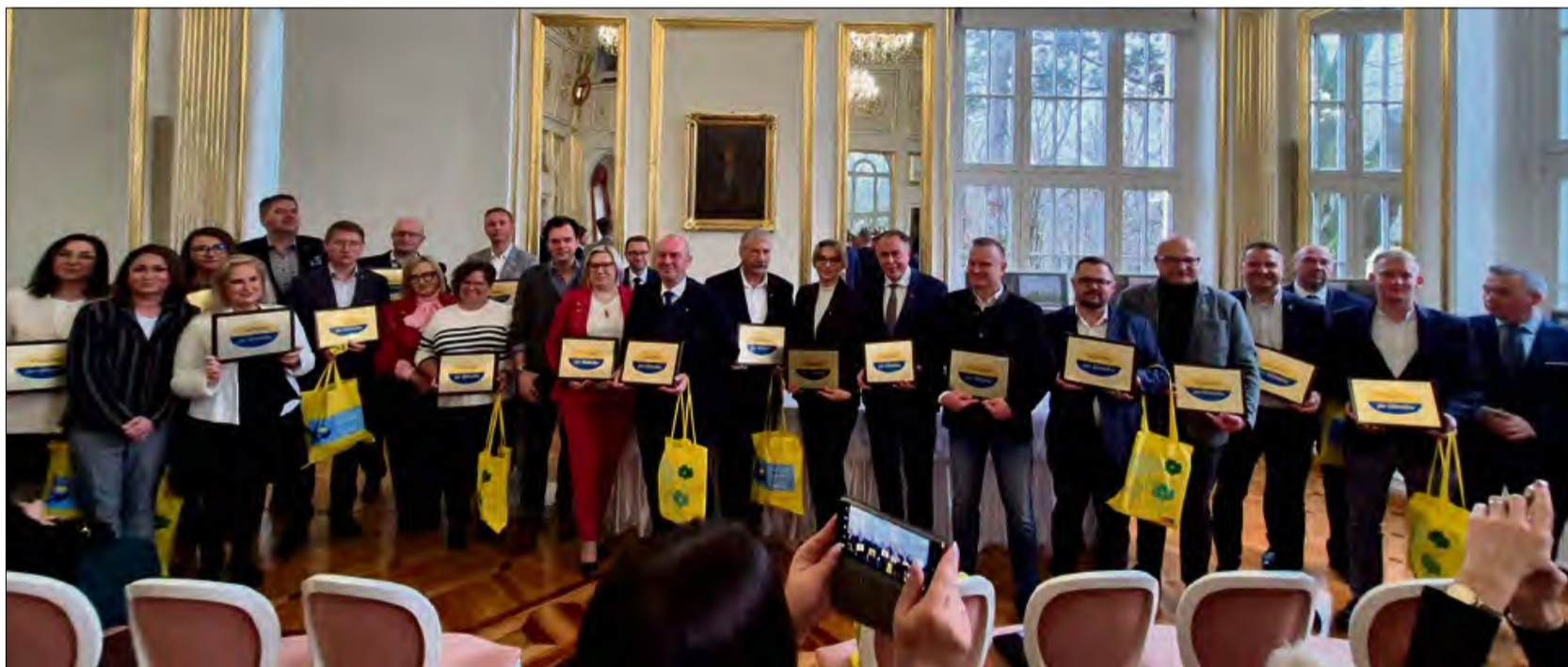
Włodarze, którzy przystąpili do programu Godomy po ślōnsku.

Jednym z pierwszych widocznych elementów projektu będzie pojawienie się w Urzędzie Gminy w Turawie specjalnej tabliczki z napisem „Gōdōmy po ślōnsku”. Będzie ona nie tylko dekoracją, ale przede wszystkim czytelnym sygnałem, że mieszkańcy posługujący się śląską godką mogą liczyć na pełne wsparcie i zrozumienie ze strony urzędników. Oznacza to, że sprawy urzędowe będzie można załatwiać również w języku śląskim, co stanowi ważne ułatwienie dla osób, które na co dzień posługują się właśnie tym etnolektem.