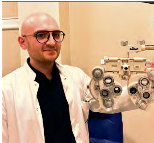
Rozmowa z ekspertem wyjaśnia, jak odróżnić kompetencje specjalistów oraz na co zwracać uwagę, aby cieszyć się dobrym wzrokiem jak najdłużej.

- Pogorszenie ostrości wzroku jest już czymś bardzo oczywistym. To rzeczywiście niepokoi i motywuje daną osobę, aby się zgłosiła do specjalisty. Jednak czymś, co zazwyczaj nie jest powiązane ze wzrokiem są bóle głowy. Często występujące, a zwłaszcza nasilające się po pracy z komputerem, po czytaniu, czy po nauce – jak w przypadku dzieci i młodzieży – jest czymś, co powinno nas zaniepokoić. Dodam, także że problemy z nauką wśród dzieci i młodzieży też nierzadko mogą być związane ze wzrokiem. Innym niepokojącym sygnałem może być ból oka, suchość lub pieczenie. Są to objawy dodatkowe. Co ciekawe czymś, co rzadko wiążemy ze wzrokiem są wady postawy. O tym mówi