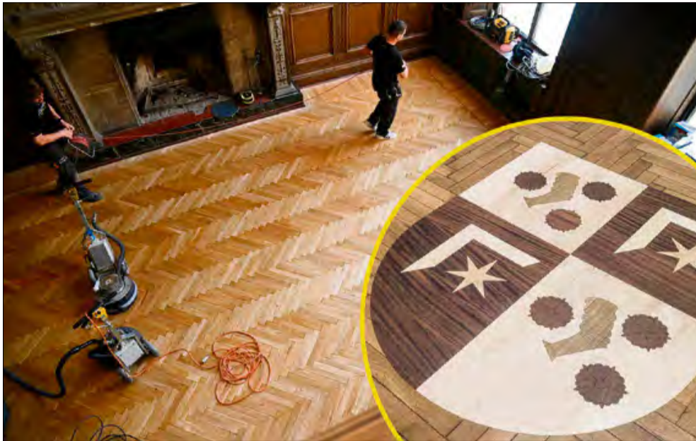
Nowością jest zamontowany uproszczony herb Tiele-Wincklerów, wykonany techniką intarsji.

Kolejne roboty wykonano w kawiarni, czyli w dawnej poczekalni hrabiego. Prace dotyczyły istniejącej posadzki ułożonej w jodełkę, pochodzącej z okresu powojennego. Wykonano cyklowanie zgrubne parkietu, polerowanie oraz lakierowanie. Ponadto przeprowadzono renowację oryginalnego fragmentu parkietu pod antresolą, pochodzącego z około 1900 roku.