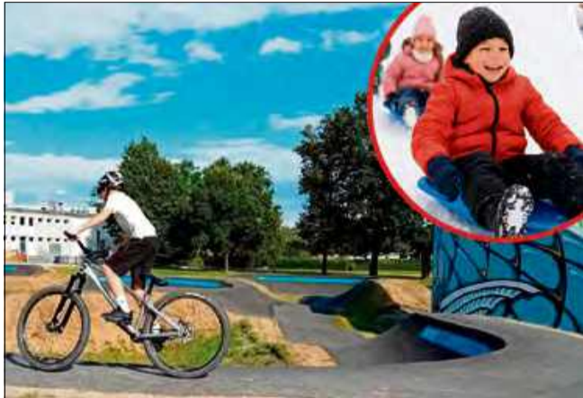
Pumptrack nie został stworzony pod sanki, ale pod rowery – OSiR apeluje o rozsądek.

- Dla bezpieczeństwa wszystkich oraz w trosce o za-