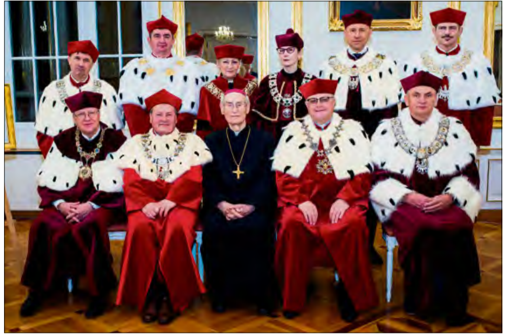
Abp Nossol uhonorowany za działalność na rzecz integracji uczelni Wrocławia i Opola.

P odczas obchodów Święta Nauki 2025, które odbyły się w Auli Leopoldina we Wrocławiu, Kolegium Rektorów Uczelni Wrocławia i Opola przyznało abp. prof. Alfonsowi Nossolowi Nagrodę im. prof. Józefa Dudka za wieloletnią działalność na rzecz integracji środowiska akademickiego.