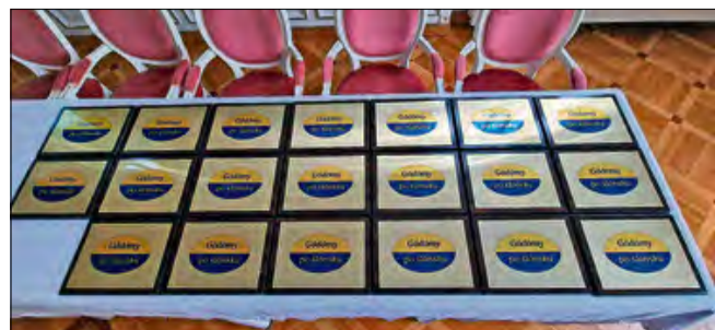
Tabliczki które trafiły do urzędów w całym regionie.