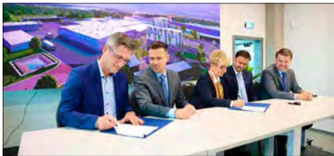
Opole rozpoczyna realizację nowoczesnej instalacji, która jest niezbędnym elementem uzupełniającym system gospodarki odpadami w regionie.

ITPO to nie tylko nowoczesne zarządzanie odpadami, ale przede wszystkim nowe źródło energii dla Opolu. Instalacja o maksymalnej rocznej przepustowości 20 000 Mg/rok będzie produkować ciepło i energię elektryczną w wysokosprawnej kogeneracji. Wyprodukowane ciepło trafi do miejskiej sieci ciepłowniczej ECO S.A., pokrywając podstawy systemu ciepłowniczego i ok. 10% całkowitej produkcji ciepła dla Opolu. Dzięki ITPO,