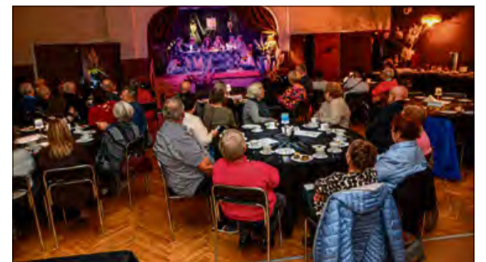
Mieszkańcy tłumnie przybyli na wieczorek kawiarniany.