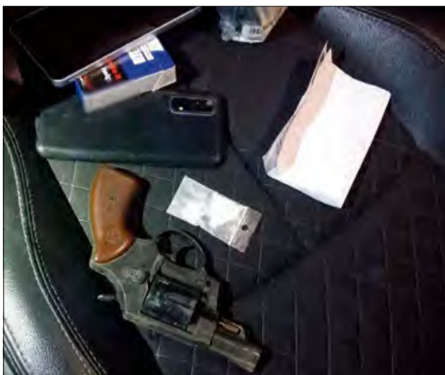
Za posiadanie środków odurzających i psychotropowych podejrzanym grozi kara do 3 lat pozbawienia wolności.

Operacje „Poszukiwany” i „Towar” trwały dwa dni. - Działania te ukierunkowane były na zatrzymanie osób, które w swojej przeszłości wielokrotnie wchodziły w konflikt z prawem i skazane prawomocnymi wyrokami powinny odbywać kary pozbawienia wolności. Jednak z różnych powodów nie zgłosiły się do zakładów karnych i ukrywają się. Gdy do jednostki policji wpłynę list gończy, policjanci poszukiwacze rozpoczynają czynności zmierzające do ustalenia miejsca pobytu i zatrzymania poszukiwanego. Czasami poszukiwani trwają wiele lat, gdyż poszukiwany stara się ukryć miejsce pobytu, w czym często pomagają mu najbliżsi i znajomi. Wielokrotnie opuszczają kraj na wiele lat. - informuje asp. Przemysław Kędzior z KMP w Opolu. Podczas dwudniowych działań, koordynowanych przez Biuro Kryminalne Komendy Głównej Policji, policjanci z Opola zatrzymali 10 osób poszukiwa-