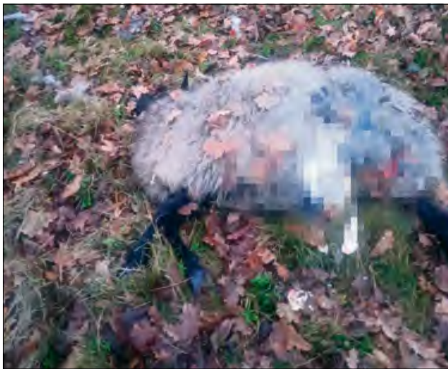
Największe obawy mieszkańców wzbudza fakt, że drapieżniki podeszły tak blisko ludzkich siedzib.