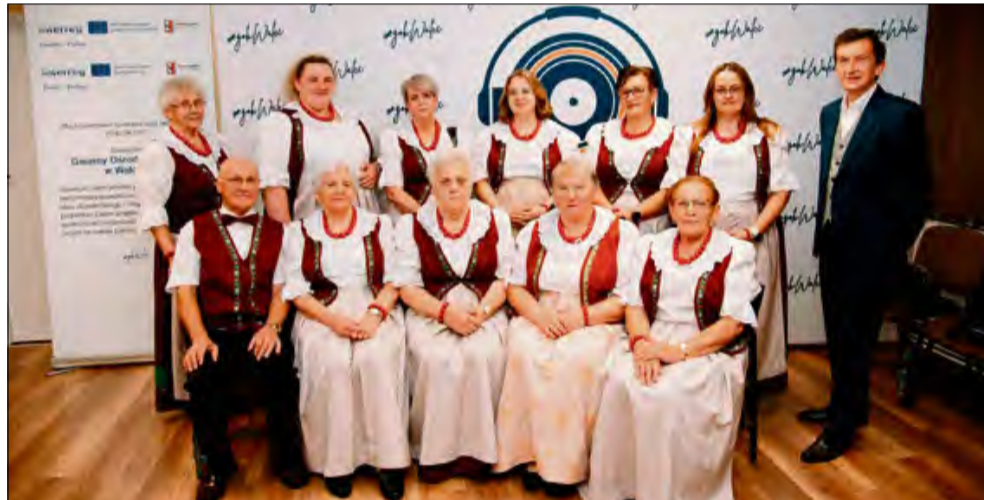
Brawa dla zespołu z Dańca.

W miniony weekend w Walcach w powiecie krapkowskim odbył się 33. Festiwal Chórów i Zespołów Śpiewaczych Mniejszości Niemieckiej. Udział w wydarzeniu wzięli także twórcy z