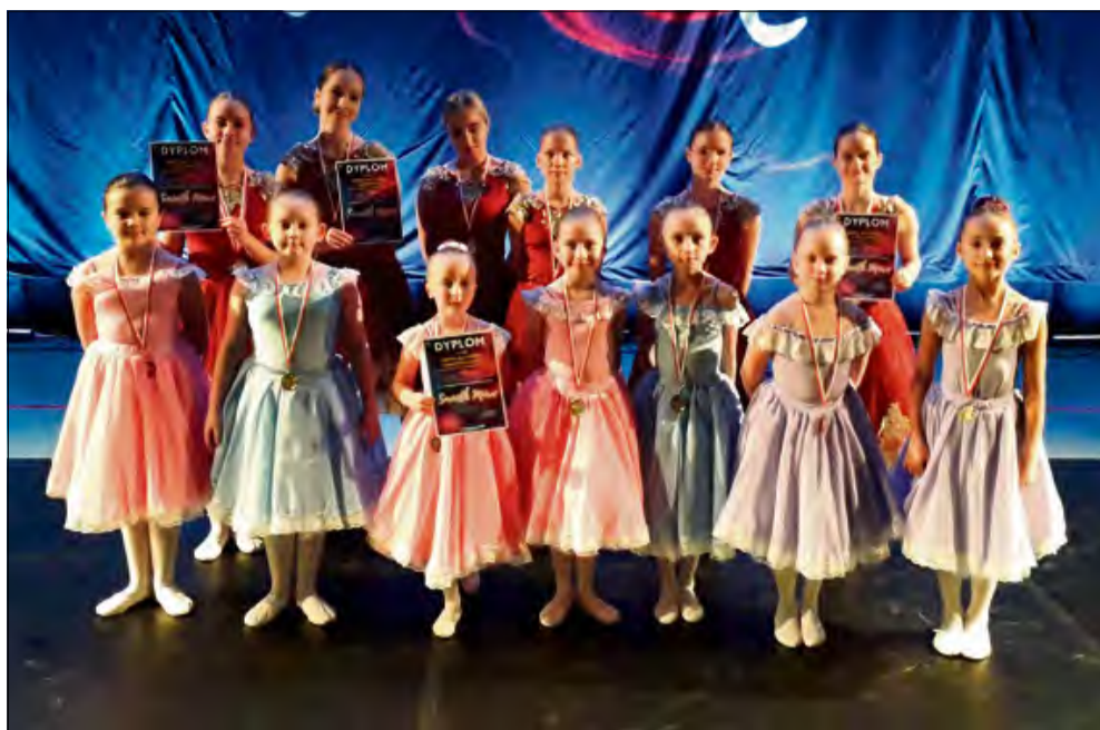
Młodzi artyści z Dobrzeńna Wielkiego znakomicie zaprezentowali swoje umiejętności w Wołczynie.