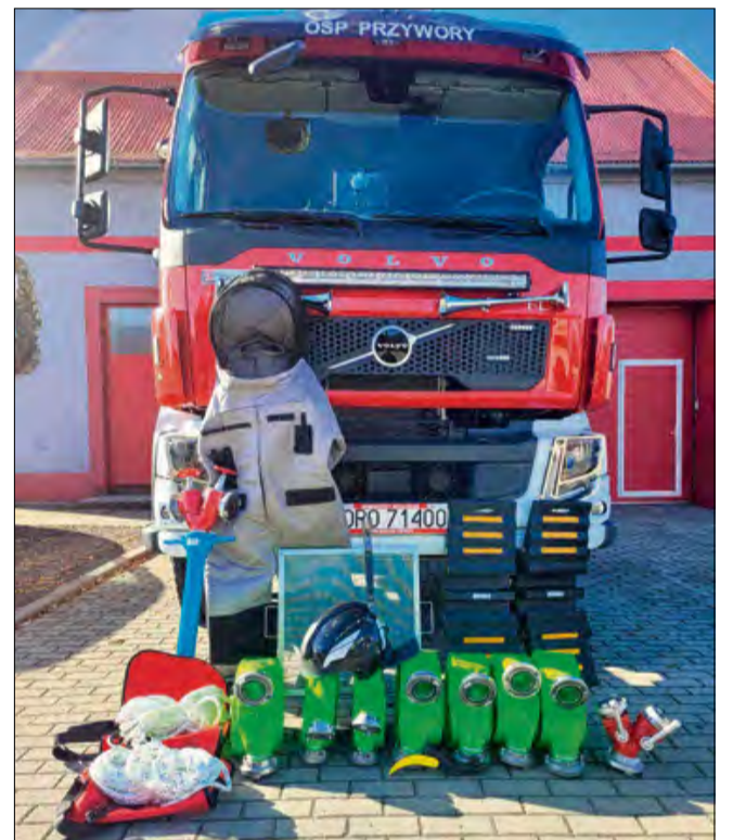
Strażacy z OSP Przywory wzmacniają swój potencjał.

Działania Ochotniczej Straży Pożarnej w Przyworach zyskały nowy, wysokiej jakości sprzęt. Inwestycja została zrealizowana dzięki pozyskaniu dofinansowania w kwocie 7 000 zł z Funduszu Składkowego Ubezpieczenia Społecznego Rolników, przy wsparciu środków własnych jednostki. Łączna wartość zakupionego wyposażenia ratowniczo-gaśniczego wyniosła 7 454 zł. Nowy sprzęt to mieszanka specjalistycznych narzędzi i elementów wyposażenia osobistego, które bezpośrednio przełożą się na skuteczność i bezpieczeństwo pracy strażaków podczas różnorodnych interwencji. Na liście zakupów znalazł się między innymi rozdzielacz kulowy, który pozwala na precyzyjne sterowanie dostawami wody do kilku linii gaśniczych jednocześnie. Sieć wodną uzupełniło pięć sztuk węża tłoczego W75 oraz dwie sztuki węża W52, co zwiększa możliwości operacyjne pod-