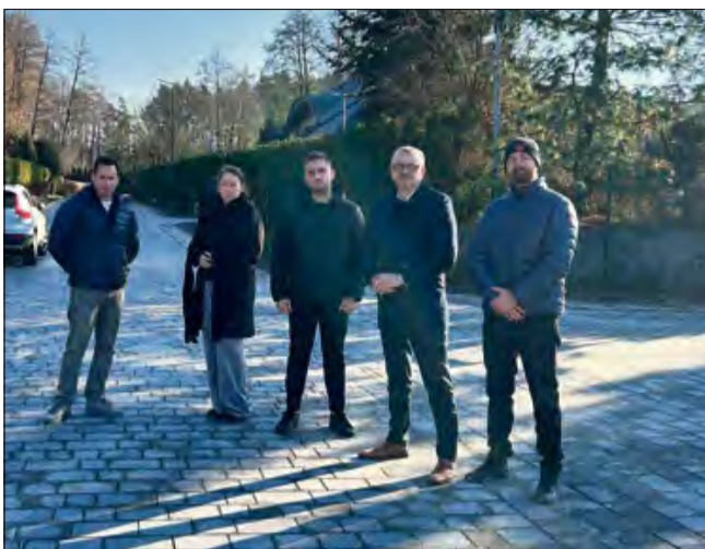
Samorządowcy duży nacisk kładą na rozwój infrastruktury drogowej.

Samorząd duży nacisk kładzie na rozwój infrastruktury drogowej. Niedawno zakończyła się przebudowa