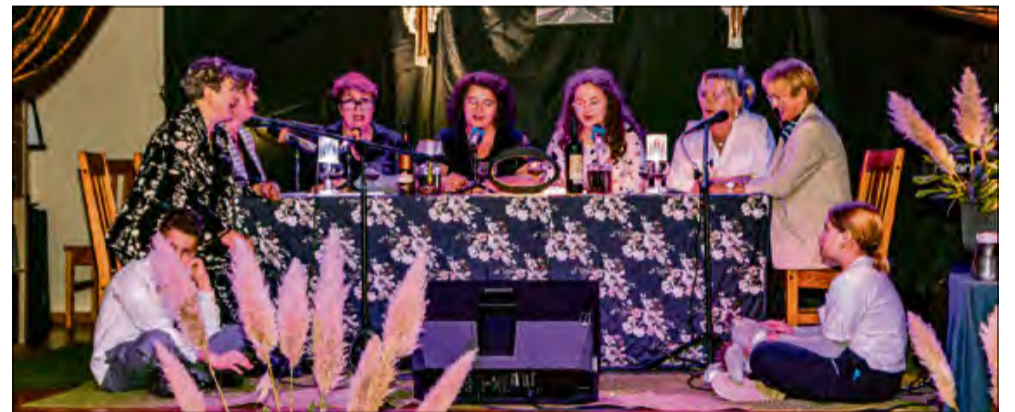
Grupa „Mirabilis” przygotowała montaż teatralno-piosenkowski.

K oło Gospodyń Wiejskich z Ciepeliowic zorganizowało w świetlicy wiejskiej „Wieczorek kawiarniany”. Wydarzenie połączone z występem grupy „Mirabilis”. Nie zabrakło poczęstunku oraz wspólnego śpiewania.