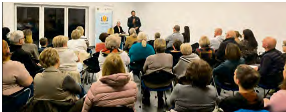
Publiczność aktywnie uczestniczyła w rozmowie.