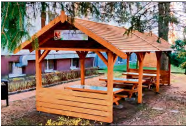
Przy Szkole Podstawowej nr 1 w Ozimku postawiono wiatę edukacyjną z ławostołami.

Zakończono realizację zadań w ramach Budżetu Obywatelskiego Miasta Ozimka. Przy Szkole Podstawowej nr 1 w Ozimku wykonano i zamontowano wiatę edukacyjną z ławostołami, ptasznikiem oraz stacją meteo. Na zielonym terenie pojawiły się