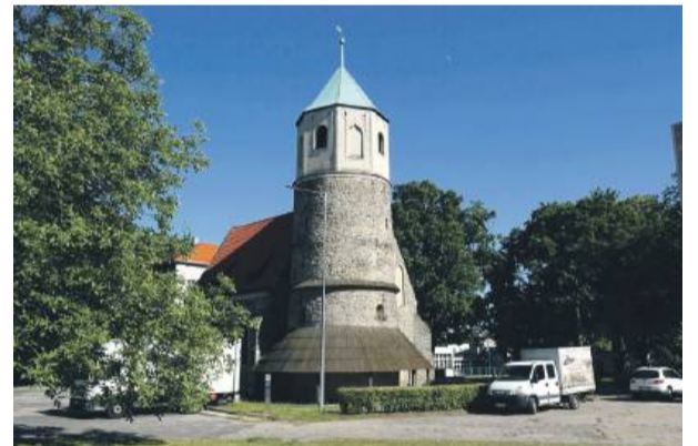
Teren wokół Rotundy św. Gotarda zostanie zagospodarowany.