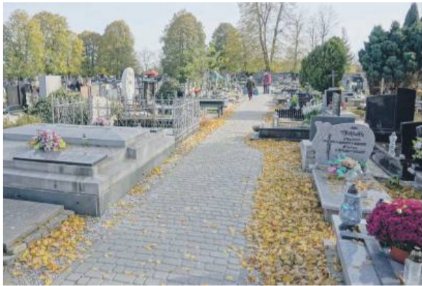
Klub Koalicji Obywatelskiej wystosował wniosek o dostosowanie treści uchwały w sprawie opłat obowiązujących na terenie cmentarzy do obowiązujących przepisów.

które opłaty pobierane przez dwa samorządy: w Olsztynie i w Radomiu – kontynuuje szefowa gminy. – Wyroki, w chwili, kiedy odpowiadam Pani na to pytanie,