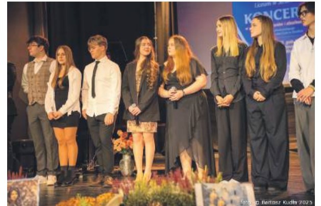
Część artystów, występujących podczas koncertu. Wśród nich uczniowie i absolwenci.

Zwieńczeniem jubileuszowych uroczystości będzie spektakl teatralny „Madame Curie i tajemnica szkolnej piwnicy”. Zostanie odegrany