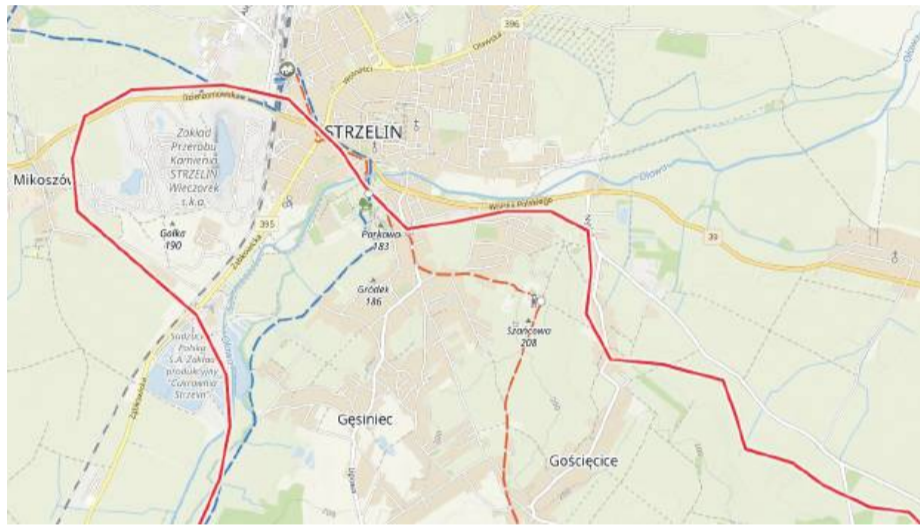
Poglądowa mapa pochodzi z portalu mapa-turystyczna.pl

większe jest fałdowanie terenu, a występujące tu liczne wzgórza pokryte są lasami.