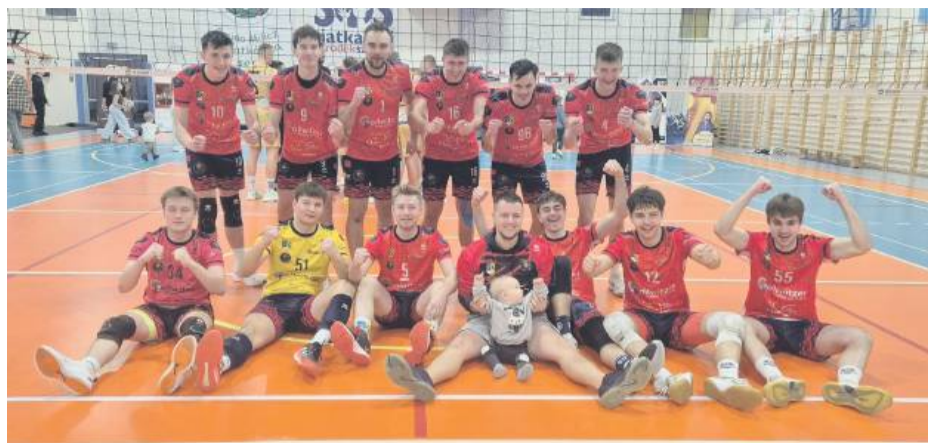
Radość siatkarki po zwycięstwie w Miliczu