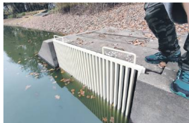
Wstawiona krata zapobiega ucieczce ryb do rowu poniżej i dalej do rzeki

Także z pytaniem o zakres prac zwróciliśmy się do strzelińskiego magistratu. – Na dolnym stawie w Białym Kościele prowadzone są drobne prace pielęgnacyjne, głównie oczyszczanie i zabezpieczanie wałów – informuje szefowa gminy. – Przegląd techniczny wykazał, że stan grobli i infrastruktury hydrotech-