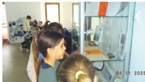
Dzieci z dużą ciekawością oglądały stare zeszyty i podziwiali piękne pismo

Wiele ekspozycji wzbudzało ogromne emocje. Najmłodszym bardzo podobały się rysunki konkursowe starszych kolegów (pokłosie konkursu „Szkolna historia nasza i naszych dziadków”), nieco starsi z uwagą przyglądali się starym podręcznikom, zeszytom („popatrz, pisali atramentem, i jak ładnie pisali”) oraz zdję-