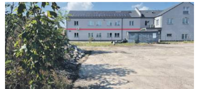
Budowa magazynu planowana jest na działce przy ul. Glinianej w Strzelinie.