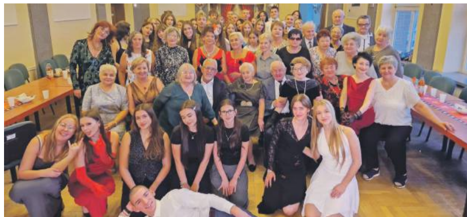
W wydarzeniu wzięli udział uczniowie technikum w Ludowie Polskim, Liceum Ogólnokształcącego w Strzelinie i Wrocławiu oraz Szkoły Podstawowej nr 3 w Strzelinie, a także lokalni seniorzy.