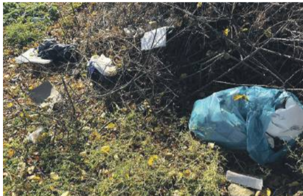
Takie worki ze styropianem ktoś wyrzucił na ścieżce prowadzącej do kładki kolejowej Strzelin - Szczawin