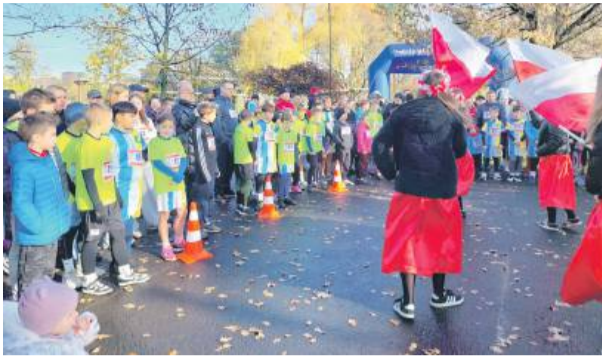
Wystartowało ponad 300 osób

We wtorek, 11 listopada, w strzelińskim parku miejskim odbył się Bieg Niepodległości zorganizowany przez Strzelińskie Centrum Sportowo-Edukacyjne. W wydarzeniu wzięło udział ponad 300 uczestników – dzieci, młodzież, dorośli i całe rodziny, którzy wspólnie uczcili 107. rocznicę odzyskania przez Polskę niepodległości. Wydarzenie otworzyła burmistrz