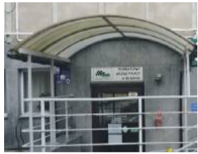
W środę, 12 listopada, w budynku PUP w Strzelinie ruszył remont sali obsługi interesantów

Powiatowy Urząd Pracy w Strzelinie informuje, że od 12 listopada w budynku ruszył remont sali obsługi interesan-