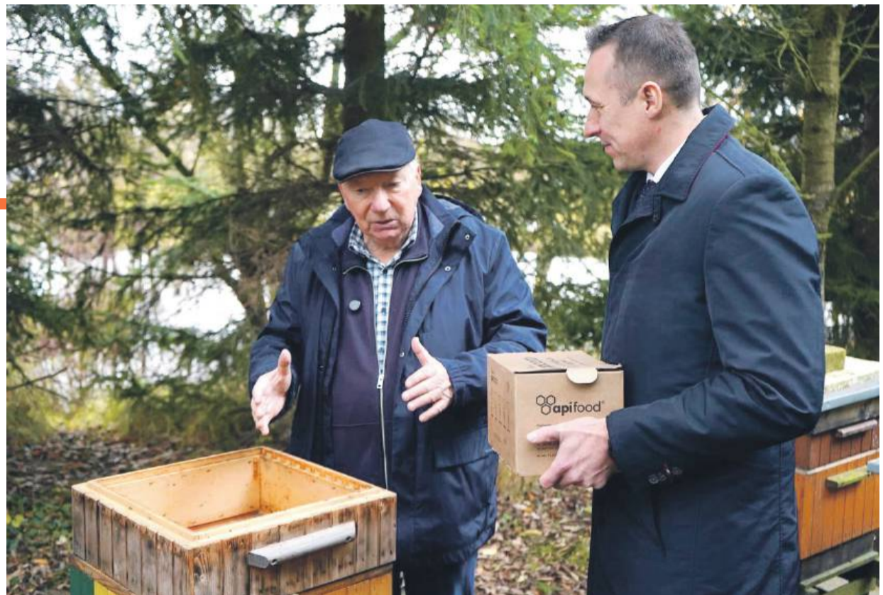
Paweł Gancarz, marszałek województwa przekazuje ciasto pszczele dla pasieki w Ptaszkowie

- W ciągu roku rodzina pszczoła potrzebuje około 80 kg miodu na własne potrzeby - wszystko ponad to jest miodem dla pszczelarza. W okresach niedoboru można