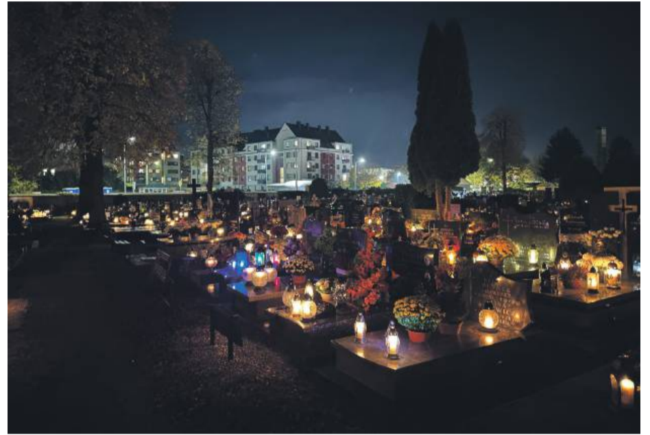
Tak jeszcze kilka dni temu wyglądał cmentarz przy ul. Oławskiej w Strzelinie. To dla nas miejsce pamięci i zadumy, ale i ważna lekcja życia...

Kiedy tak patrzy się na te różne, dziejące się szybko