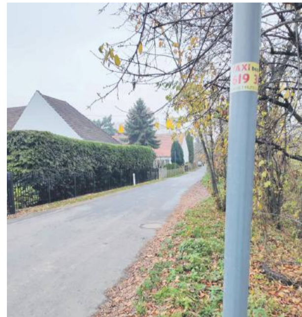
Znaki ostrzegające o progach zwalniających zostały zdjęte. Pozostały same słupki, co ułatwi powrót oznakowania, jeżeli progi zostaną wybudowane

była natychmiastowa i (tak jak sugerowaliśmy) znaki zostały odkręcone, a słupki pozostawione, co umożliwi ich ponowne przymocowanie.