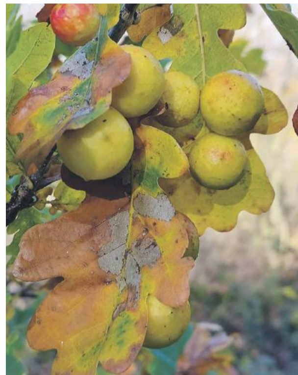
To galasy dębowe, zwane też jabłuszkami dębowymi, znalezione na dębnie nieopodal kamieniołomu Gliczyny w Gęsińcu