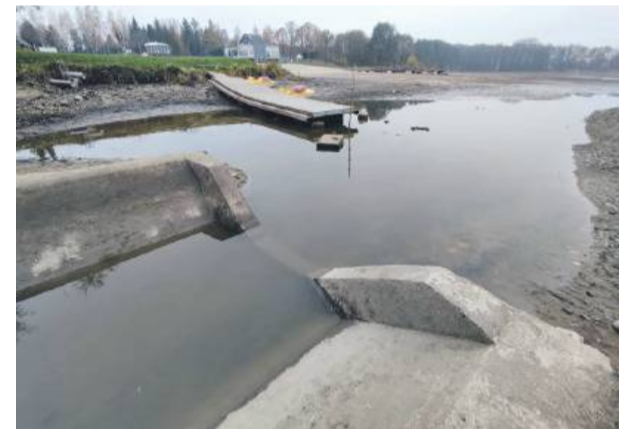
Na dolnym stawie w Białym Kościele mają być przeprowadzone prace naprawcze

gotowość do odbycia szkolenia zapewnionego przez pracodawcę);