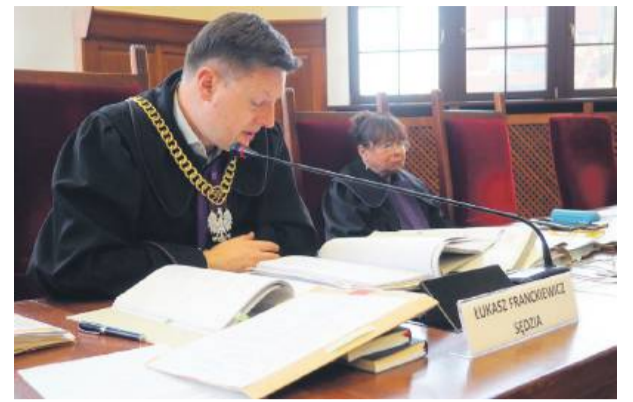
Sprawa toczy się przed wrocławskim sądem na wniosek strzelińskiej prokuratury