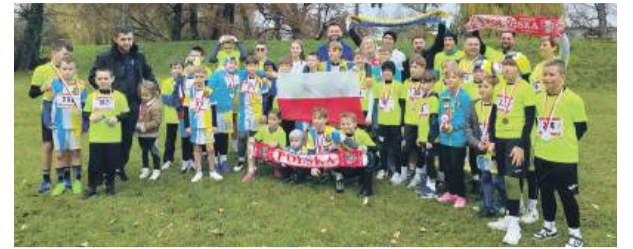
W klasyfikacji drużynowej puchar za najwyższą frekwencję zdobyła drużyna Strzelinianki

rodowego jubileuszu. Przed startem wystąpiły uczennice ze Szkoły Podstawowej nr 3 w Strzelinie, prezentując układ taneczny z patriotycznymi elementami, który został nagrodzony gromkimi brawami. Uczestnicy pokonali symboliczny dystans 1918 metrów, który nawiązywał do daty odzyskania niepodległości. Na mecie na wszystkich czekały okolicznościowe medale oraz gorąca grochówka, która rozgrzewała po wysiłku i chłodnym, listopadowym biegu. W klasyfikacji druży-