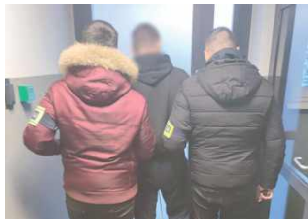
Złodzieje, którzy okradli sklep w Staninie, już siedzą w areszcie

19 lutego na terenie Puław i Radomia policjanci zatrzymali trzech mężczyzn podejrzanych o dokonywanie seryjnych kradzieży w okresie od grudnia 2024 r. do 8 lutego br. z zapleczy stacji paliw, a także sklepów spożywczych na terenie wojewódz-