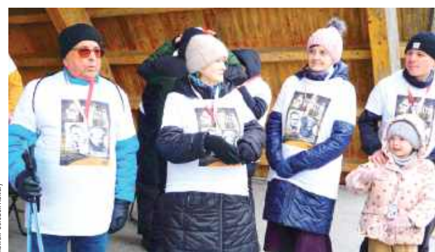
Wszyscy uczestnicy wilczego biegu otrzymali pamiątkowe medale, patriotyczne koszulki, materiały historyczne oraz ciepły posiłek

czyków Rzeczypospolitej Polskiej Oddział w Kałuszynie. Organizatorami Biegu Pamięci Żołnierzy Wyklętych w Łuko-