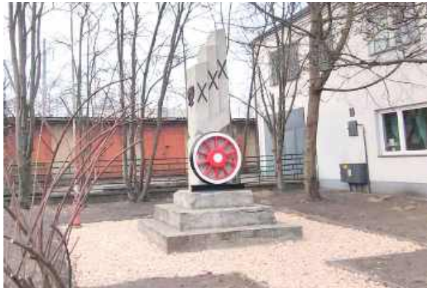
Pomnik upamiętniający „czyn zbrojny kolejarzy” przy Poczcie obok Dworca PKP został wyczyszczony, a plac obok uporządkowany