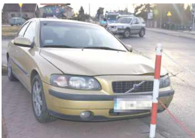
Badanie alkomatem wykazało, że miał niemal 2,5 promila alkoholu w organizmie

- Kierujący samochodem osobowym marki Volvo S60, wykonując manewr skrętu, na skrzyżowaniu doprowa-