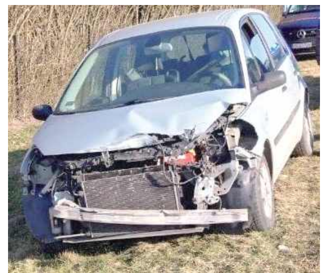
Volkswagen uszkodzony podczas zderzenia z pociągiem

- Ubolewamy tylko, że w takich sytuacjach nie zawsze sprawiedliwości staje się zadość. Mówiąc wprost, aktualne składki OC nie odzwierciedlają rzeczywistych