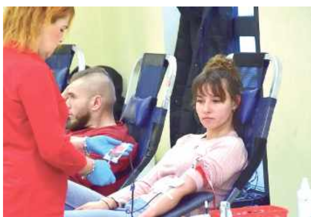
Organizatorzy akcji z HDK Ostoja wyrażają ogromne podziękowania dla wszystkich krwiodawców, którzy wzięli udział w akcji

Wielu uczestników biegu zdecydowało się nie tylko na sportowe wyzwanie, ale także na szlachetny gest, jakim jest oddanie krwi. Organizatorzy wyrażają ogromne uznanie dla wszystkich krwiodawców, którzy wzięli udział w akcji. Członkowie Klubu HDK „Ostoja” również aktywnie uczestni-