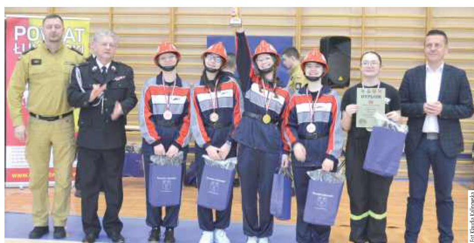
Zdobywcynie pierwszego miejsca