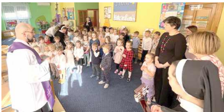
mo W obrzędzie posypania głów popiołem uczestniczyły wszystkie dzieci i kadra przedszkola