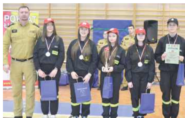
Zdobywcynie drugiego miejsca