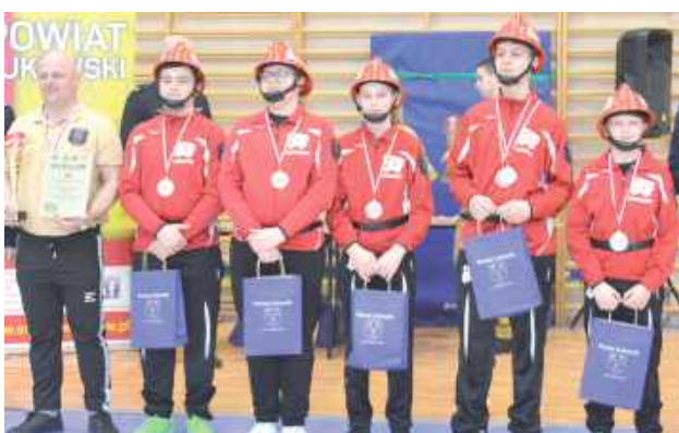
Zdobywcy drugiego miejsca