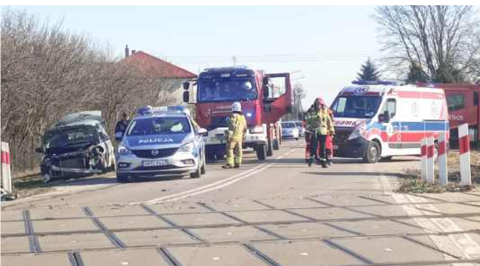
Mężczyzna wjechał pod pociąg POLREGIO relacji Terespol - Chełm w miejscowości Szczygły na przejeździe kolejowo-drogowym na linii kolejowej Łuków Łąpiguz - Okrzeja

Komunikat na temat wypadku zamieściły PKP Polskie