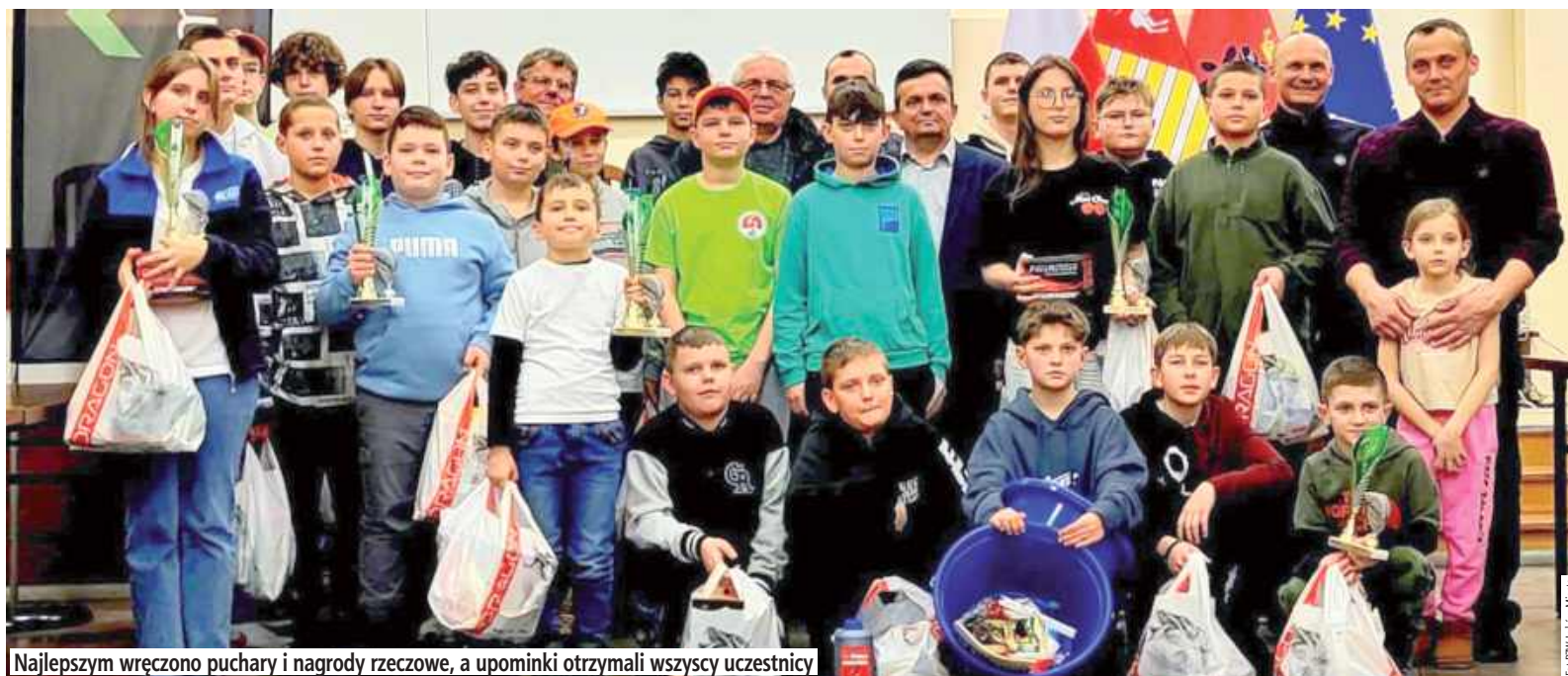
Najlepszym wręczono puchary i nagrody rzeczowe, a upominki otrzymali wszyscy uczestnicy

Test składał się z 26 pytań, w tym 24 pochodziły z bazy