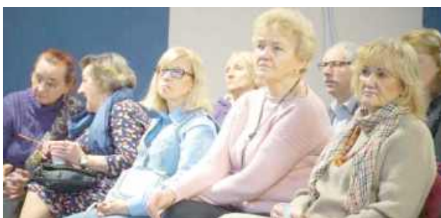
Słuchacze ŁUTW mieli okazję wysłuchać ciekawych opowieści o Argentynie

rzony z tym krajem nie jest tak popularne, jak muzyka i tańce nawiązujące do folkloru, czyli np. Chacarera. Podróżniczka opowiedziała również o licznej Polonii, mieszkającej w Argentynie, która stara się podtrzymy-