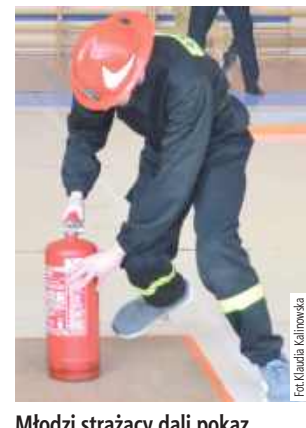
Młodzi strażacy dali pokaz swoich umiejętności