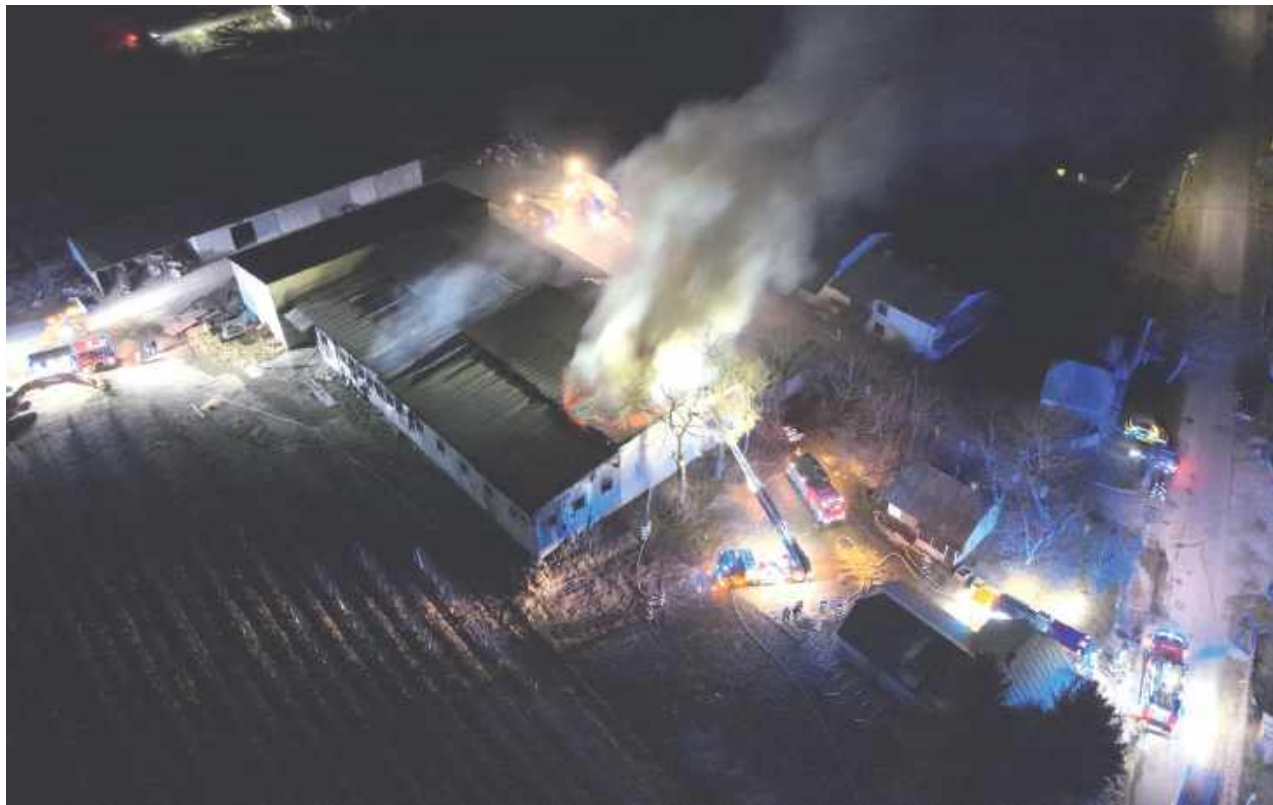
Dron w akcji - zdjęcie pożaru z lotu ptaka w Mokranach Starych

– Dron z kamerą termowizyjną pomagał w koordynacji działań. Do gaszenia przybyło 21 zastępów PSP i OSP z samochodami ciężkimi i średnimi ratowniczo-gaśniczymi oraz blisko 100 strażaków. Zbudowano magistralę wodną, pobie-