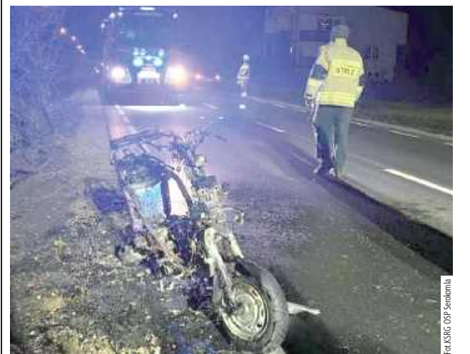
W chwili przybycia służb właściciela pojazd nie było ma miejscu zdarzenia

Do straży pożarnej wpłynęło zgłoszenie o pożarze skutera na drodze powiatowej w Charlejewie. Zdarzenie miało miejsce 4 marca o godzinie 19.27.