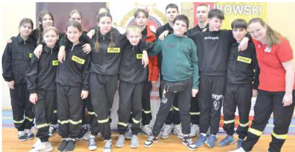
MDP OSP Wola Bystrzycka