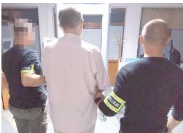
Podejrzeni - 51-latka i 55-latek (na zdj.) - nie przyznali się do popełnienia zarzuconych im czynów i złożyli wyjaśnienia sprzeczne ze zgromadzonym w tej sprawie materiałem dowodowym

- W ramach głównego z wątków podejrzanym zarzucono popełnienie wspólnie i w porozumieniu przestępstw polegających na doprowadzeniu województwa