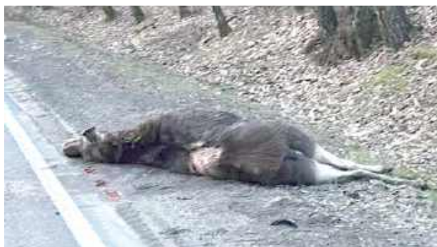
Łoś zginął na miejscu

ŁUKÓW: W czwartek, 6 marca, około godz. 5.30 doszło do groźnego wypadku w lesie Kryńszczak na trasie z Łukowa do Siedlec, w pobliżu skrzyżowania na Krynkę i Gręzówkę.