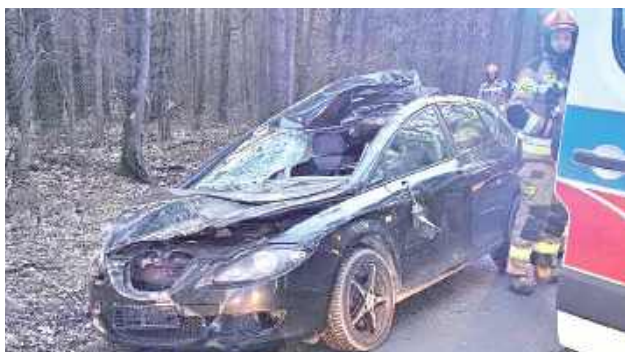
Zniszczony seat