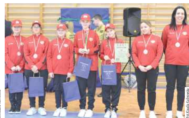
Zdobywcynie trzeciego miejsca

Pierwszego marca w Zespole Szkół w Wojcieszkowie odbyły się I Powiatowe Halowe Młodzieżowe Zawody Sportowo-Pożarnicze.