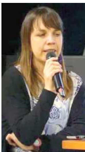
Podróżniczka opowiedziała również o licznej Polonii, mieszkającej w Argentynie