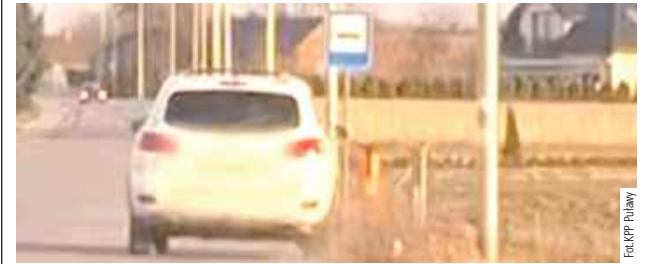
Kierowca Hyundai jechał od rowu do rowu, omal nie skasował słupka przystankowego i nie zderzył się z dwoma samochodami jadącymi z naprzeciwka

I być może zapobiegł tragedii, bo 40-latek kierujący Hyundaiem miał prawie 3 promile alkoholu w organizmie i jechał bez prawa jazdy.