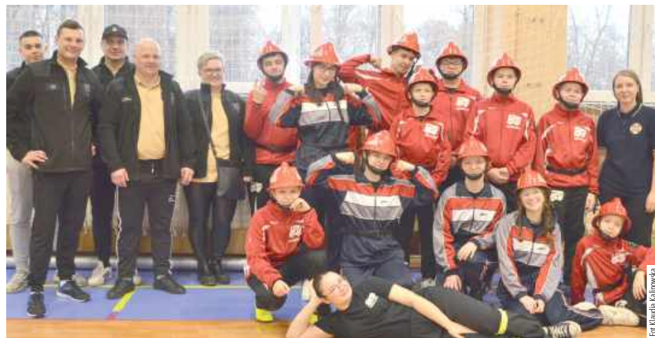
MDP OSP Świderki