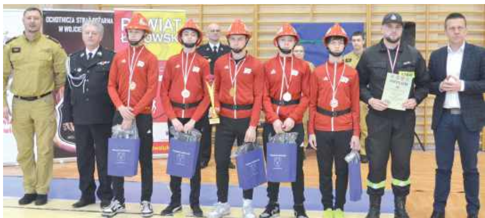
Zdobywcy pierwszego miejsca