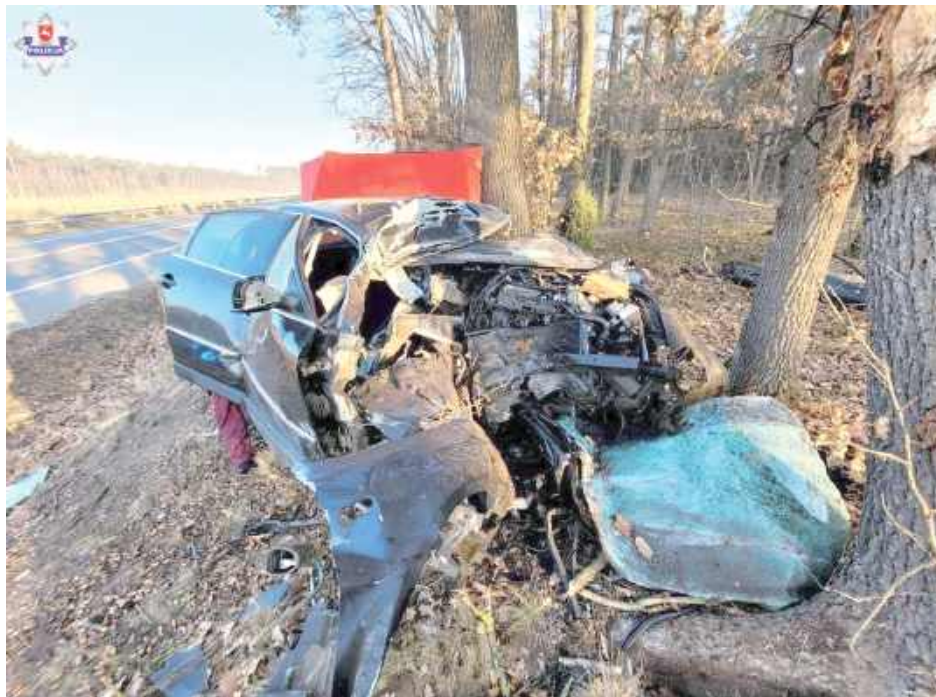
Kierujący Volkswagenem mężczyzna z nieustalonych jak dotąd przyczyn zjechał z drogi i uderzył w drzewo

Na miejscu policjanci z puławskiej drogówki prowadzili oględziny pod nadzorem prokuratora. Przyczyny wy-