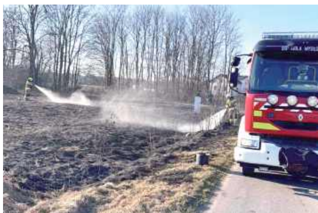
Do akcji ruszyły jednostki OSP Ksawerynów i OSP Wola Mysłowska