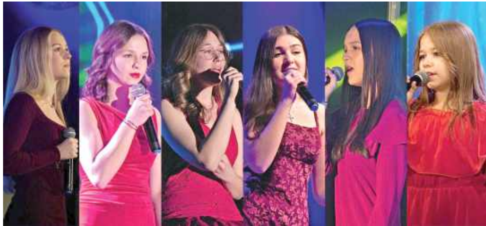
Wokalistki Łukowskiego Ośrodka Kultury zostały laureatkami I Ogólnopolskiego Konkursu Polskich Koled i Pastorałek Online

Chociaż za oknem coraz bliżej wiosna, ŁOK podzielił się już ostatnimi wynikami konkursów koledowych. Wokalistki Łukowskiego Ośrodka Kultury zostały laureatkami I Ogólnopolskiego Konkursu Polskich Koled i Pastorałek Online.