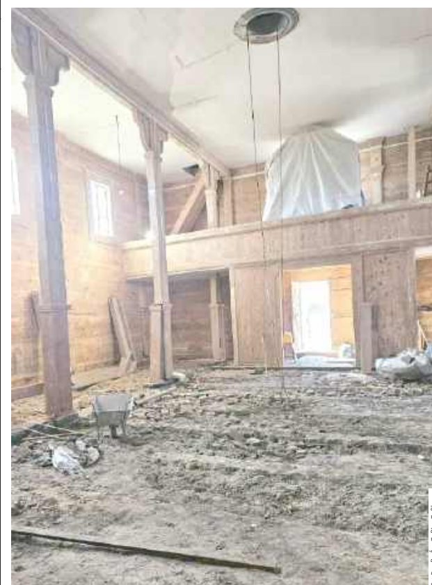
Remont kościoła ma kosztować 2 867 757,17 zł, z czego dofinansowanie wynosi 2 437 593,58 zł