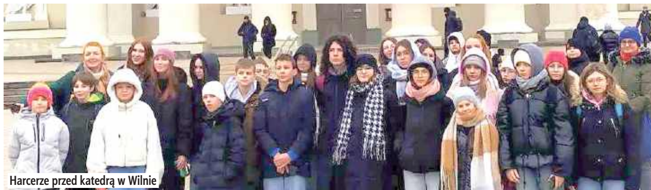
Harcerze przed katedrą w Wilnie

Program wyjazdu nawiązywał do okresu Rzeczypospolitej szlacheckiej. Uczestnicy poznawali jej dzieje i sarmacką obyczajowość. Uczyli się poloneza, bawili się podczas ostatnich u Radziwiłła, bawili w śniegu