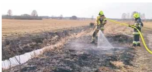
Strażacy gasili pożar traw wzdłuż ciek w wodnego

Tego samego dnia strażacy ponownie interweniowali