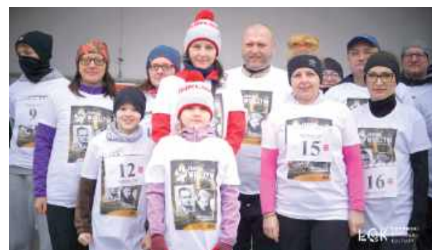
Gotowi do Biegu Tropem Wilczym w pamiątkowych koszulkach!

W wydarzeniu wzięli też udział: Grupa Rekonstrukcji Historycznej 22 Pułk Piechoty z Łukowa oraz Związek Piłsud-