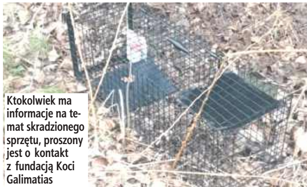
Ktokolwiek ma informacje na temat skradzionego sprzętu, proszony jest o kontakt z fundacją Koci Galimatias

- W poniedziałek, tj. 3 marca między godz. 17.30 a 20 ktoś przywłaszczył własność Fundacji - klatkę łapkę. Stała na działce przy płocie/siatce pomiędzy ul. Międzyrzeczką a Trentowskiego w bardzo zakrzaczonym terenie poinformowała fundacja Koci Galimatias.