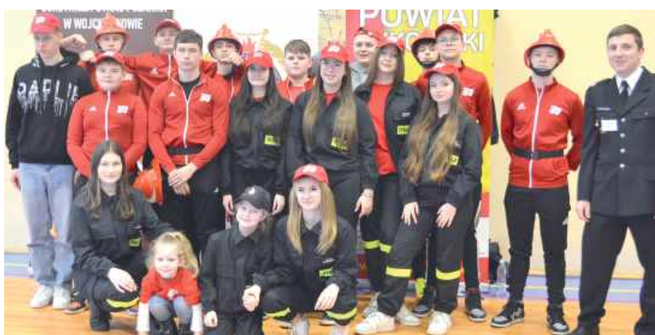
Wiele drużyn wzięło udział w tegorocznych zawodach