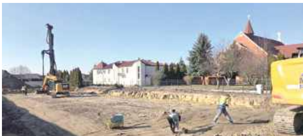
Prace budowlane mają potrwać do 20 kwietnia 2026 roku

Przy ulicy Ostrobramskiej powstaje nowoczesny kompleks żłobkowo-przedszkolny, który zapewni komfortowe warunki dla najmłodszych mieszkańców.