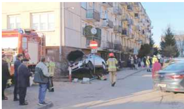
Niestety nie udało się uratować życia 38-letniego mężczyzny, który w czwartek, 6 marca spowodował wypadek na osiedlu Chącińskiego

- Kierowca Volkswagena stracił panowanie nad pojazdem, uderzył w trzy samochody, a następnie prawie wjechał w ścianę bloku. Samochód przewrócił się na