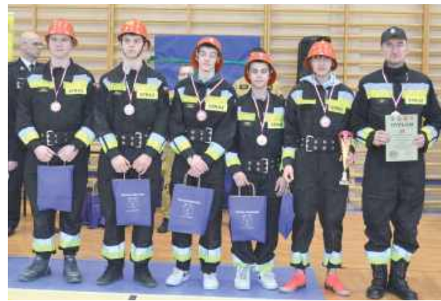
Zdobywcy trzeciego miejsca