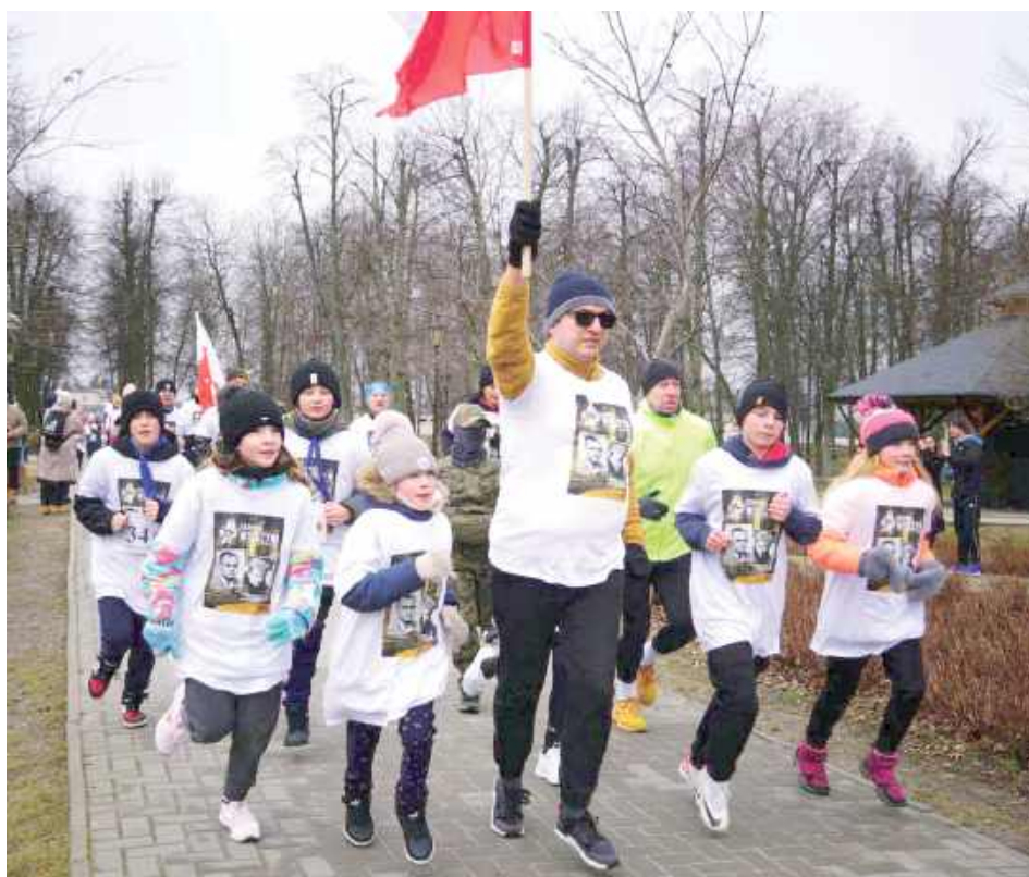
Najmłodsze pokolenie biegaczy oddało cześć Żołnierzom Wyklętym

Drugi dystans to już był bieg konkursowy, tzw. Bieg Wilka, w którym uczestni-