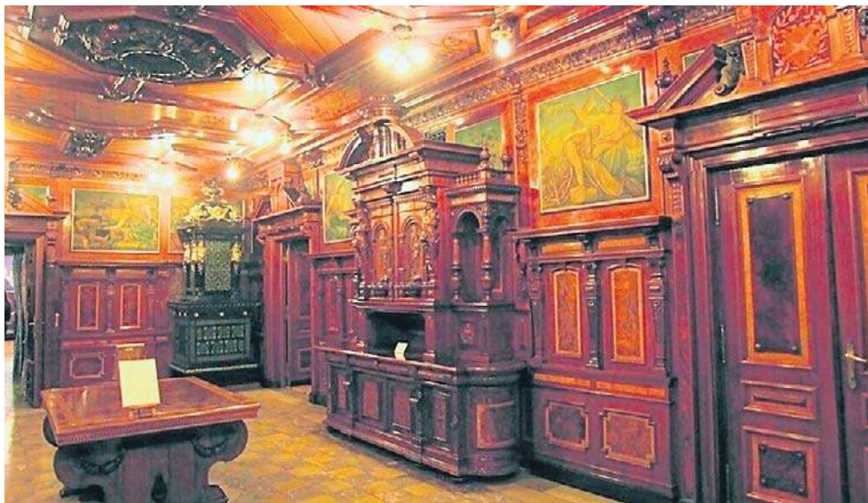
Pałac Scheiblera można podziwiać w wielu polskich filmach i serialach, doliczono się ich około trzydziestu

W okresie powojennym przez pewien czas na poddaszu nad pałacem (skrzydło wschodnie) znajdowało się kilka mieszkań prywatnych. Potem mieścił się tam rektorat Politechniki Łódzkiej; Państwowa Szkoła Muzyczna I stopnia; Pracownia Konserwa-