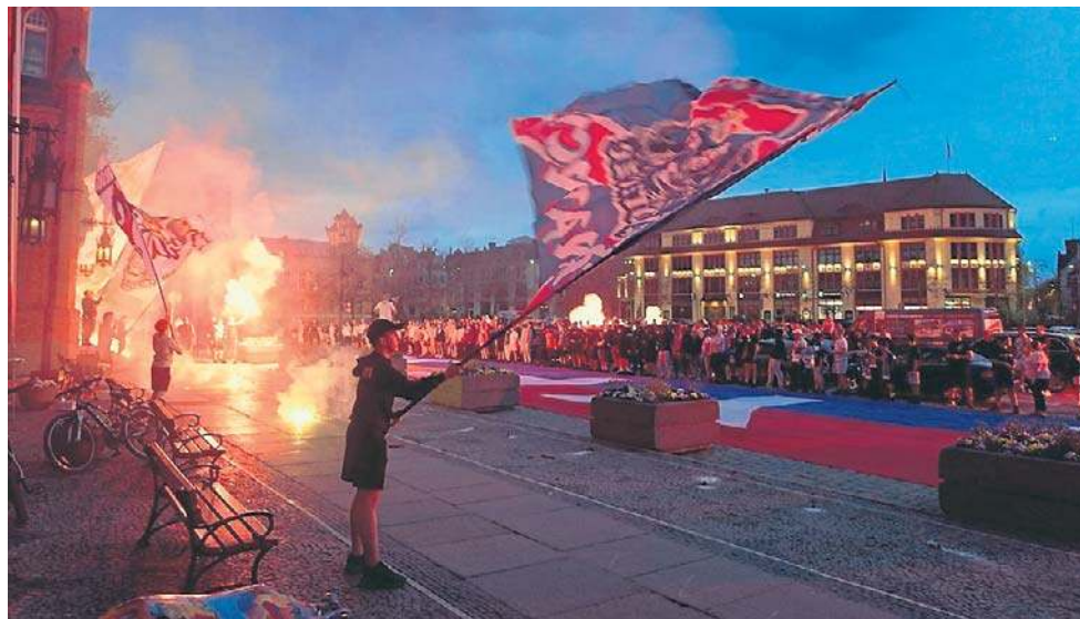
Kibicowskie racowisko pod ratuszem Słupska dla uczczenia 80-lecia Gryfa

Drużyna AP Orlenu Gdańsk przegrała u siebie ze Stomilankami Olsztyn 1:3, a Pogoni Dekpolu Tczew w Bielsku-Białej z Rekordem 1:5. (stan)