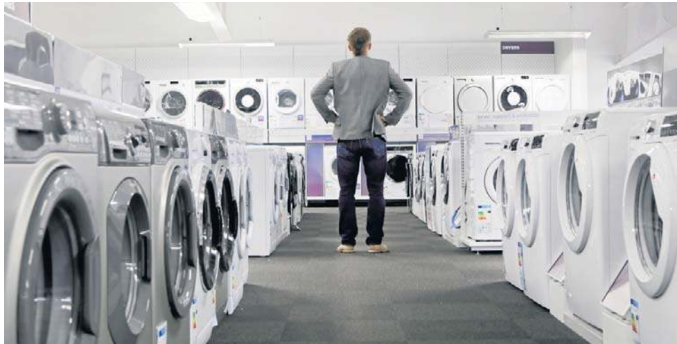
Spółka Amica potrafi zwiększać udziały rynkowe i utrzymywać stabilne wyniki

Jak dodał, podobne pozytywne trendy spółka notuje także na wybranych rynkach zagranicznych.