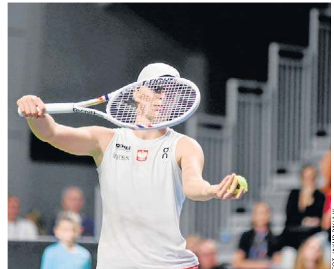
Rozstawiona z numerem 4 Iga Świątek rozpocznie WTA 1000 Italian Open w Rzymie od drugiej rundy

Świątek triumfowała na meczach w Rzymie w 2021, 2022 i 2024 roku. W ubiegłorocznej edycji dotarła do trzeciej rundy, w której przegrała z Amerykanką Danielle Collins. Tytułu będzie bronić Włoszka Jasmine Paolini. ©