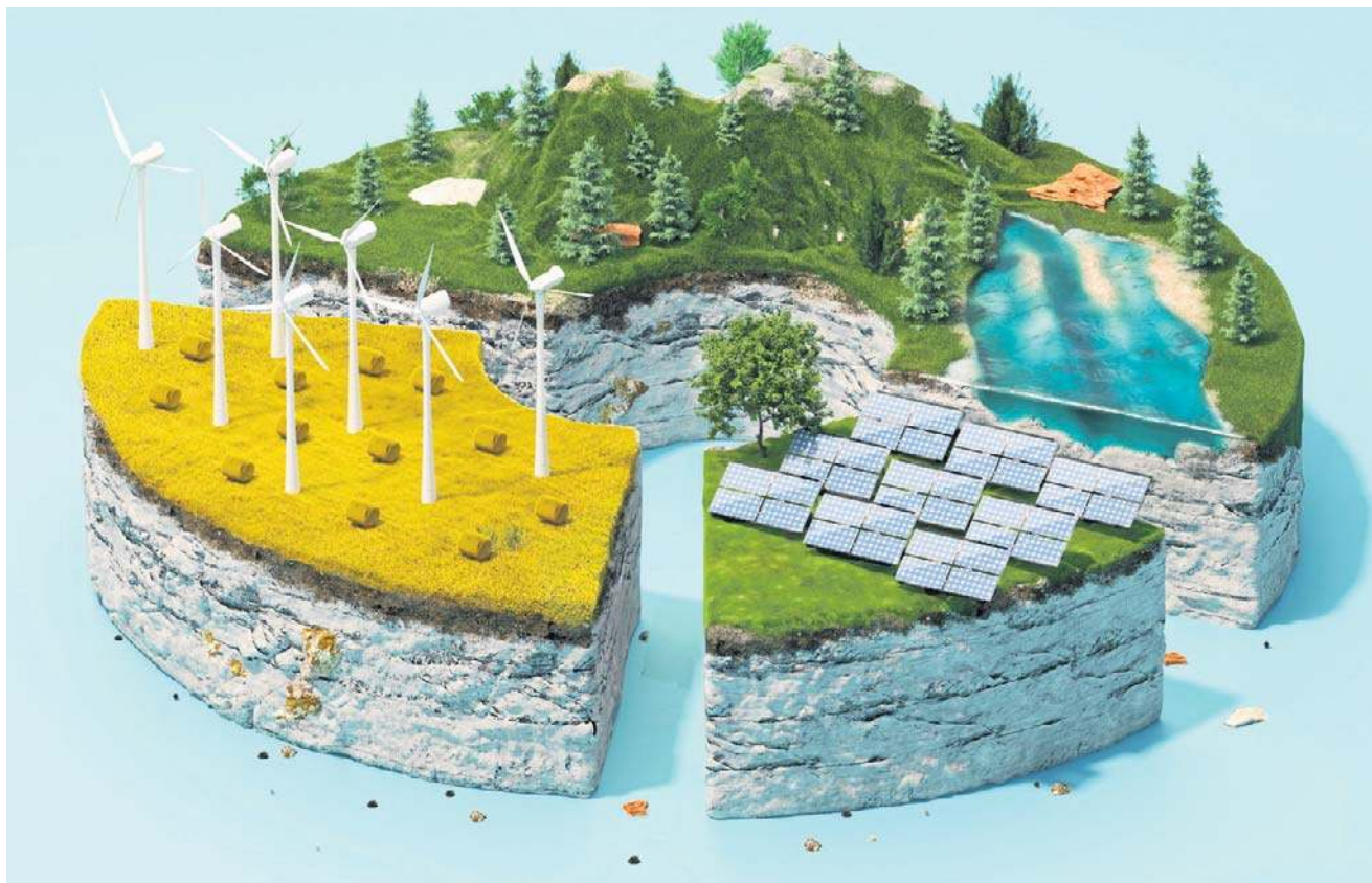
Dziś nie chodzi o to, czy Europa chce być zielona. Chodzi o to, czy chce być w ogóle konkurencyjna.

- W Brazylii, uwzględniając koszt energii, przesyłu i podatków, płacimy około 130 zł za megawatogodzinę. W Kazachstanie mniej niż 200 zł