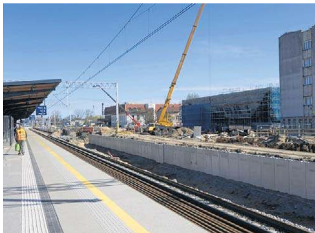
Roboty przy modernizacji stacji Słupsk

Przebudowywane na stacji Słupsk perony będą wyższe